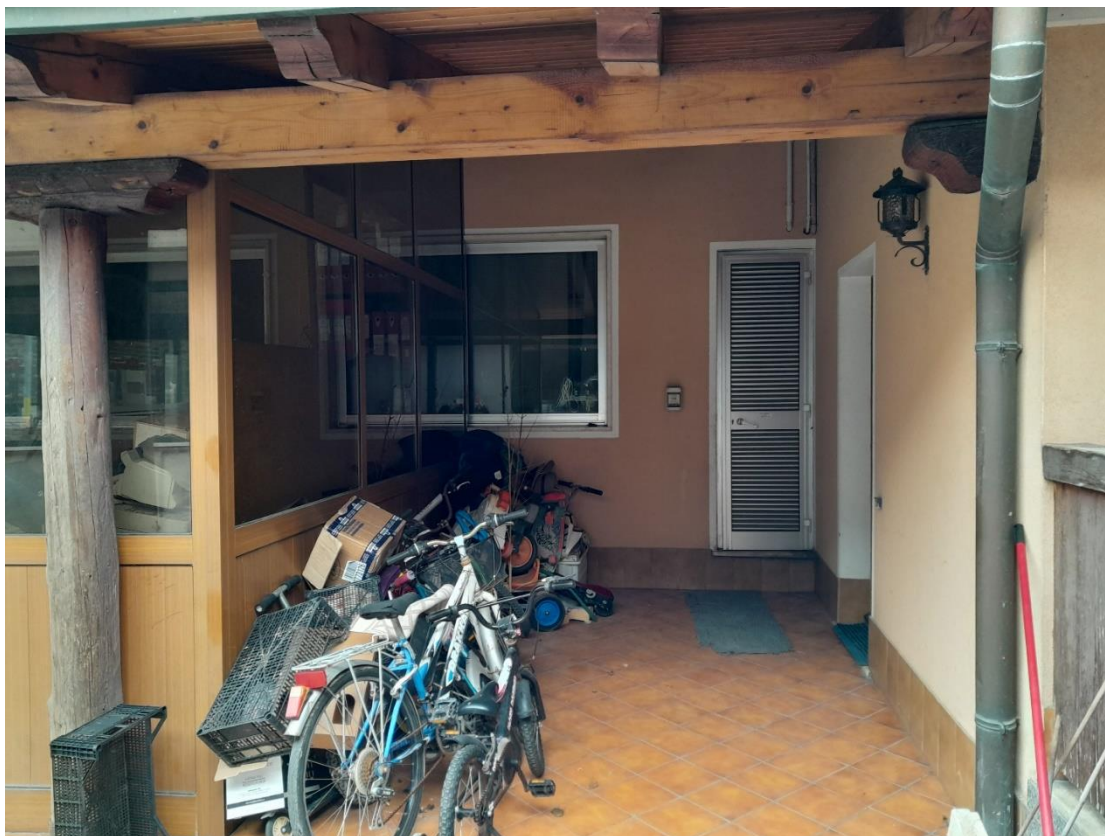
FOTO N.26_ Prospetto Sud- Ingresso CT ufficio