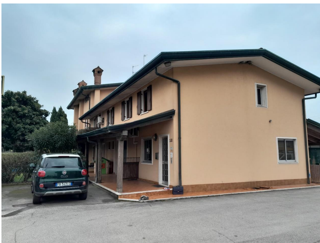
FOTO N.24_ Prospetto Nord-Ovest – Ingresso ufficio locali al piano primo