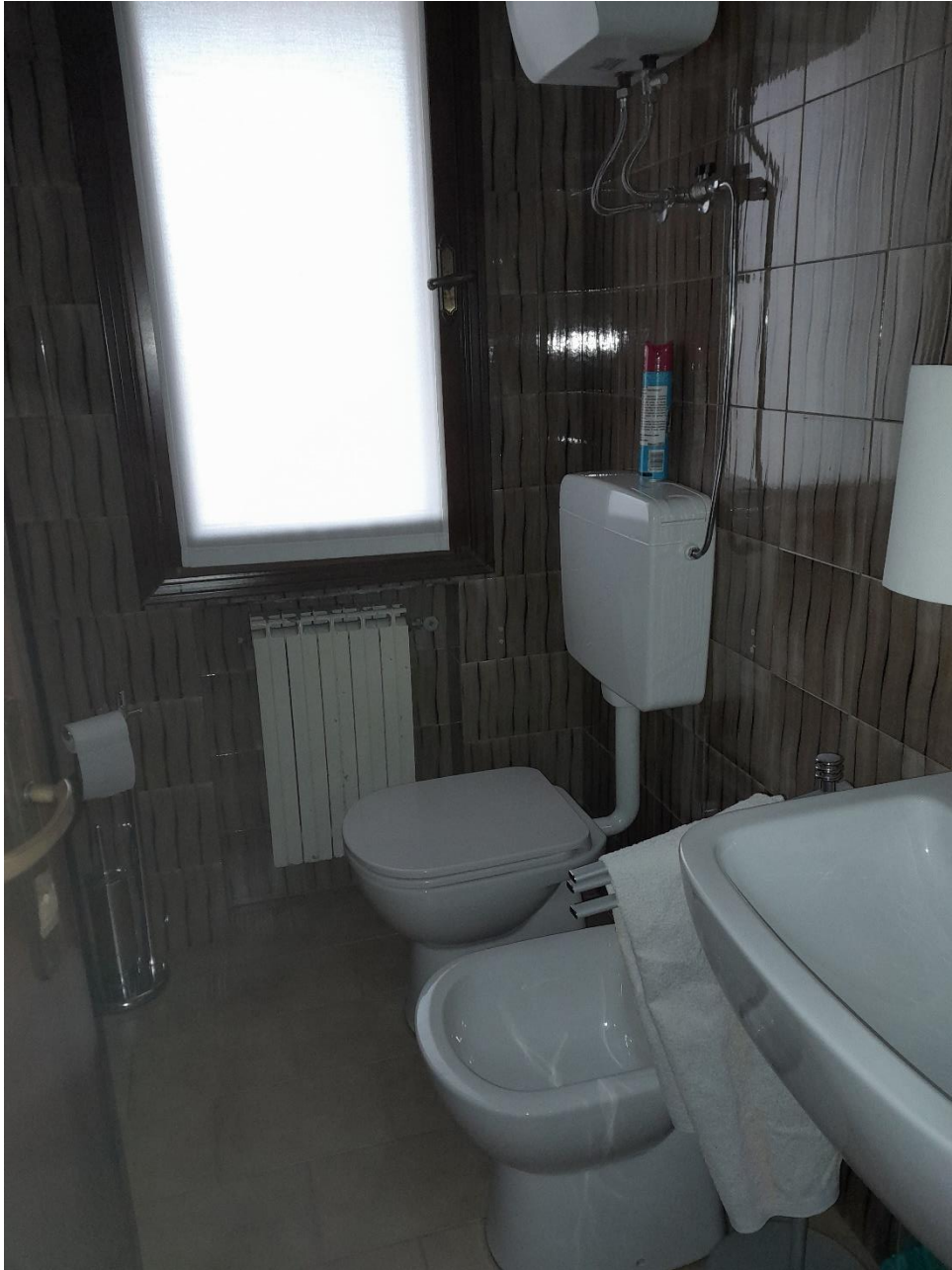
FOTO N.34_ Servizio igienico al piano primo