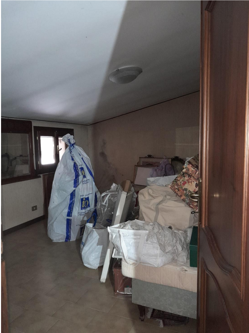
FOTO N.21_ Camera/ripostiglio piano secondo