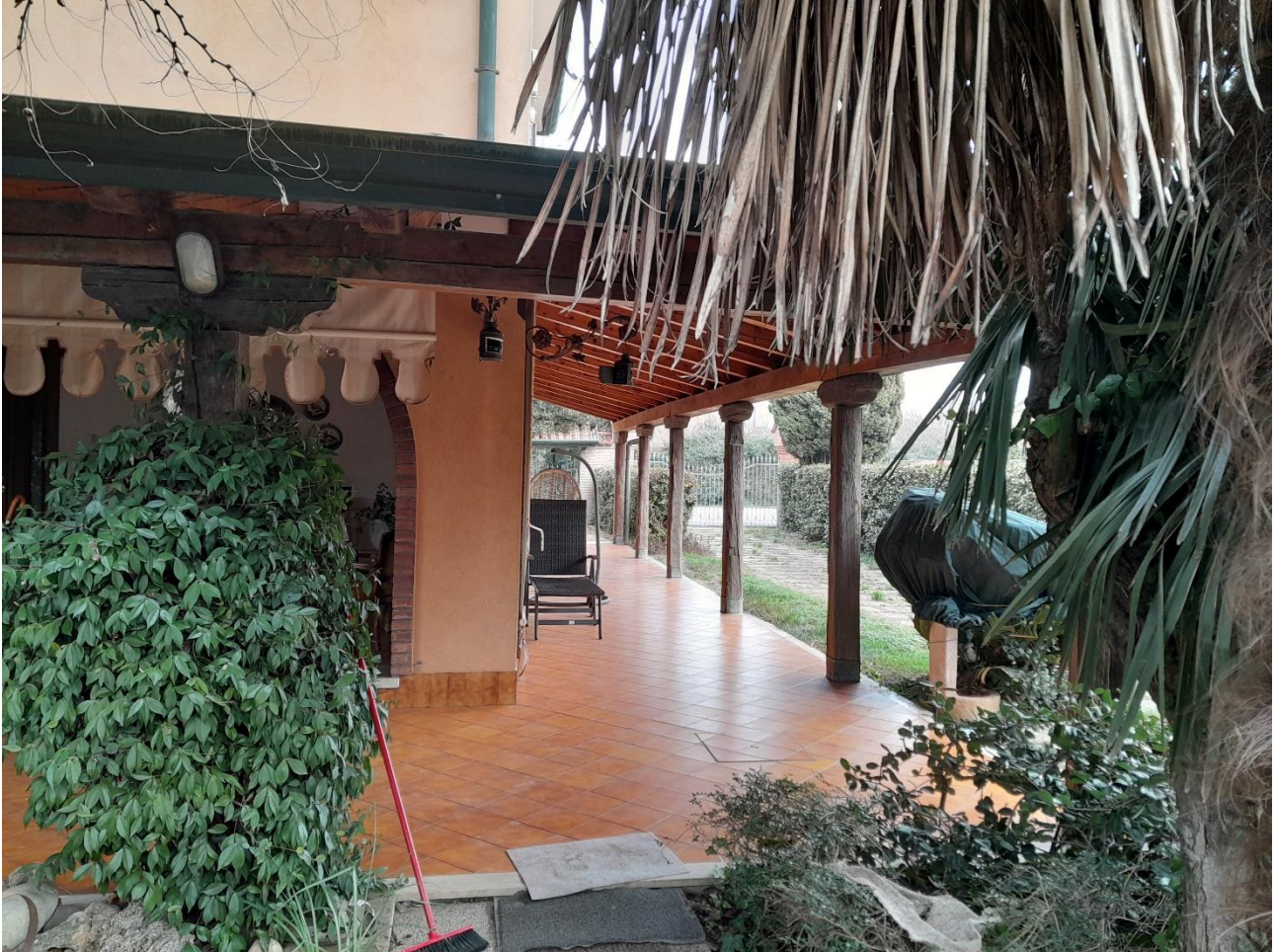
FOTO N.04_ Prospetto Sud - sottoportico