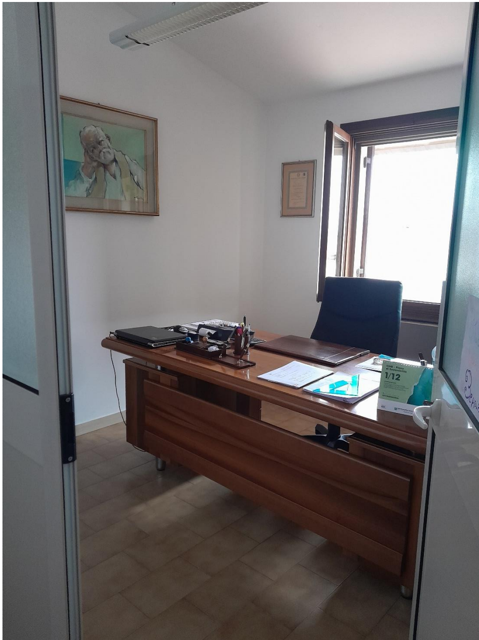
FOTO N.38_ Ufficio - Locali al piano primo