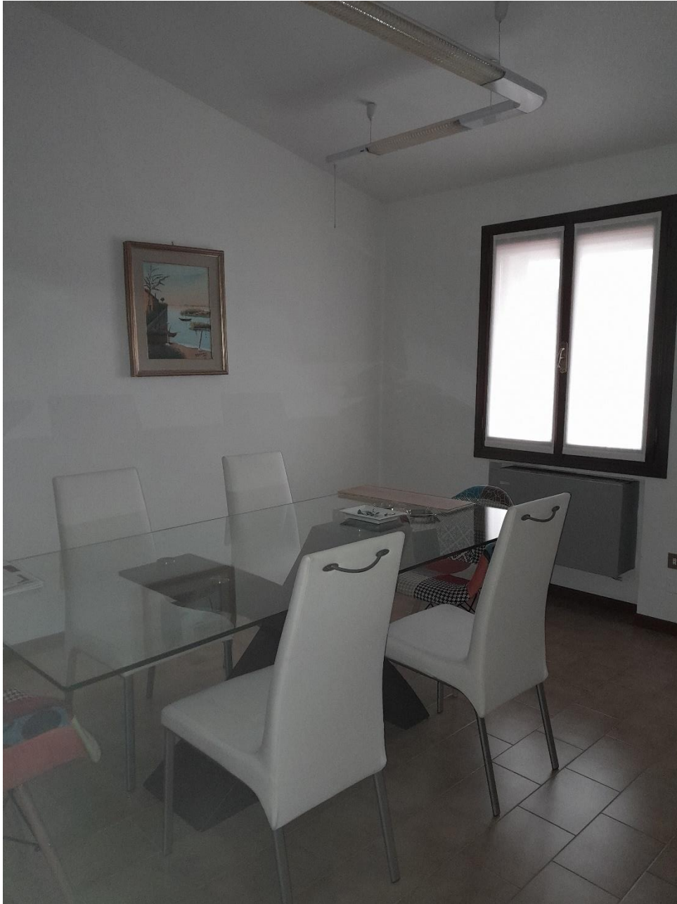
FOTO N.35_ Ufficio - Locali al piano primo