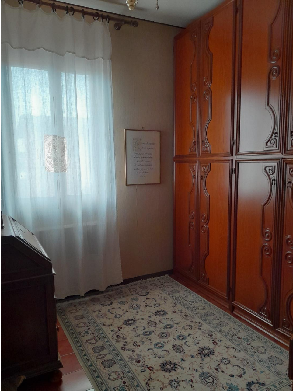
FOTO N.14_ Guardaroba primo piano