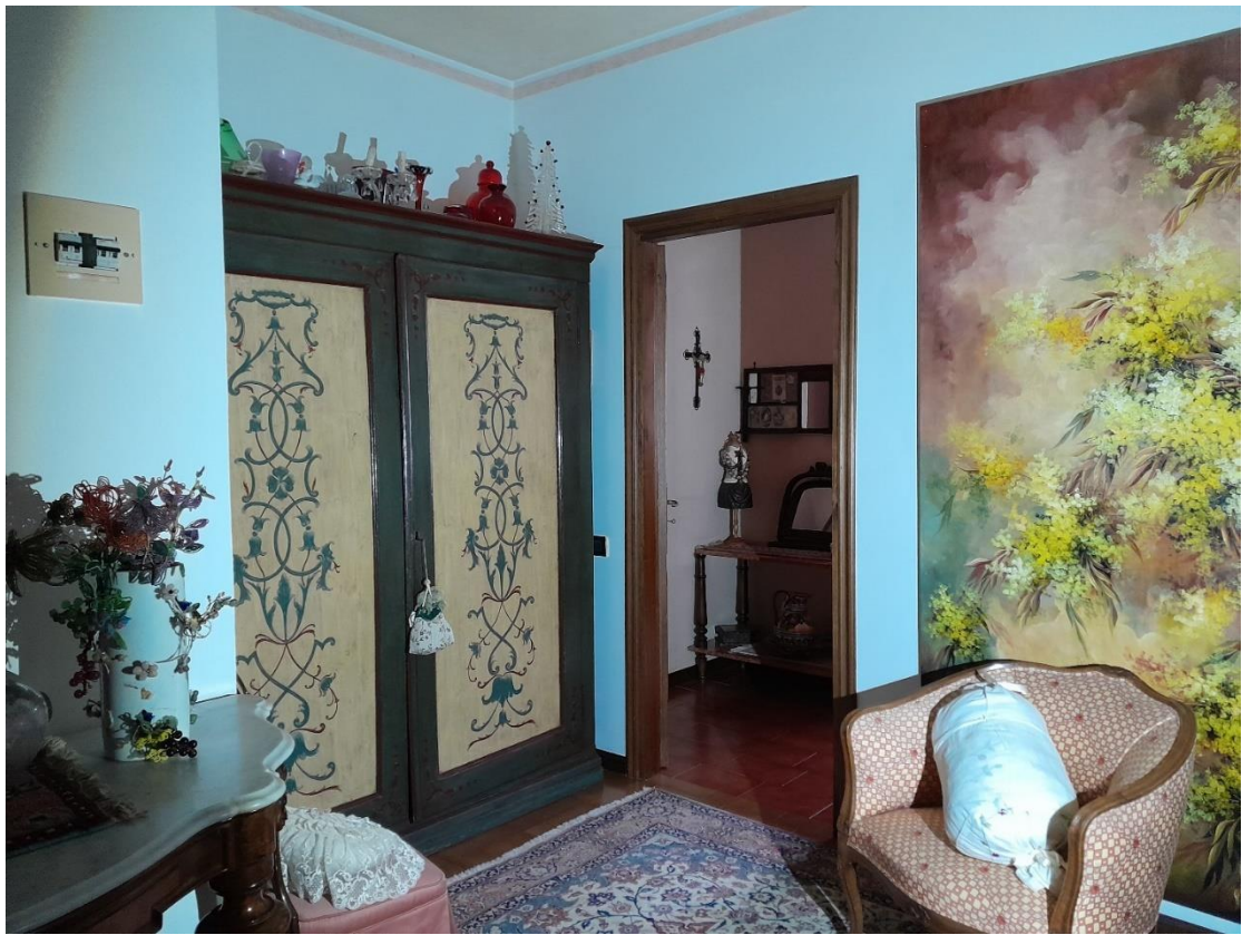
FOTO N.12_ Disimpegno primo piano