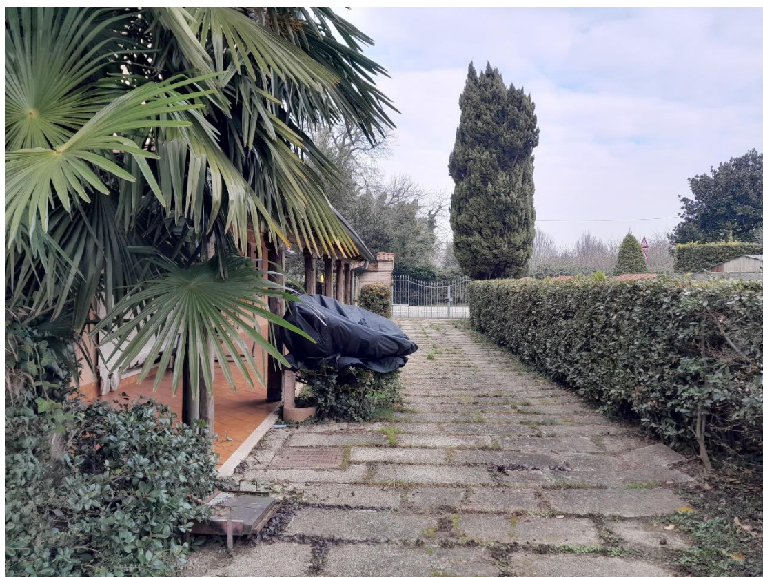
FOTO N.01_ Area urbana (part.778 F/1) adibita a cortile abitazione