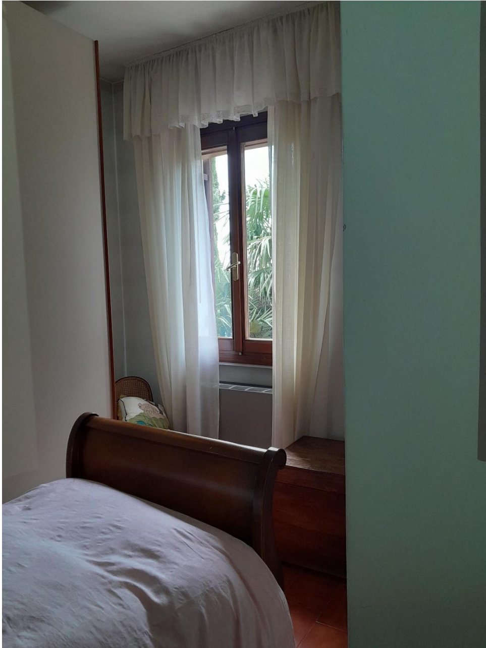
FOTO N.15_ Camera primo piano