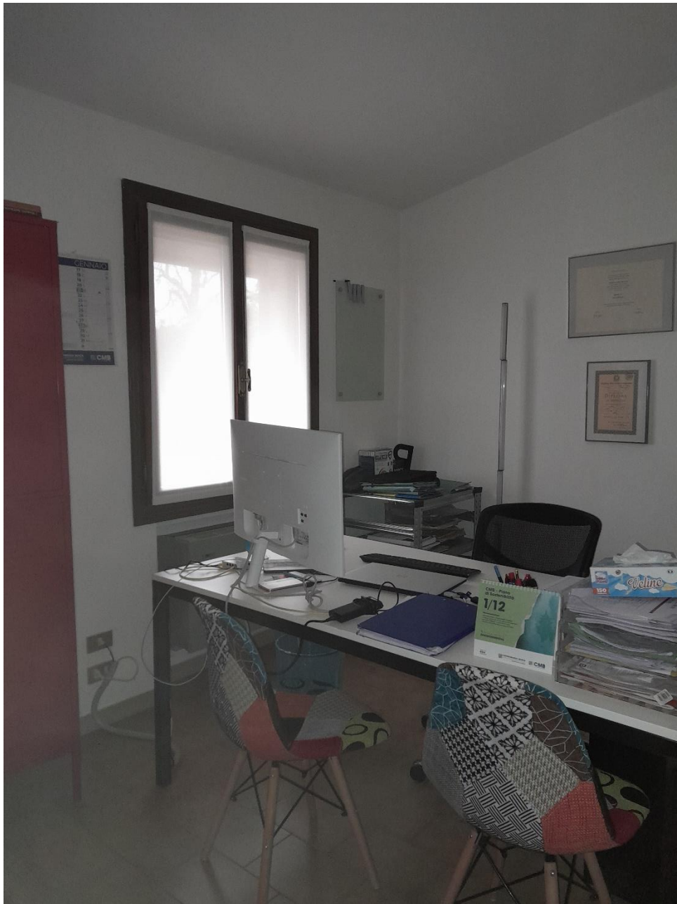
FOTO N.36_ Ufficio - Locali al piano primo