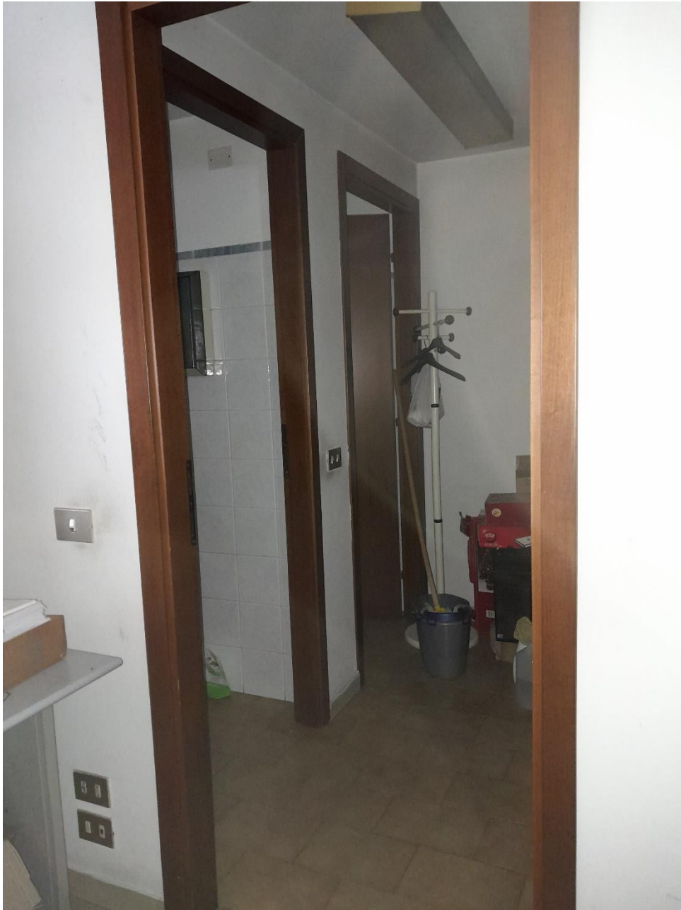
FOTO N.31_ Ufficio - disimpegno servizi piano terra