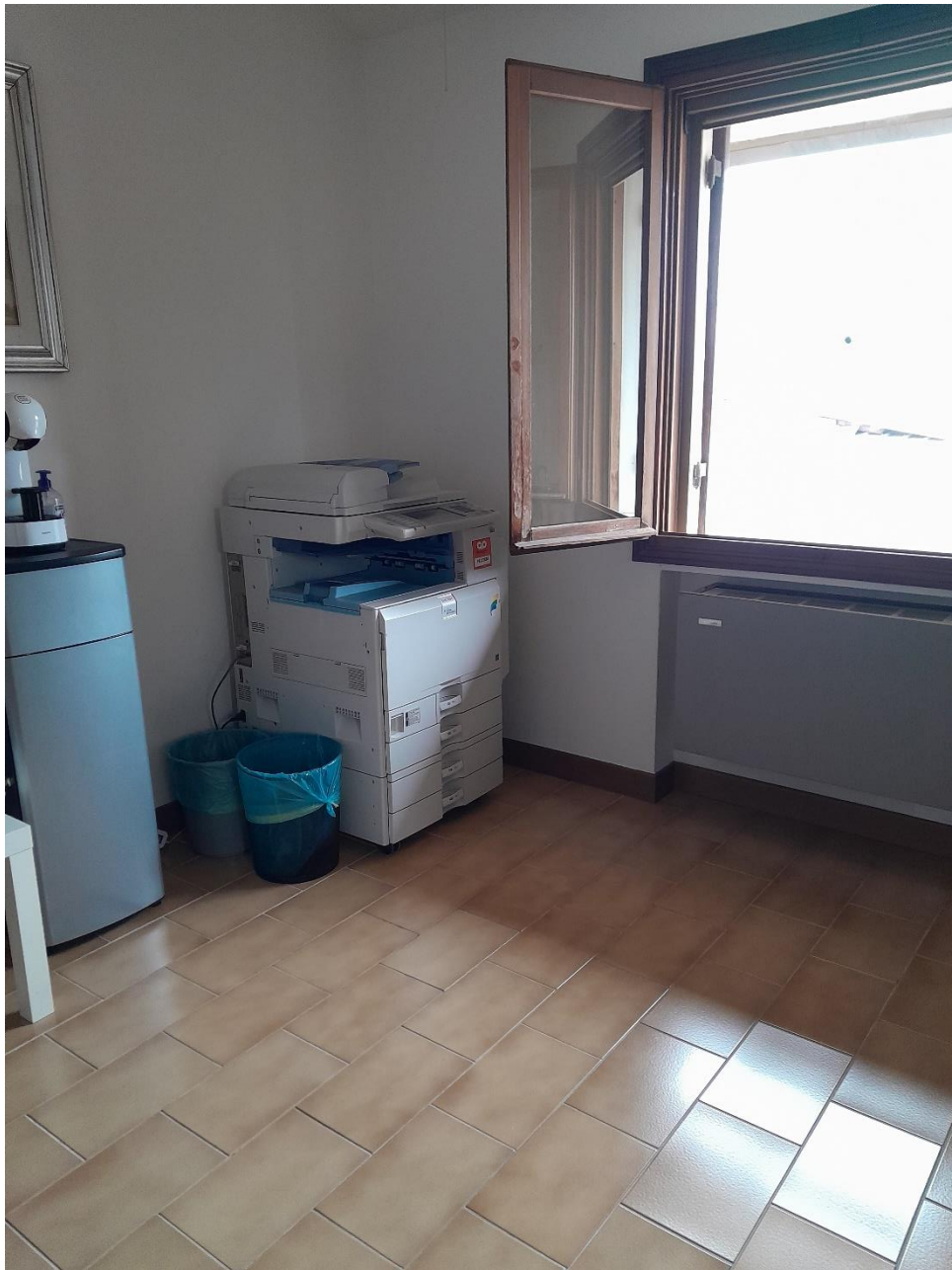
FOTO N.39_ Ufficio - Locali al piano primo