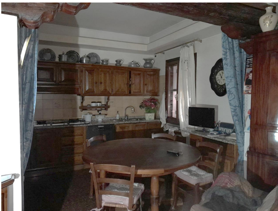
FOTO N.07_ Cucina