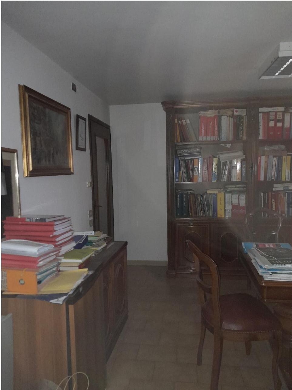
FOTO N.29_ Ufficio locale piano terra