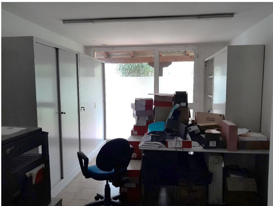
FOTO N.30_ Ufficio locale piano terra