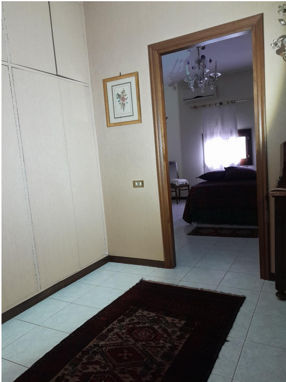
FOTO N.17_ Disimpegno piano secondo