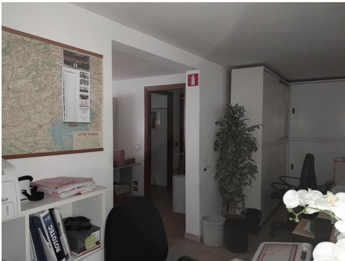
FOTO N.28_ Ufficio locali piano terra