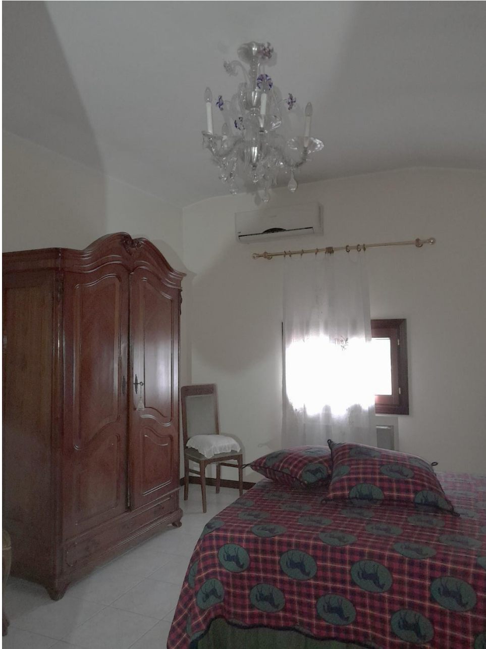
FOTO N.18_ Camera piano secondo