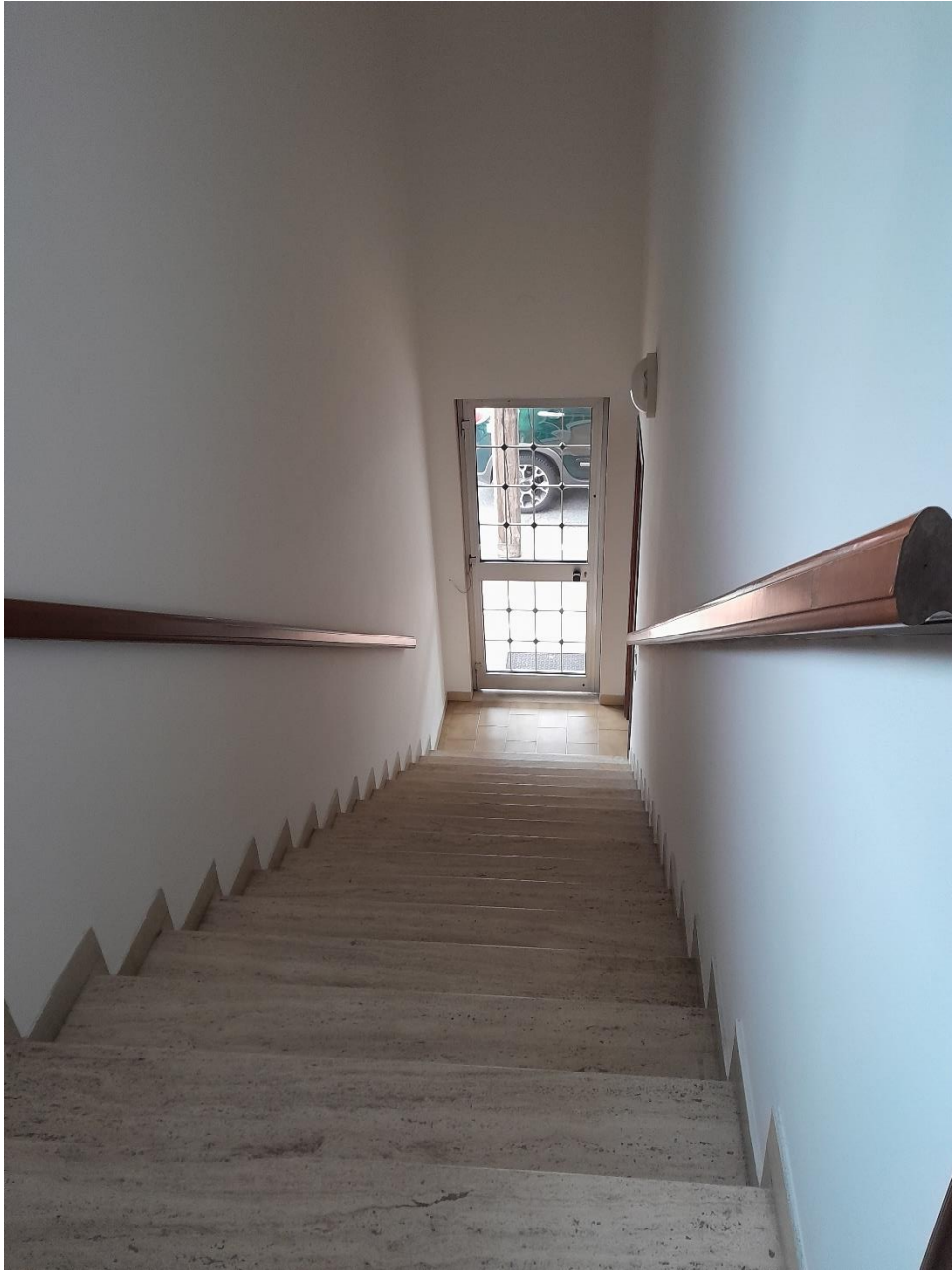
FOTO N.33_ Scala di accesso locali al piano primo