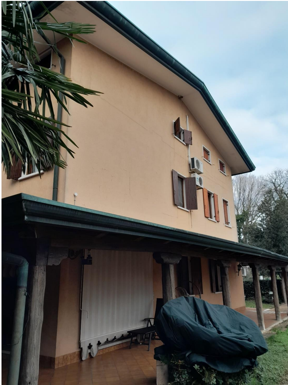
FOTO N.03_ Prospetto Est abitazione cat. A/7 e scoperto (part.778 cat F/1)