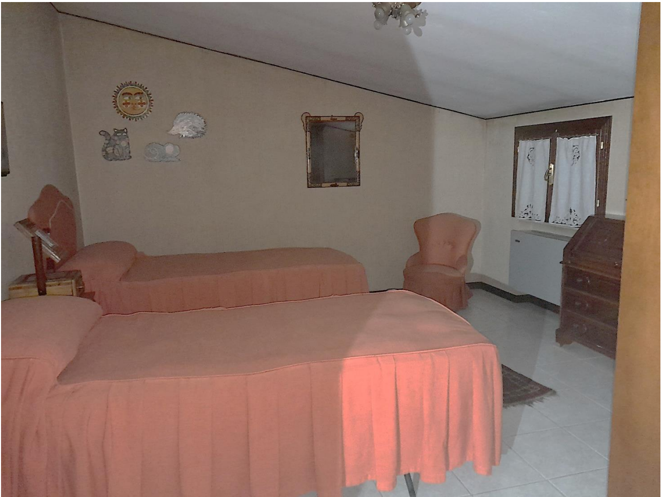
FOTO N.19_ Camera piano secondo