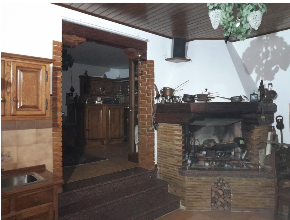
FOTO N.09_ Taverna zona caminetto