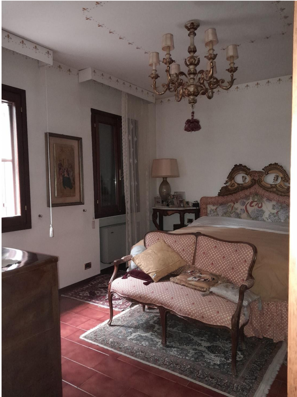
FOTO N.13_ Camera primo piano