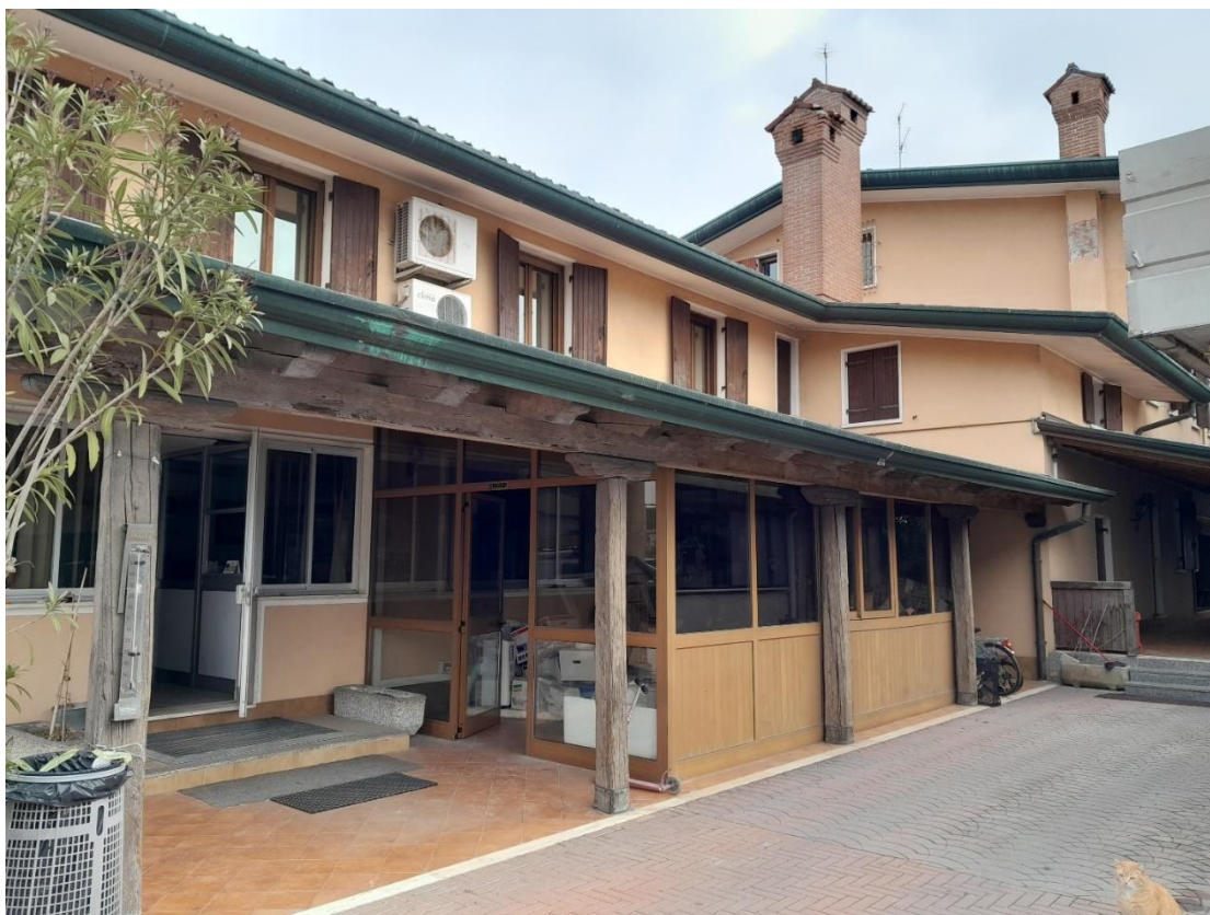
FOTO N.25_ Prospetto Sud- Ingresso ufficio locali al pinao terra