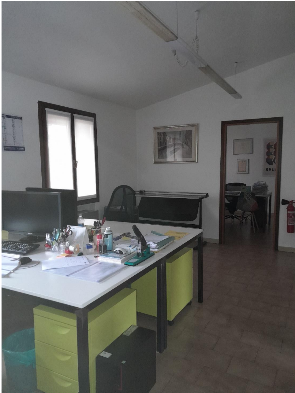
FOTO N.37_ Ufficio - Locali al piano primo