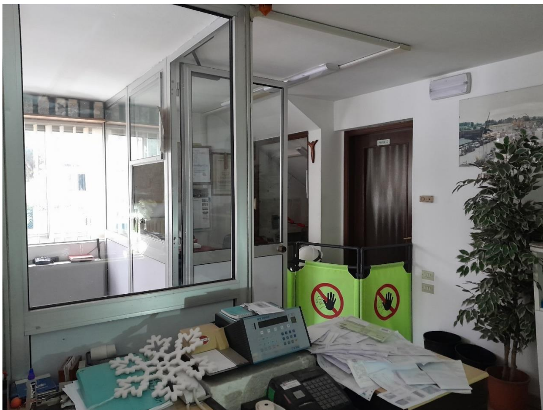
FOTO N.27_ Ufficio locali piano terra