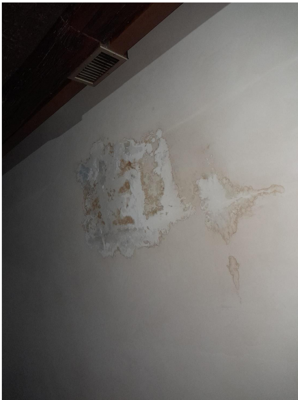
FOTO N.22_ Infiltrazione muro soggiorno piano terra