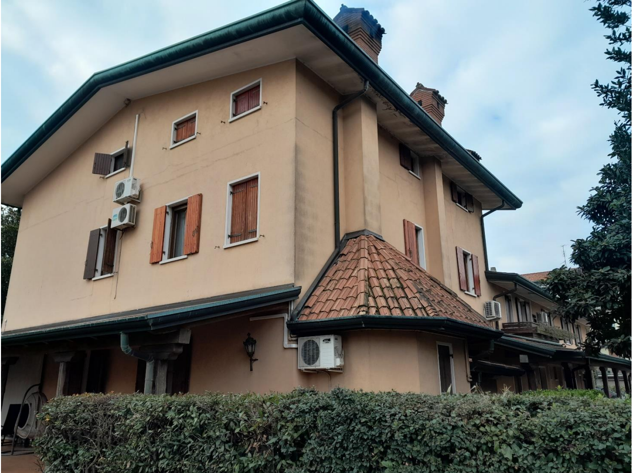
FOTO N.02_ Prospetto Nord-Est abitazione cat. A/7