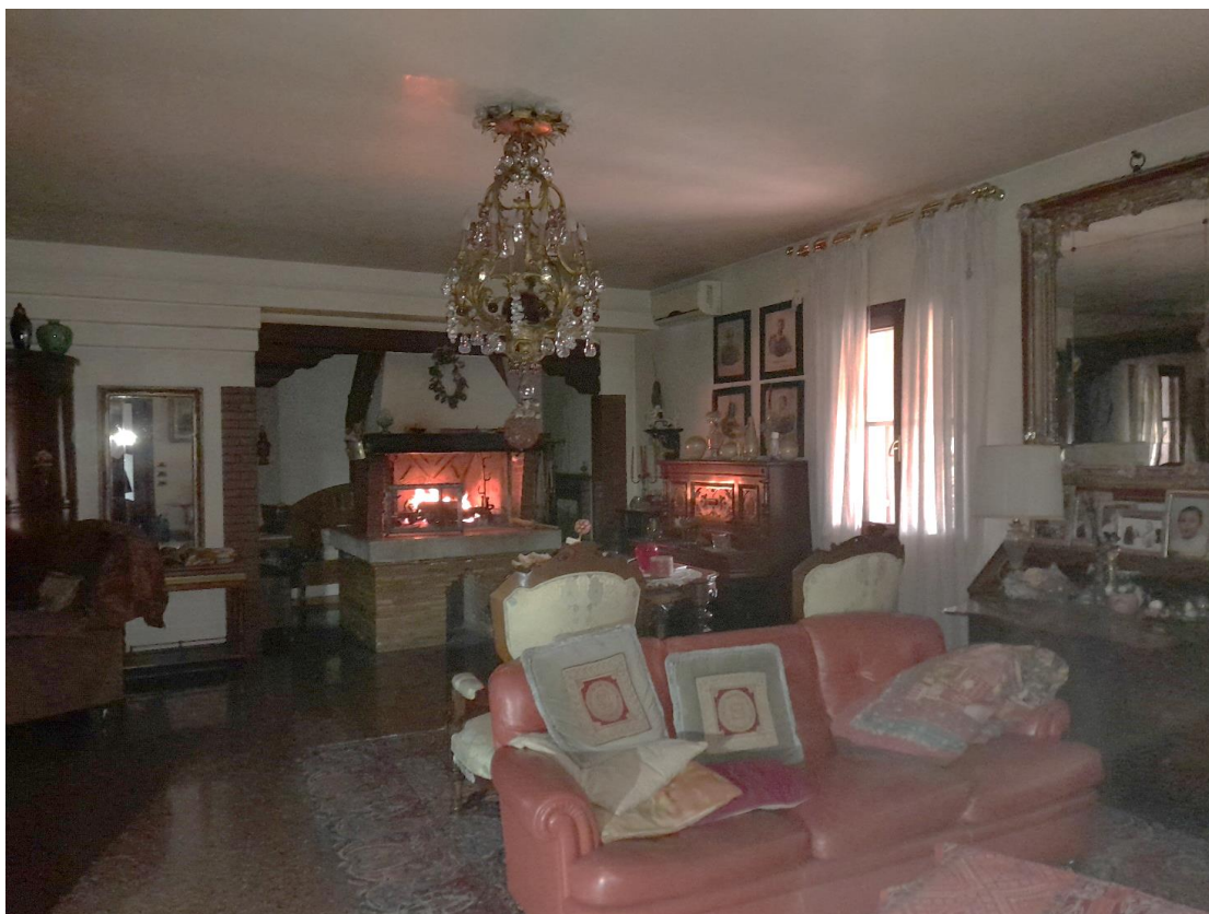
FOTO N.06_ Ingresso-Soggiorno