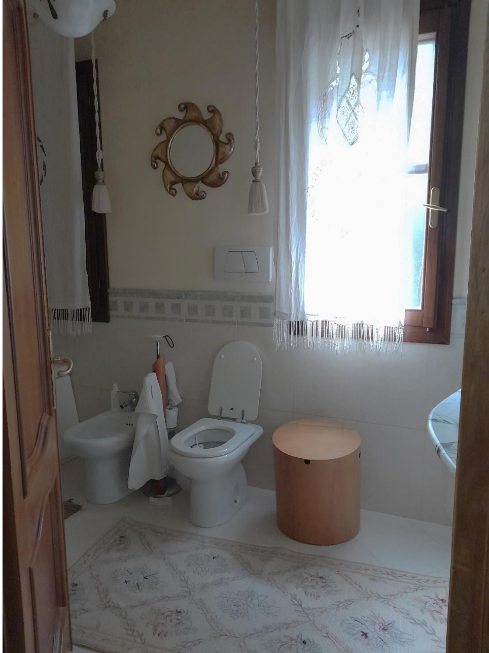
FOTO N.11_ Bagno notte