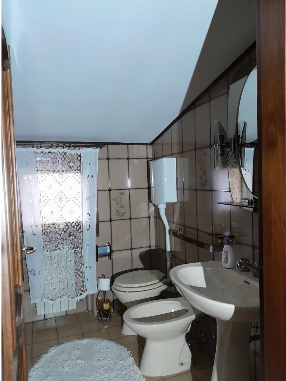
FOTO N.20_ Bagno piano secondo