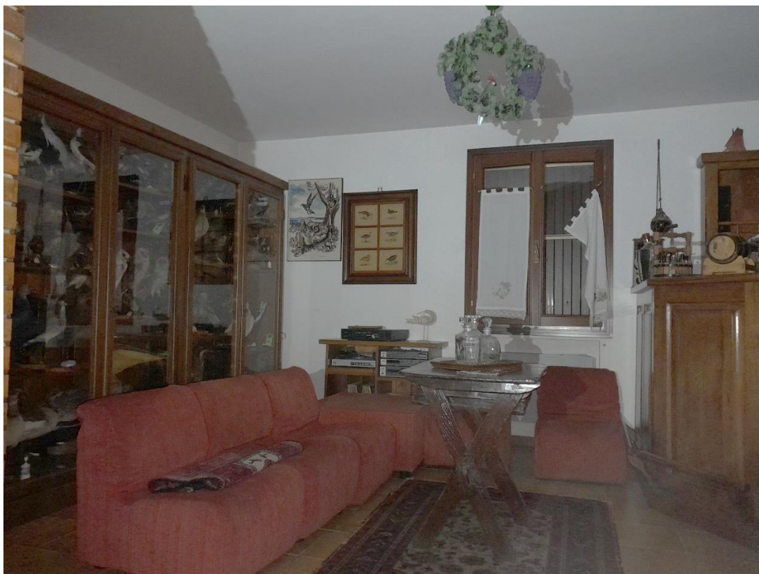
FOTO N.08_ Taverna