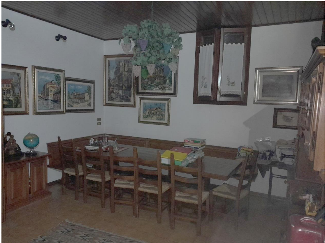
FOTO N10_ Taverna zona pranzo