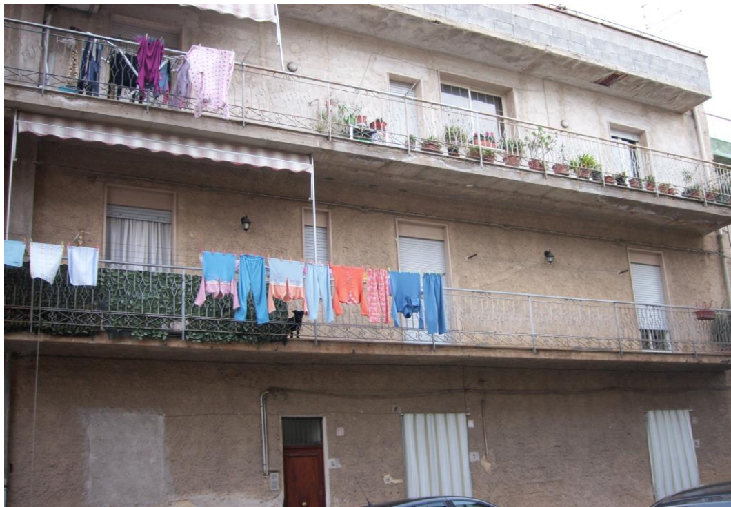
Foto 2 - PROSPETTO -