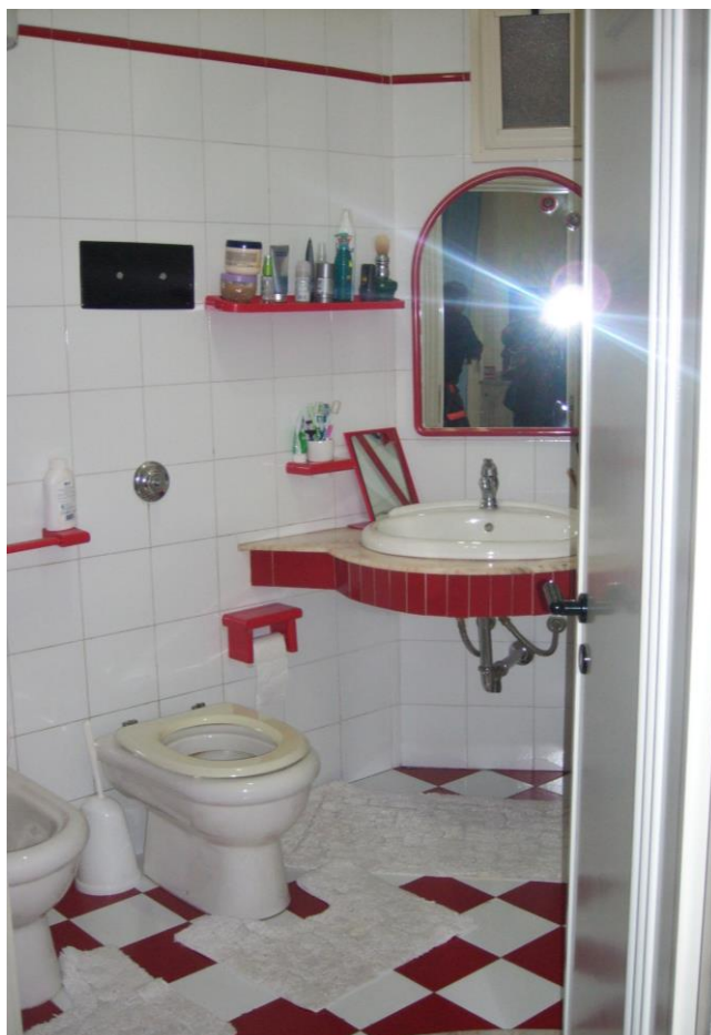
Foto 12 - W.C. DOCCIA -