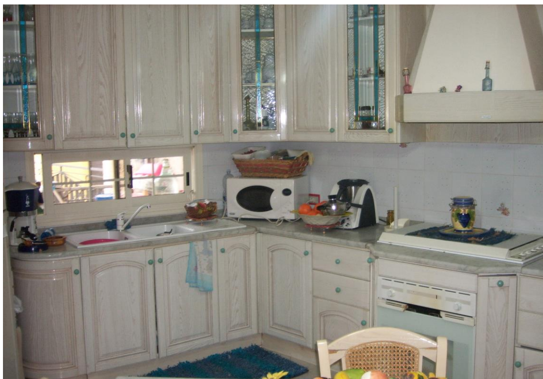
Foto 5 - CUCINA -