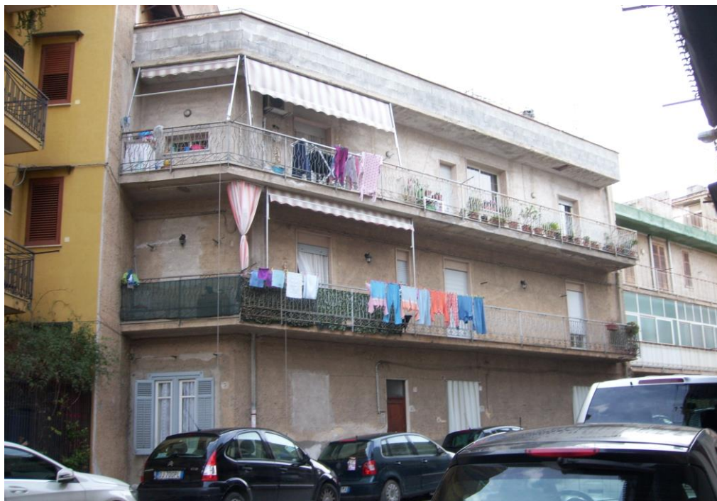
Foto 1 - PROSPETTO -