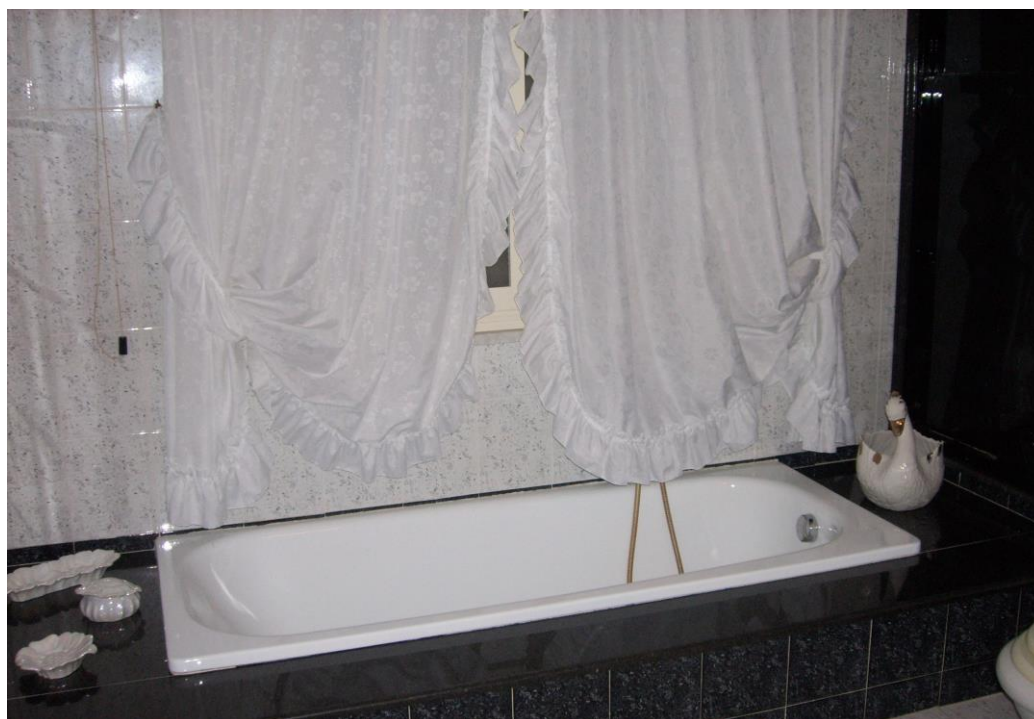
Foto 8 - W.C. BAGNO -