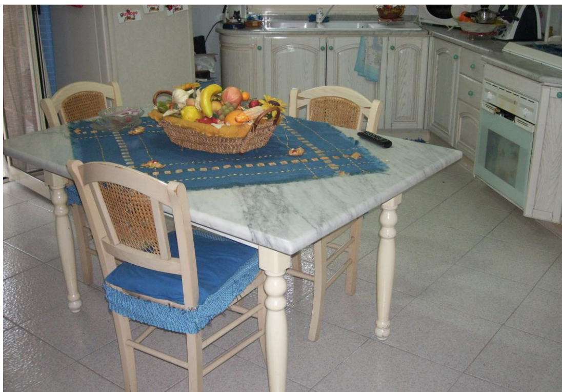
Foto 6 - CUCINA -