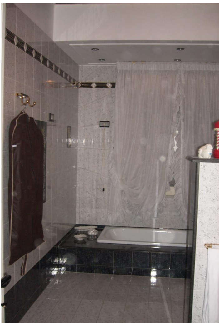
Foto 7 - W.C. BAGNO -