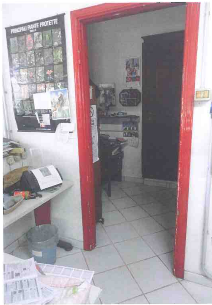
Foto 007 - Disimpegno di comunicaz con la scala.JPG