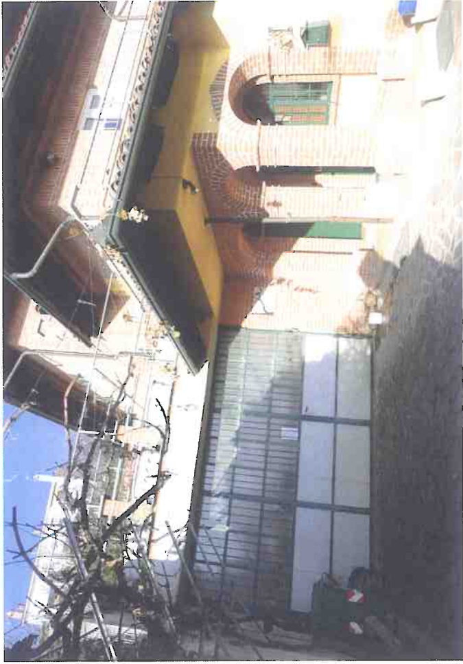
Foto 001 - Portone di accesso autorimessa.JPG