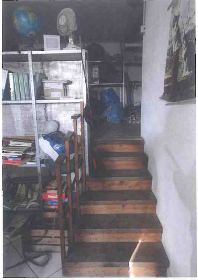
Foto 003 - Scala di accesso alla zona soppalcata.JPG