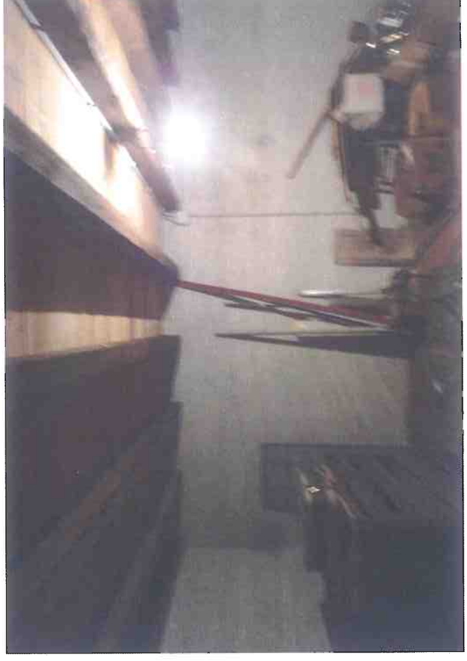
Foto 028 - P. Interrato - Loc. Sgombero 2.JPG