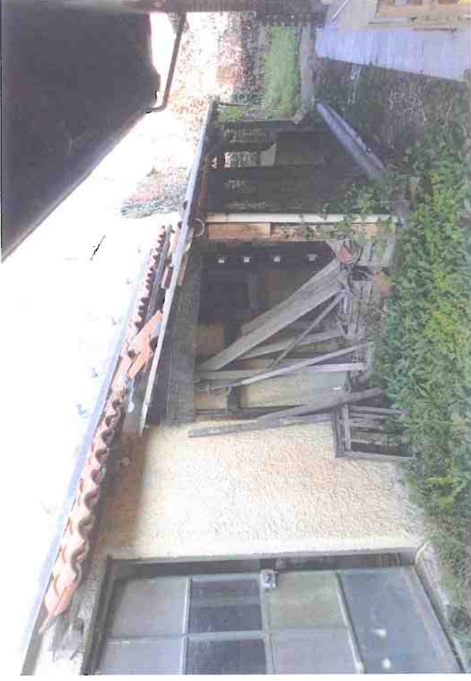
Foto 002 - Tettoia su cortile piano secondo lato Ovest.JPG