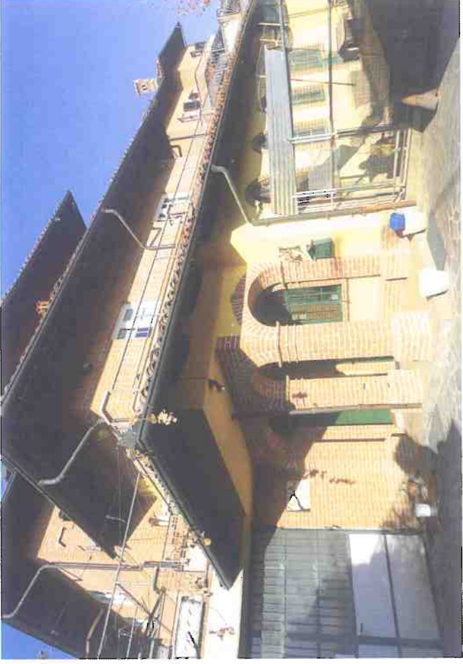
Foto 002 - Porticato ingresso principale.JPG