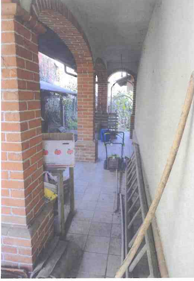
Foto 022 - P. Secondo - Porticato lato Ovest 2.JPG