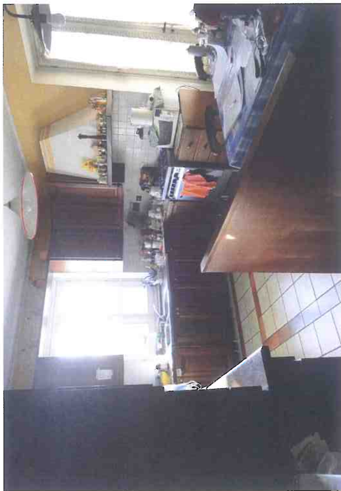
Foto 005 - P. Primo - Cucina.JPG