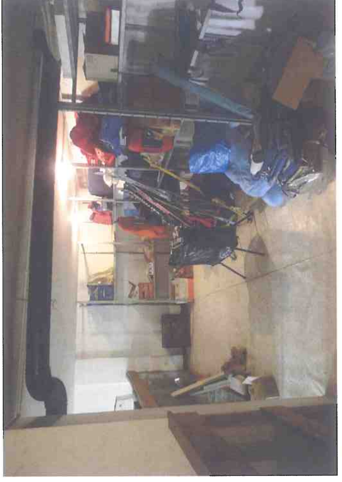
Foto 004 - zona soppalcata dell'ex laboratorio.JPG