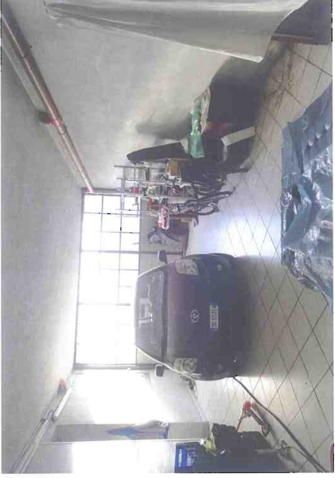
Foto 002 - Autorimessa.JPG