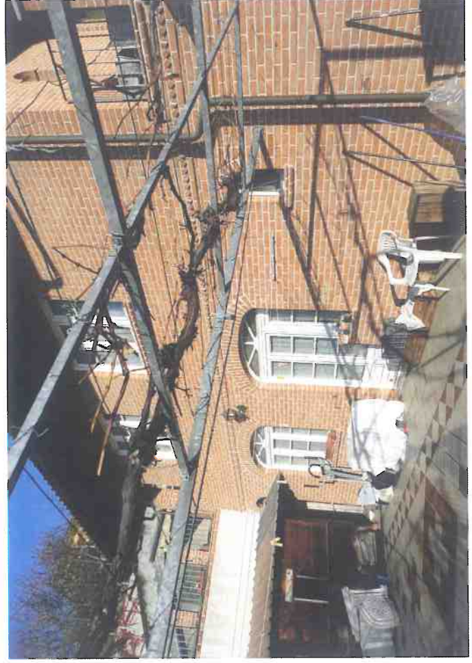
Foto 003 - Prospetto Sud.JPG