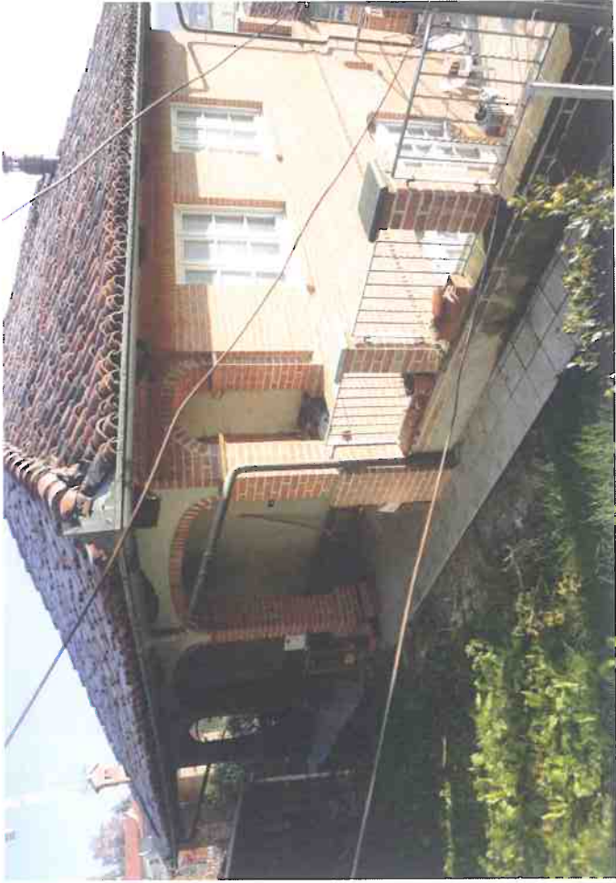
Foto 005 - Prospetto Ovest.JPG