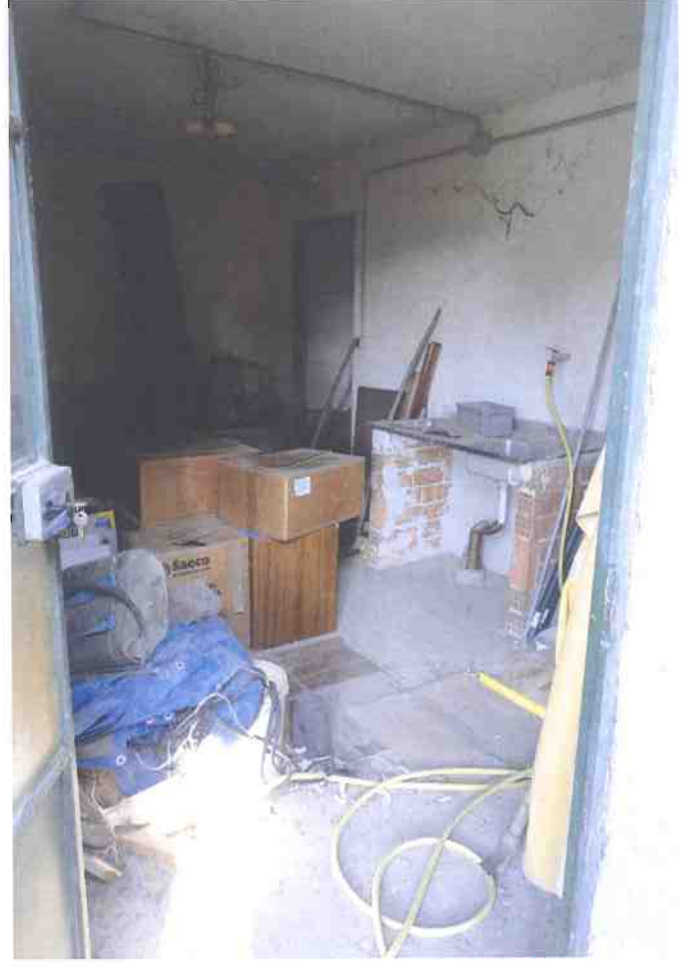
Foto 003 - Locale 1 Interrato piano secondo.JPG