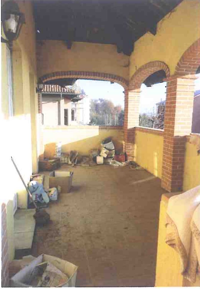
Foto 021 - P. Secondo - Terrazzo coperto lato Est.JPG