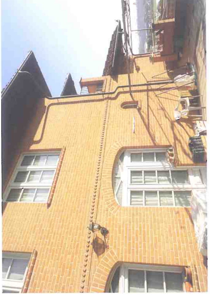
Foto 004 - Prospetto Sud.JPG