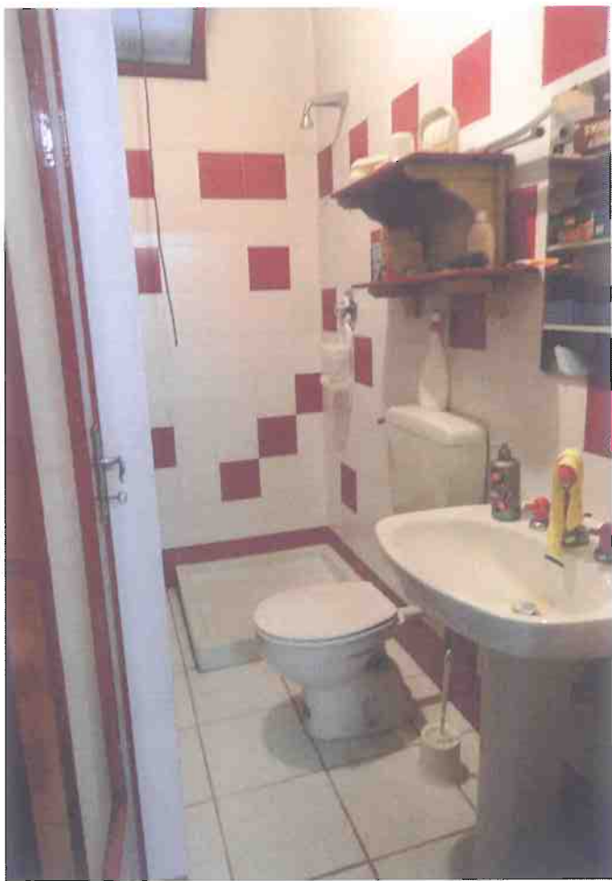
Foto 006 - Servizio igienico.JPG