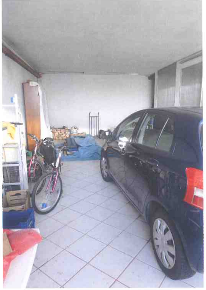
Foto 003 - Autorimessa.JPG