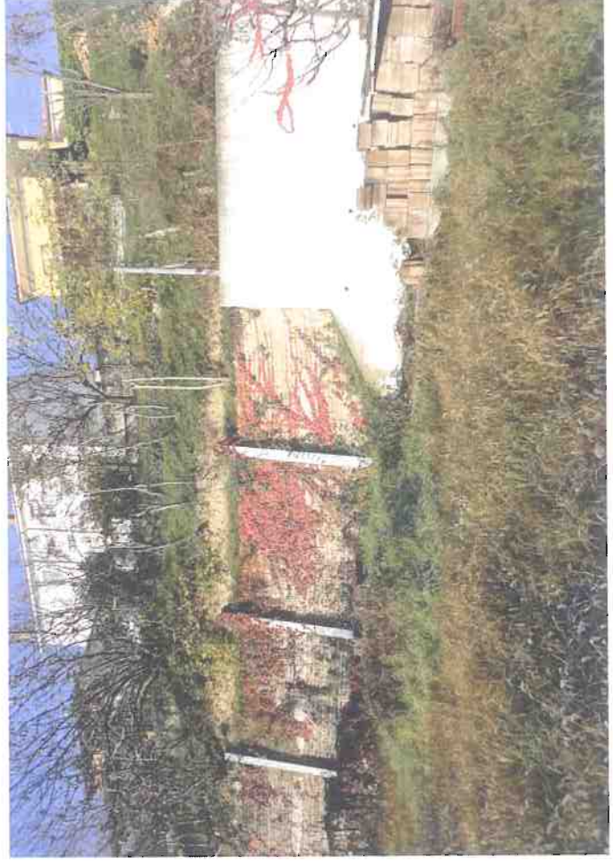
Foto 008 - Giardino terrazzato sul retro.JPG