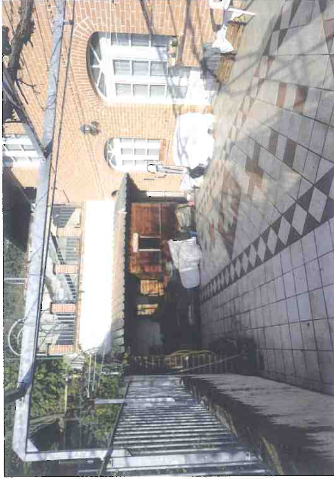
Foto 001 - Tettoia su terrazzo piano primo lato Sud.JPG