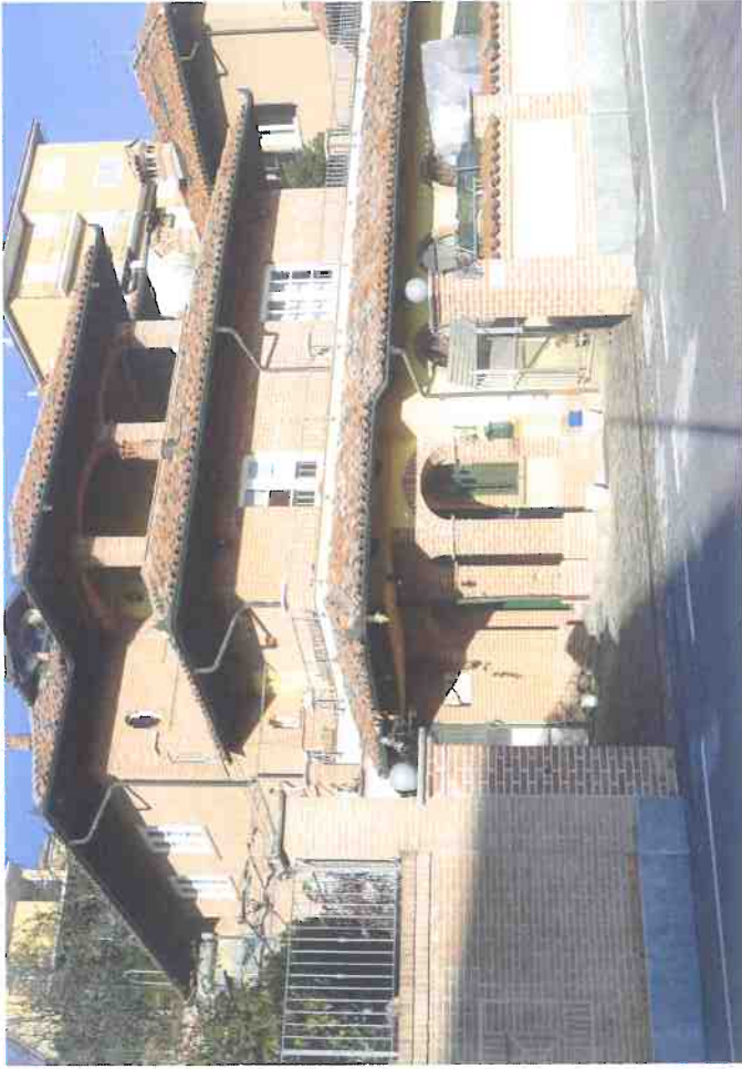
Foto 001 - Prospetto Est - Via Coniolo.JPG