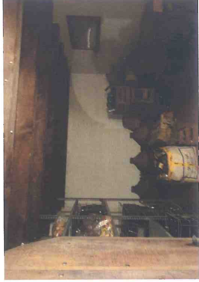
Foto 027 - P. Interrato - Loc. Sgombero 1.JPG