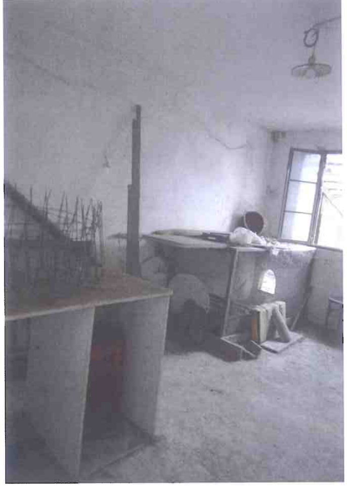
Foto 004 - Locale 2 Interrato piano secondo.JPG