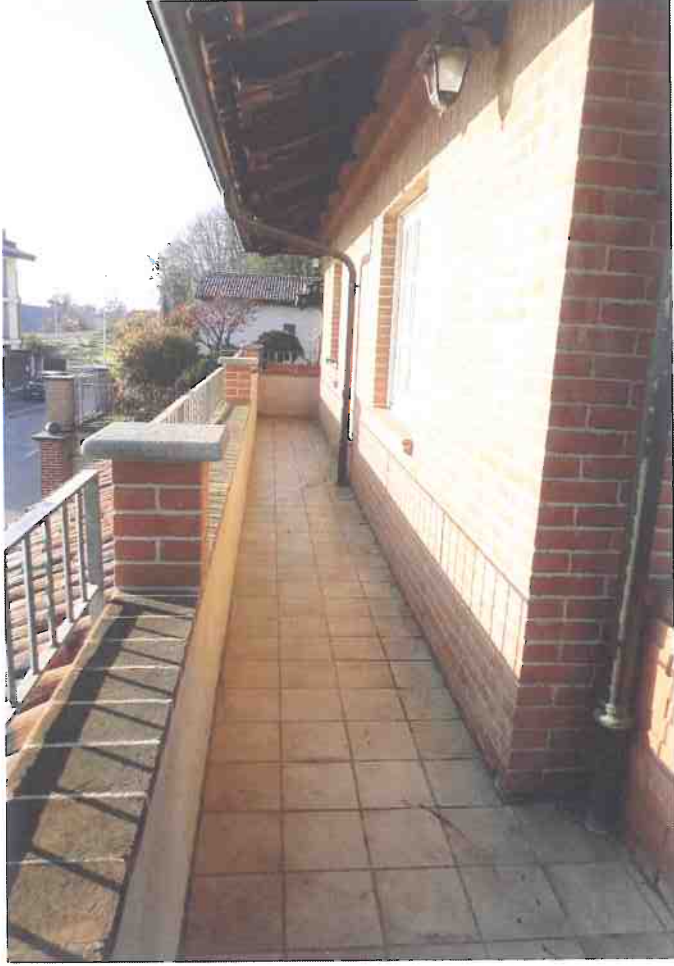
Foto 013 - P. Primo - Passaggio di comunicaz. tra terrazzi lato Est.JPG