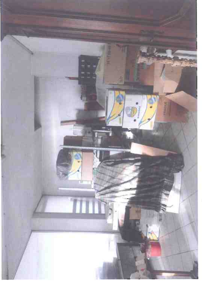
Foto 004 - Autorimessa.JPG