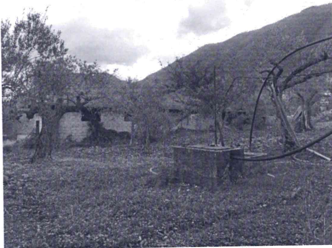
1_veduta generale fronte nord ovest 2_dettaglio fronte principale su via Bebiana e fronte ovest