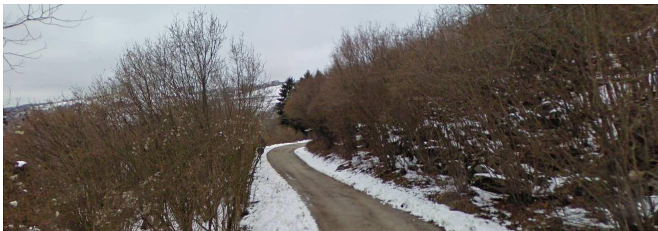
Panoramica terreni da strada che li attraversa