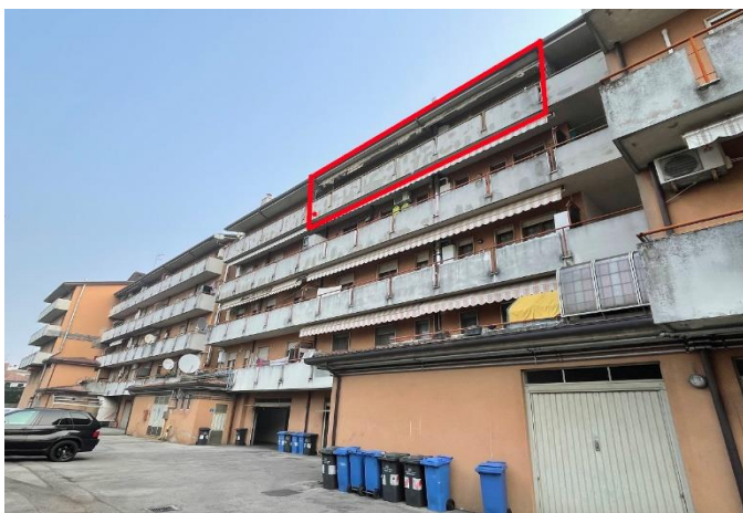
Vista del fabbricato condominiale da Ovest