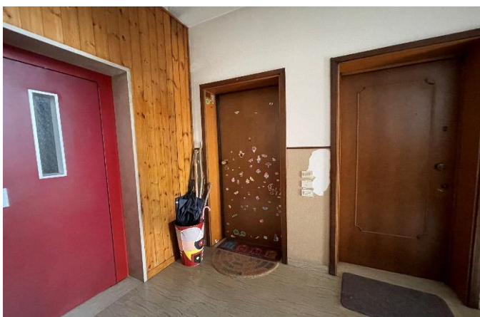
Vista del portoncino di ingresso all'appartamento