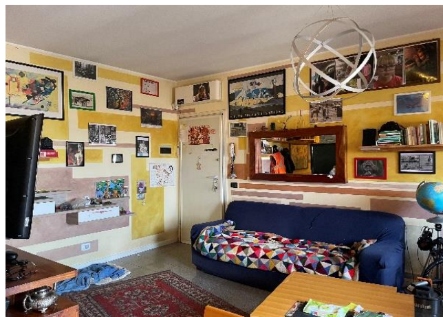
Vista dell'ingresso soggiorno