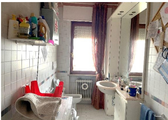
Vista del bagno