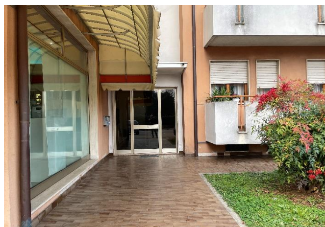
Vista dell'ingresso comune alla scala "C" del condominio