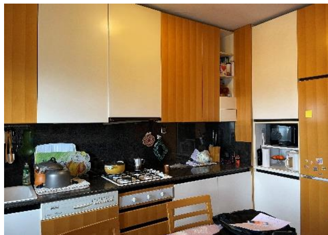
Vista della cucina