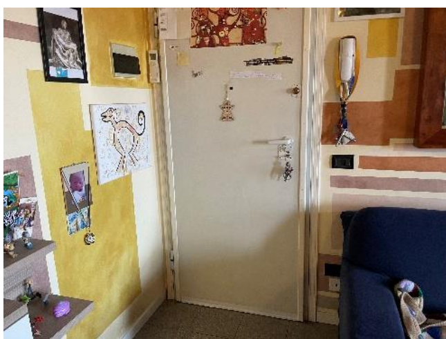
Vista del portoncino di ingresso