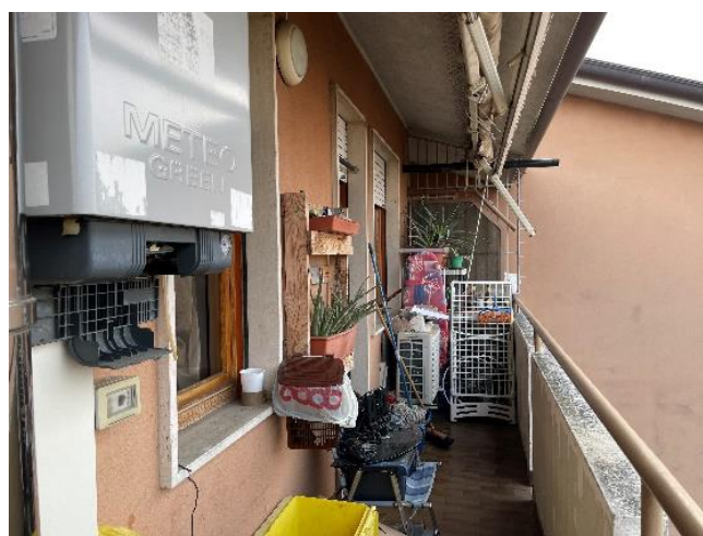
Vista della terrazza