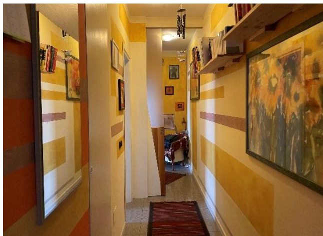
Vista del corridoio