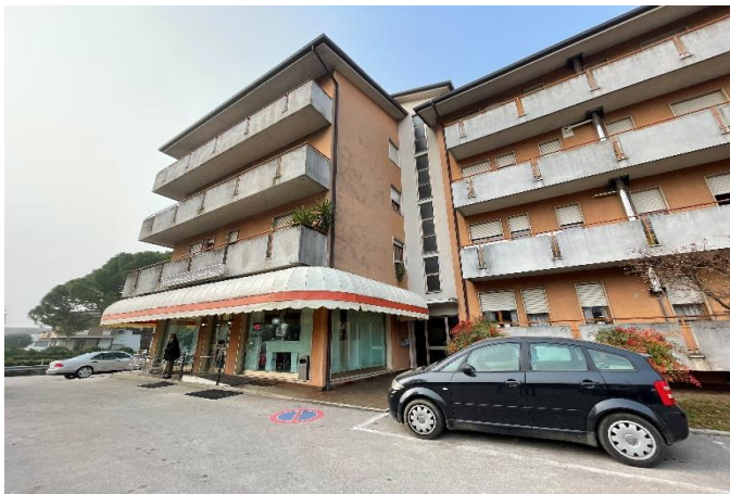
Vista del fabbricato condominiale dalla Via S. Maria