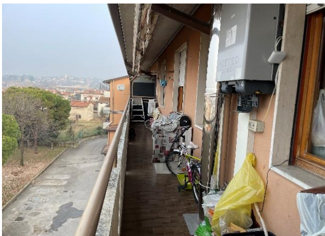
Vista della terrazza

Proc. n. 337/2023 RGE – Rapporto di valutazione Giudice Dr.sa Sonia PANTANO Custode IVG VI Perito Arch. Marco VIANELLO