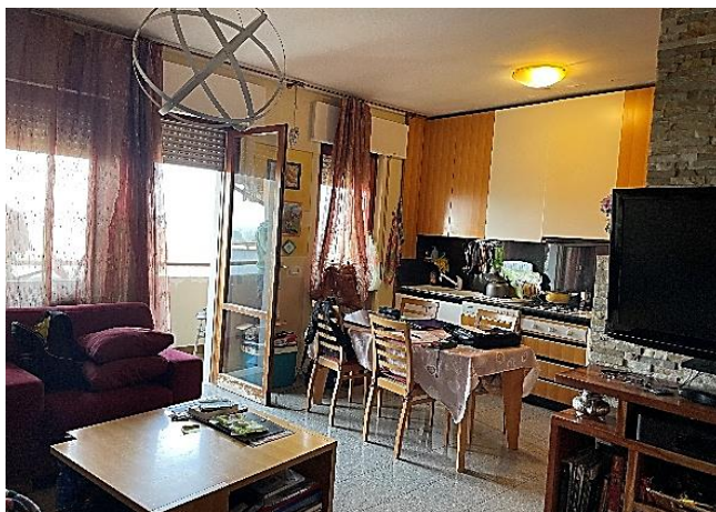
Vista della cucina soggiorno