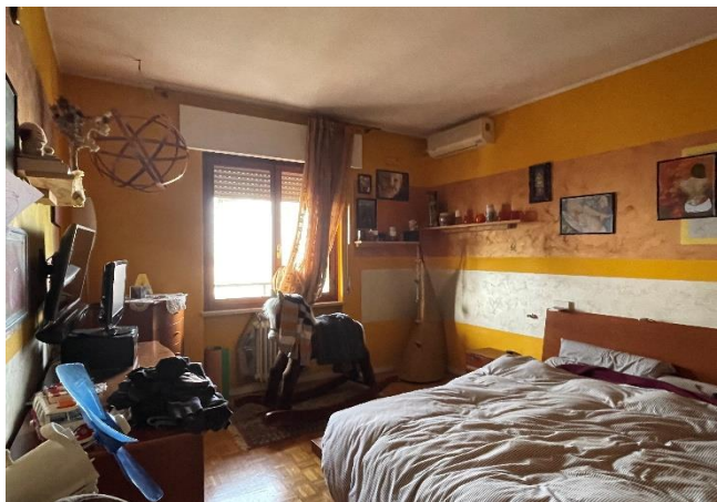
Vista della camera