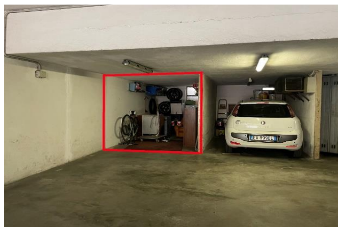
Vista dell'autorimessa al piano interrato