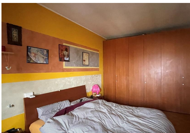
Vista della camera