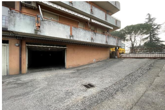
Vista del fabbricato da Ovest sull'accesso carraio