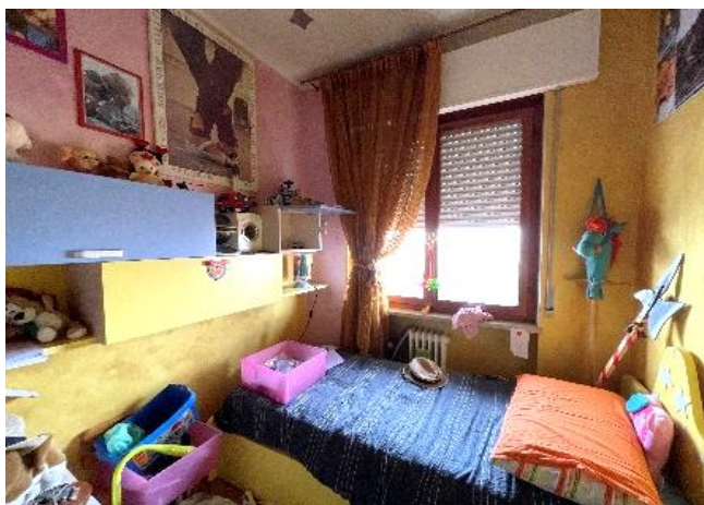
Vista del guardaroba (mq 7.13) adibito a cameretta