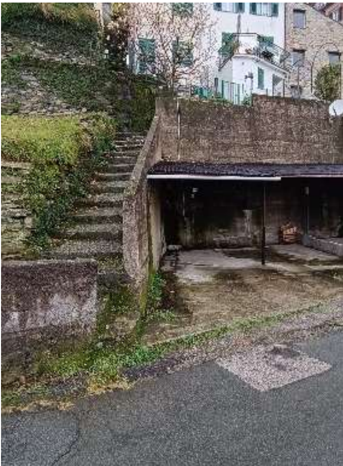
Foto 5 - Inizio sentiero pedonale.