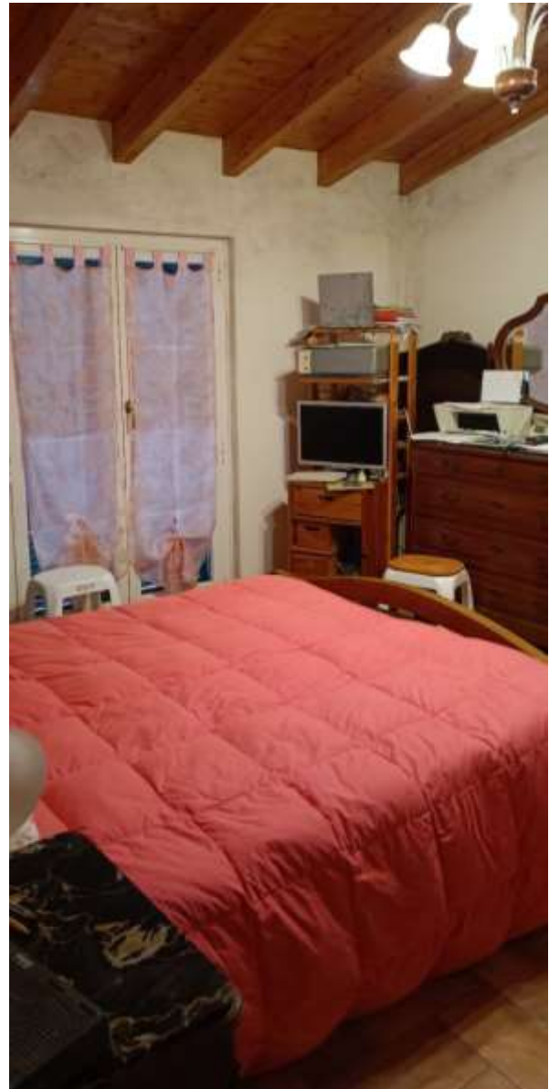
Foto 17 - Camera nor-est.