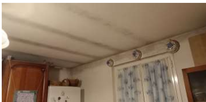
Foto 25 - Soffitto cucina.