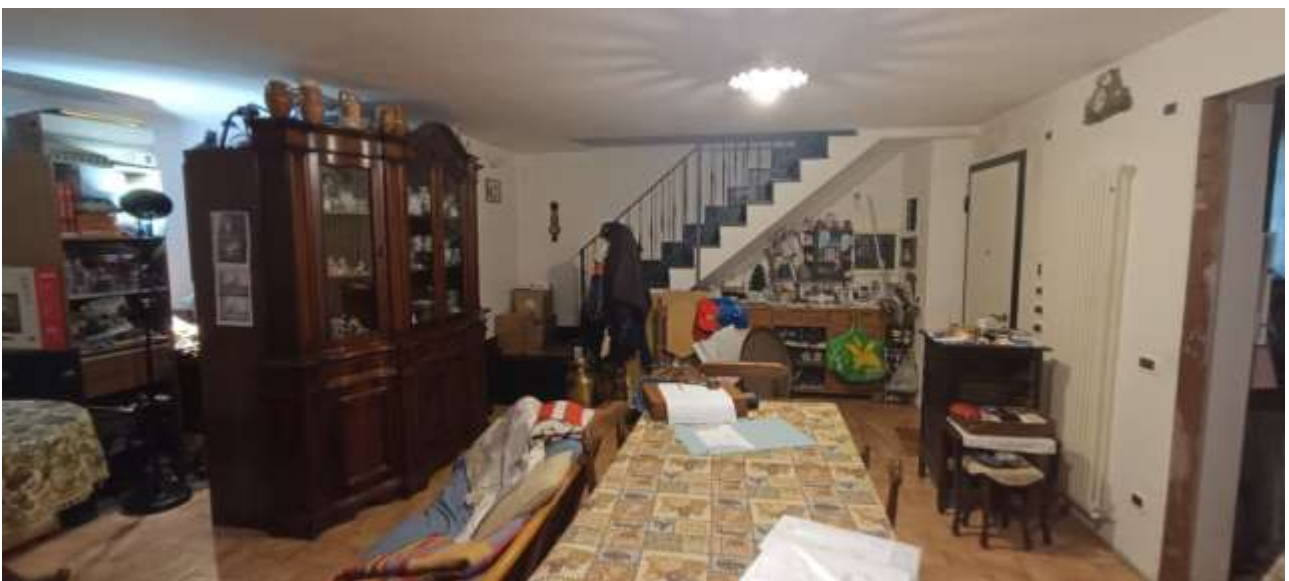
Foto 11 - Ingresso - soggiorno.