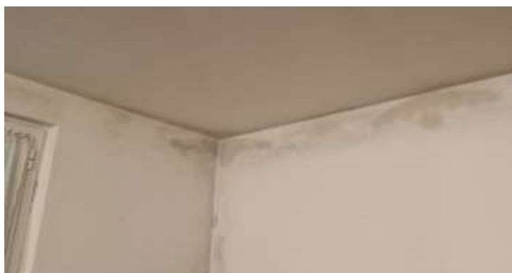
Foto 24 - Soffitto soggiorno.