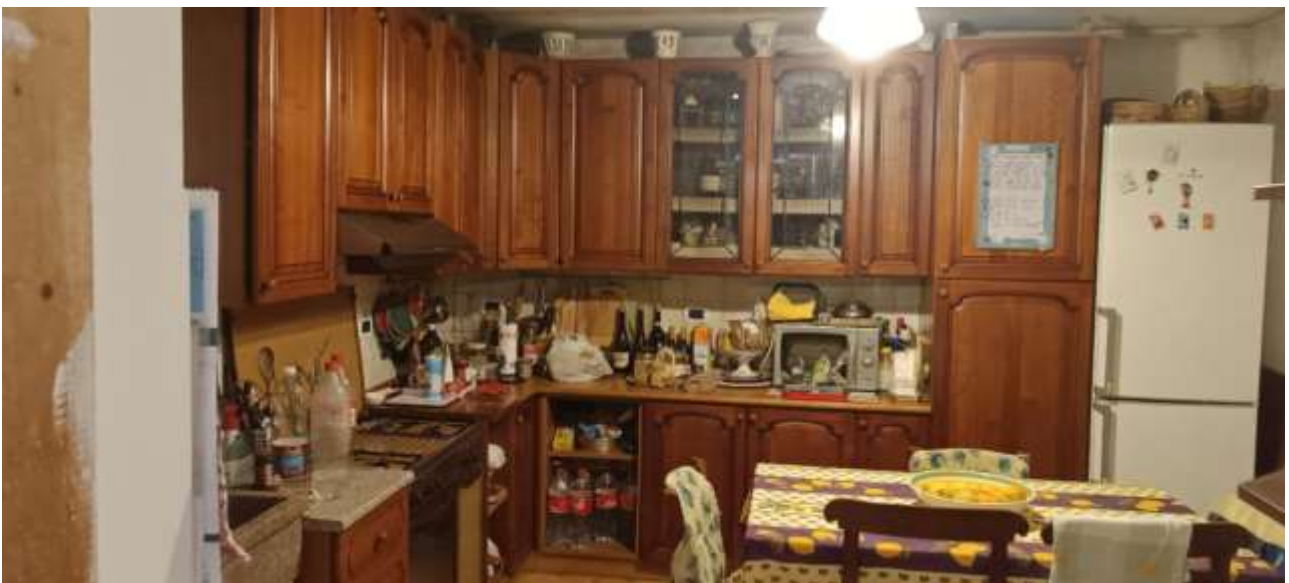
Foto 14 - Cucina.