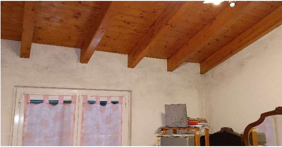
Foto 28 - Parete nord della camera nord-est.