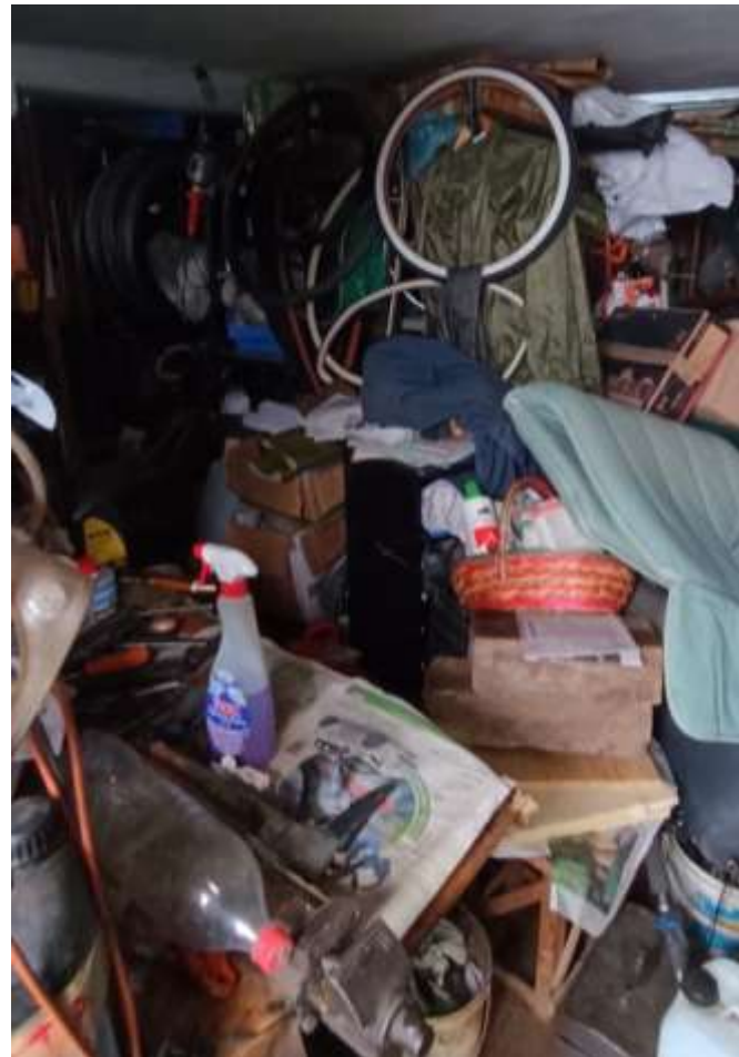
Foto 8 - Cantina