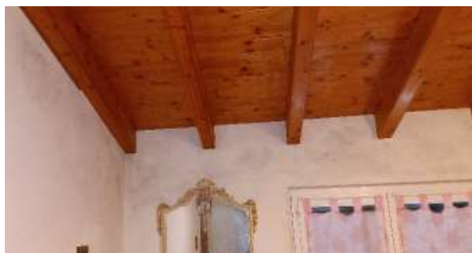
Foto 27 - Soffitto camera nord-est.