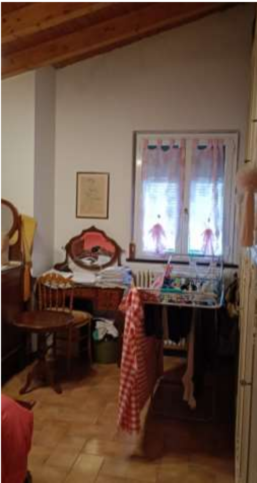
Foto 18 - Camera nord-est.