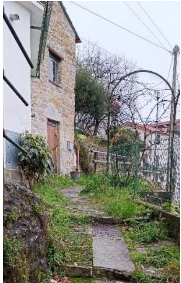
Foto 6 - Sentiero pedonale.