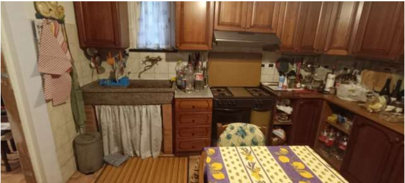
Foto 15 - Cucina