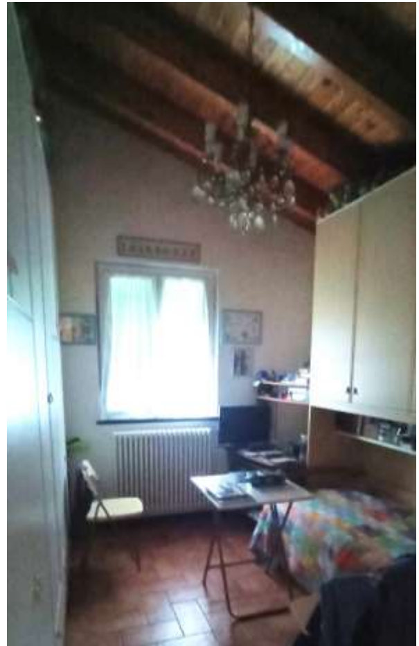
Foto 19 - Camera sud-est.