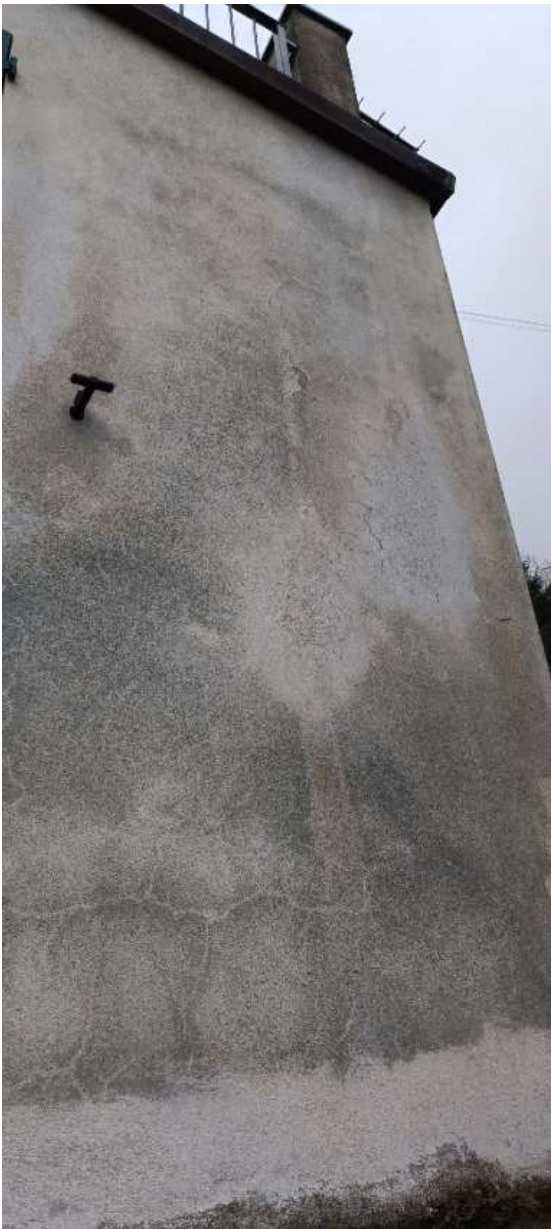
Foto 9 - Particolare della facciata ammalorata dall'umidità.