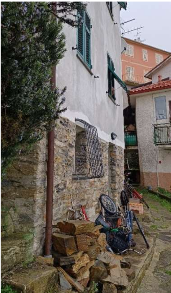
Foto 7 - Edificio in esame: a piano terra la porta e la finestra della cantina.