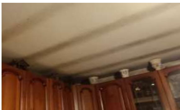
Foto 26 - Soffitto cucina.