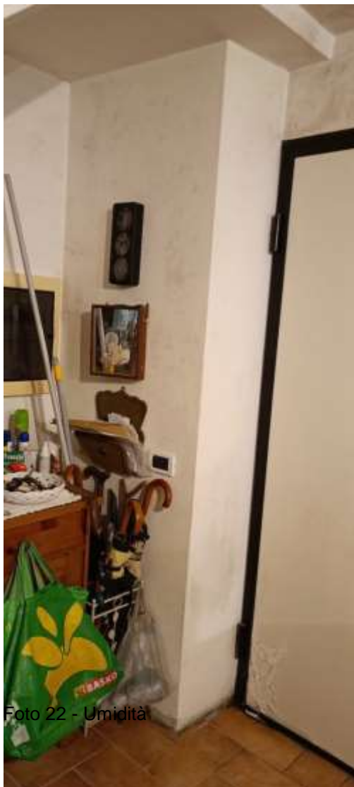
Foto 22 - Umidità