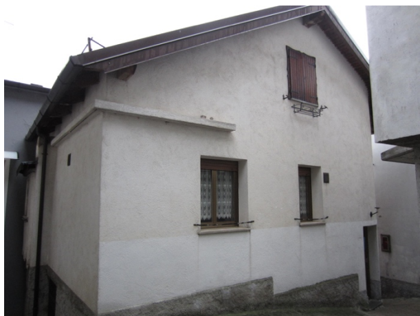
Vedute esterne fabbricato