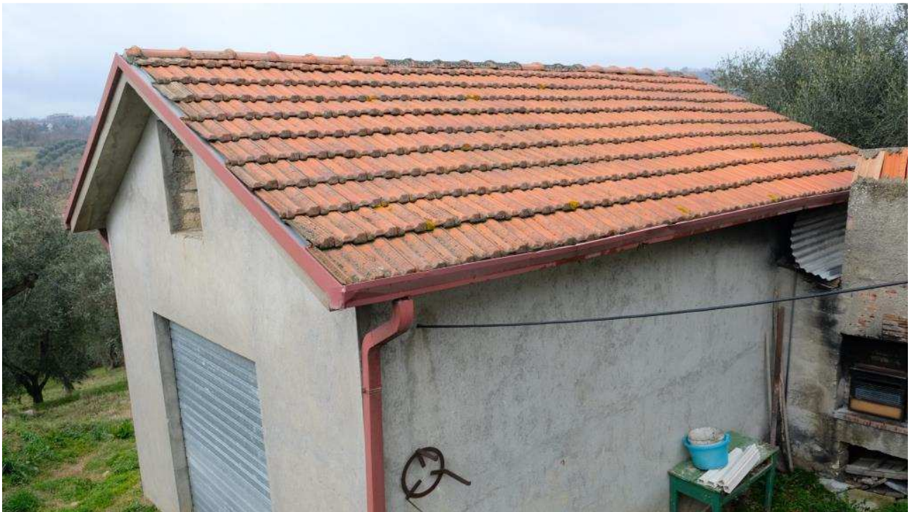
Foto 13 – Vista dell’autorimessa dal portico del fabbricato ex deposito