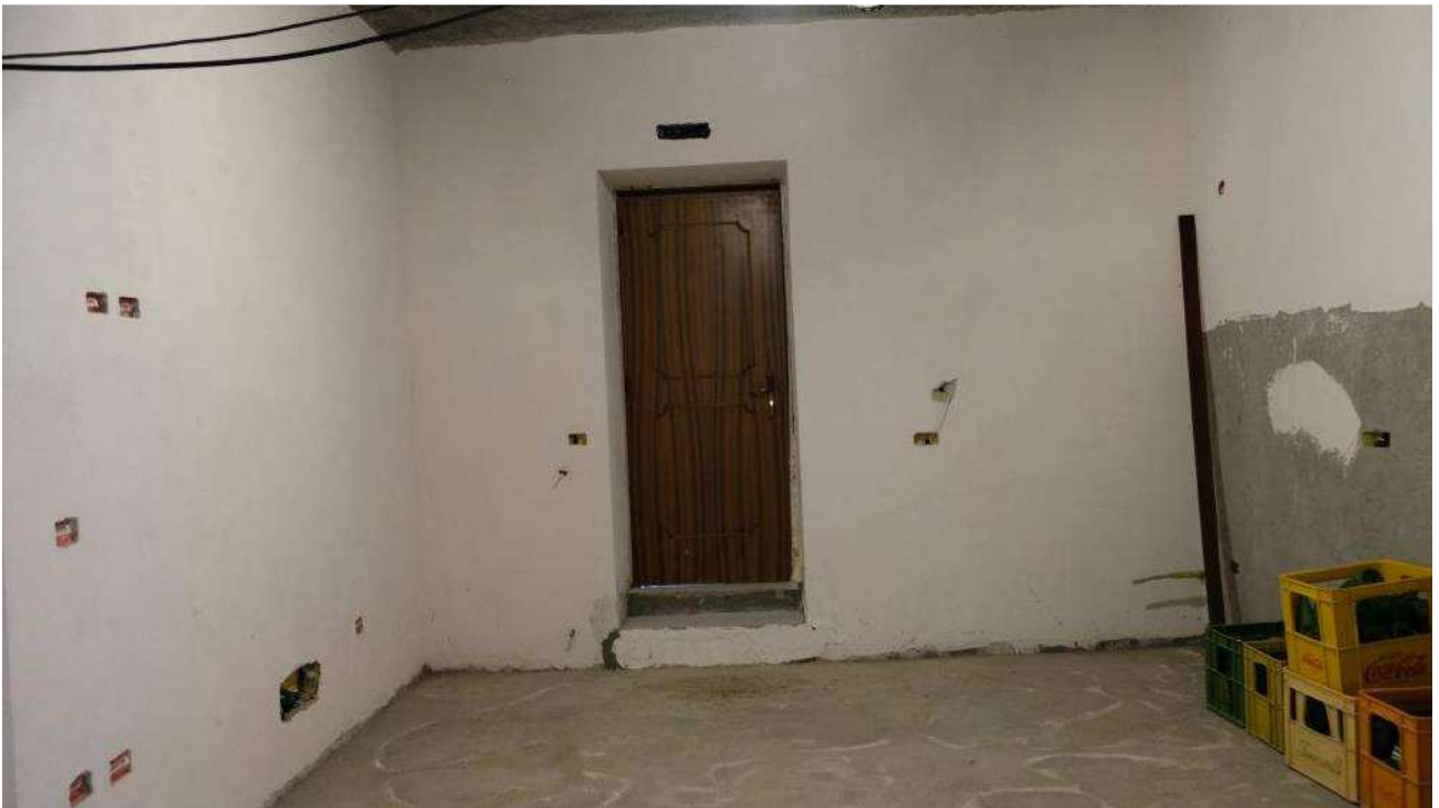
Foto 6 – Dettaglio della porta di accesso al vano soggiorno nel fabbricato ex deposito