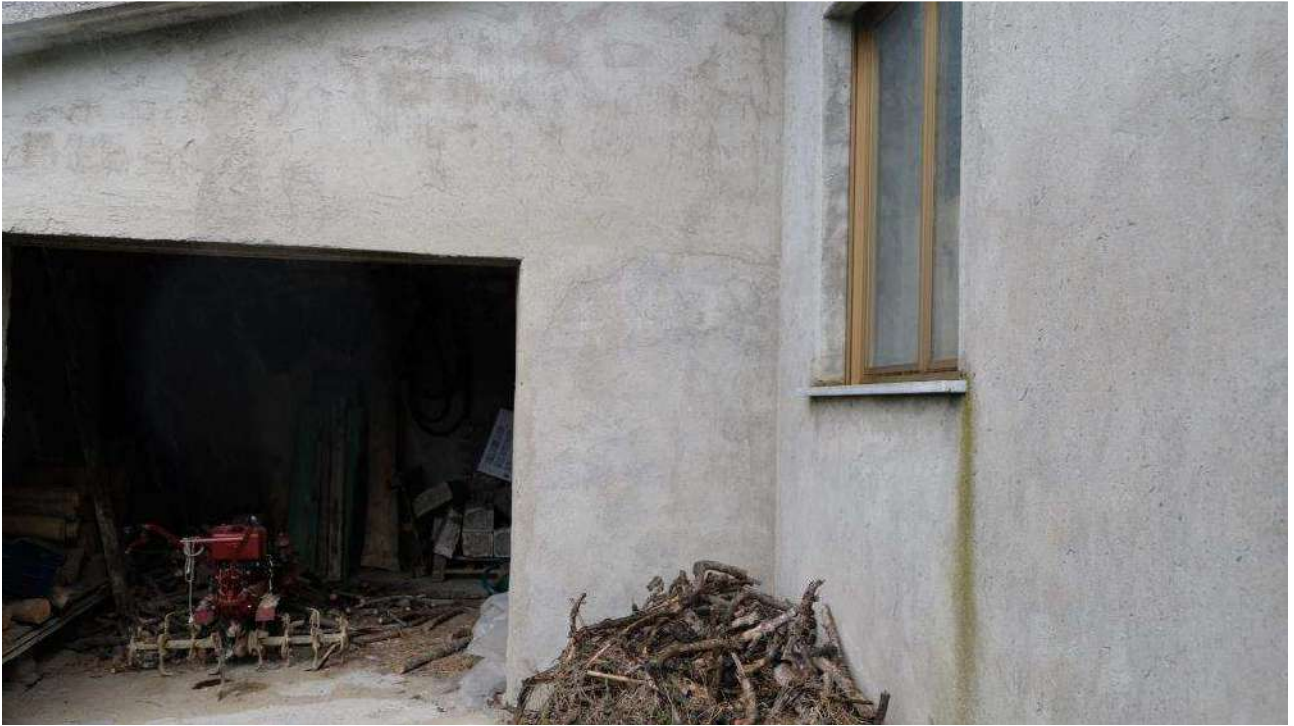
Foto 15 – Dettaglio dell'ingresso al locale più piccolo dell'autorimessa