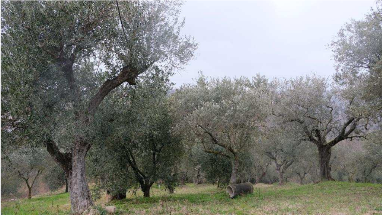
Foto 19 – Vista dell’uliveto particella 1196 ad OVEST dei fabbricati