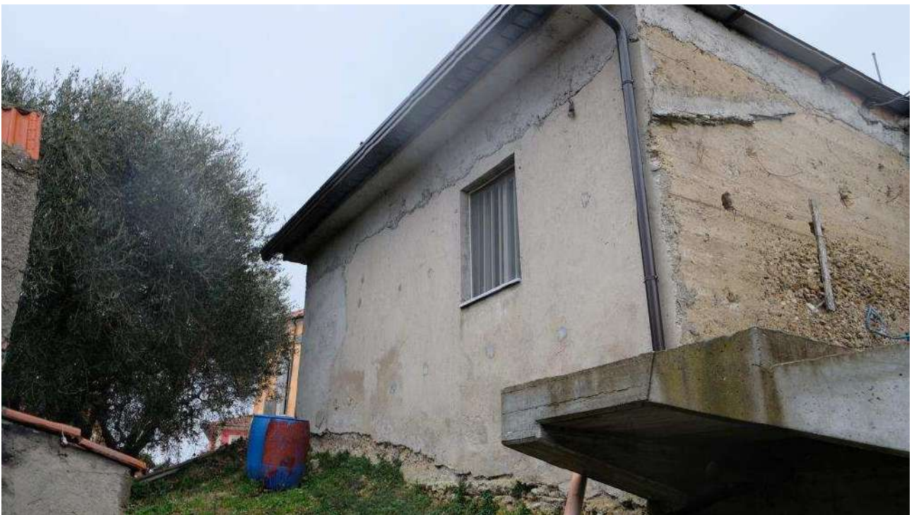
Foto 10 - Dettagli esterni nello stato rustico del fabbricato ex deposito,