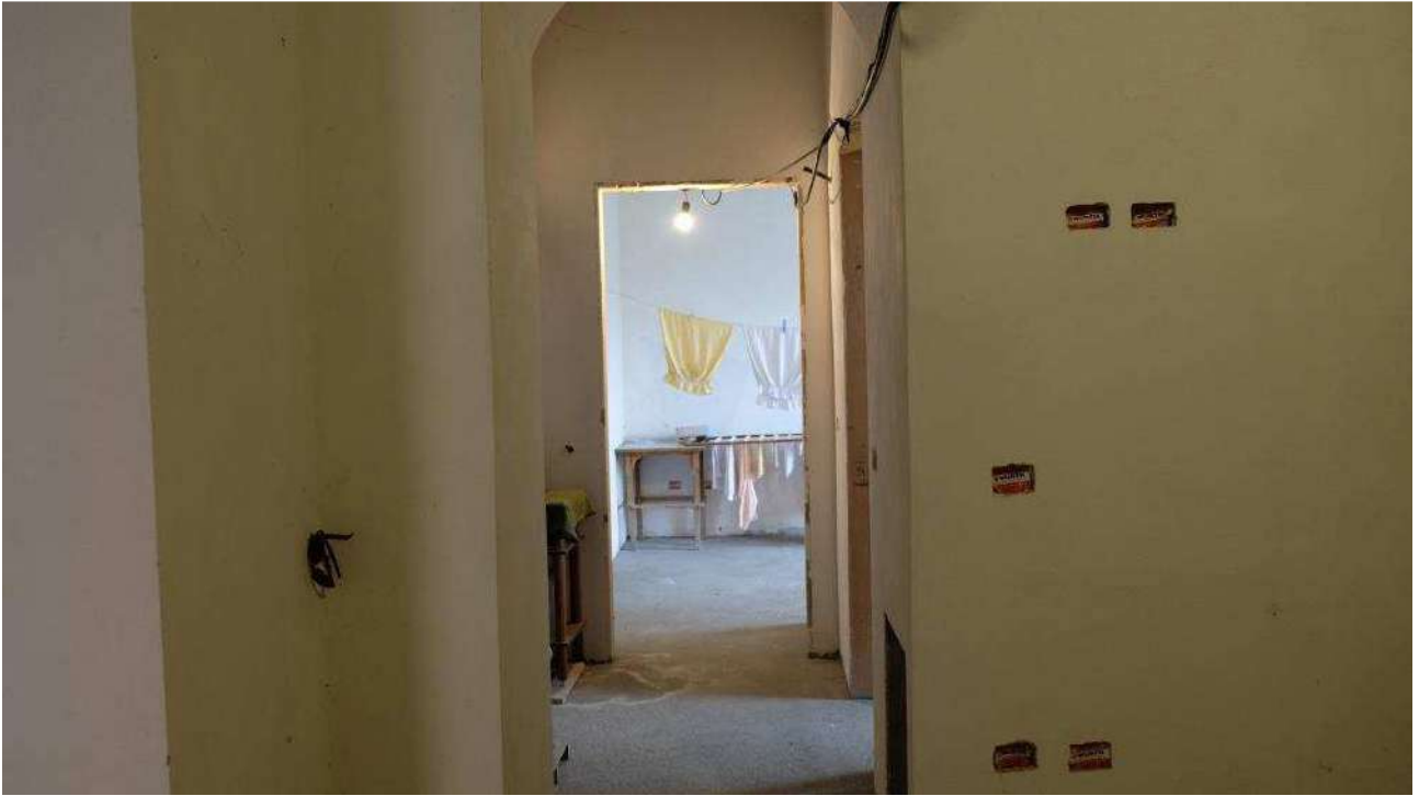
Foto 5 – Dettaglio degli interni dell'immobile ex deposito nello stato rustico