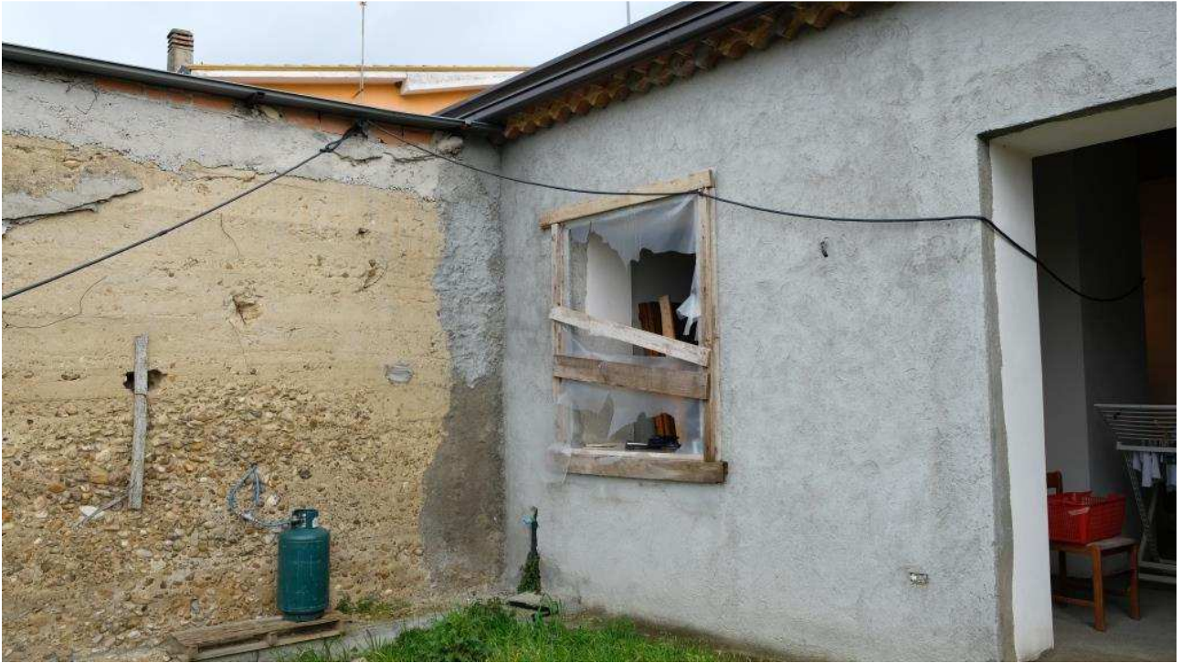
Foto 9 – Dettagli esterni nello stato rustico del fabbricato ex deposito, area del portico