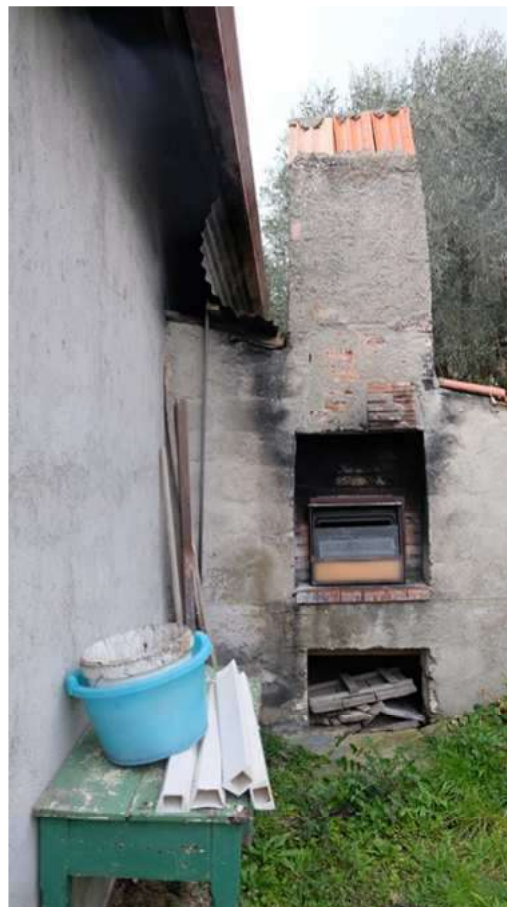
Foto 18 – Vista del forno sul lato EST del fabbricato autorimessa