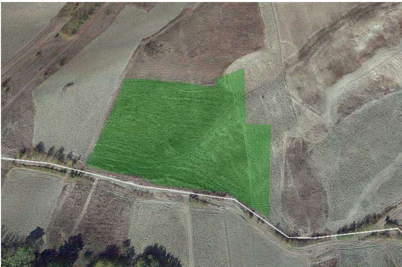
Foto 23 – Vista satellitare dell'area occupata dalle particelle pignorate del foglio 94