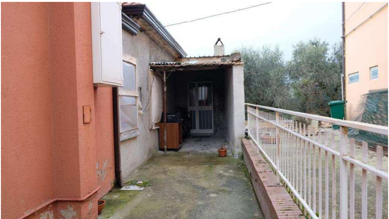
Foto 12 – Vista dell'accesso esterno al vano soggiorno dell'ex deposito dalla corte di ingresso all'abitazione