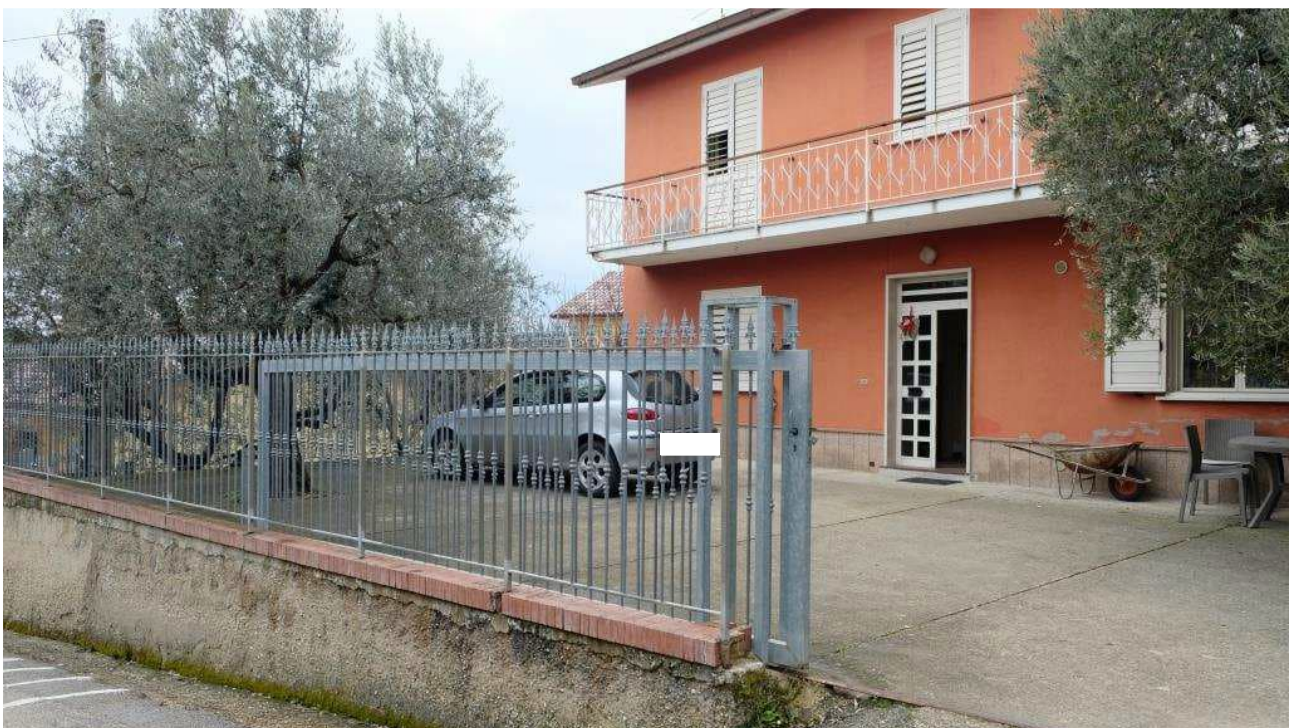
Foto 2 – Dettaglio dell’ingresso alla corte del fabbricato con cancello carraio scorrevole su rotaia e recinzione