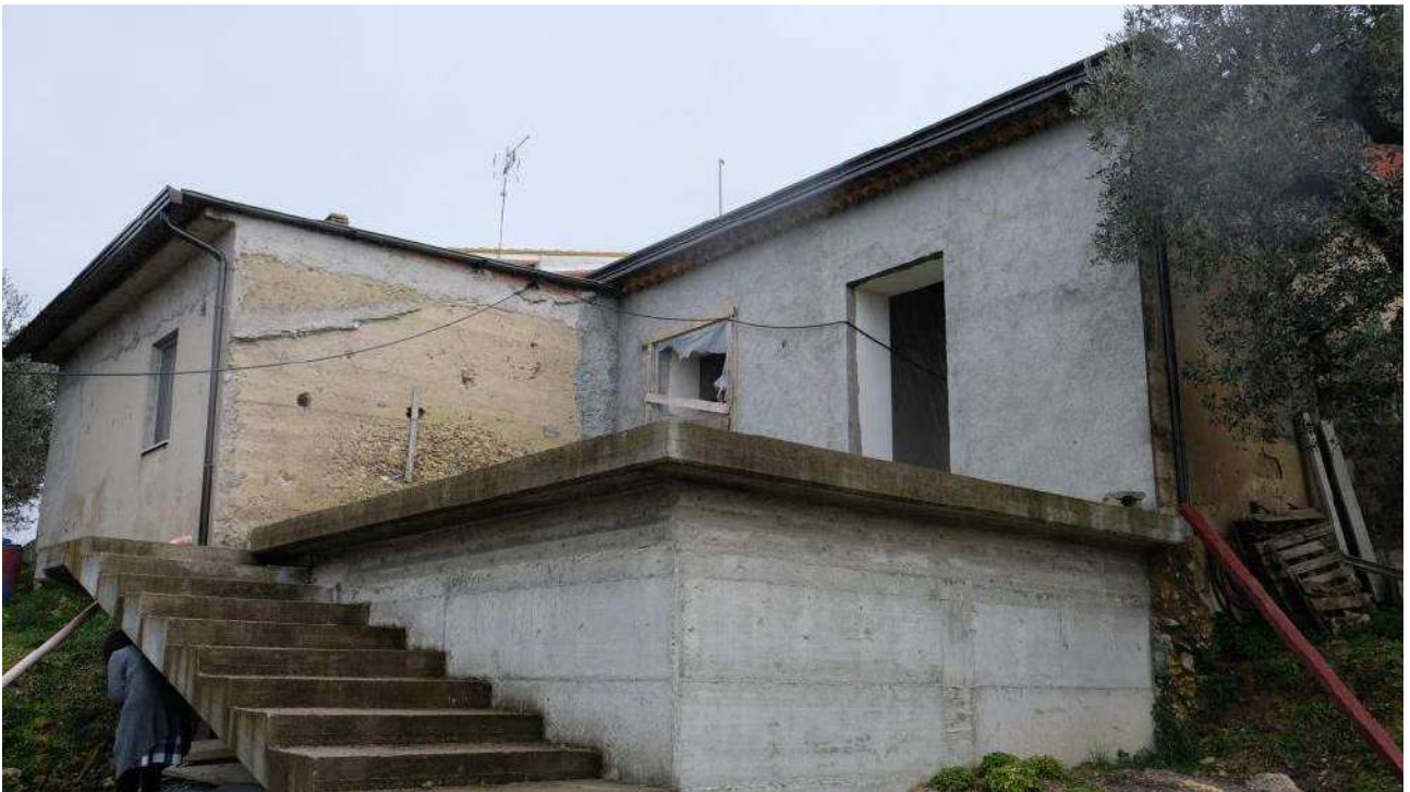
Foto 8 – Vista dell'esterno del fabbricato ex deposito lato NORD/OVEST