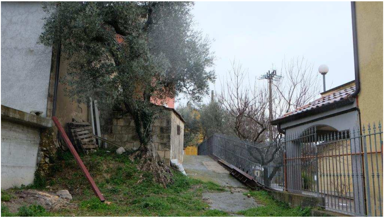
Foto 11 – Viottolo di accesso carraio alla corte interna dell'abitazione dall'area di ingresso