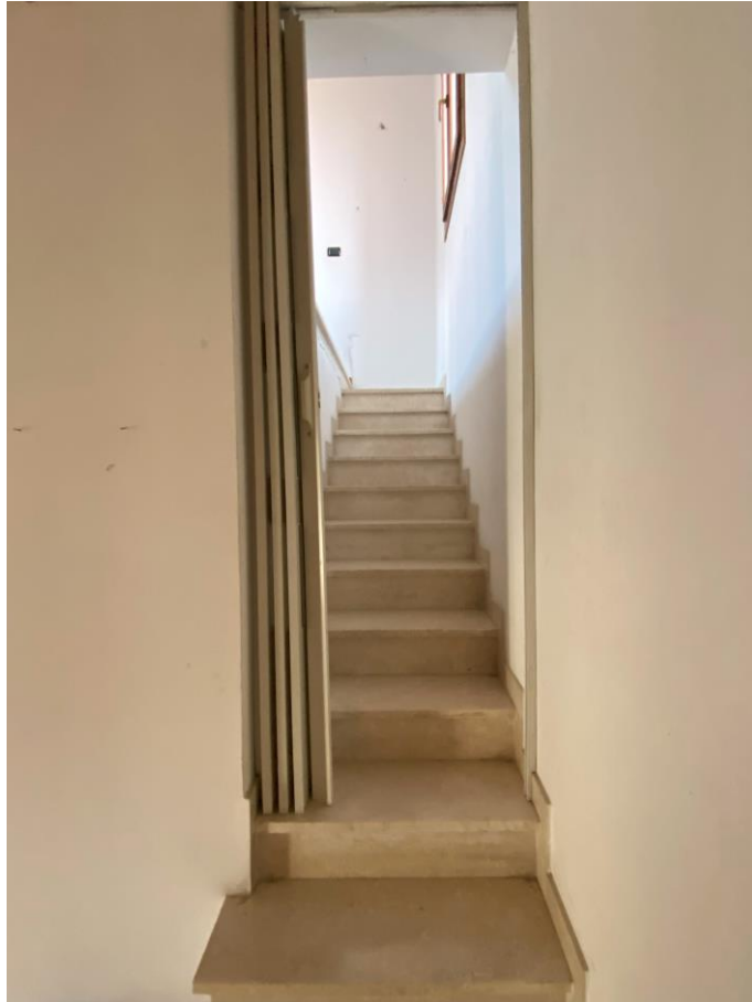
Scala accesso al piano torretta