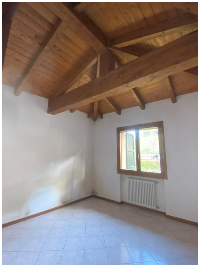
Camera letto – foto 1