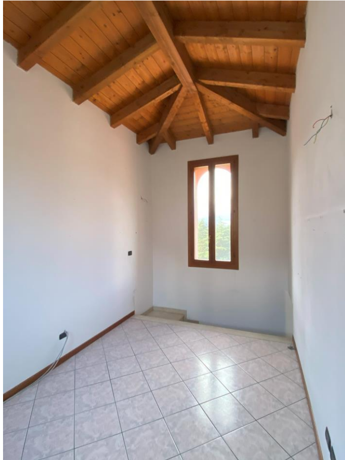
Camera al piano torretta –foto 2