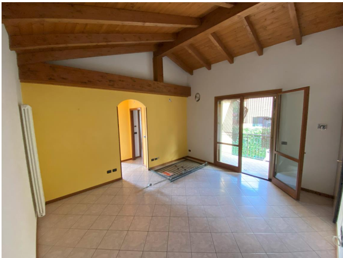
Soggiorno - Ingresso – foto 1