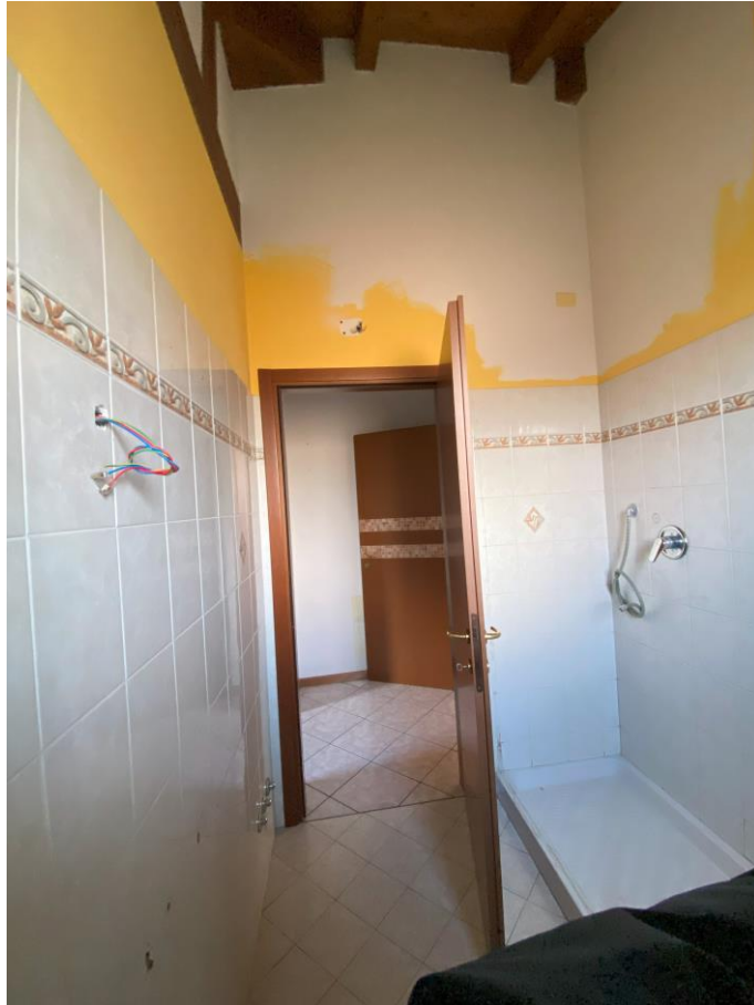
Bagno – foto 2