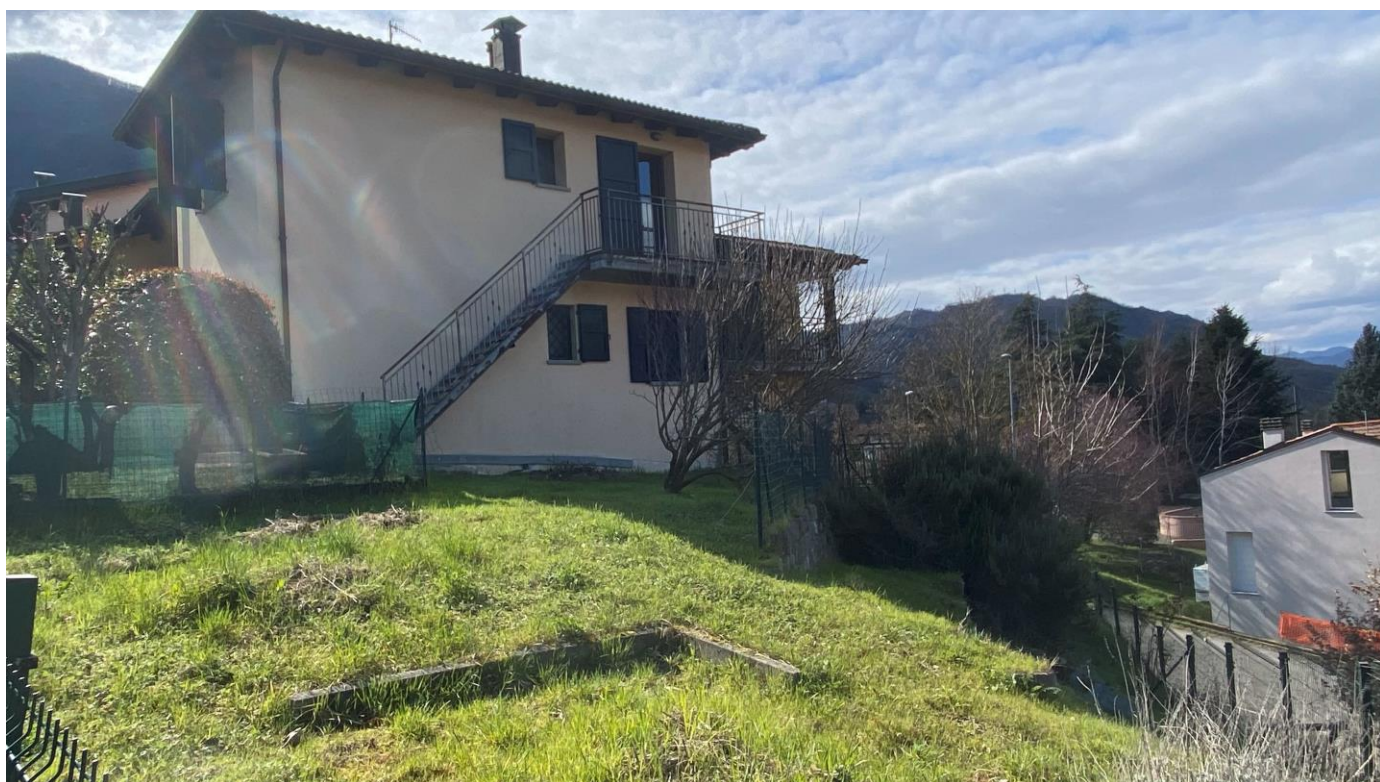
Giardino – foto 1