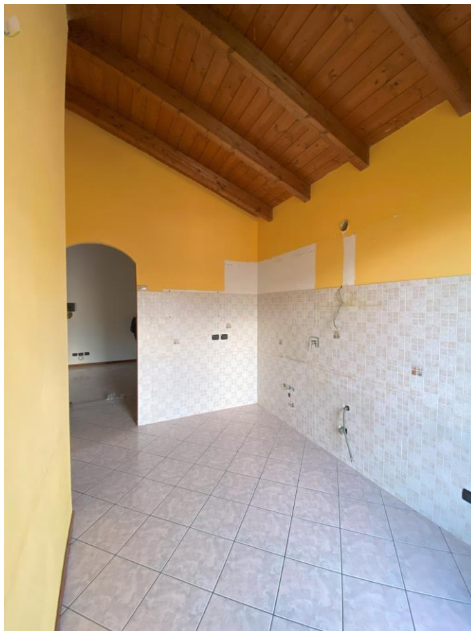
Cucina – foto 1