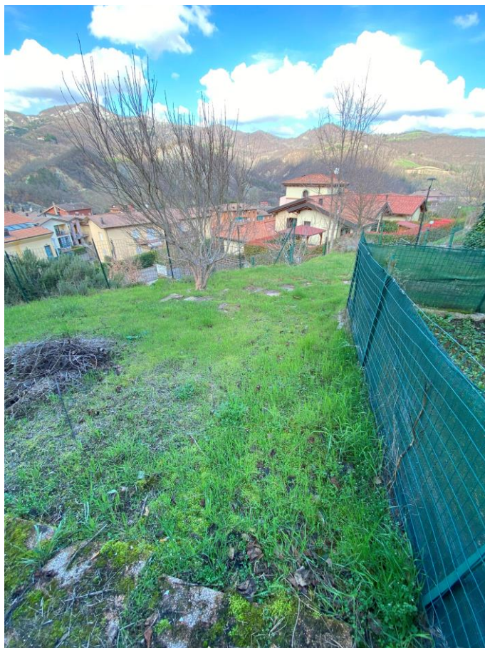
Giardino – foto 1