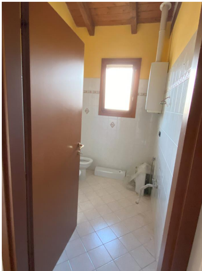
Bagno – foto 1