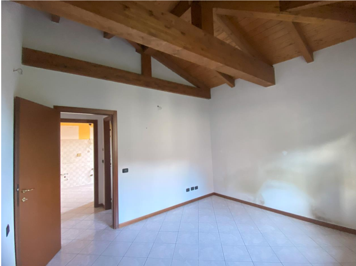
Camera letto – foto 2