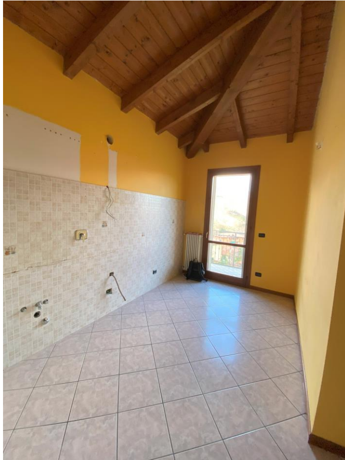
Cucina – foto 1