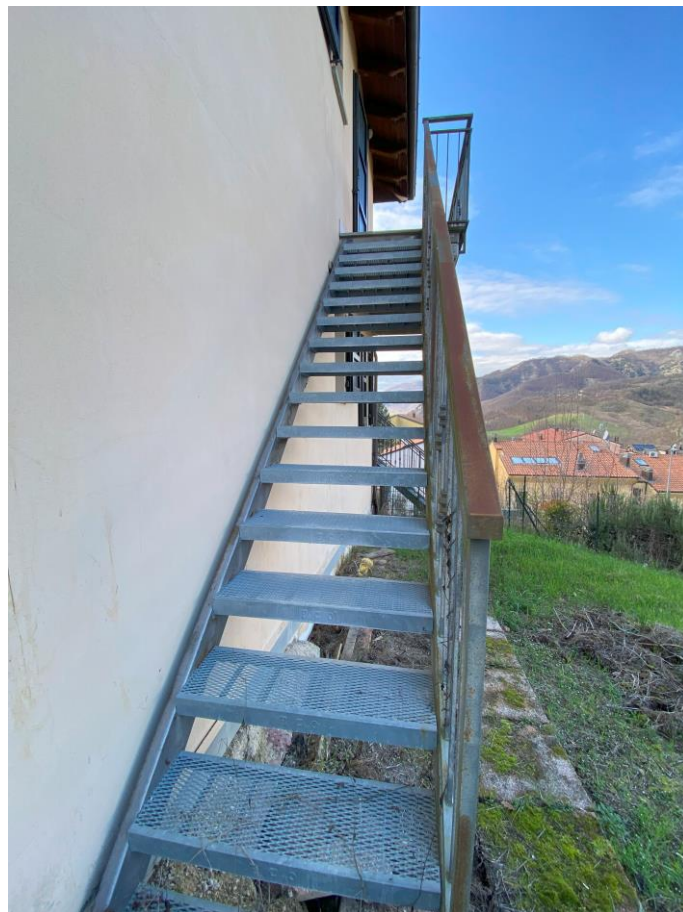
Vista scala dal giardino