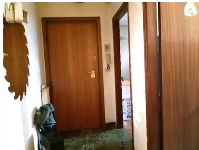
Vista del corridoio di ingresso all'abitazione