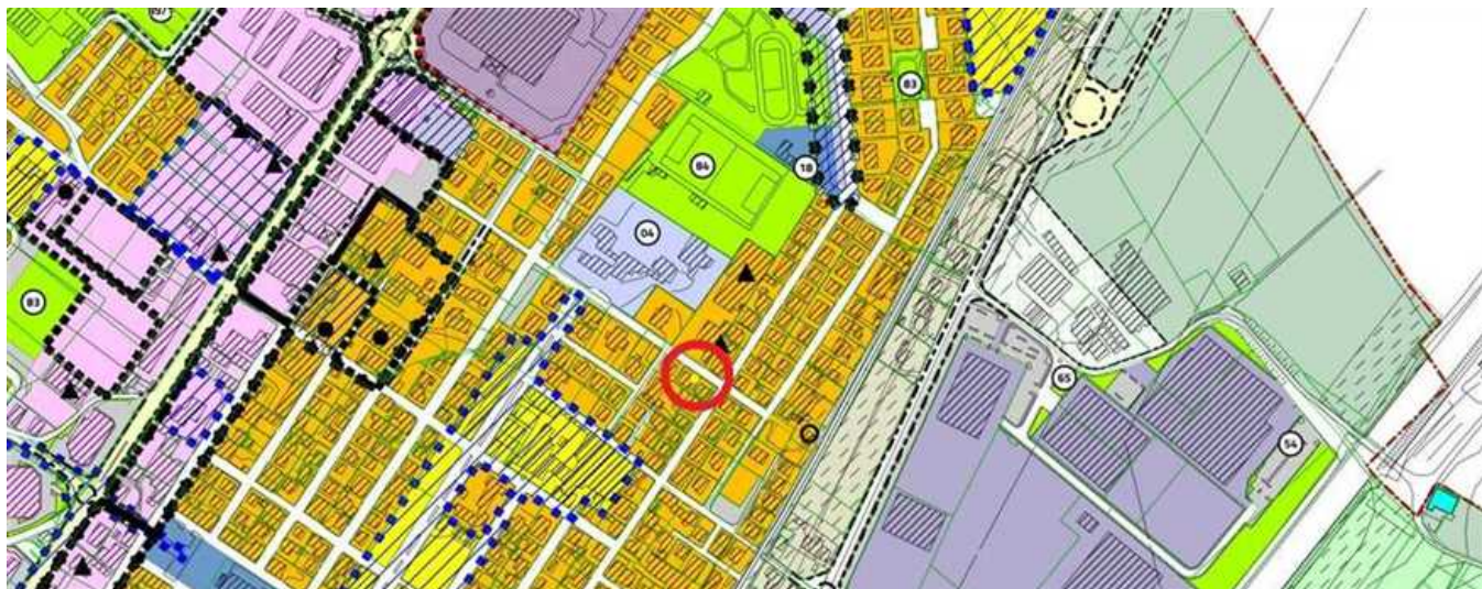
Estratto del Piano degli Interventi del Comune di Montecchio maggiore.

L'ambito in cui insiste l'immobile ad uso residenziale di cui al mapp. n. 150 ricade in Zona Territoriale Omogenea di tipo "B/32 - Aree prevalentemente residenziali di completamento e ristrutturazione densamente edificate" la cui lettura si demanda alle N.T.A.