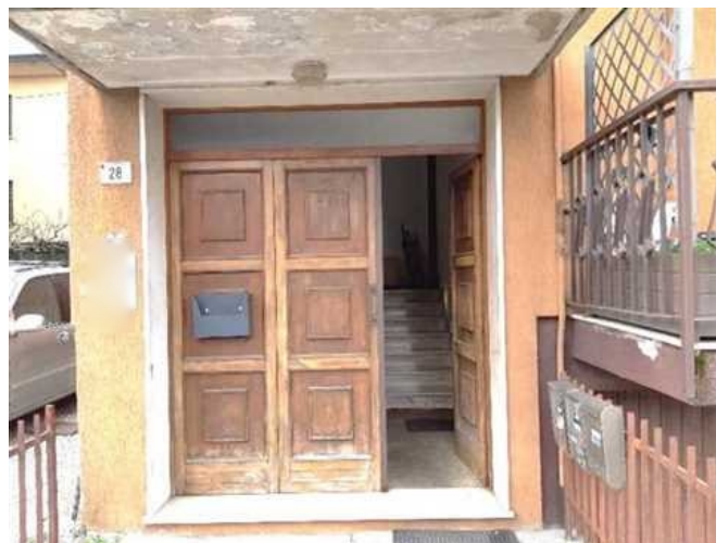
Vista dell'ingresso alla scala comune