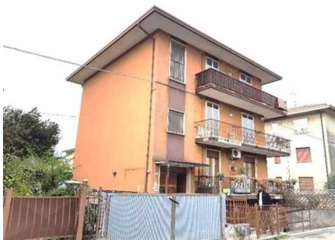
Vista dalla Via Tagliamento

La palazzina si attesta lungo la via pubblica dalla quale mediante cancello pedonale si accede al vano scala comune di servizio di ciascuna abitazione, alla corte di cui al sub 10 ed all'autorimessa interrata. Le corti esterne sono ubicate rispettivamente sul lato Nord Est la porzione di terreno di cui al sub 10 (F/4) avente una superficie in ghiaio lavato di c.a 55 mq, e a Sud Est la porzione di terreno adibita a verde (F/1) avente una superficie di c.a 60 mq. L'immobile risalente ai primi anni '70 del secolo scorso è ubicato nella frazione di Alte Ceccato a poca distanza dai principali servizi pubblici e/o attività commerciali.