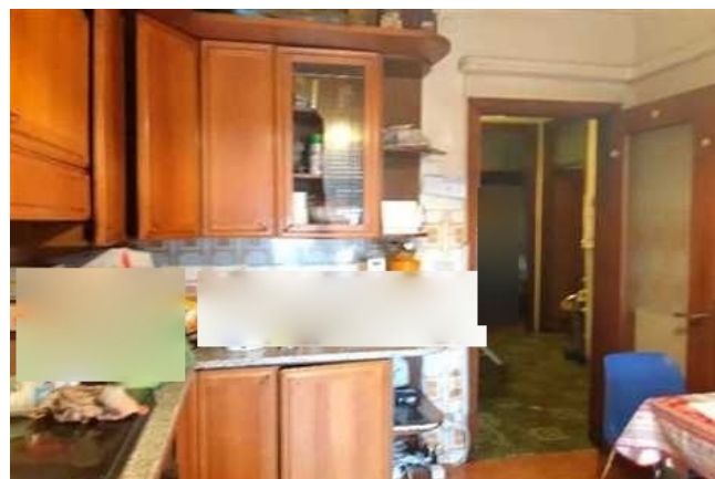
Vista della cucina