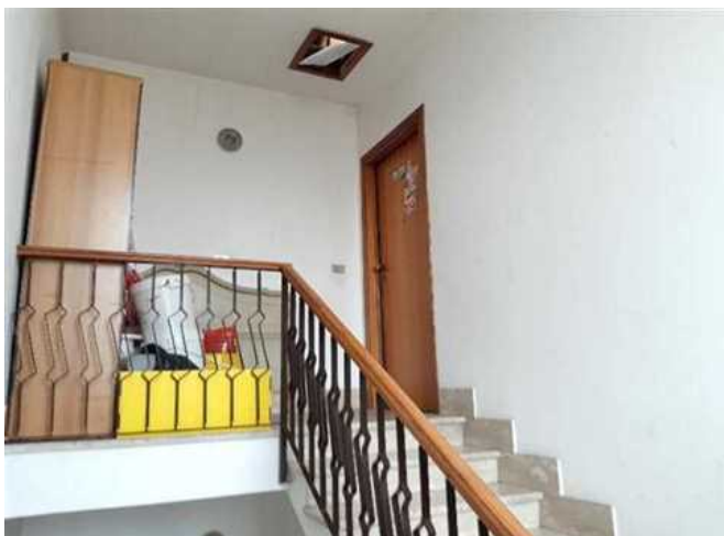
Vista del vano scala comune e della porta di ingresso all'abitazione