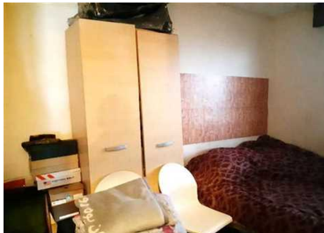
Vista della camera