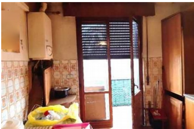
Vista della cucina