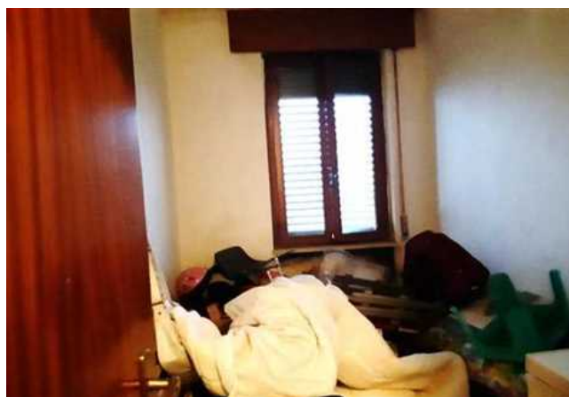
Vista della camera