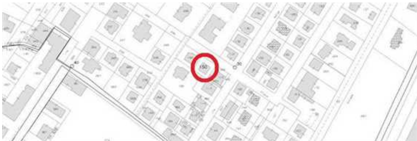
Estratto di mappa Comune Montecchio Maggiore, foglio 8 particella 150