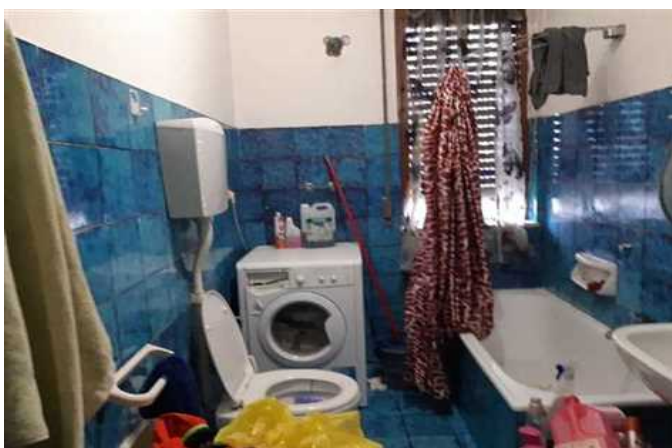
Vista del bagno