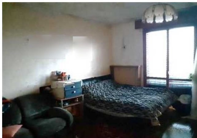
Vista del soggiorno adibito a camera