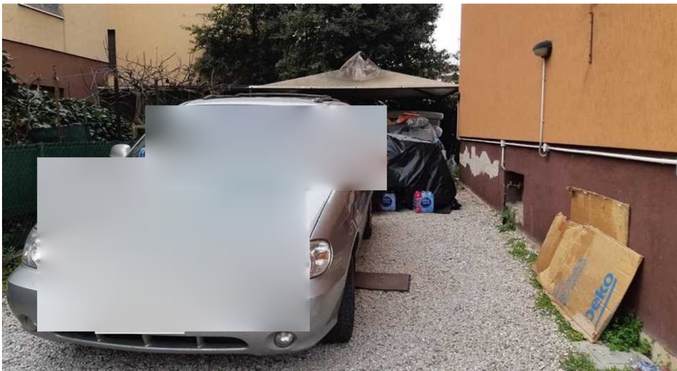
Vista della corte di cui alla pc. 150 sub 10.