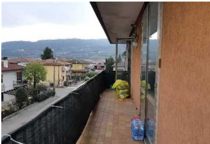
Vista della terrazza