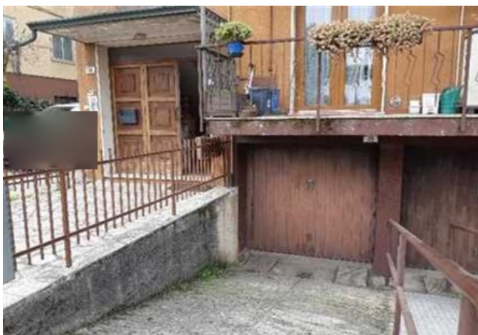
Vista della rampa di accesso all'autorimessa sotto strada