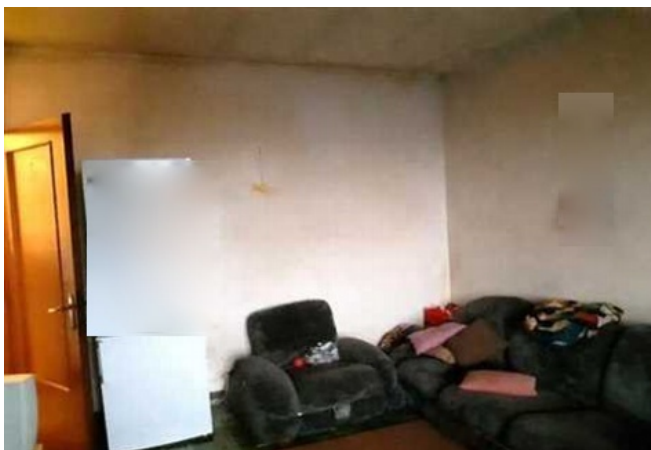
Vista del soggiorno adibito a camera