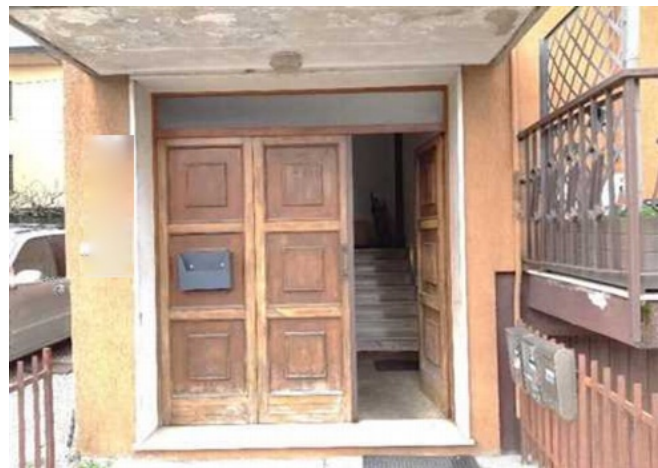
Vista dell'ingresso alla scala comune