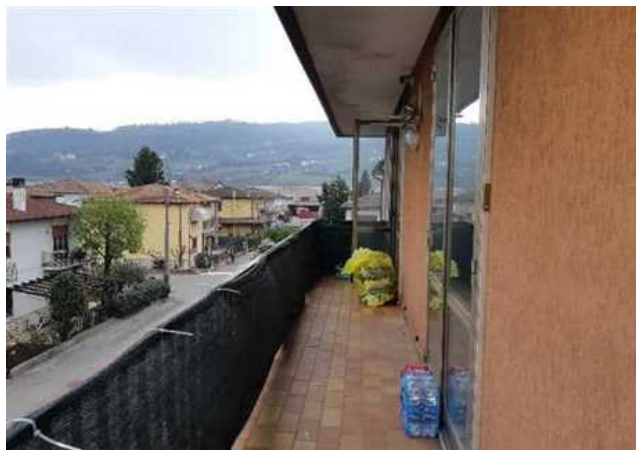
Vista della terrazza