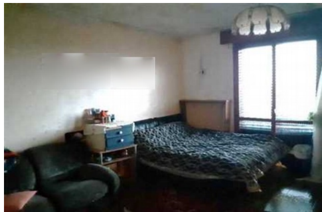
Vista del soggiorno adibito a camera