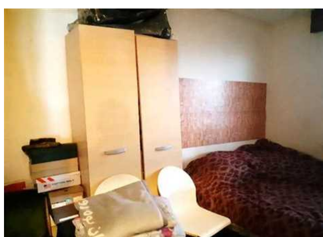
Vista della camera