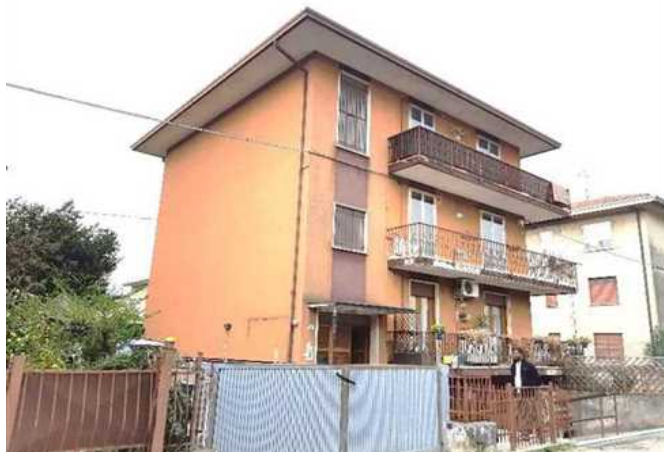
Vista dalla Via Tagliamento