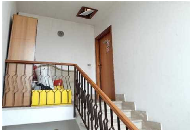
Vista del vano scala comune e della porta di ingresso all'abitazione