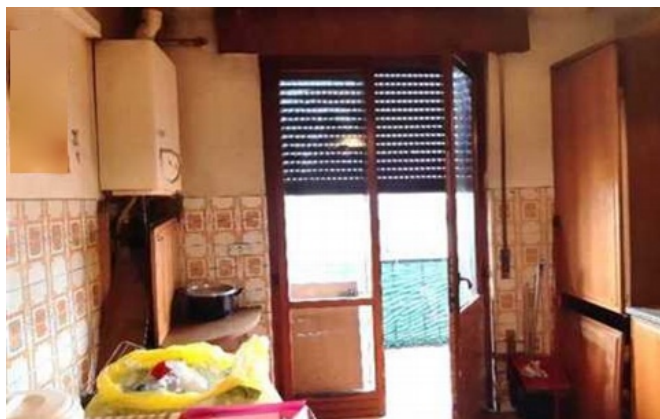
Vista della cucina