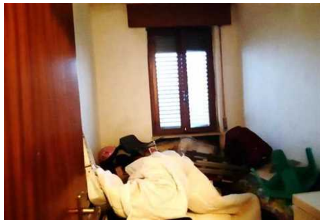
Vista della camera