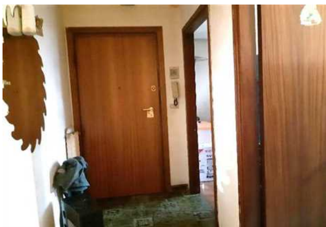
Vista del corridoio di ingresso all'abitazione