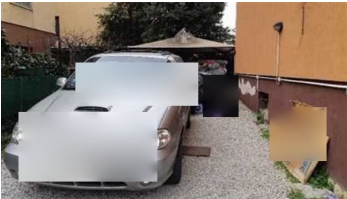
Vista della corte di cui alla pc. 150 sub 10.