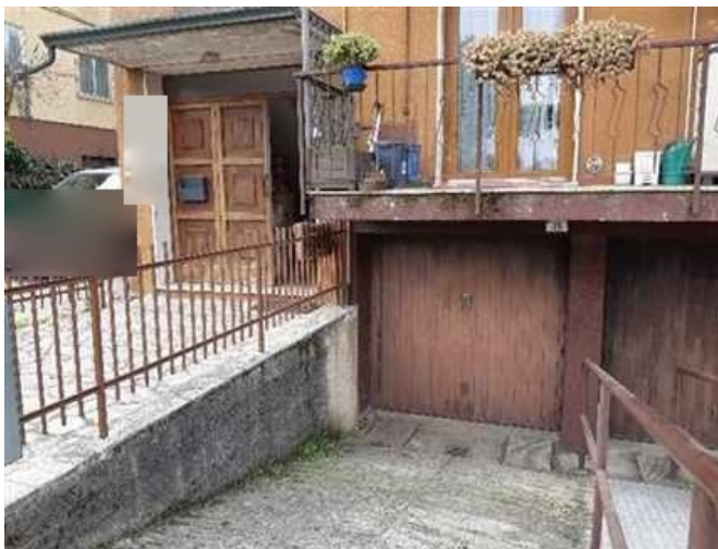
Vista della rampa di accesso all'autorimessa sotto strada