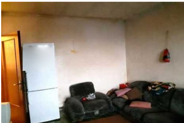
Vista del soggiorno adibito a camera

Proc. n. 547/2021 RGE – 318/2023 RGE Giudice Dr.ssa Maria Antonietta ROSATO Custode IVG VI Perito Arch. Marco VIANELLO