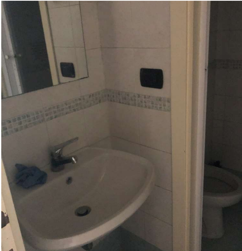
Bagno con antibagno