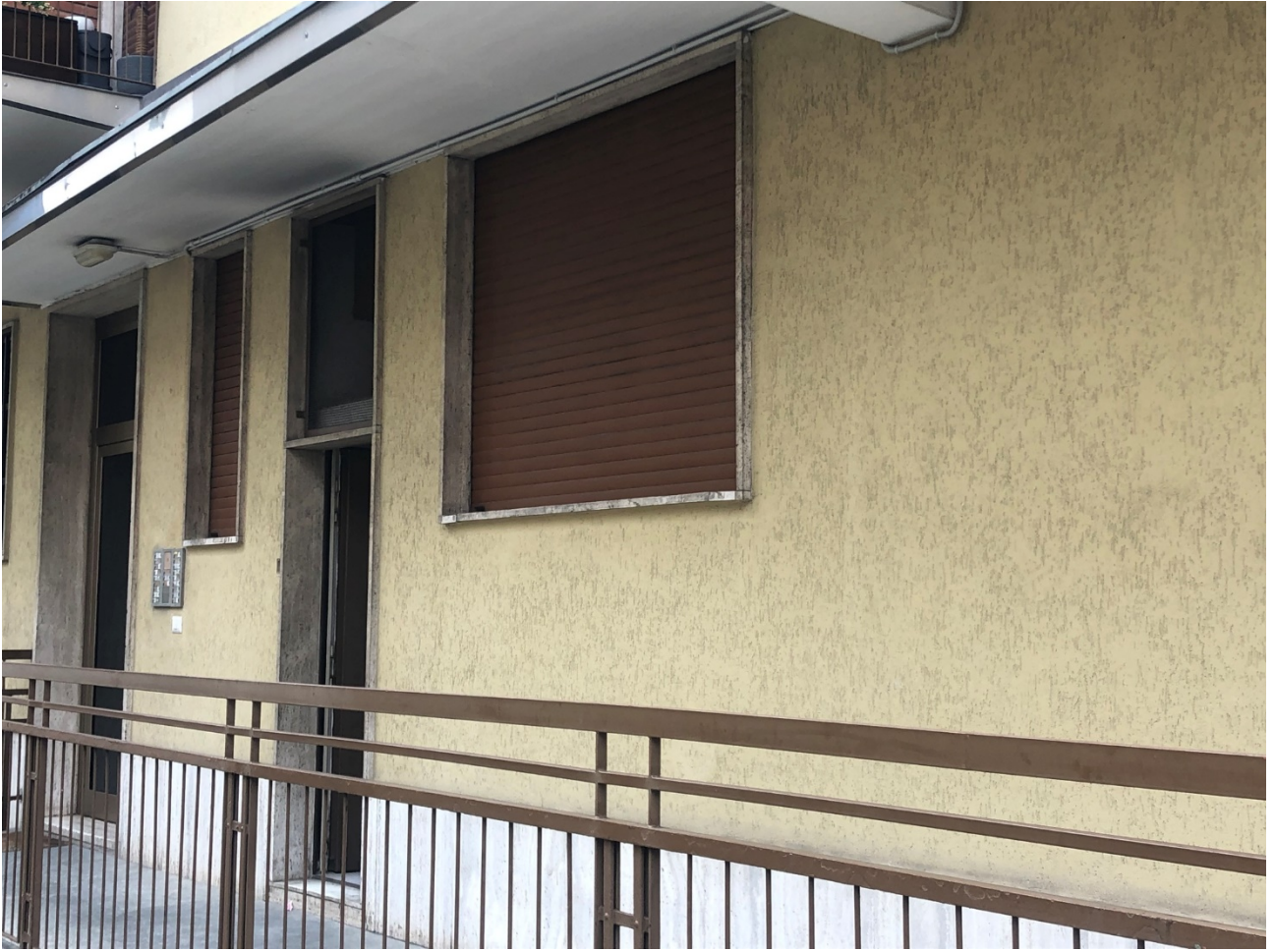
Porta di servizio immobile