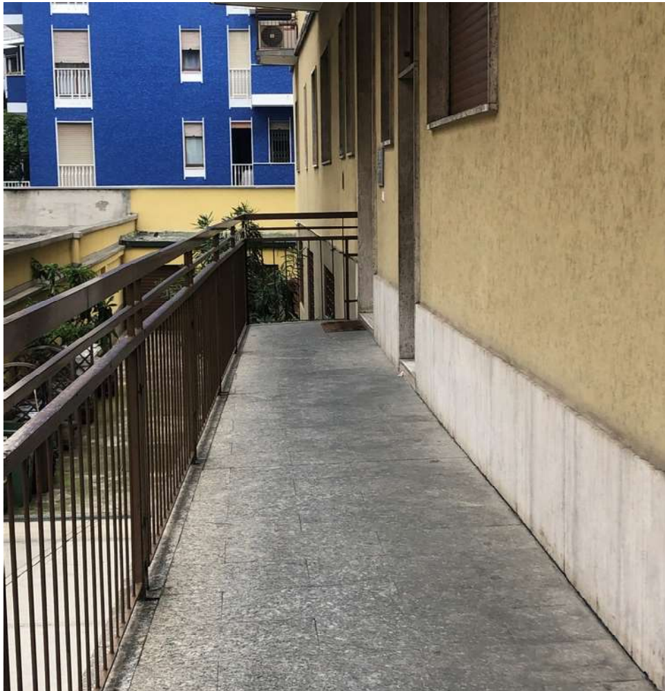
Camminamento/ballatoio verso porta condominio e porta di servizio immobile