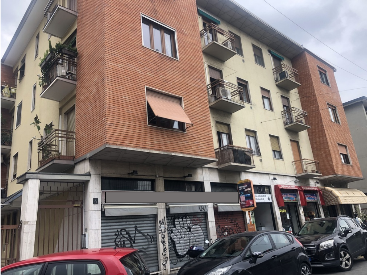
Edificio Via Albertinelli 4