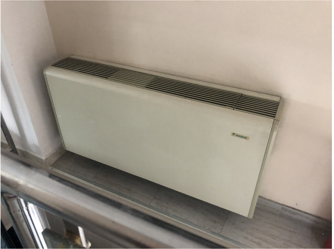
Dettaglio fancoil riscaldamento