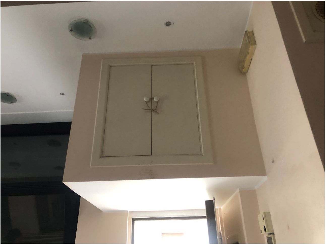
Controsoffitto porta servizio contenente macchinari impianto condizionamento