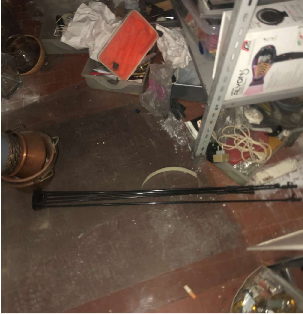
Dettaglio scantinato pavimento in gres