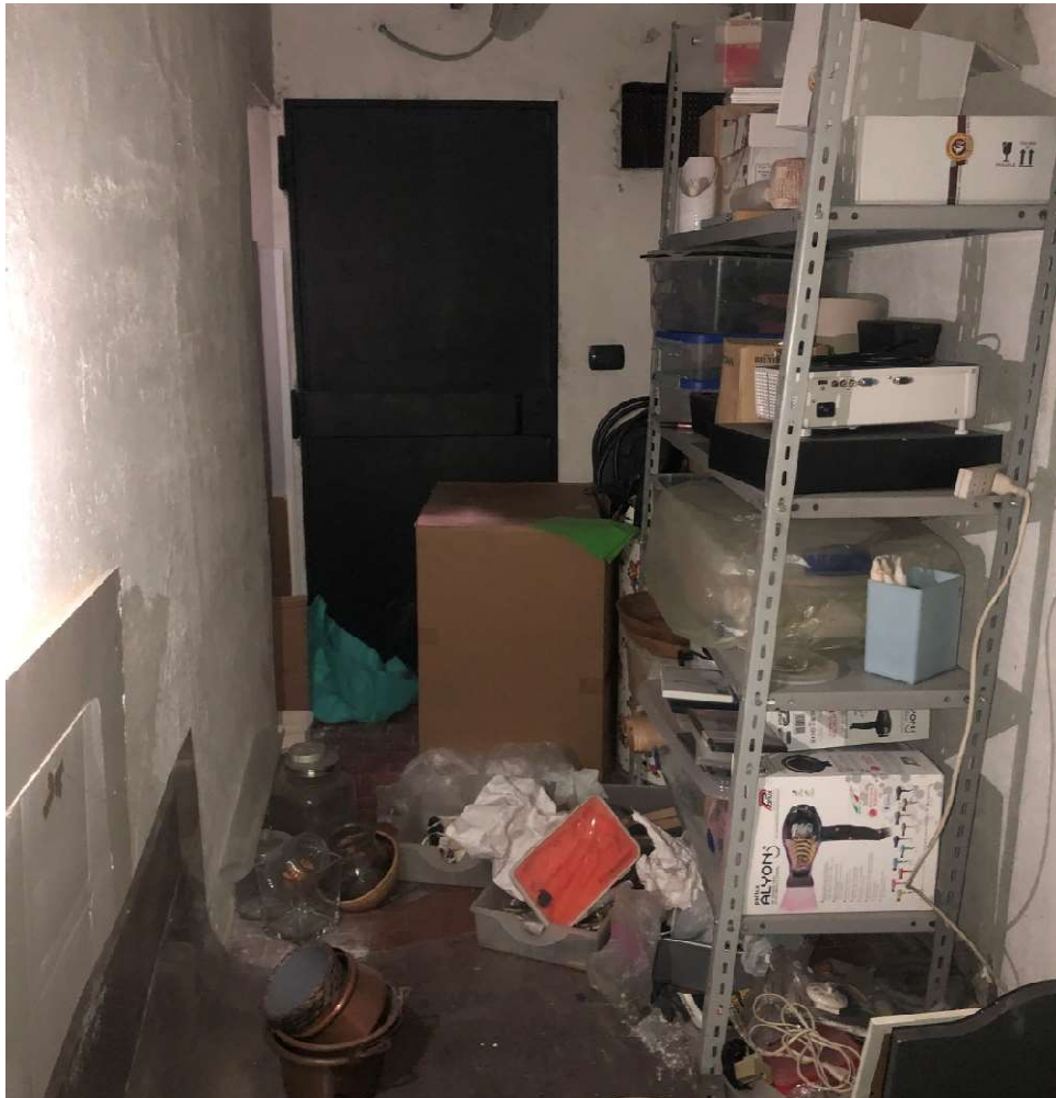
Scantinato (con porta da zona cantine condominiali)