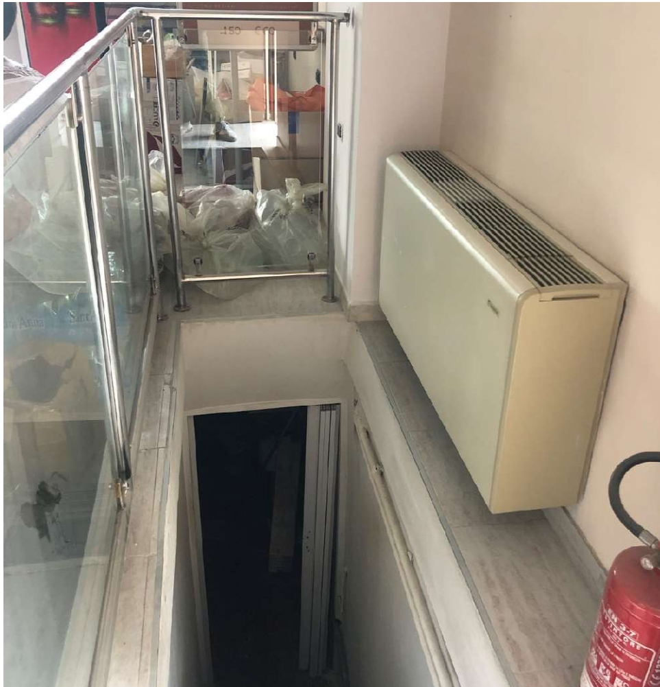
Dettaglio scala collegamento con scantinati