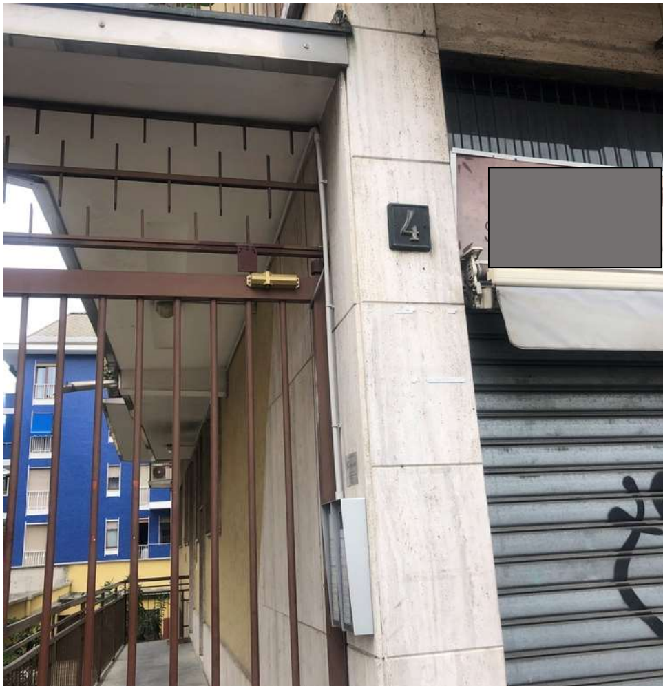
Cancelletto verso porta condominio