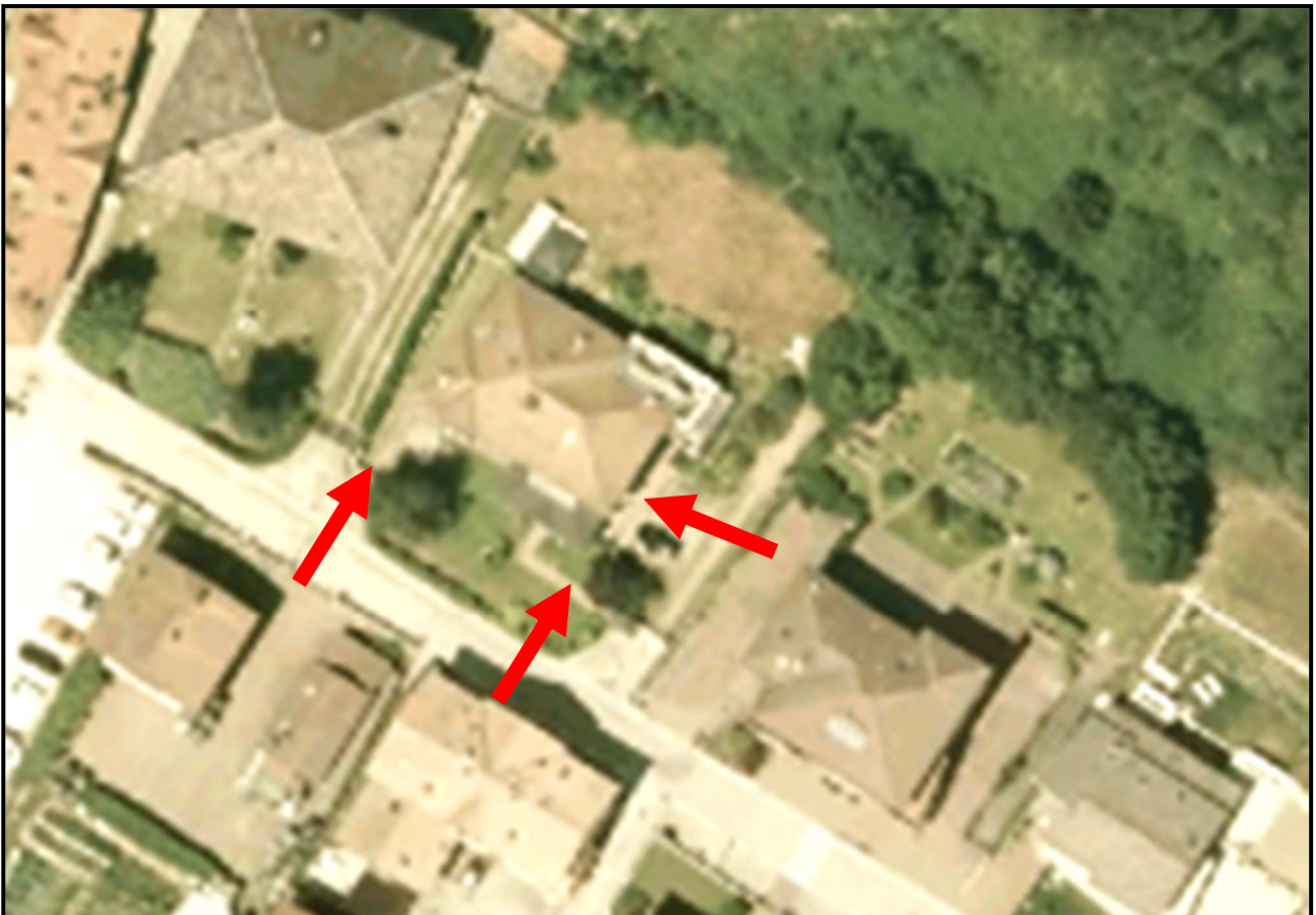
PLANIMETRIA GIS PAT TRENTO – VISTA PERCORSI ACCESSO SU PP.ED. 244 E 361

Dall'analisi della situazione dei luoghi, dove si vede chiaramente la presenza sulle pp.ed. 244 e 361 c.c. Madrano, di percorsi di accesso all'immobile p.ed. 291 p.m.4, pedonali e carrabili pavimentati e definiti negli ingombri e dalla documentazione prodotta dall'avvocato ***** , sembra che ad oggi di fatto si acceda liberamente al bene pignorato.