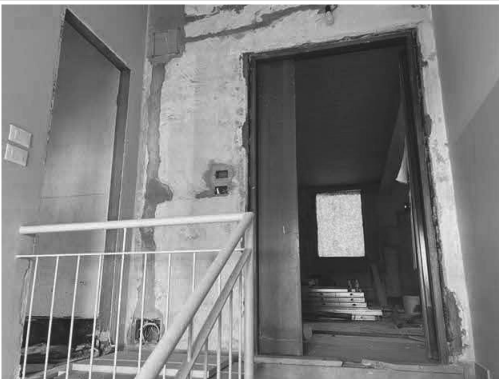
Porta d'ingresso all'appartamento