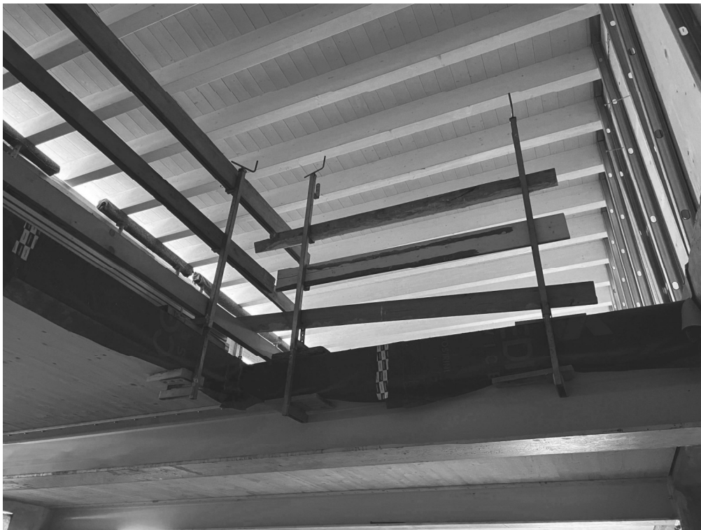
Vista sulla zona giorno dal piano terzo