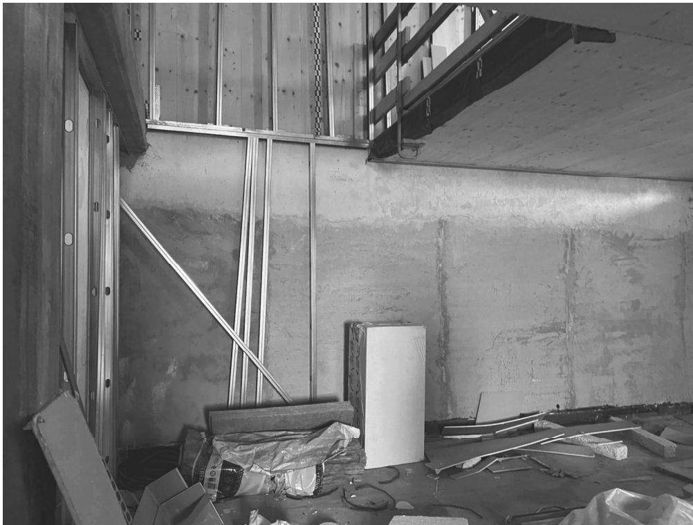
Spazio per le scale interne di collegamento tra i piani