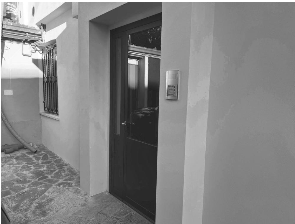
Porta ingresso alla scala comune sub. 10