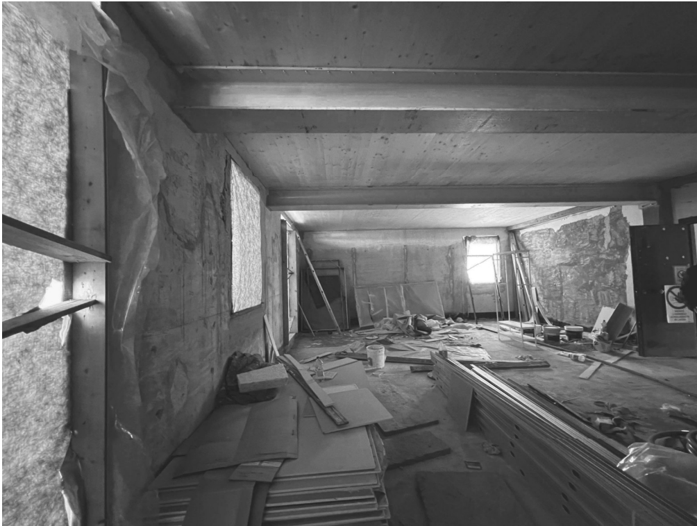
Piano terzo (zona notte)

L'ultimo piano al momento risulta inaccessibile poiché mancano le scale di collegamento tra i piani. Per questo non vi sono foto del quarto piano.