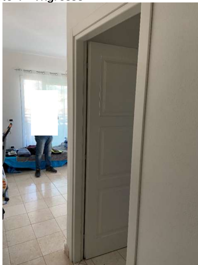
Foto 2 - Ingresso