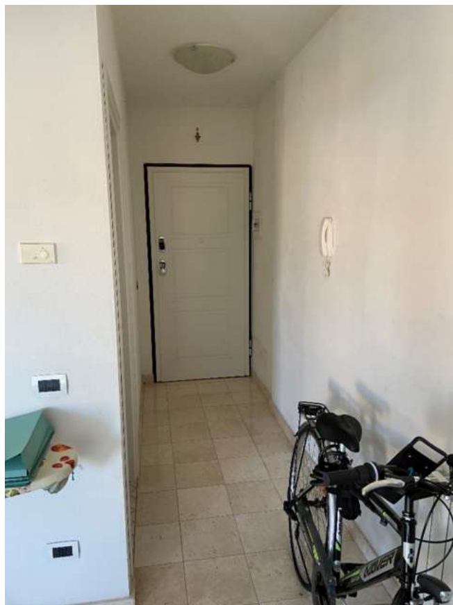
Foto 1 - Ingresso