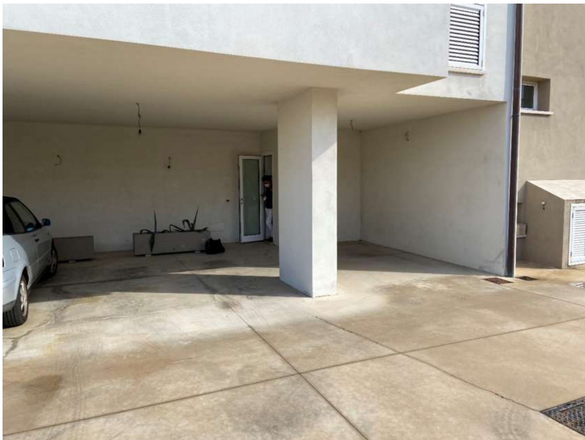
Foto 15 - Posto auto