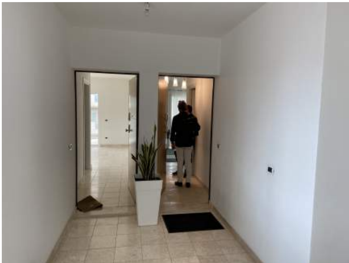
Foto 1 - Ingresso