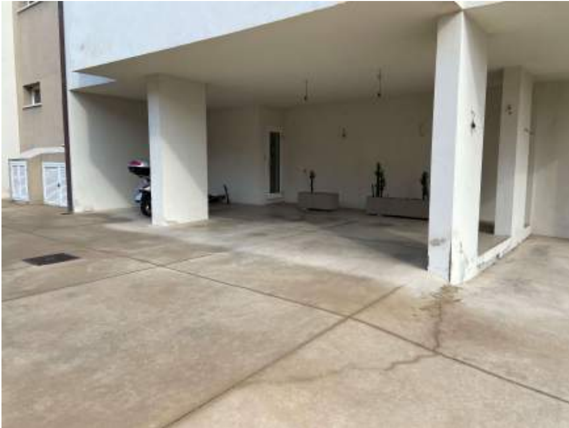
Foto 19 - Posto auto