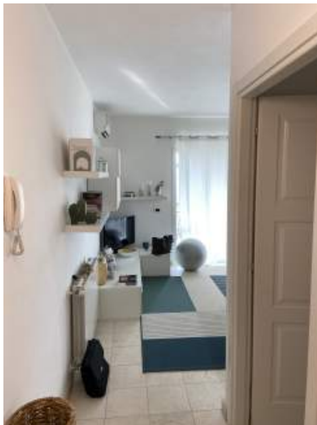
Foto 3 - Soggiorno