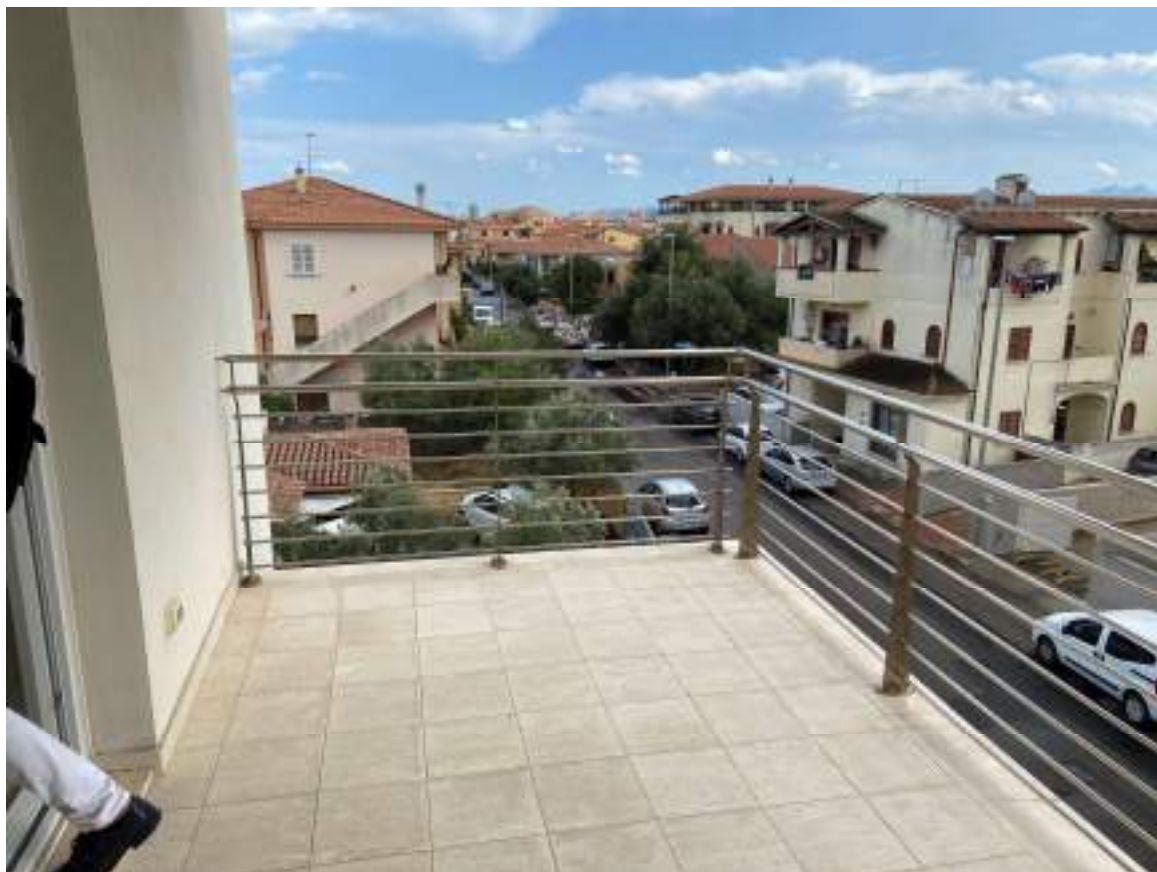
Foto 10 - Esterno