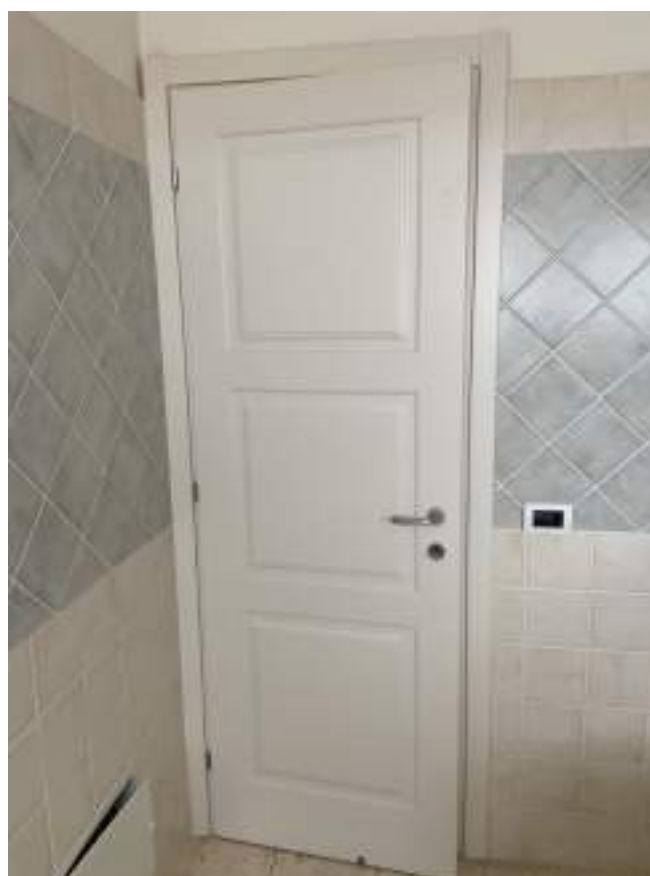
Foto 9 - Bagno