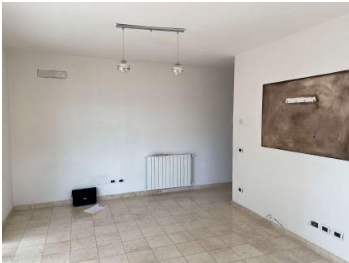
Foto 5 - Soggiorno Cucina