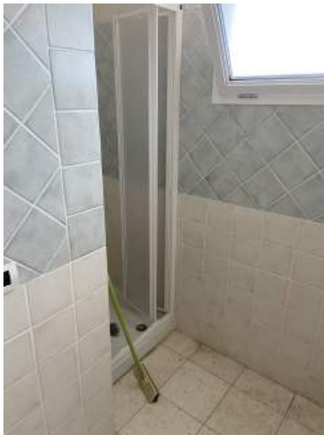
Foto 8 - Bagno