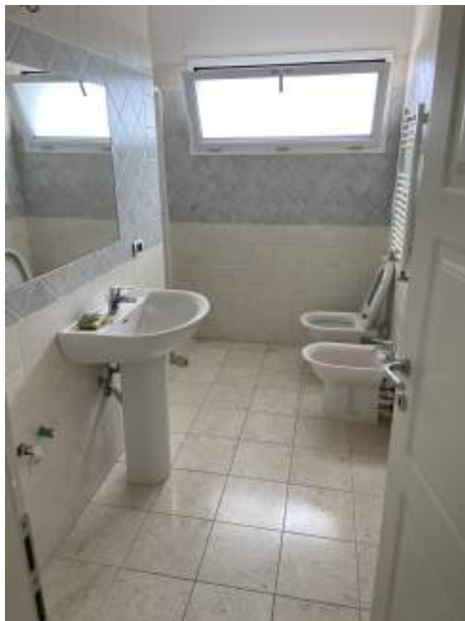
Foto 6 - Bagno