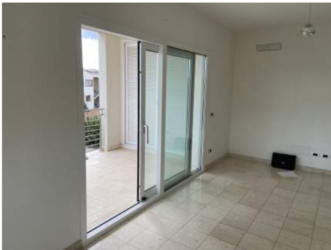
Foto 4 - Soggiorno Cucina