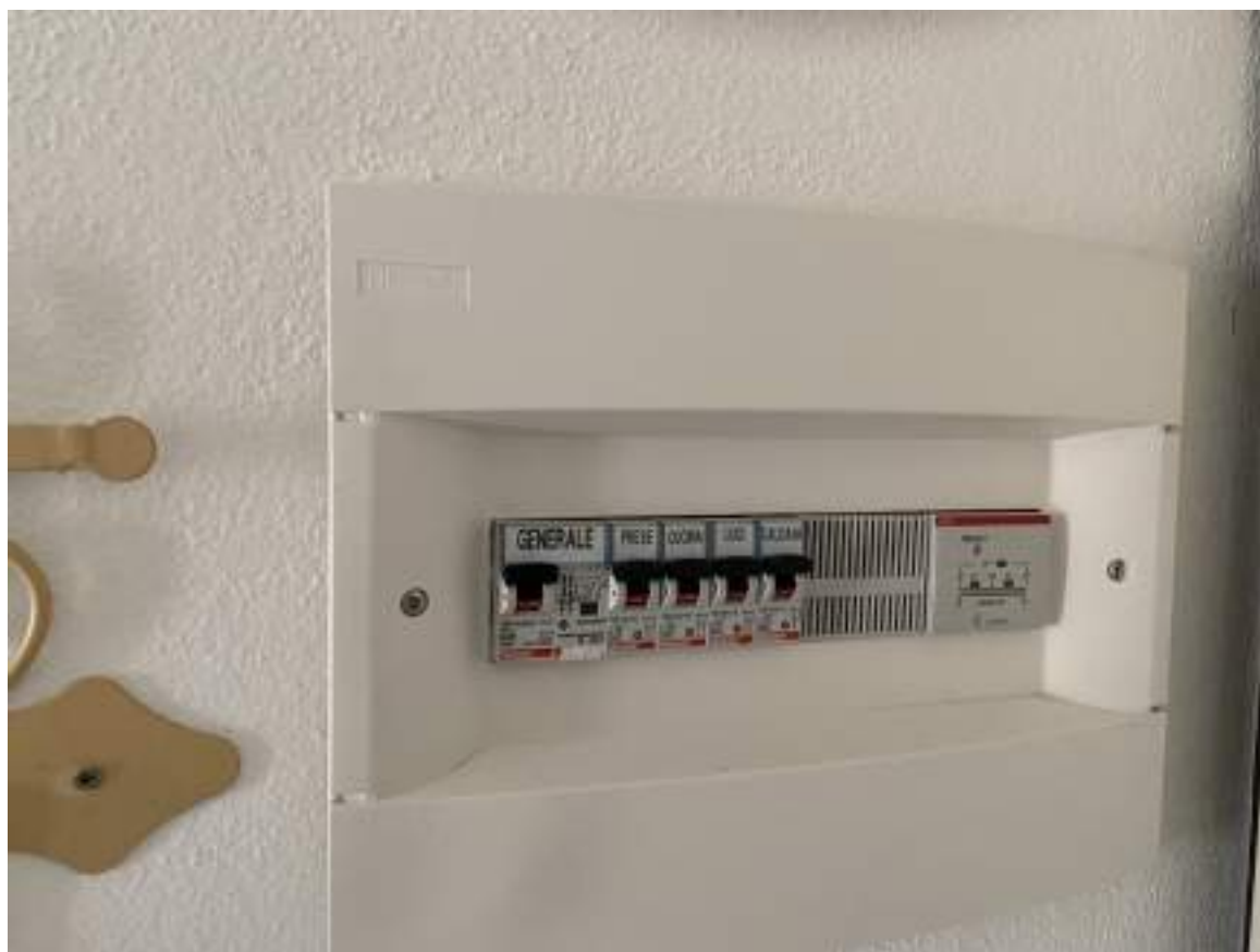
Foto 11 - Particolare impianti