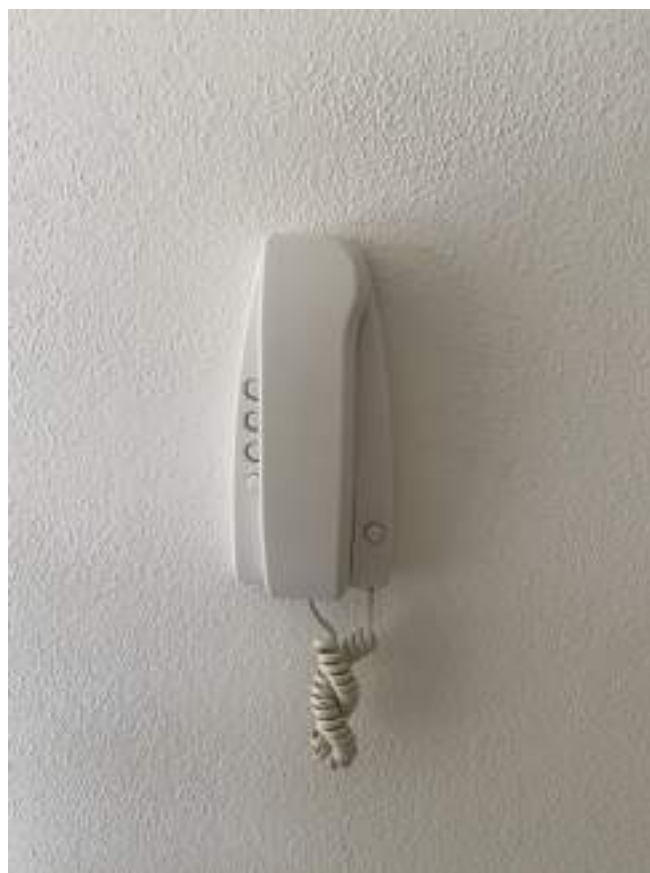
Foto 13 - Particolare impianti