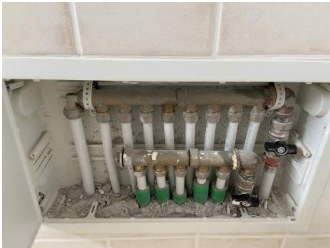
Foto 14 - Particolare impianti