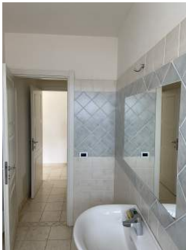
Foto 7 - Bagno