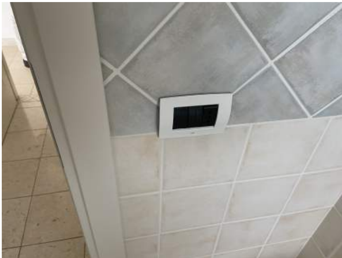
Foto 12 - Particolare impianti