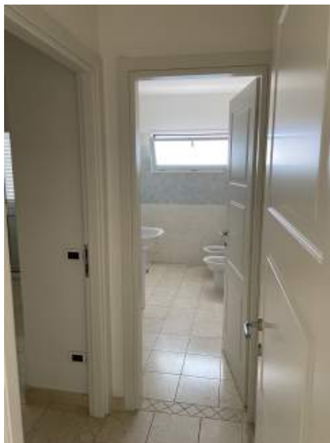
Foto 5 - Disimpegno