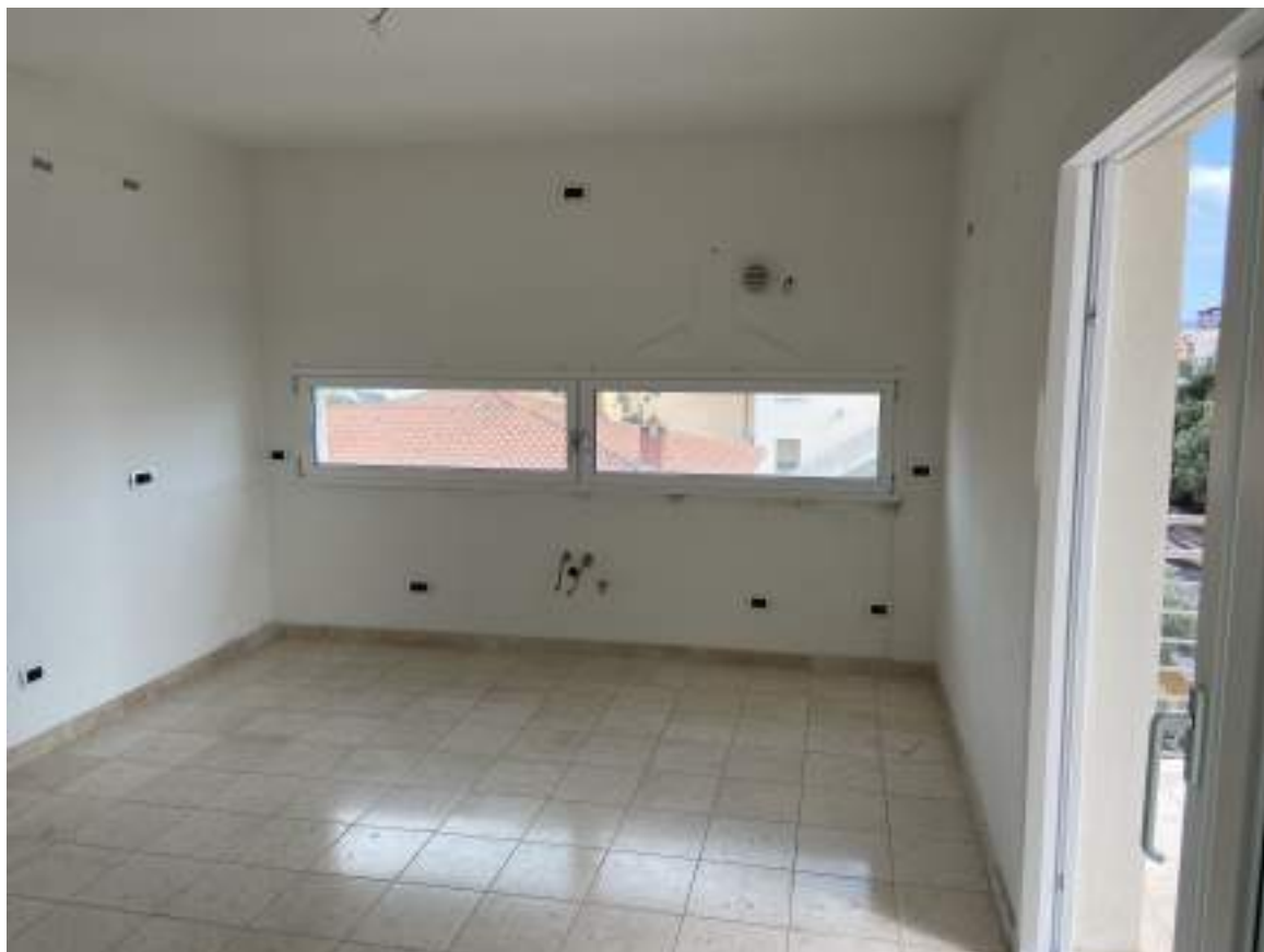
Foto 3 - Soggiorno Cucina