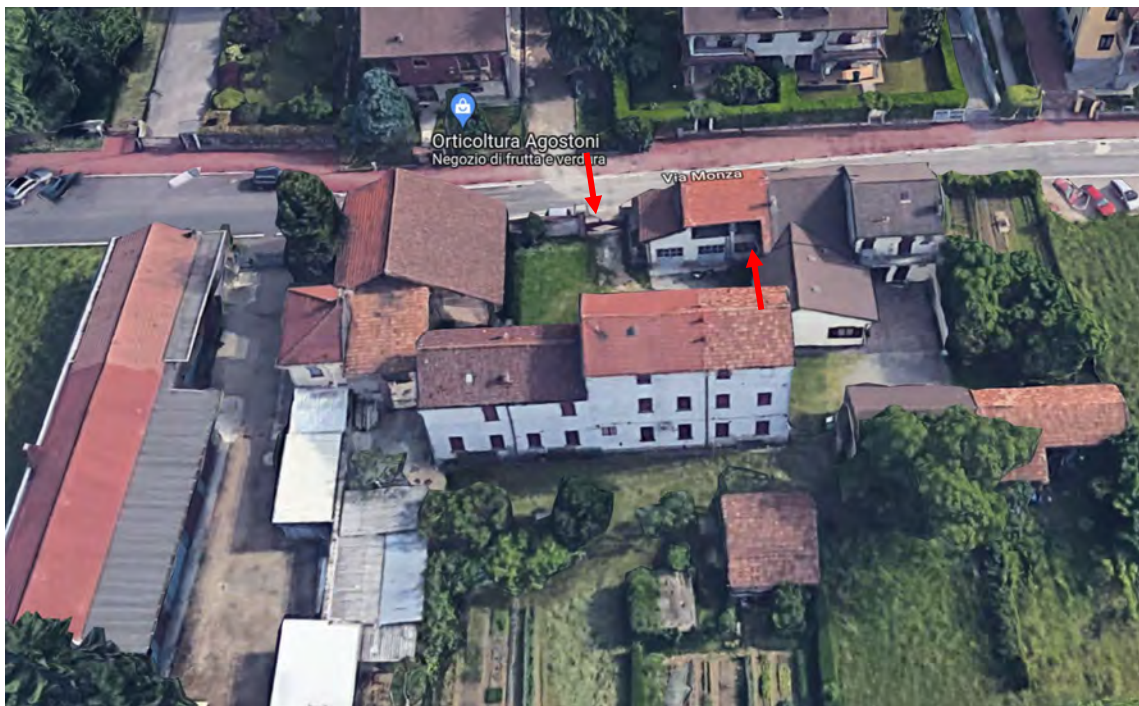
Inquadramento territoriale - vista aerea e individuazione accesso alla corte e fabbricato