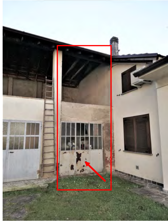
Accesso carrabile alla corte civico 136 e deposito con sovrastante fienile