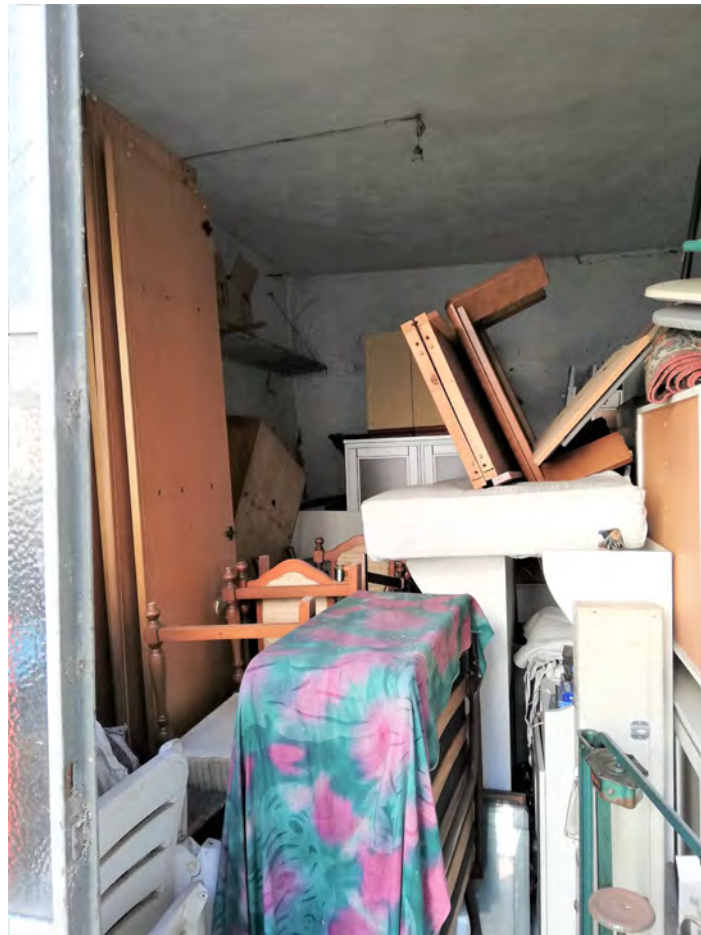
Interno deposito e accesso