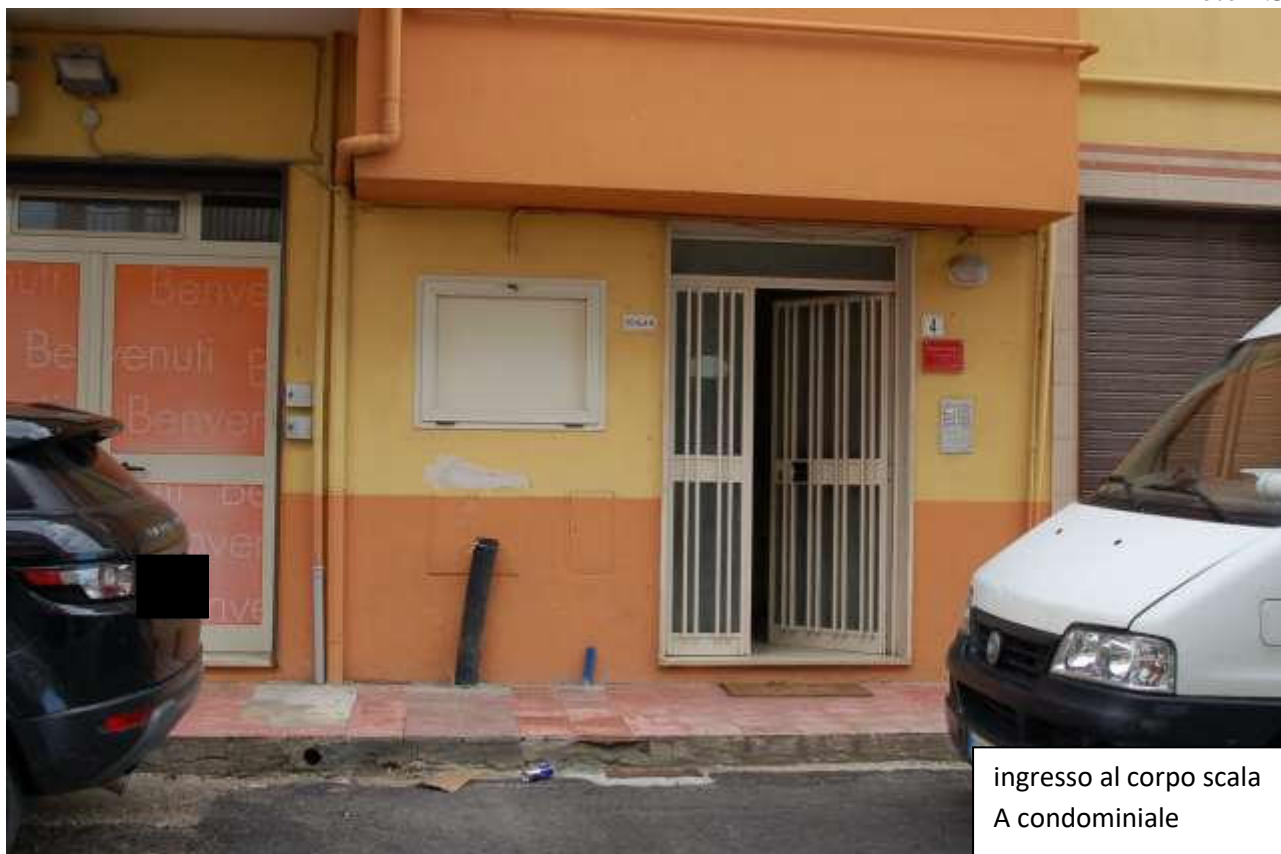
ingresso al corpo scala A condominiale