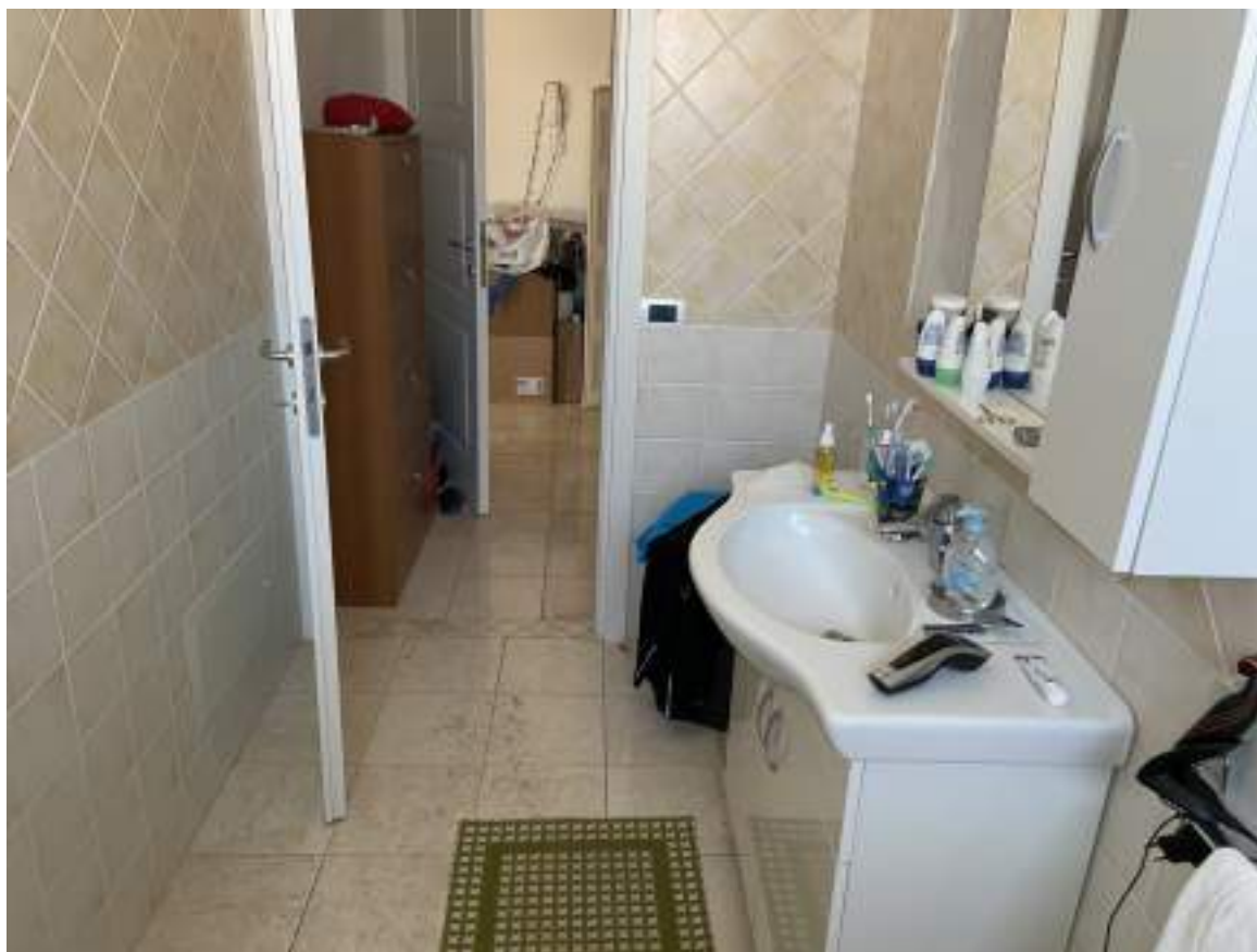
Foto 6 - Bagno