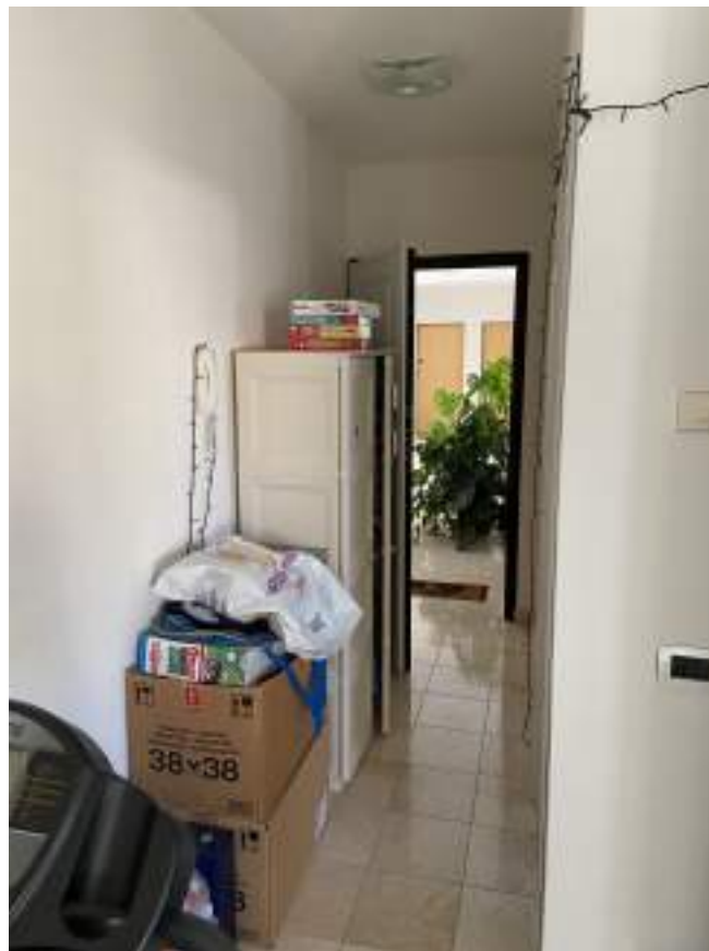
Foto 1 - Ingresso