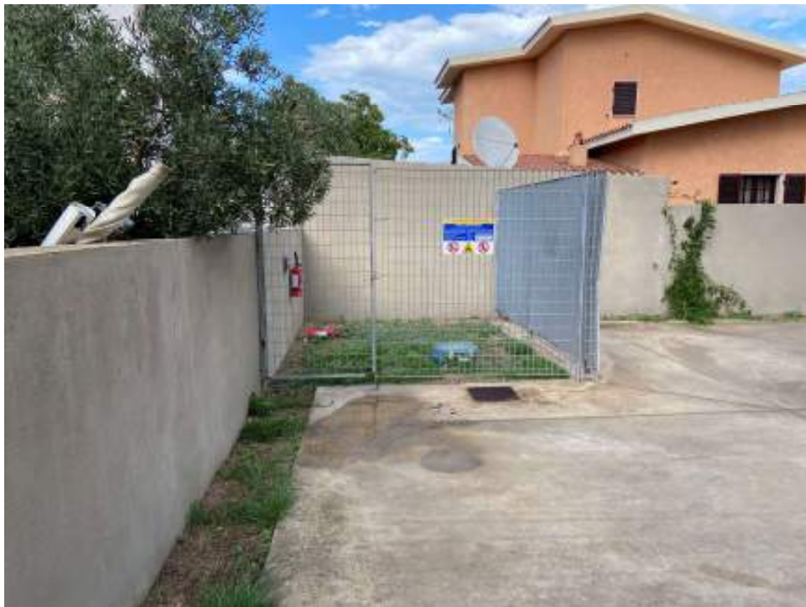
Foto 13 - Posto Auto