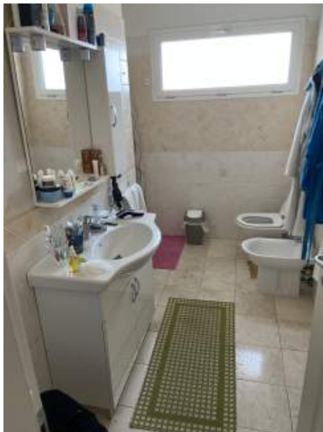
Foto 5 - Bagno