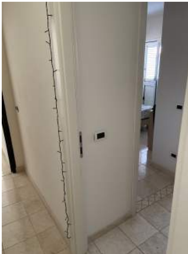
Foto 3 - Disimpegno