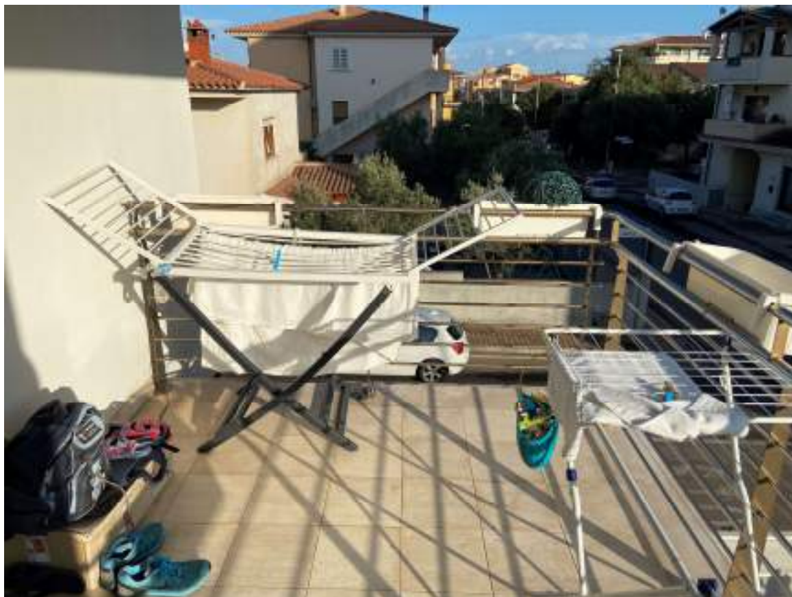
Foto 11 - Esterno