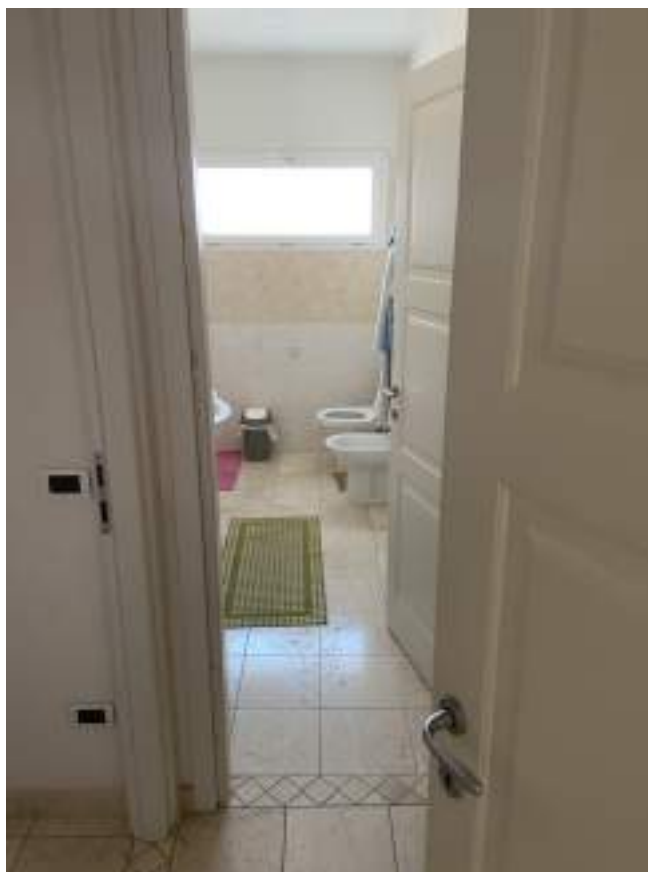
Foto 4 - Disimpegno