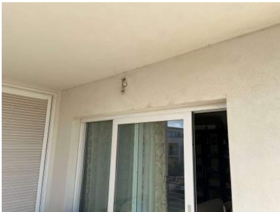
Foto 12 - Esterno