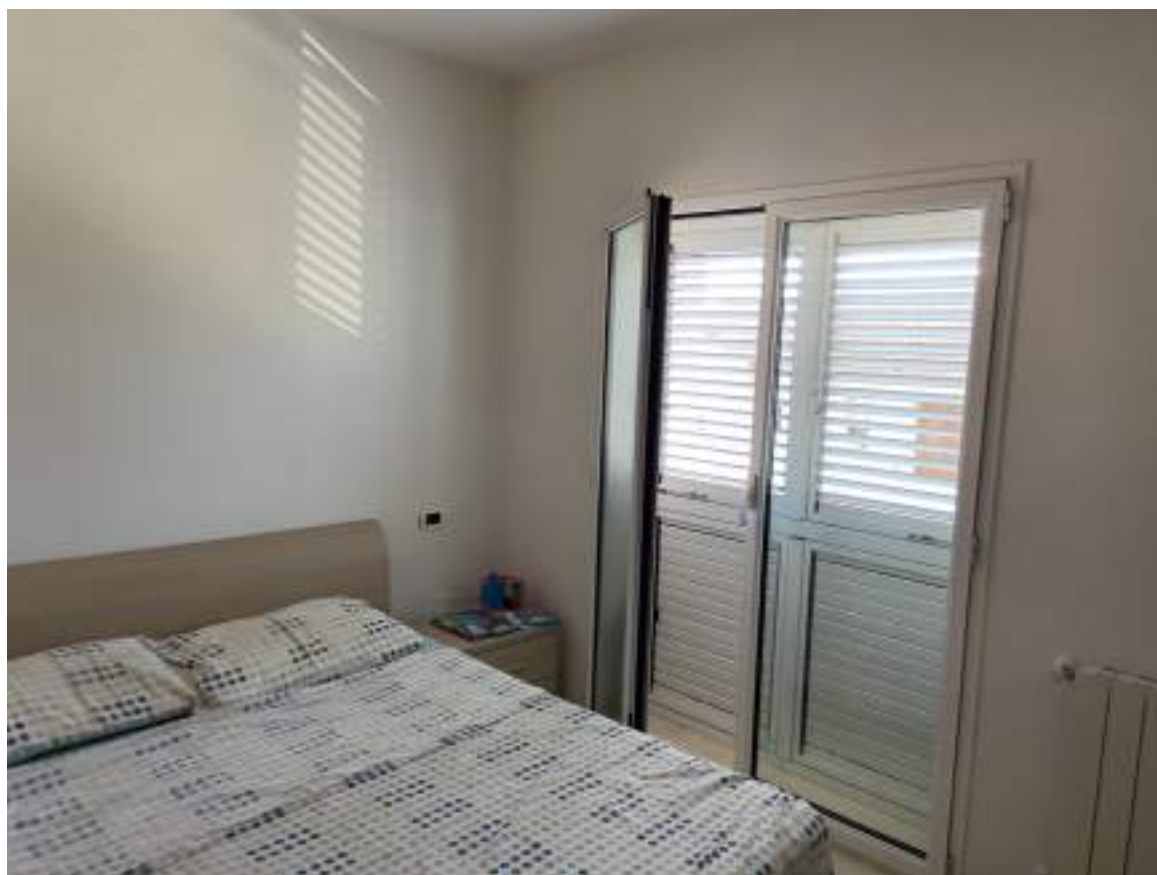
Foto 8 - Camera da letto