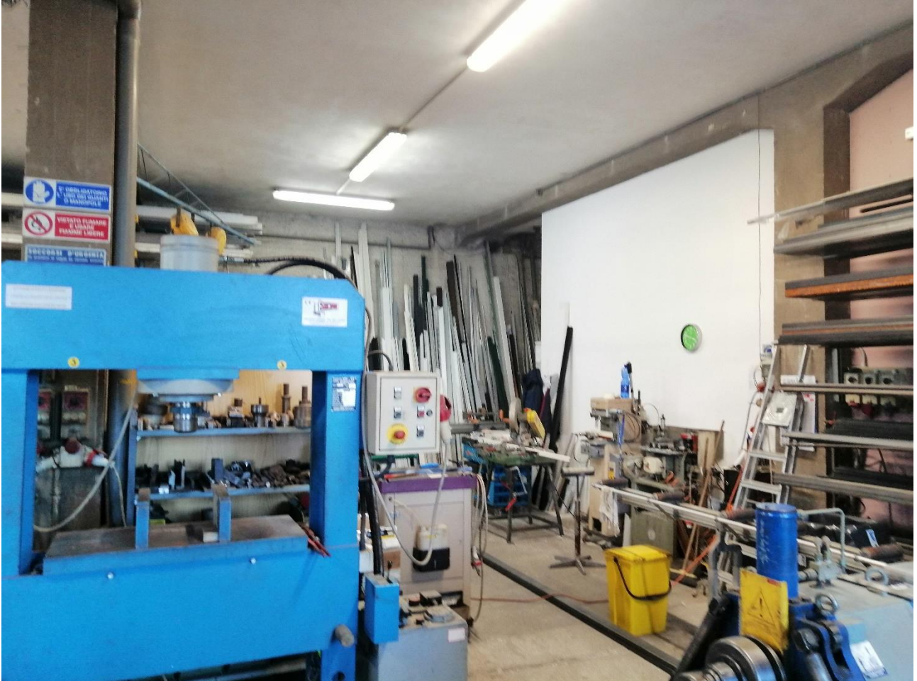
Foto n. 15 interno del locale artigianale con visione della parziale chiusura abusiva di parte del locale artigianale (distinto al Catasto fabbricati al foglio 88 particella 41 sub 8) utilizzata dalla proprietà adiacente, tramite ingresso interno dal locale adiacente