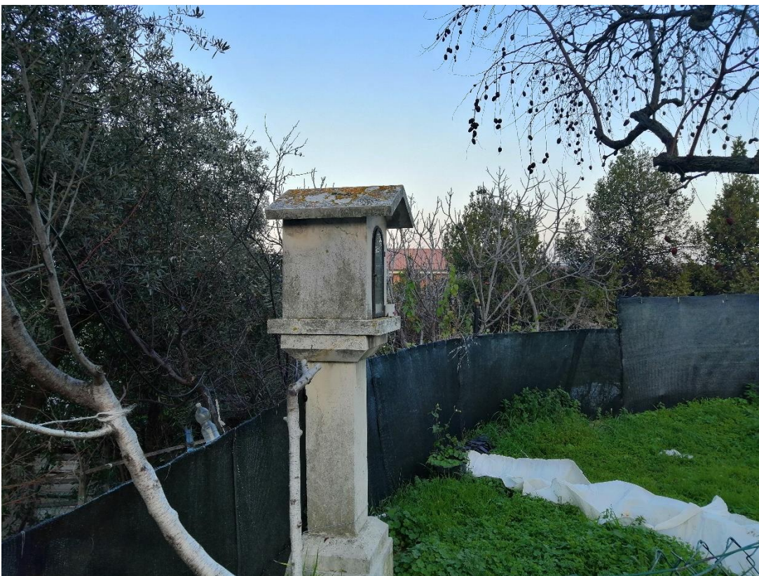
Foto n.4 veduta terreno (distinto al Catasto terreni al foglio 109 particella 389) dalla strada