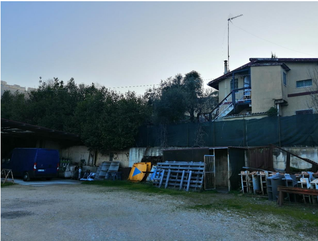
Foto n. 5 veduta del terreno (distinto al Catasto terreni al foglio 109 particella 389) da quota sottostante area di proprietà confinante