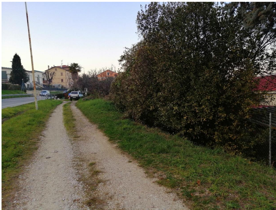
Foto n.1 strada d'accesso al terreno (distinto al Catasto terreni al foglio 109 particella 389)