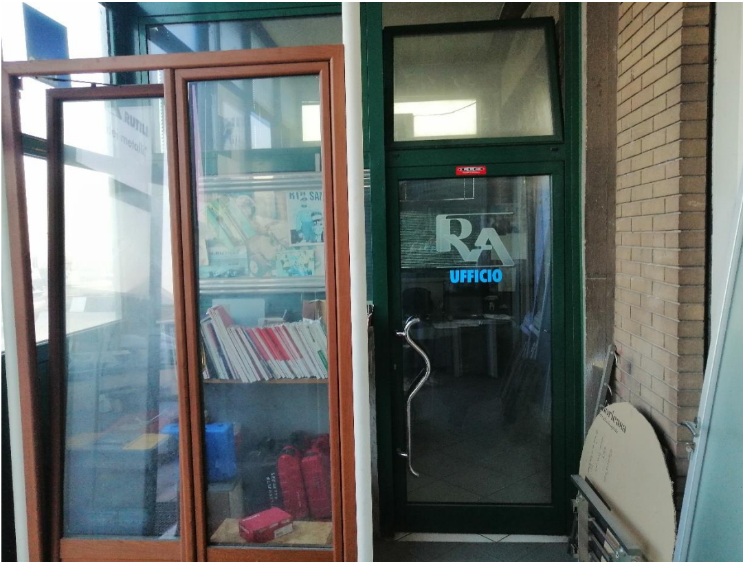
Foto n. 11 porta d'ingresso interna del locale artigianale (distinto al Catasto fabbricati al foglio 88 particella 41 sub 8)