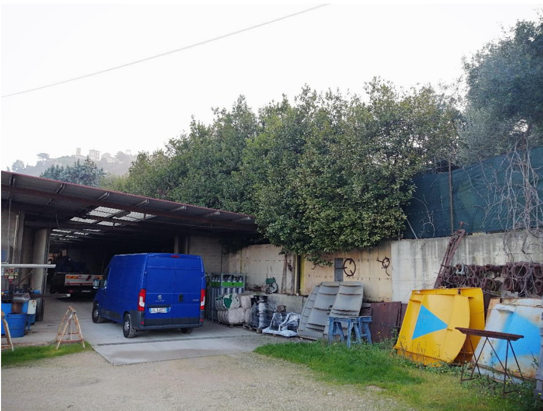
Foto n. 6 veduta del terreno (distinto al Catasto terreni al foglio 109 particella 389) da quota sottostante area di proprietà confinante