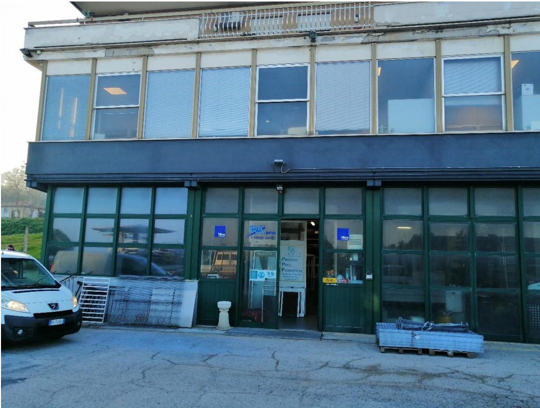
Foto n. 9 prospetto d'ingresso del locale artigianale (distinto al Catasto fabbricati al foglio 88 particella 41 sub 8)