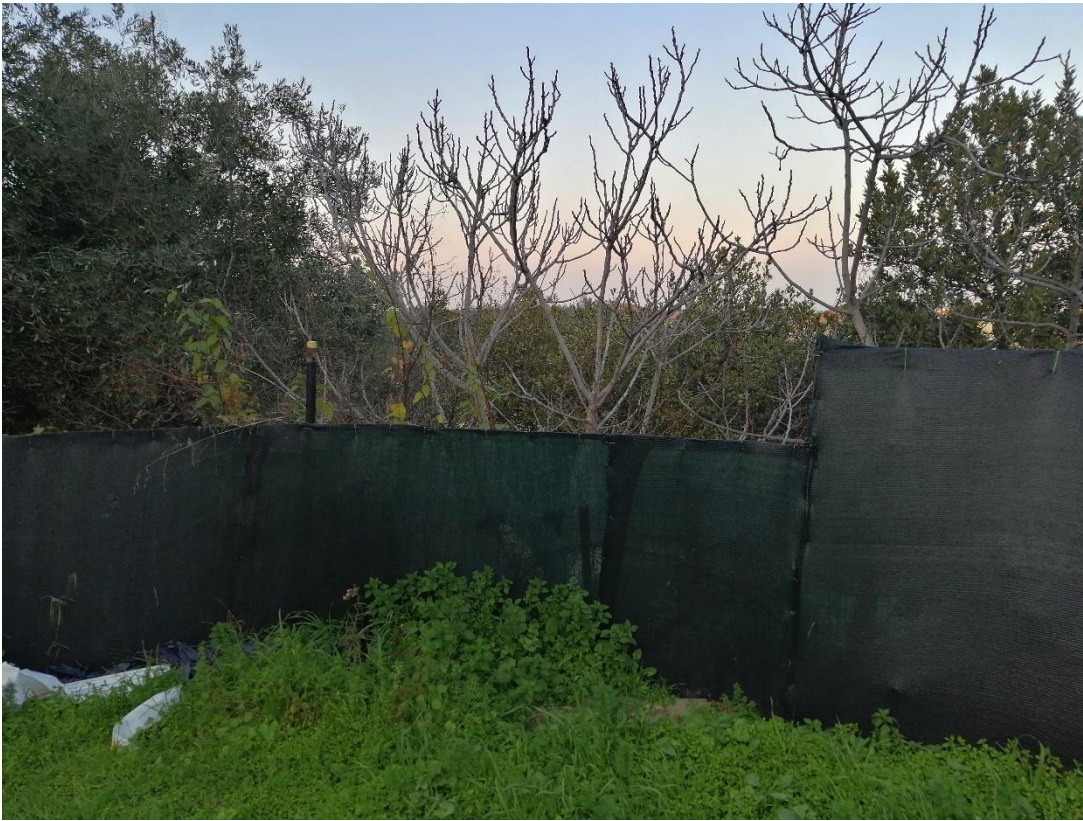
Foto n.3 veduta terreno (distinto al Catasto terreni al foglio 109 particella 389) dalla strada