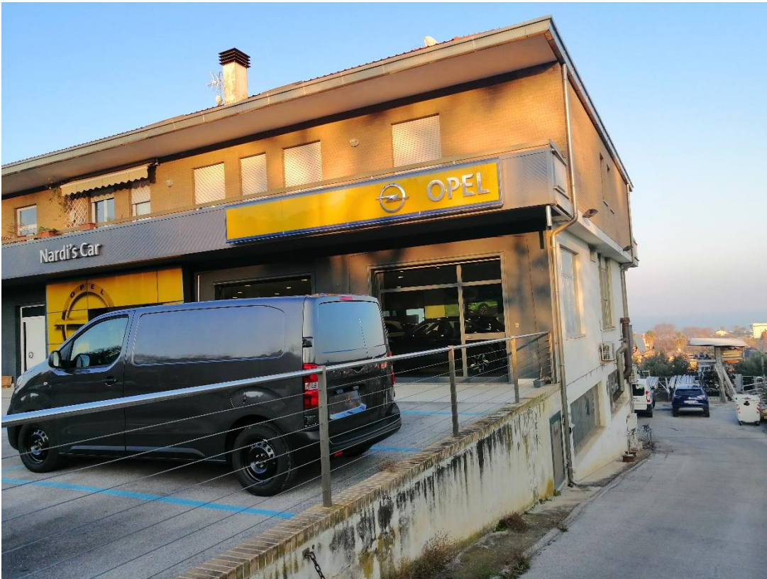
Foto n. 7 scivolo d'accesso al laboratorio artigianale (distinto al Catasto fabbricati al foglio 88 particella 41 sub 8) da quota strada statale