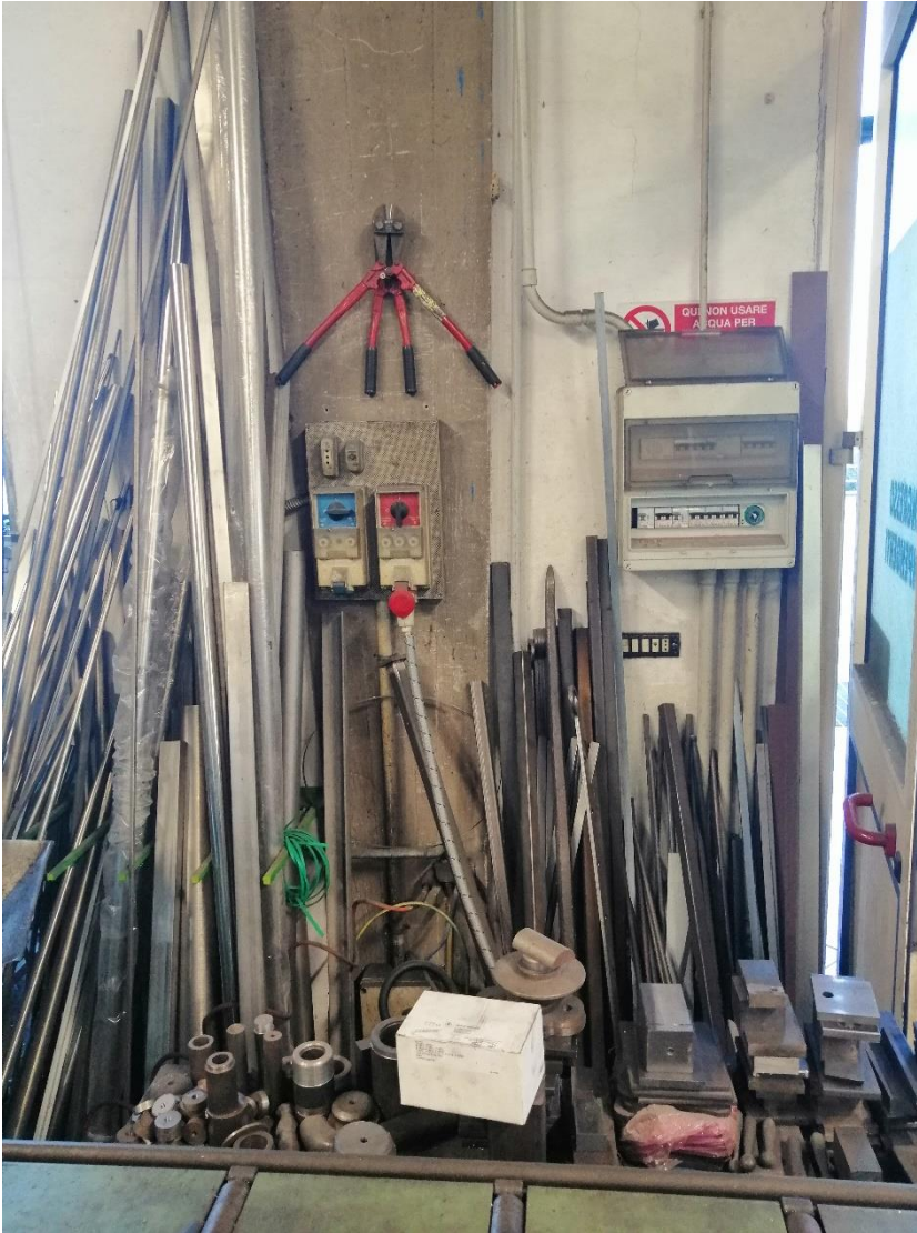
Foto n. 16 quadri elettrici del locale artigianale (distinto al Catasto fabbricati al foglio 88 particella 41 sub 8)