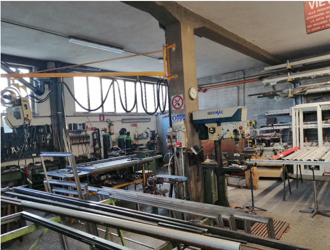
Foto n. 13 interno del locale artigianale (distinto al Catasto fabbricati al foglio 88 particella 41 sub 8)