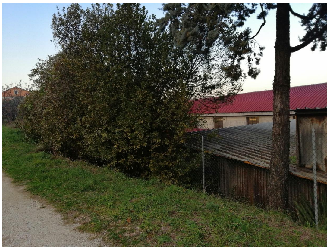
Foto n.2 strada d'accesso al terreno (distinto al Catasto terreni al foglio 109 particella 389)