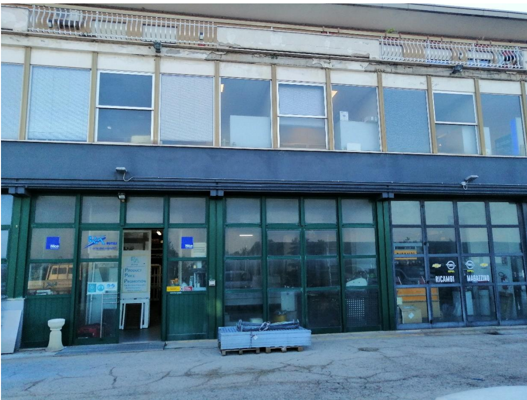
Foto n. 10 porta d'ingresso vetrata esterna del locale artigianale (distinto al Catasto fabbricati al foglio 88 particella 41 sub 8)