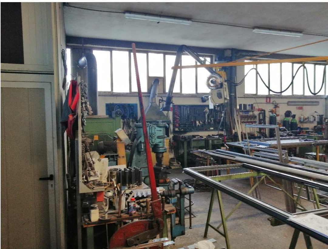
Foto n. 12 interno del locale artigianale (distinto al Catasto fabbricati al foglio 88 particella 41 sub 8)