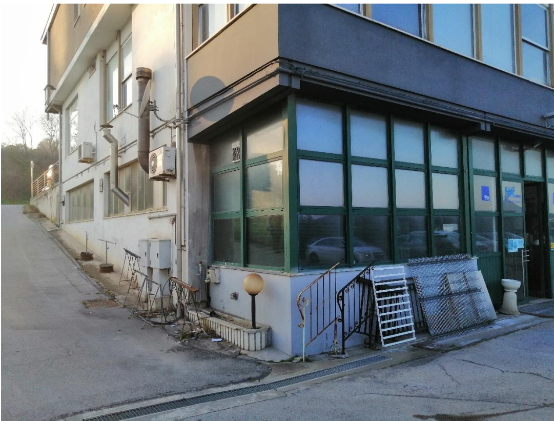
Foto n. 8 scivolo d'accesso al laboratorio artigianale (distinto al Catasto fabbricati al foglio 88 particella 41 sub 8) da quota piazzale ingresso e prospetto d'ingresso del locale artigianale