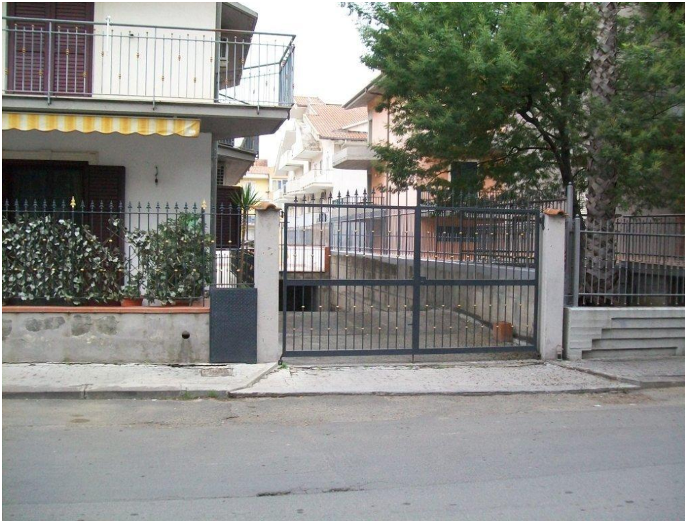
Foto n.1 Vista del cancello di accesso carrabile al piano S1 al civico n. 3/B di via Ruggeri.