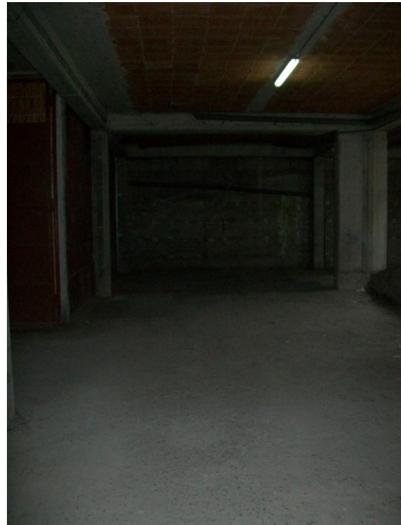
Foto n.2-3 Vista della scivola carrabile di accesso al piano S1 e dello spazio comune di manovra.