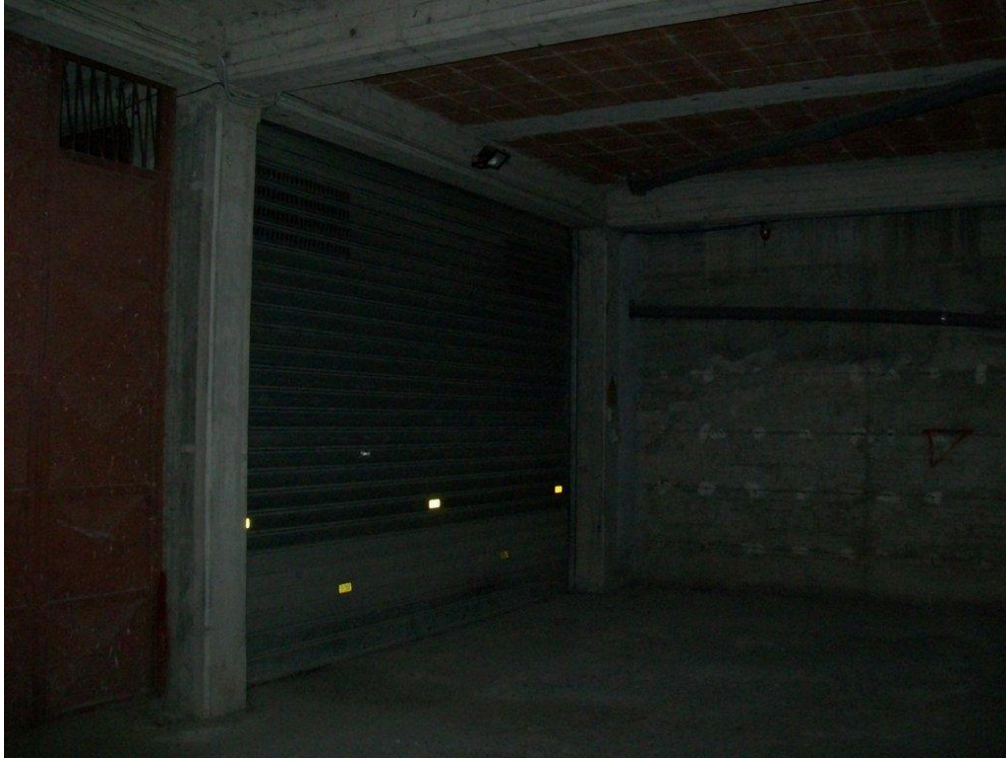
Foto n.4 Vista della saracinesca di ingresso al vano garage.