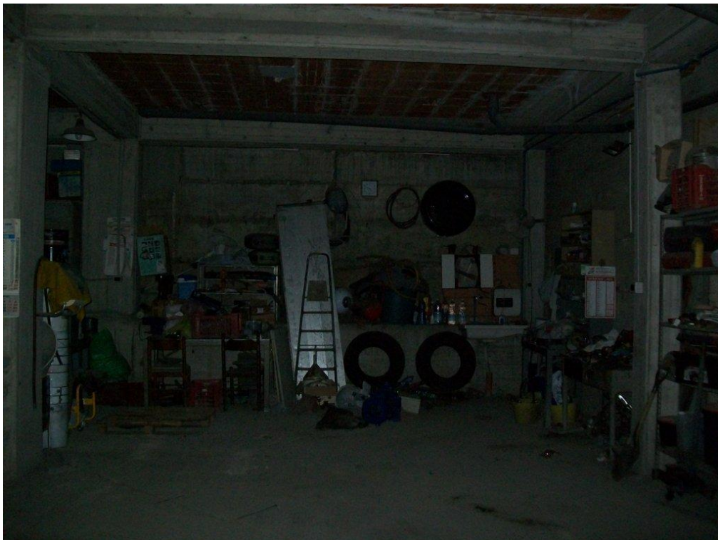
Foto n.5 Vista del vano garage.