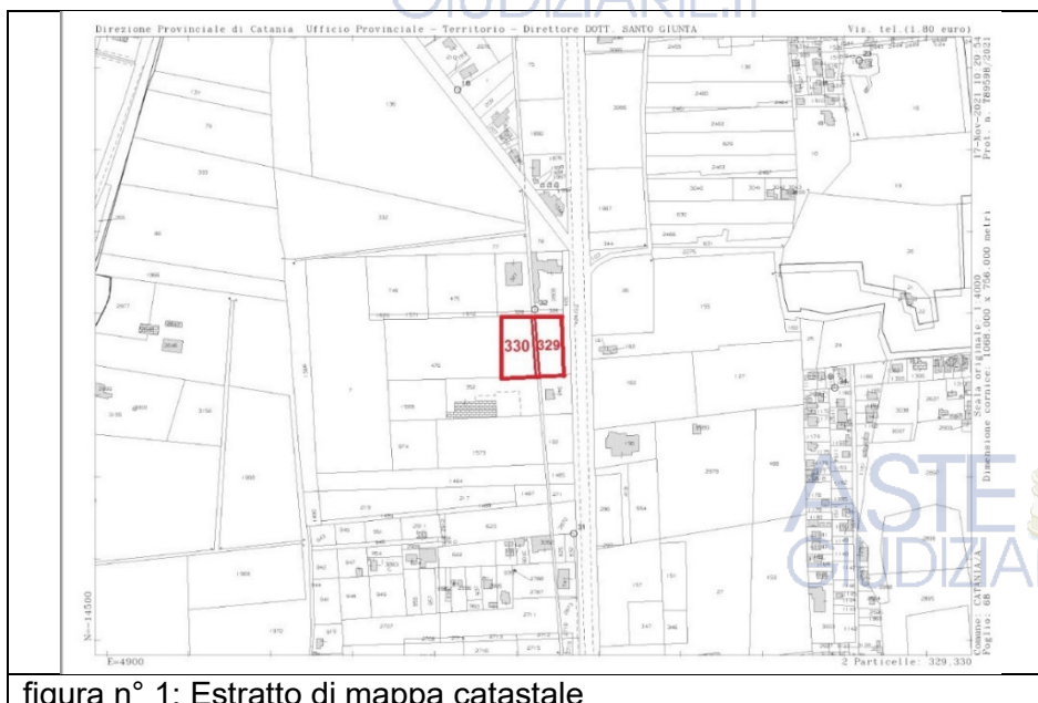
figura n° 1: Estratto di mappa catastale