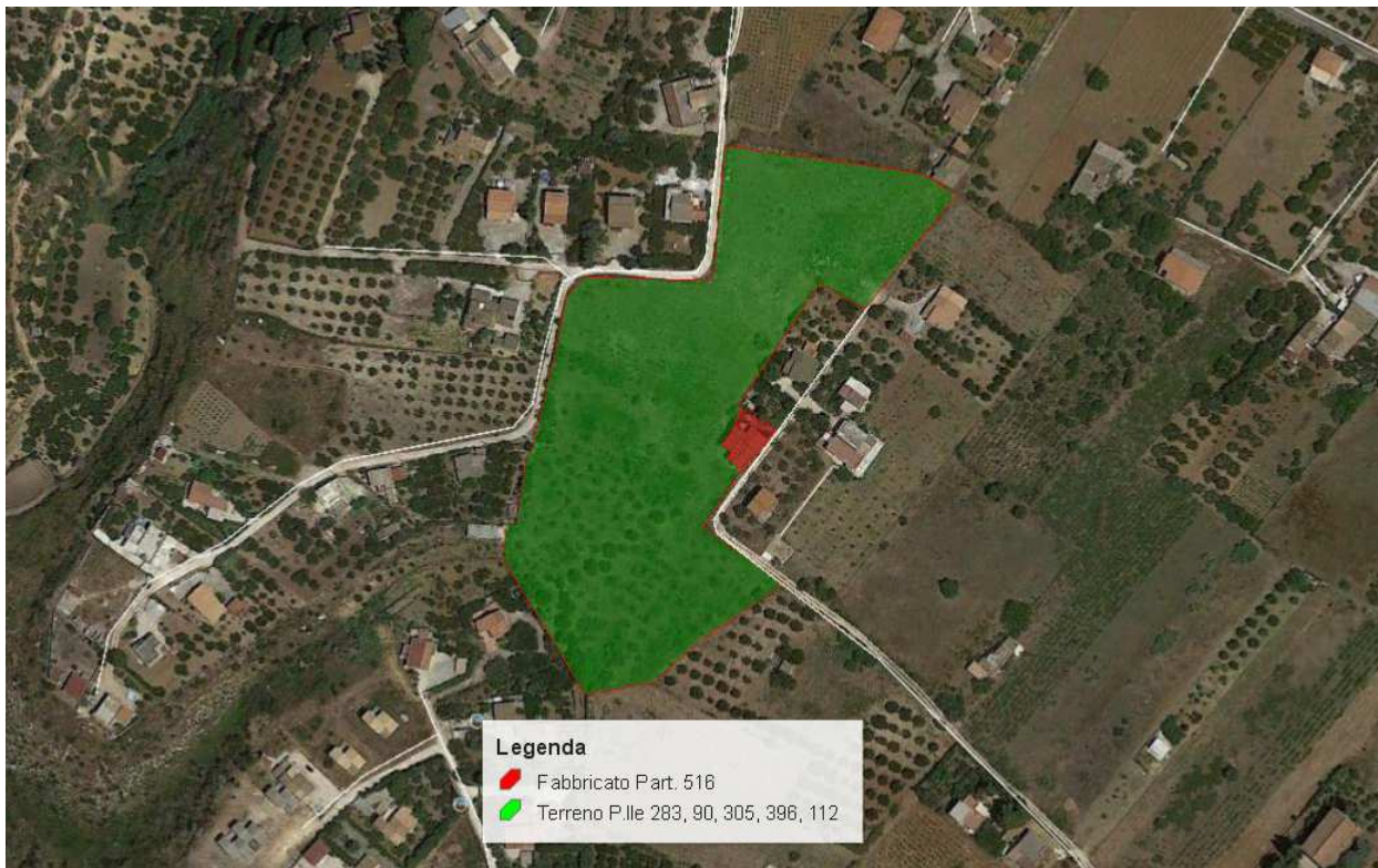
Ubicazione immobile – Vista satellitare della zona (c.da Fragnesi)