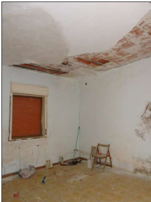
Soggiorno con apertura esterna.