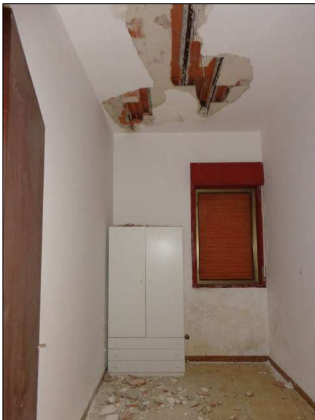
Cameretta nord-ovest con apertura esterna.