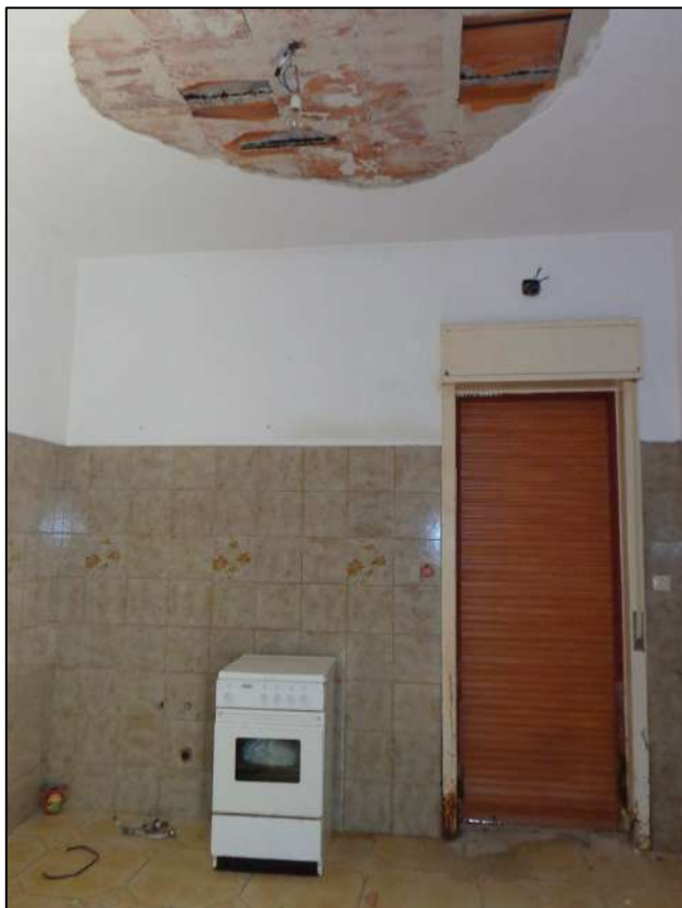
Cucina con apertura esterna.