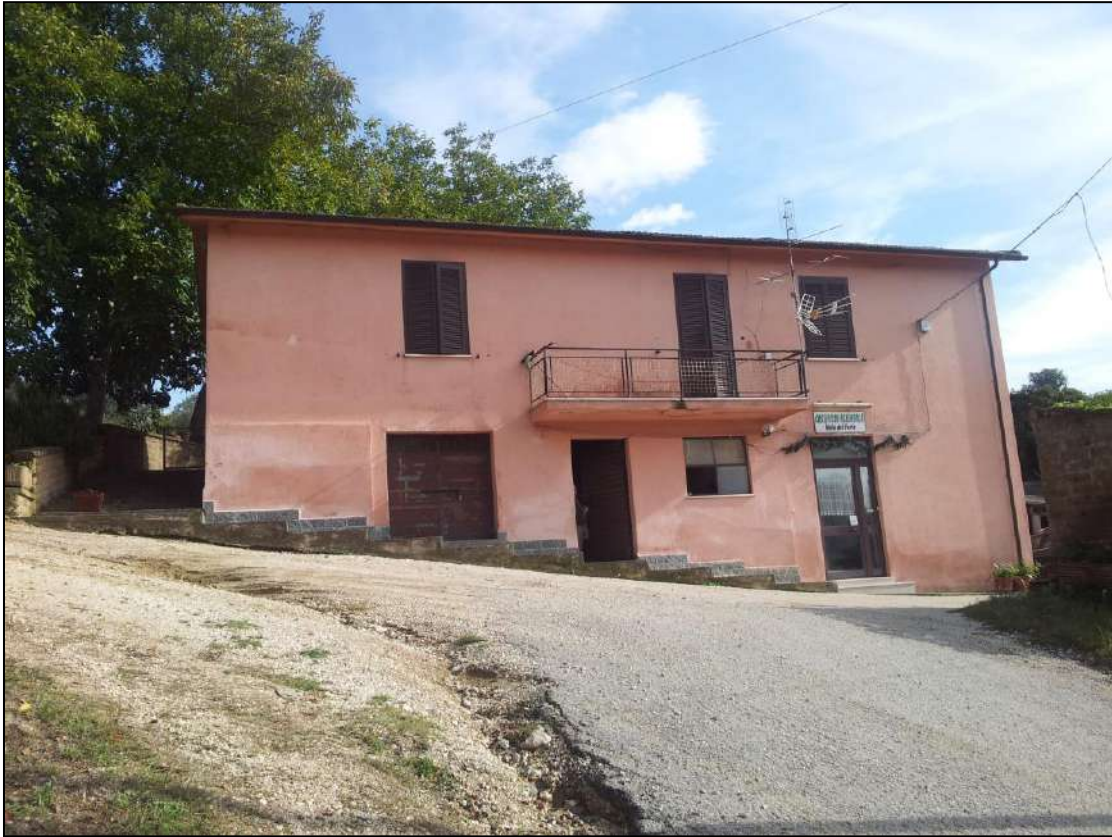
Foto 1 – Vista del fabbricato lato nord-est – strada di accesso (servitù) da Via Ferruti