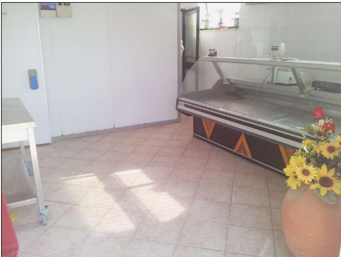
Foto 16 – Vista interna locale stagionatura/vendita - piano seminterrato