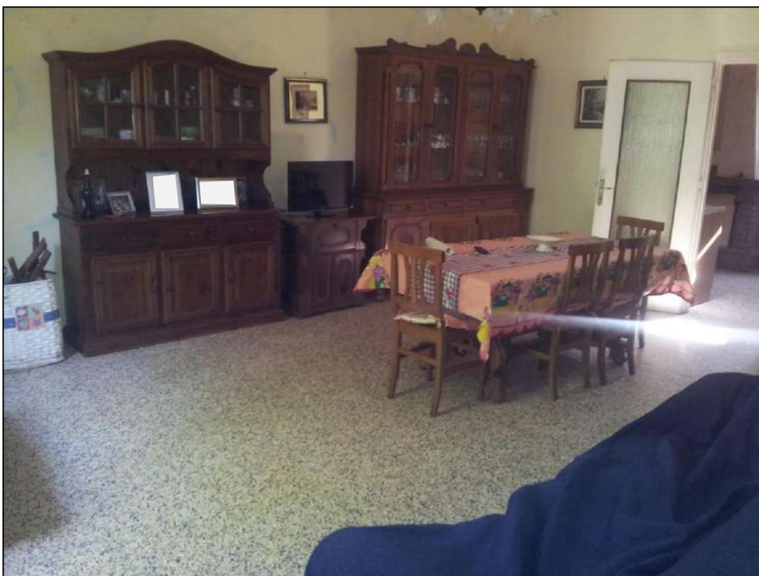
Foto 12 – Vista interna appartamento piano terra – Soggiorno/Pranzo