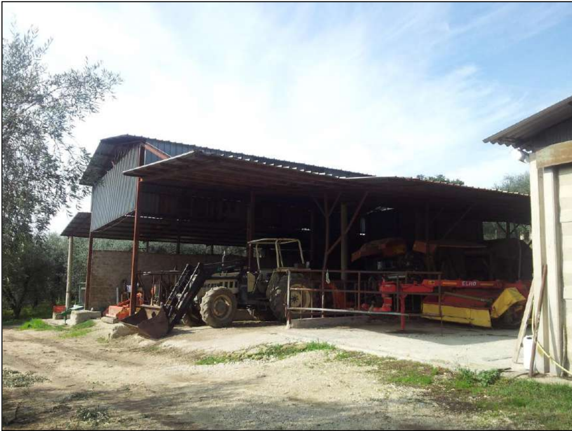
Foto 21 – Vista Capannone e Tettoie (rimesse mezzi/attrezzi) – lato sud -est