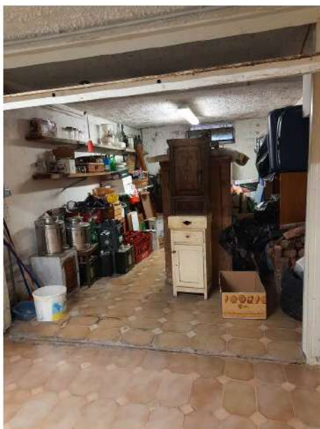
garage, sub 11