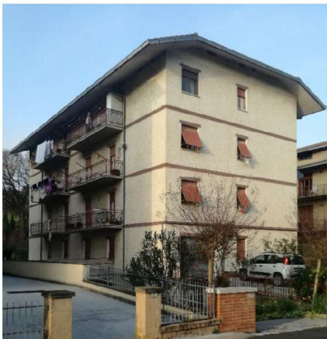
prospetto su via C.Colombo