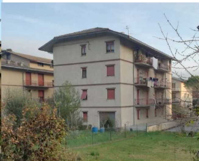
vista dalla provinciale 361