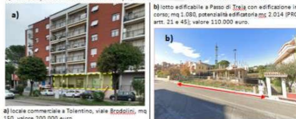
a) locale commerciale a Tolentino, viale Brodolini, mq 150, valore 200.000 euro

Qui sotto il quadro sinottico dei beni in capo [REDACTED] con il relativo valore di stima