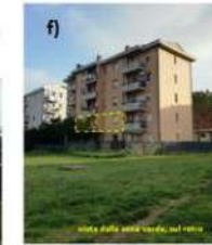
f) appartamento (67 mq) con garage (17 mq) a sfioraccio di Macerata, via Tano, civico 23, valore 100.650 euro