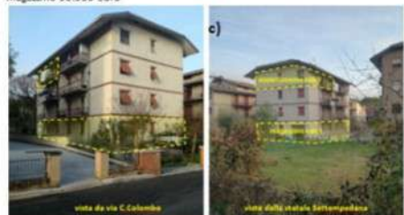
c) appartamento di abitazione (119 mq) con garage (17 mq) e locale magazzino (202 mq) in via Cristoforo Colombo, Passo di Treia; appartamento e garage 129.200 euro; magazzino 90.900 euro