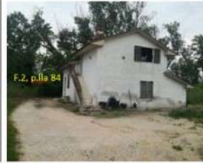
F.2, p.lla 84

Piccolo edificio residenziale (111 mq) con corte, da considerare al grezzo, valore 68.820 euro