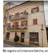
h) negozio a Civitanova Marche, corso Dalmazia, bene in proprietà di 1/2 con altro soggetto, valore 240.000 euro

g) Edificio in costruzione in c.da 18(0808), valore 275.000 euro seminativo di ha 2,14 valore 54.000 euro