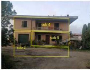
Fabbricato residenziale (2 appartamenti) con garage e interrato, sup. catastale 432 mq; valore compl. 309.400 €

Piccolo edificio residenziale (111 mq) con corte, da considerare al grezzo, valore 68.820 euro