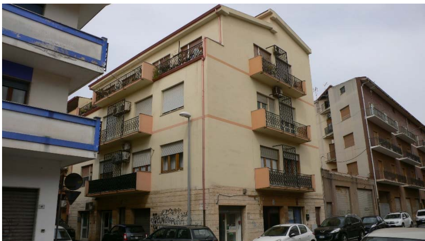
Foto 1: Facciate principali dello stabile condominiale, via Ferrara-via Venezia