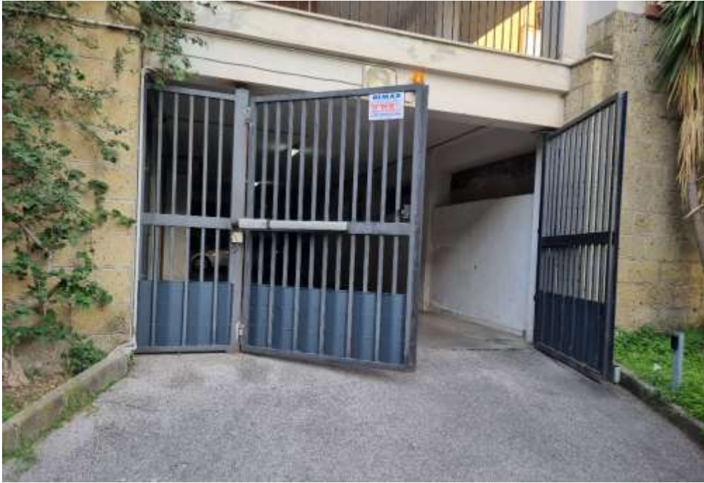
INGRESSO CARRABILE AL GARAGE