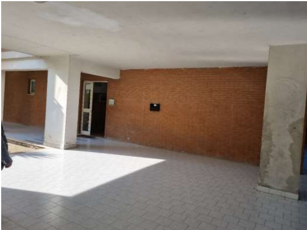
INGRESSO ALLA SCALA CONDOMINIALE