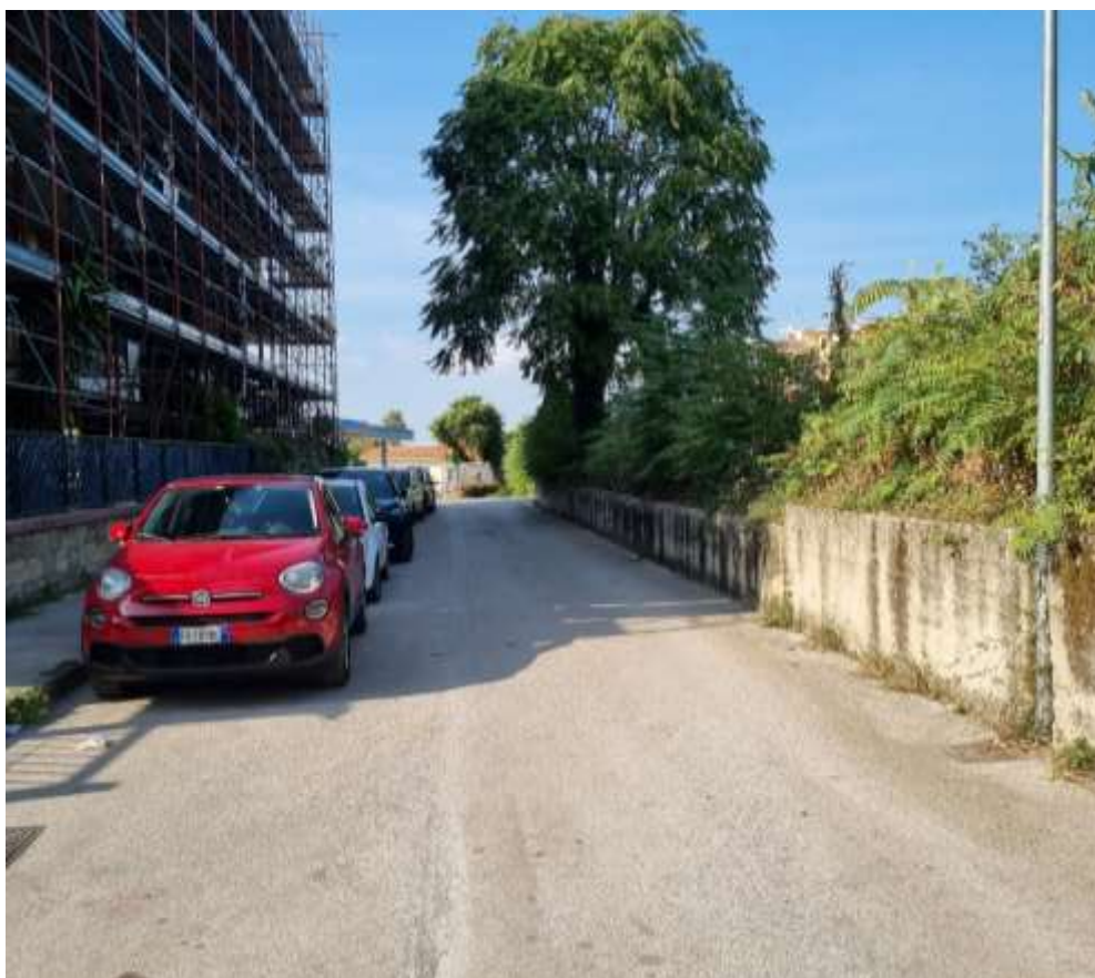
VIALE DI ACCESSO