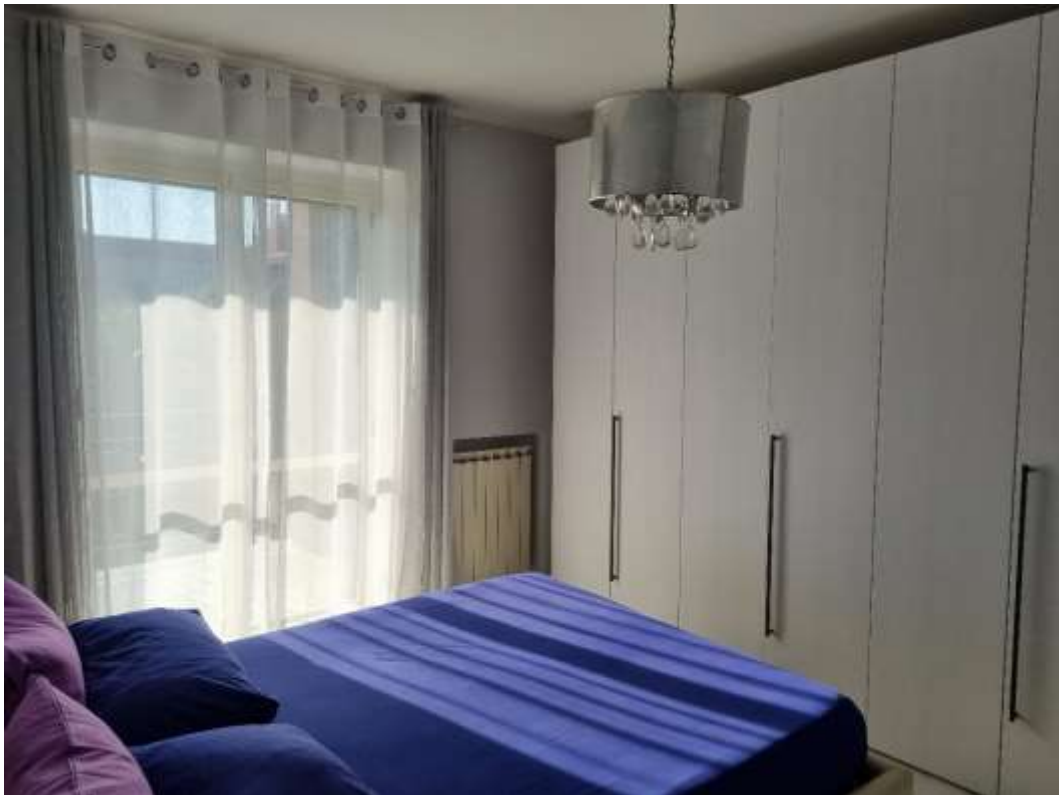
CAMERA DA LETTO 2 (VISTA 2)