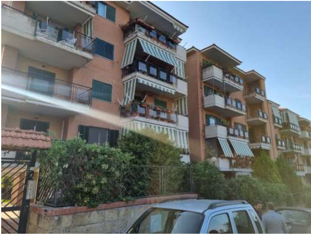
VISTA ESTERNA DEL FABBRICATO