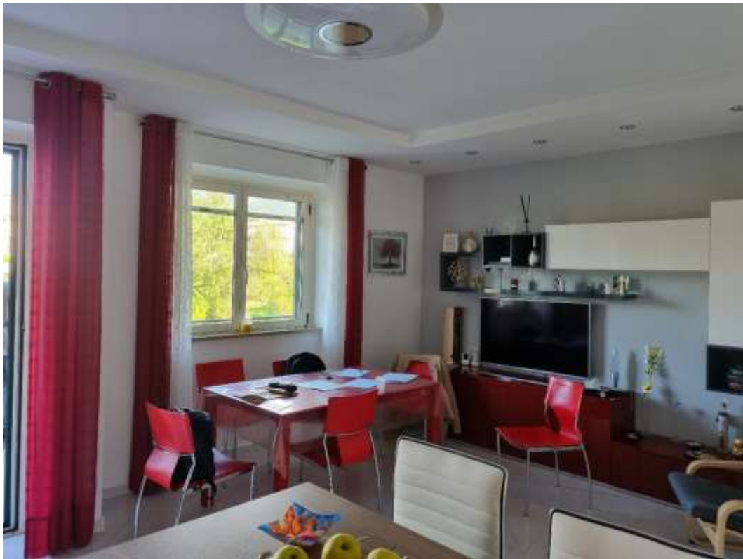
CUCINA (VISTA 1)