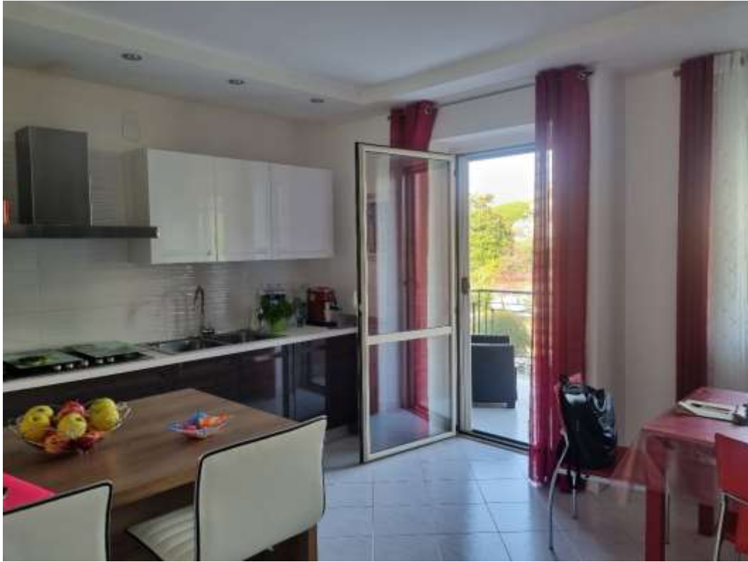
CUCINA (VISTA 2)