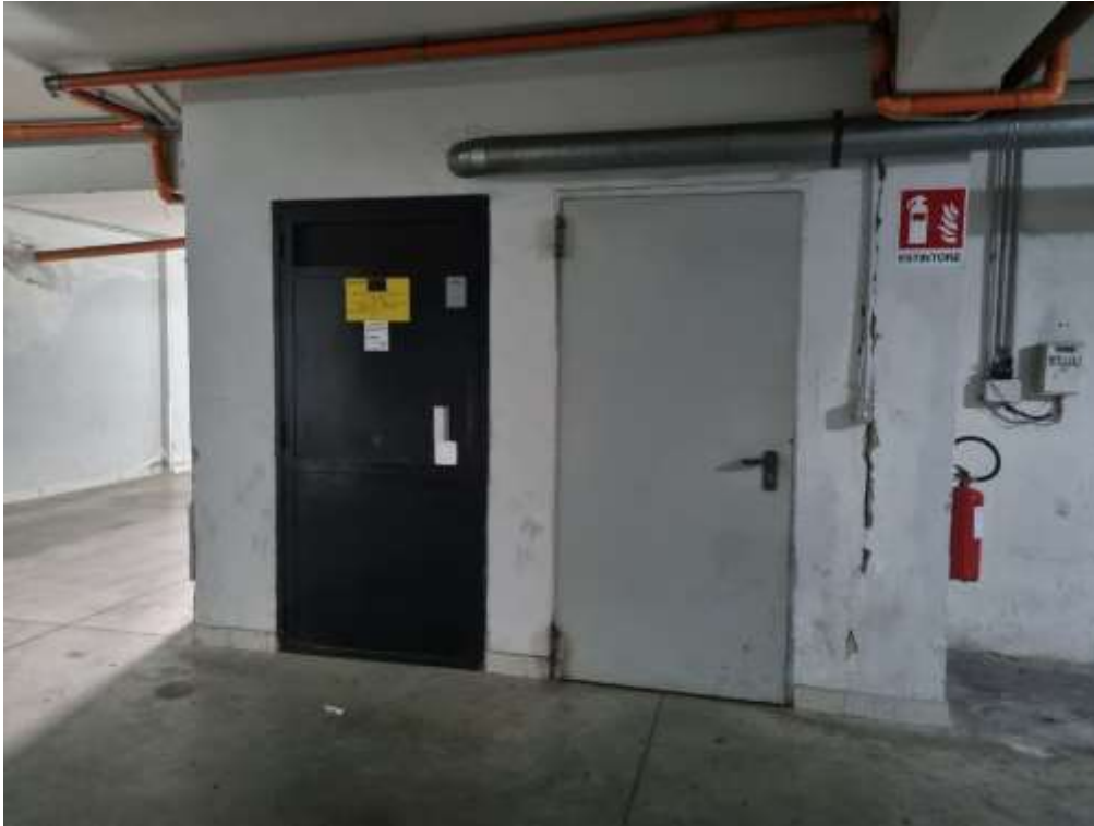
INGRESSO DALL'AREA CONDOMINIALE ADIACENTE AL GARRAGE AL VANO SCALA CONDOMINIALE