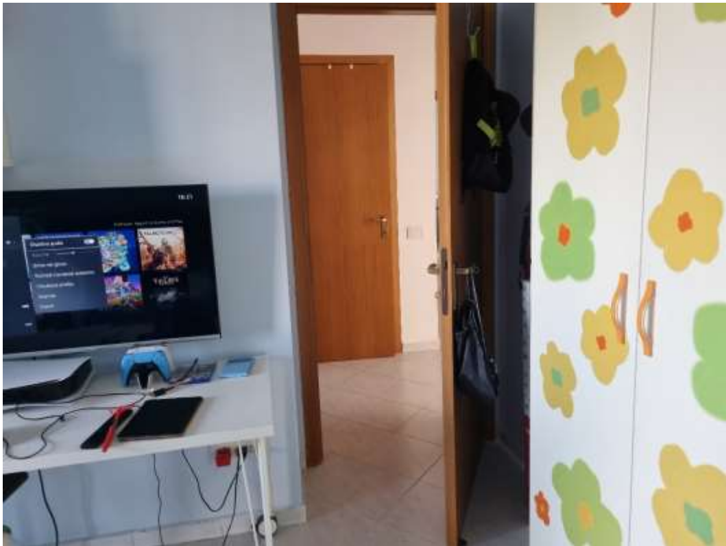
CAMERA DA LETTO 3 (VISTA 2)