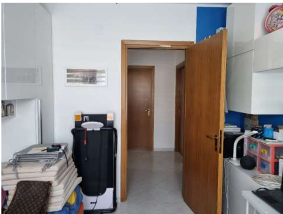
CAMERA DA LETTO 1 (VISTA 2)