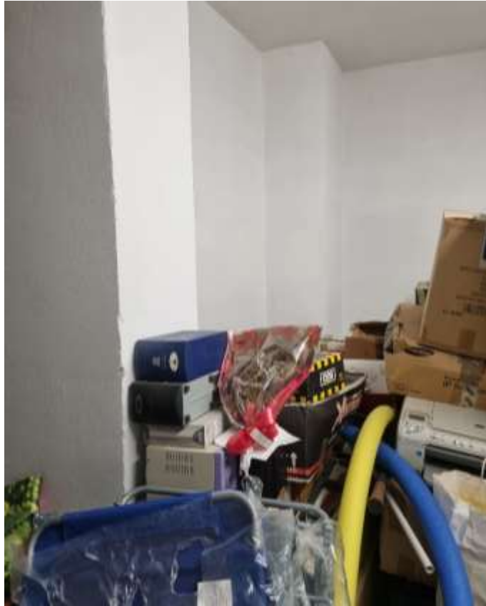
VISTA INTERNA DEL GARAGE