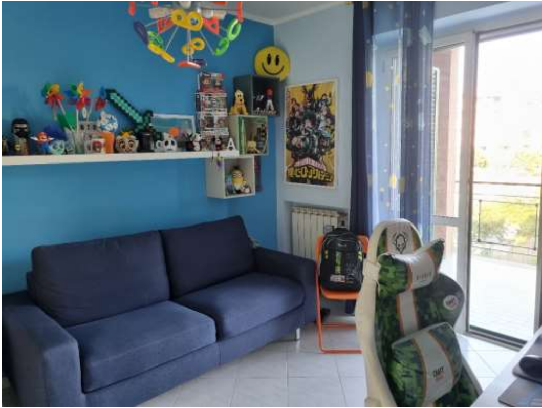
CAMERA DA LETTO 3 (VISTA 1)