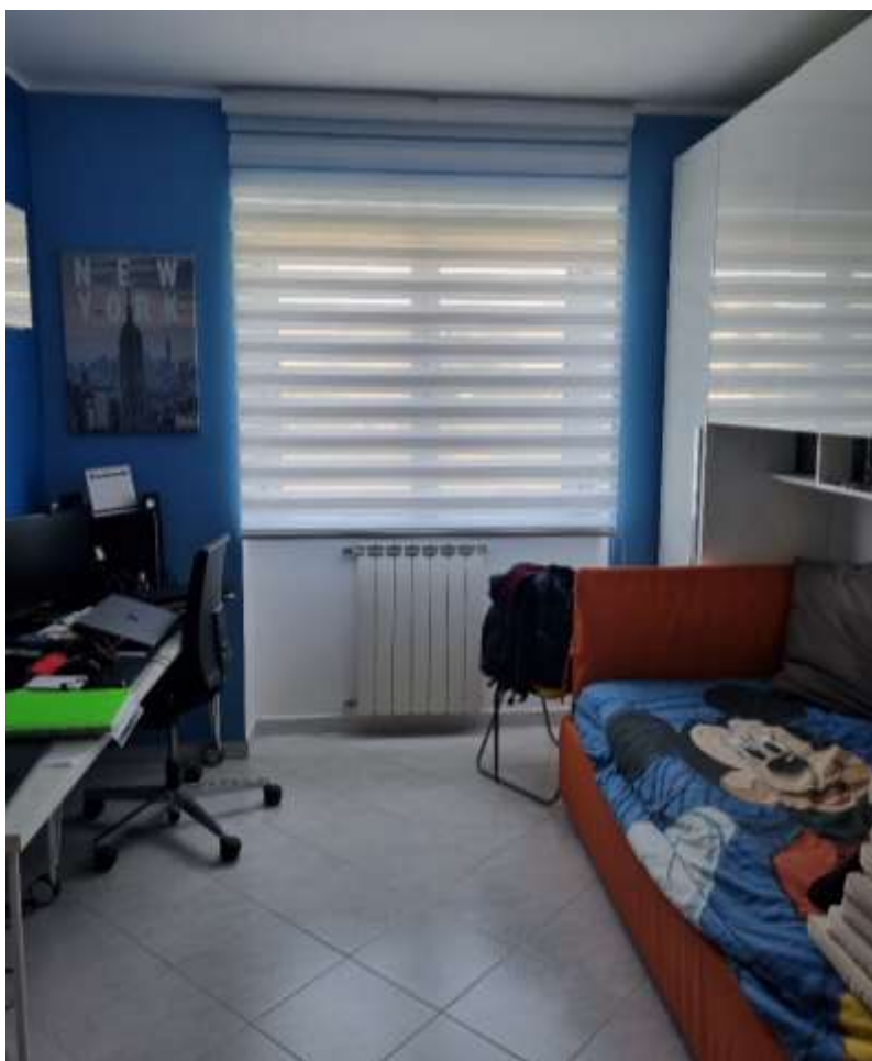
CAMERA DA LETTO 1 (VISTA 1)