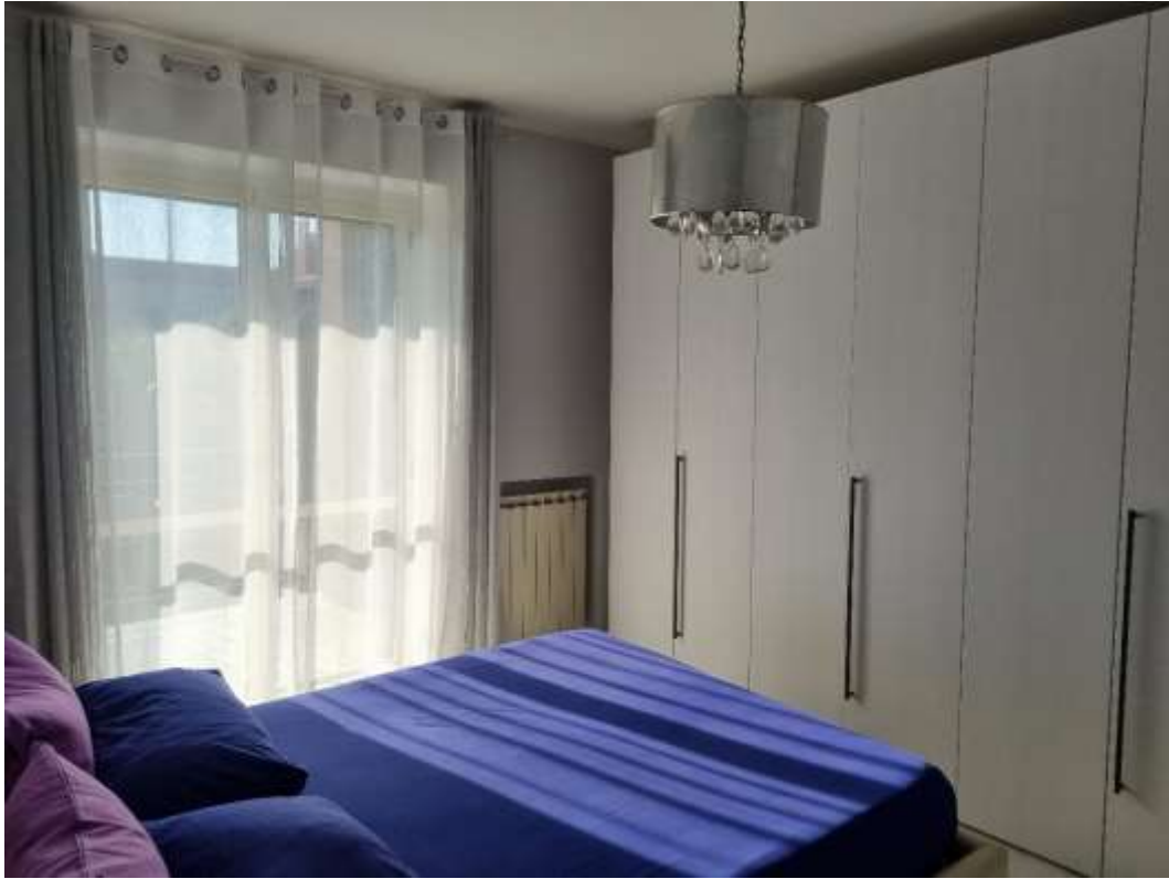
CAMERA DA LETTO 2 (VISTA 1)