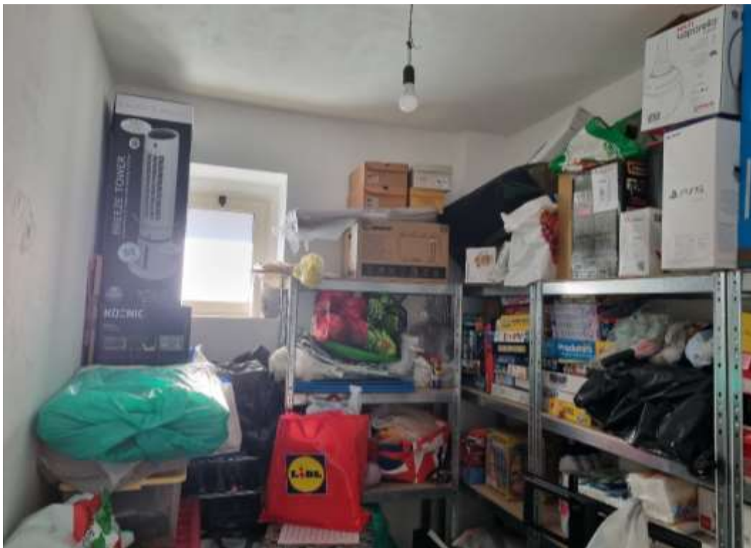
VISTA INTERNA DEL DEPOSITO