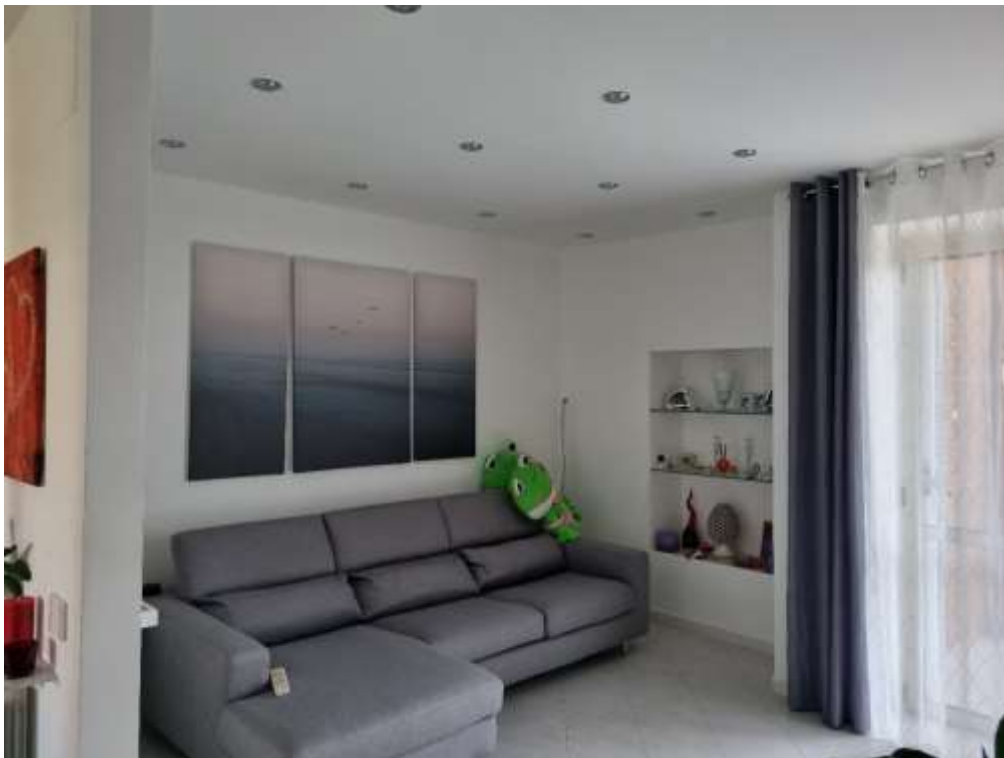
SOGGIORNO (VISTA 1)