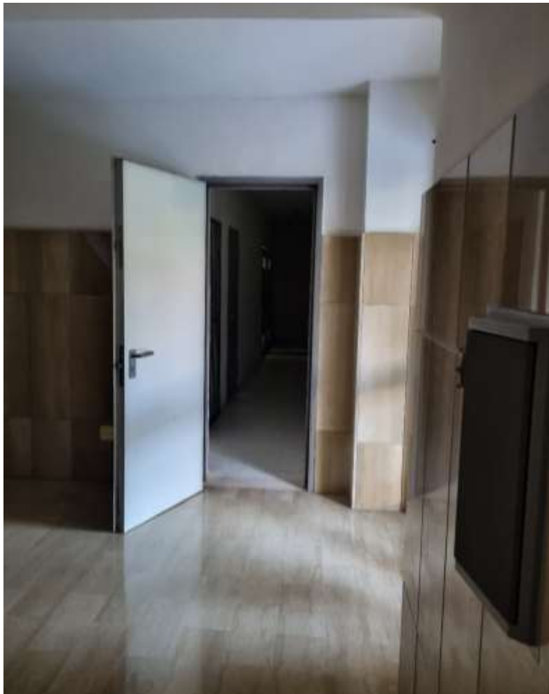
INGRESSO PEDONALE ALLE CANTINOLE