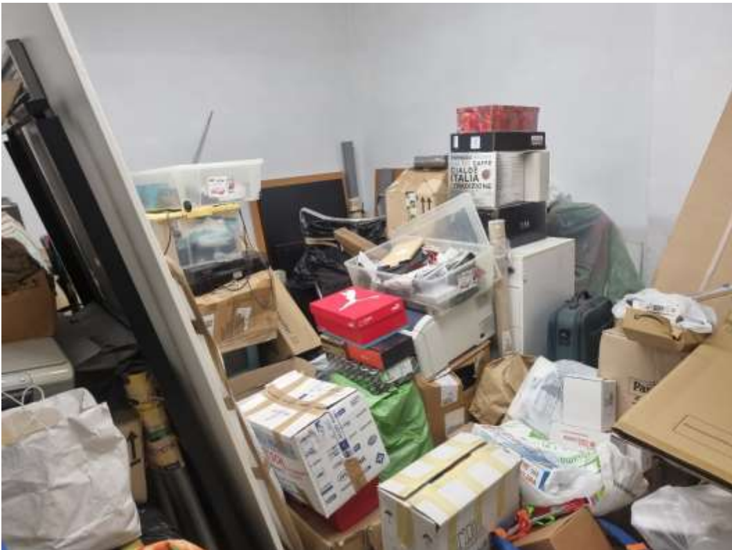
VISTA INTERNA DEL GARAGE