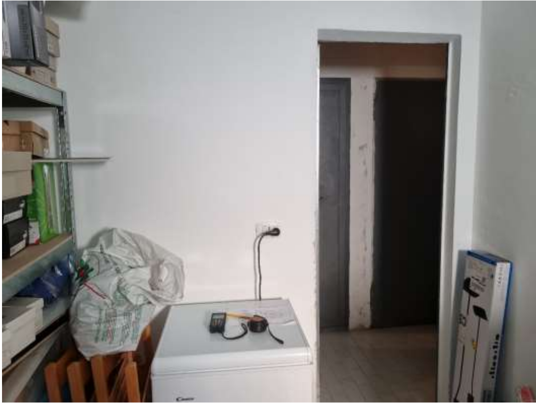
VISTA INTERNA DEL DEPOSITO