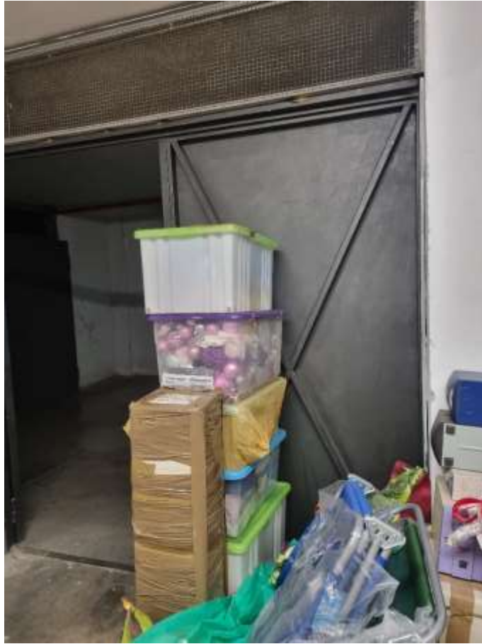
VISTA INTERNA DEL GARAGE