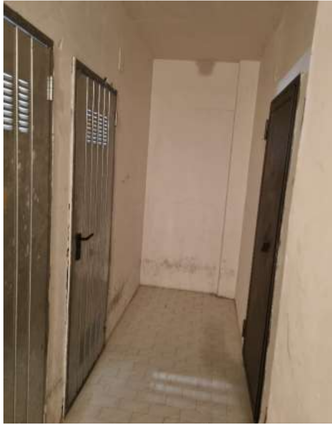
INGRESSO AL DEPOSITO