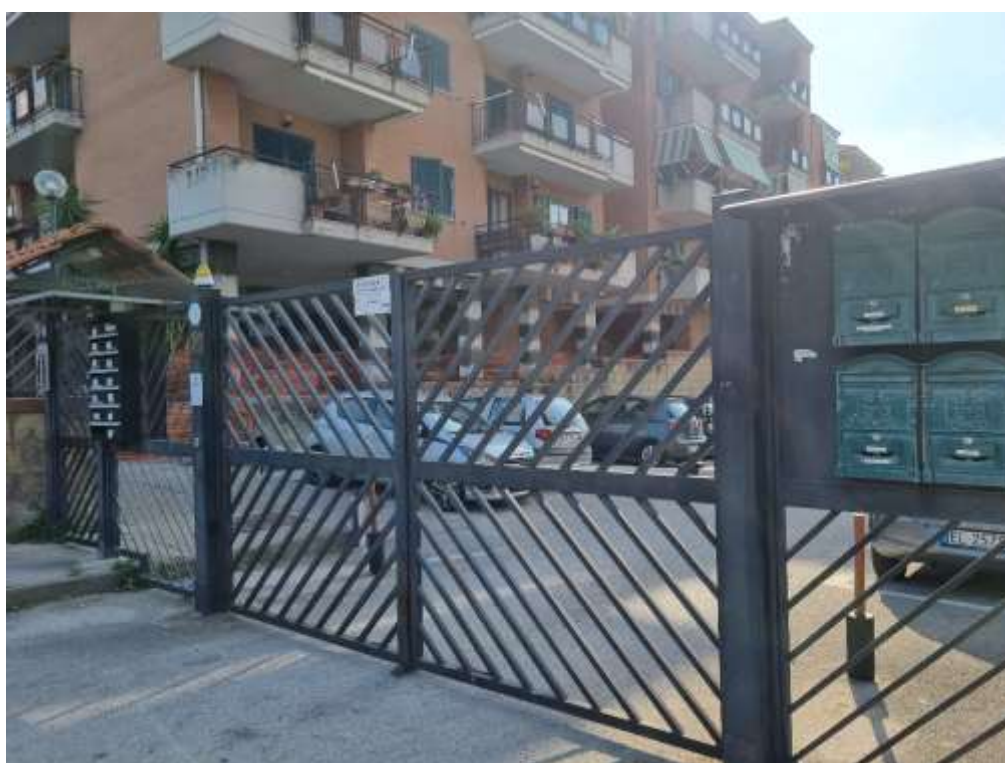
CANCELLO DI ACCESSO