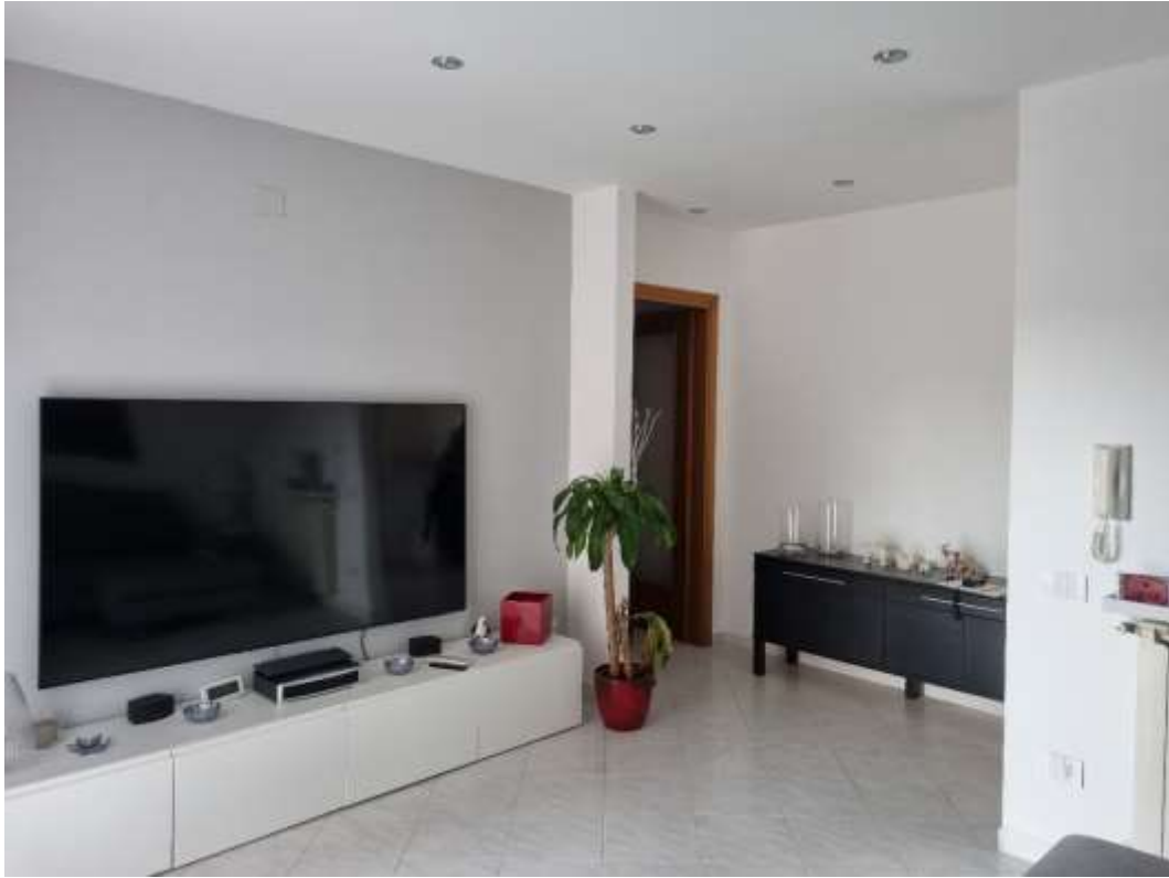
SOGGIORNO (VISTA 2)