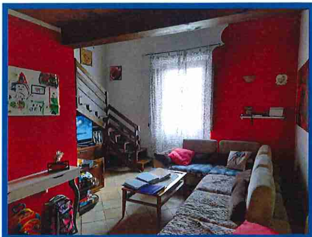
8 - soggiorno