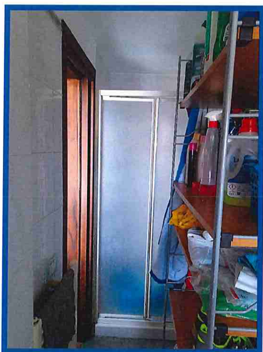
11 – Doccia bagno di servizio