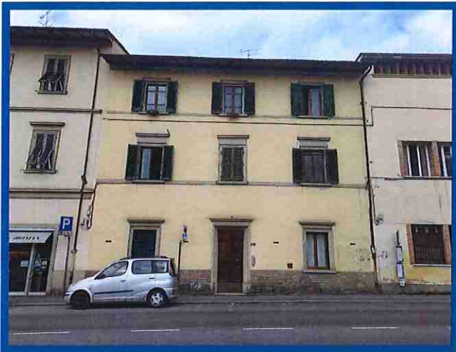
1 - vista frontale complessiva