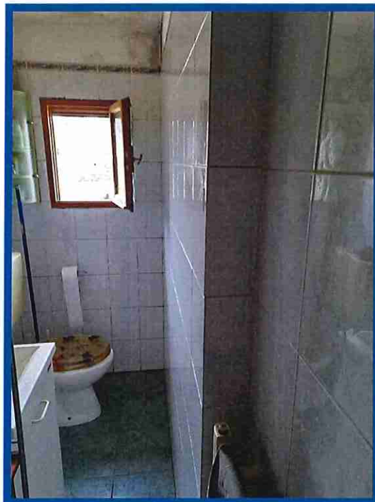
7 - Bagno di servizio