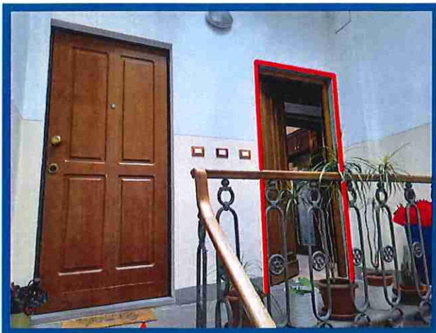
3 - Ingresso appartamento