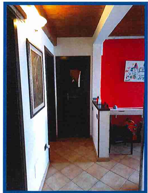
4 - Ingresso/disimpegno