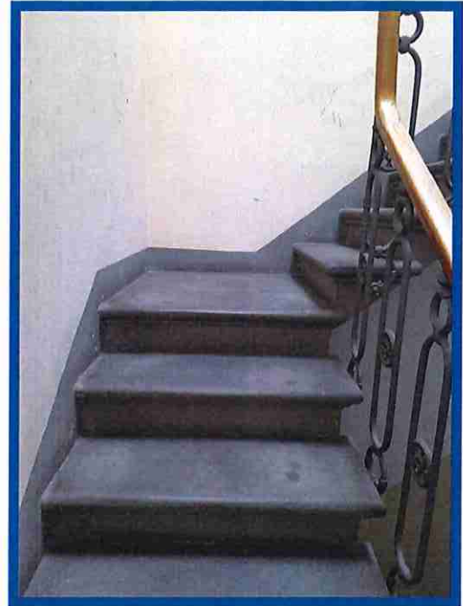
2 - scale condominiali