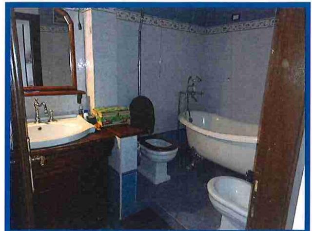
9 - bagno