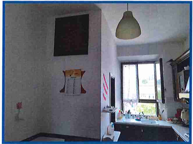
6 - palco morto - cucina