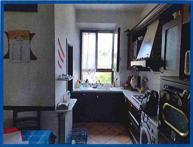
5 - cucina