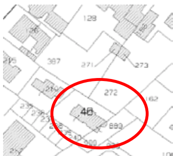
estratto di mappa foglio 9 – mappali n. 48 – 889

Il fabbricato è inserito su lotto di terreno catastalmente individuato all'U.T.E. di Vicenza al C.T. in Comune di Grisignano di Zocco (VI) al foglio 9 – mappali nn. 48 e 889 (enti urbani) di superficie complessiva pari a mq. 507 posti tra i confini Nord in senso N.E.S.O.: mm. nn. 387 – 272; mm. nn. 1000 – 998; mm. nn. 999 – 240 – 239 – 238 – 237; m. n. 219.