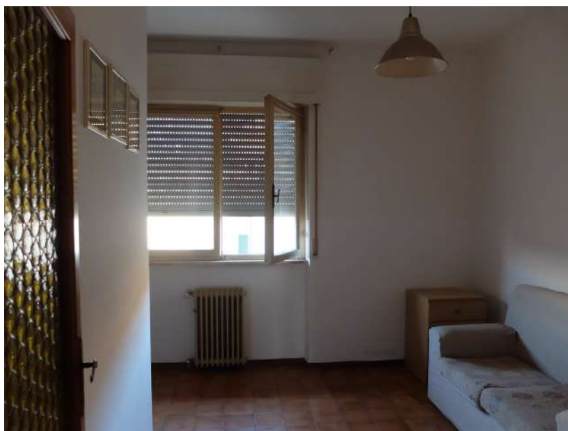
Foto6: Soggiorno – pranzo