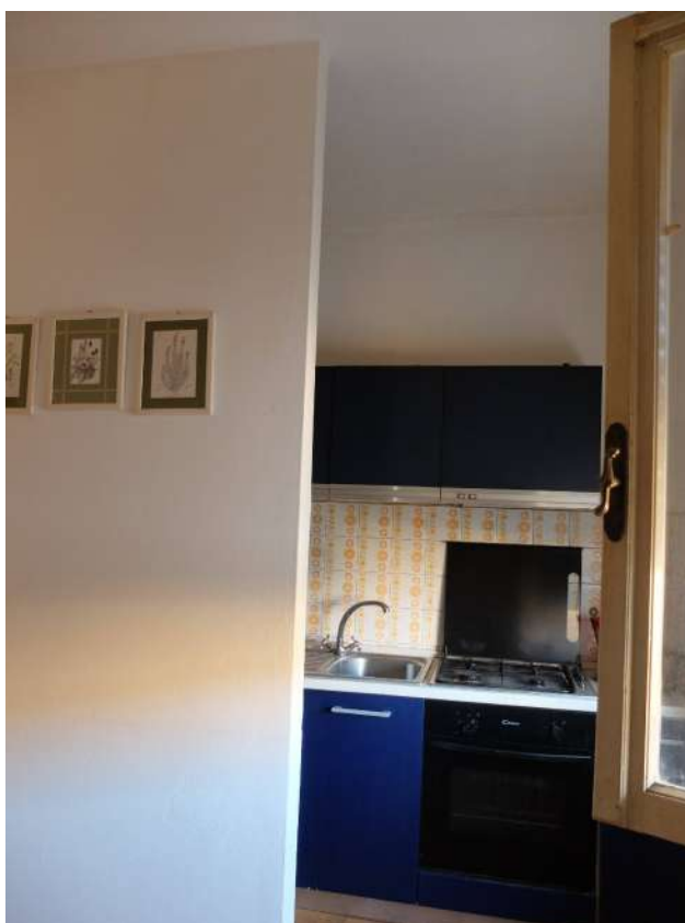
Foto7: zona cucina