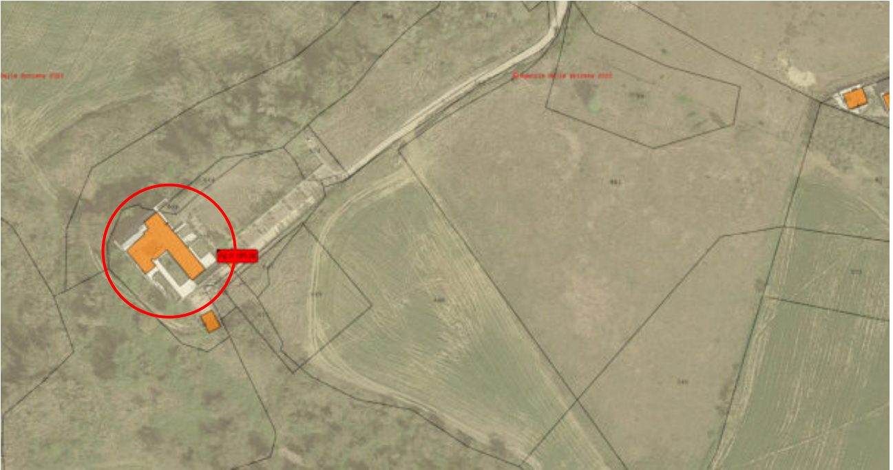
FOTO AEREA DELLA ZONA SOVRAPPOSTA ALLA MAPPA CATASTALE PART. N° 38 FG 141 CT TODI