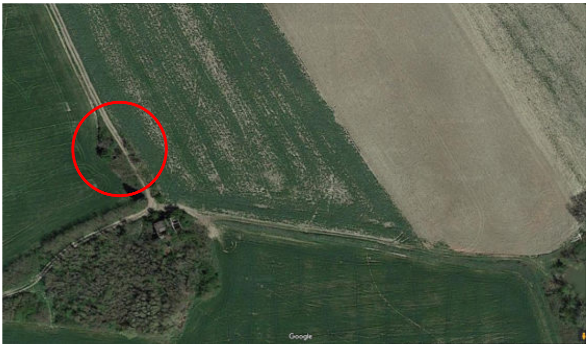
Foto n°2: foto aerea del fabbricato posto in Todi Frazione Crocefisso, Vocabolo Mossa Alta censito al C.F. al Foglio 141 particella n° 646 – unità collabente;