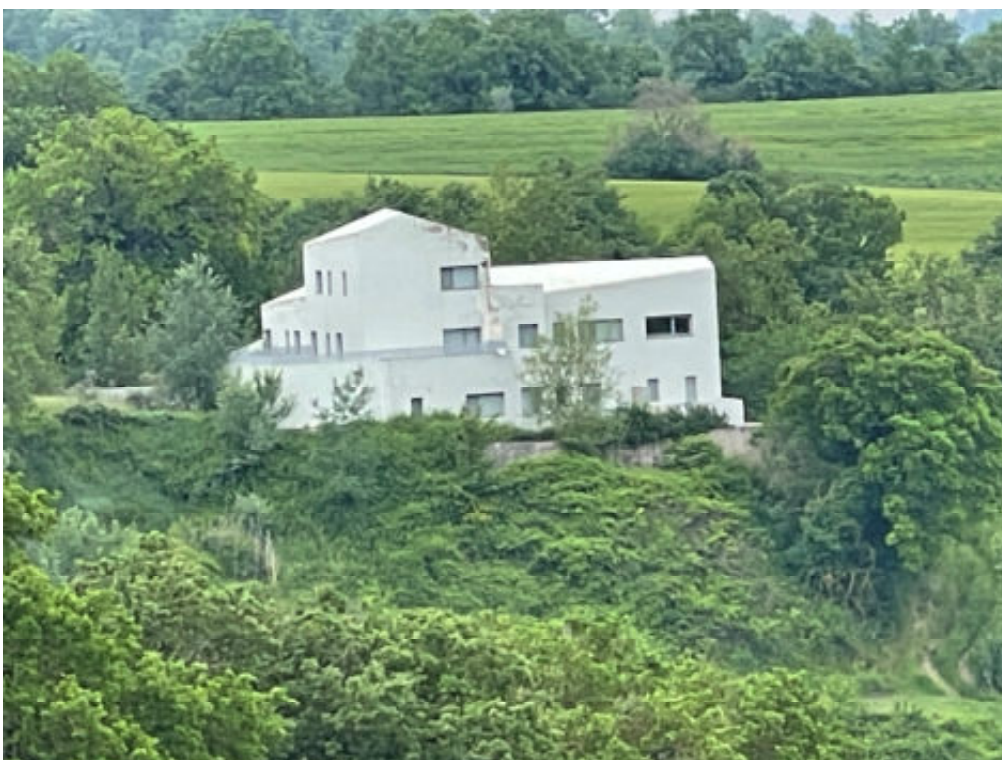
Foto n° 8: prospetto Nord del fabbricato posto in Todi, località San Benigno, vocabolo Torresquadrata n° 182