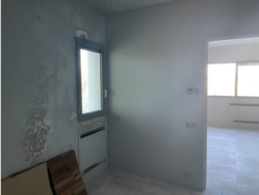
Foto n° 17: interno dell'unità immobiliare n° 38/504 – si notano tracce di umidità sulle pareti -