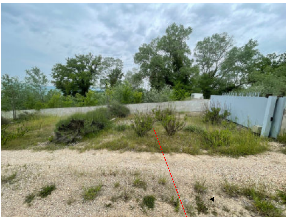
Foto n°7: ingresso del fabbricato e posto auto ( C.F. di Todi fg 141 part 38/47 )