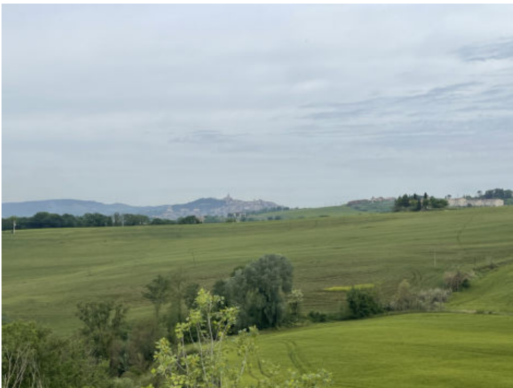
Foto n° 4: foto della zona circostante il fabbricato posto in Todi, località San Benigno, vocabolo Torresquadrata n° 182