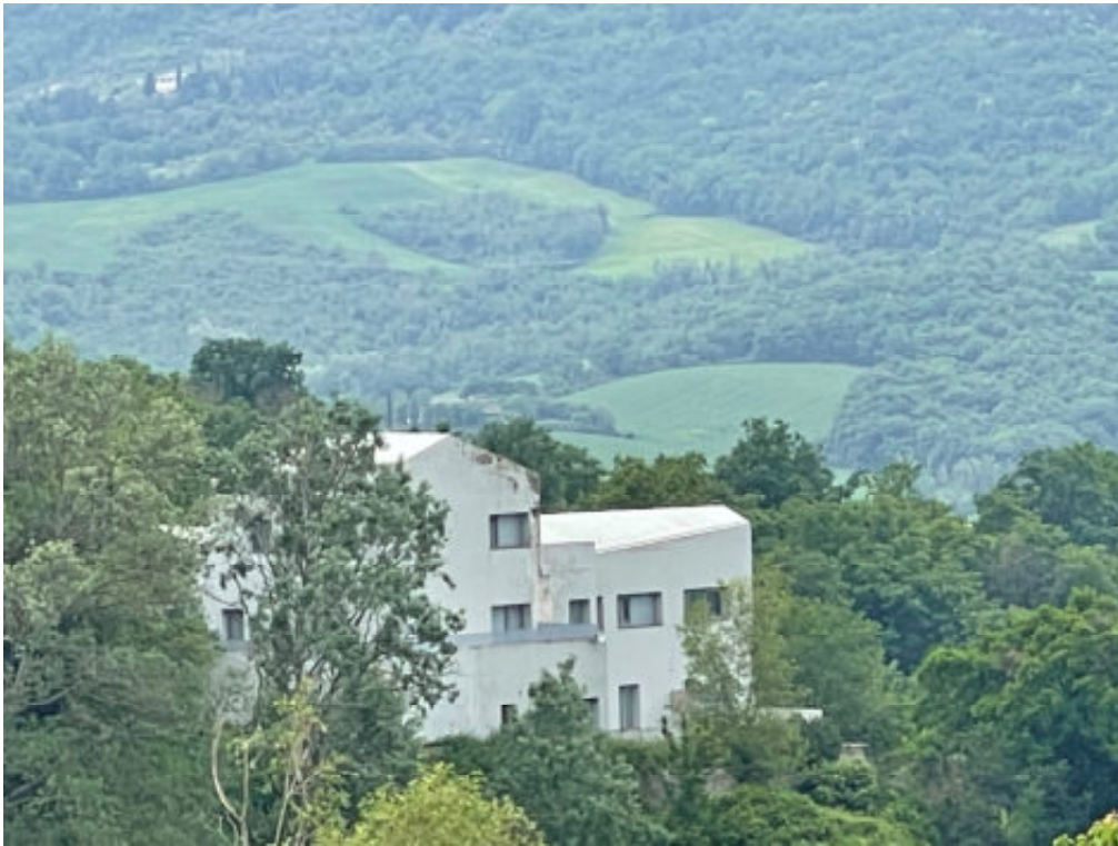
Foto n° 3: foto della zona circostante il fabbricato posto in Todi, località San Benigno, vocabolo Torresquadrata n° 182