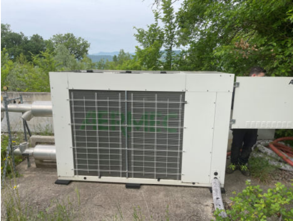
Foto n° 27: pompa di calore condominiale posta all'esterno del fabbricato in prossimità del cancello d'ingresso