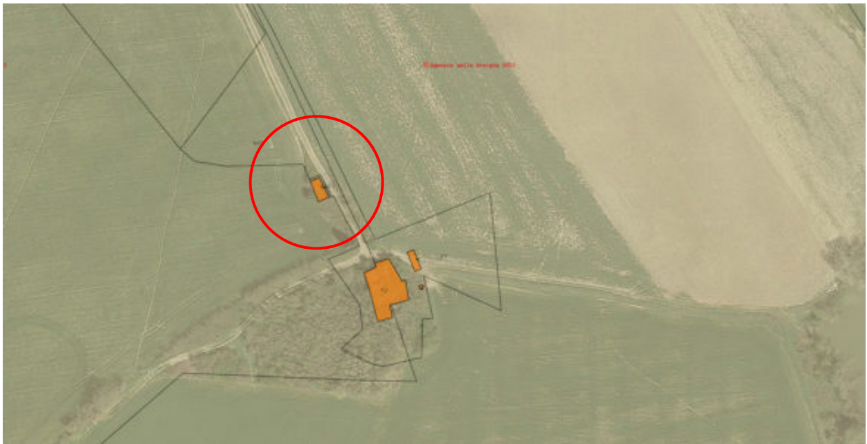
FOTO AEREA DELLA ZONA SOVRAPPOSTA ALLA MAPPA CATASTALE PART. N° 646 FG 141 CT TODI