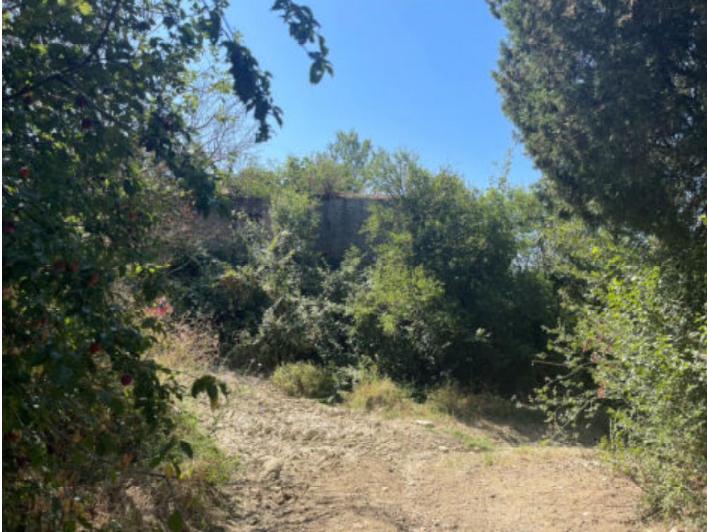
Foto n° 21: strada di accesso al fabbricato collabente ( unità immobiliare n° 646 ) – incrocio con fabbricato diruto particella n° 62 di altra proprietà