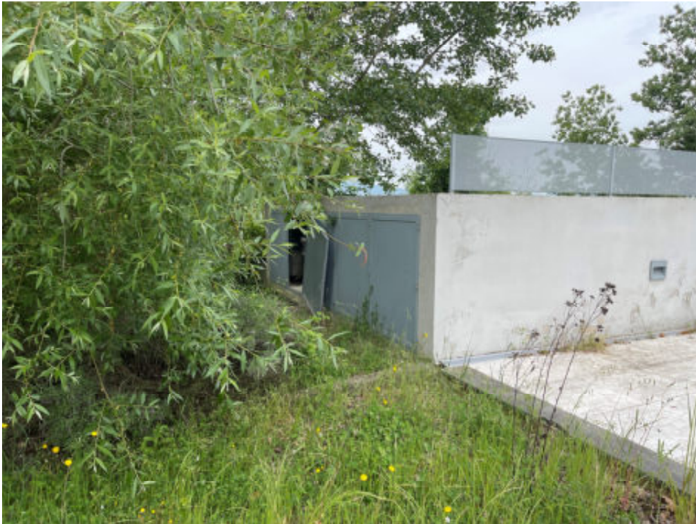
Foto n° 24 : zona contatori luce, acqua, metano di tutte le unità immobiliari presenti nel fabbricato