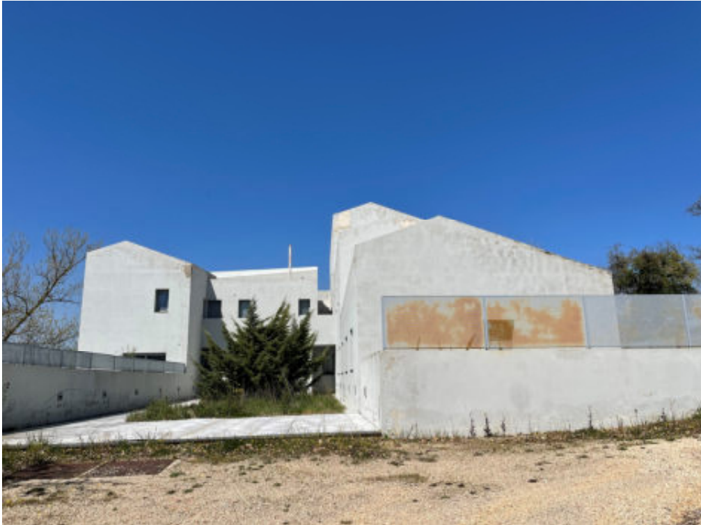
Foto n° 10: prospetto Sud del fabbricato posto in Todi, località San Benigno, vocabolo Torresquadrata n° 182