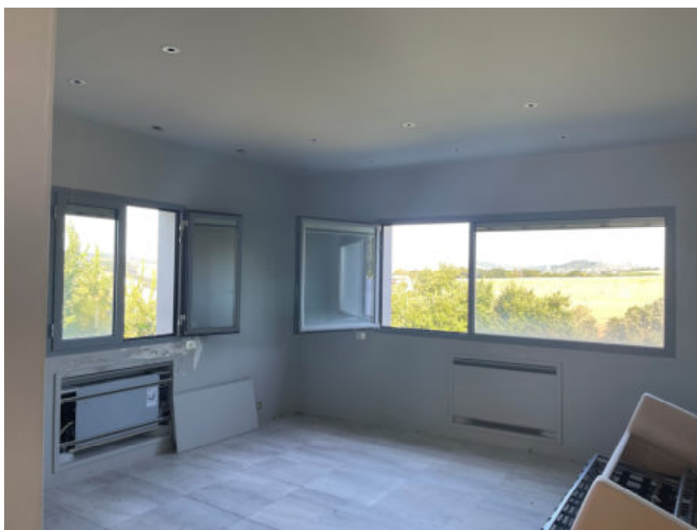
Foto n° 16: interno dell'unità immobiliare n° 38/504 – cat A/2 – si notano i termoventilconvettori