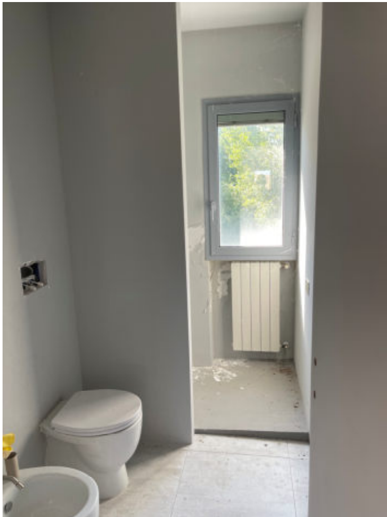
Foto n° 18: interno del WC dell'unità immobiliare n° 38/504 – cat A/2