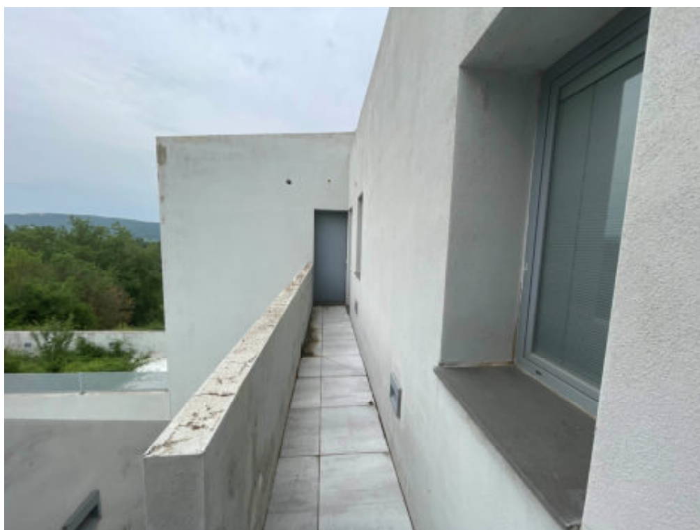
Foto n° 14: porta d'ingresso all'unità immobiliare n° 38/504 – cat A/2