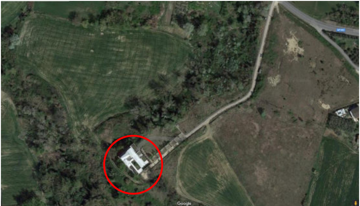
Foto n° 1: foto aerea della zona del fabbricato posto in Todi, località San Benigno, vocabolo Torresquadrata n° 182, di cui fanno parte le porzioni immobiliari censite al C.F. al Foglio 141, con le particelle n° 38/5 – cat C/6; n° 38/6 – unità collabente; n° 38/47 – cat C/6; n° 38/504 – cat A/2