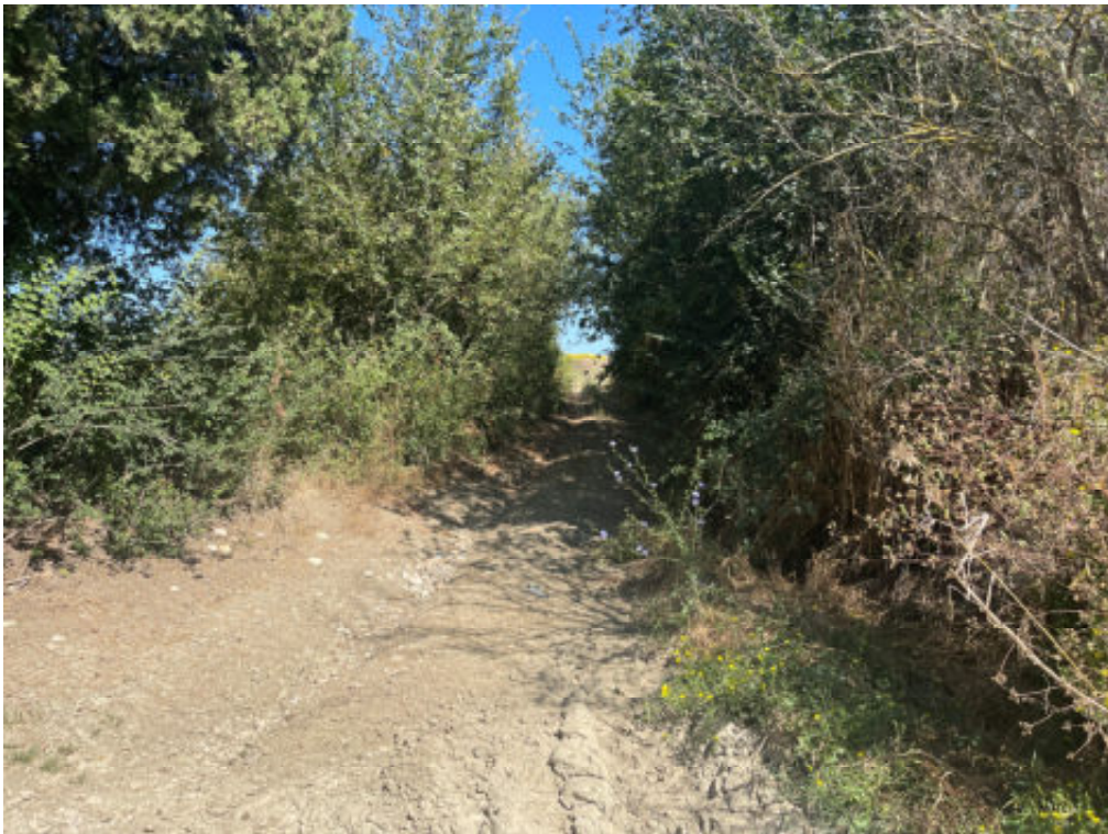
Foto n° 22: strada di accesso al fabbricato collabente ( unità immobiliare n° 646 )