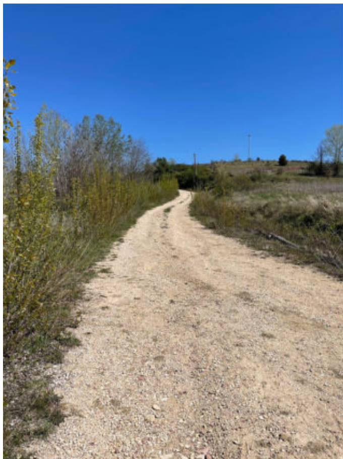
Foto n° 5: strada di accesso al fabbricato posto in Todi, località San Benigno, vocabolo Torresquadrata n° 182