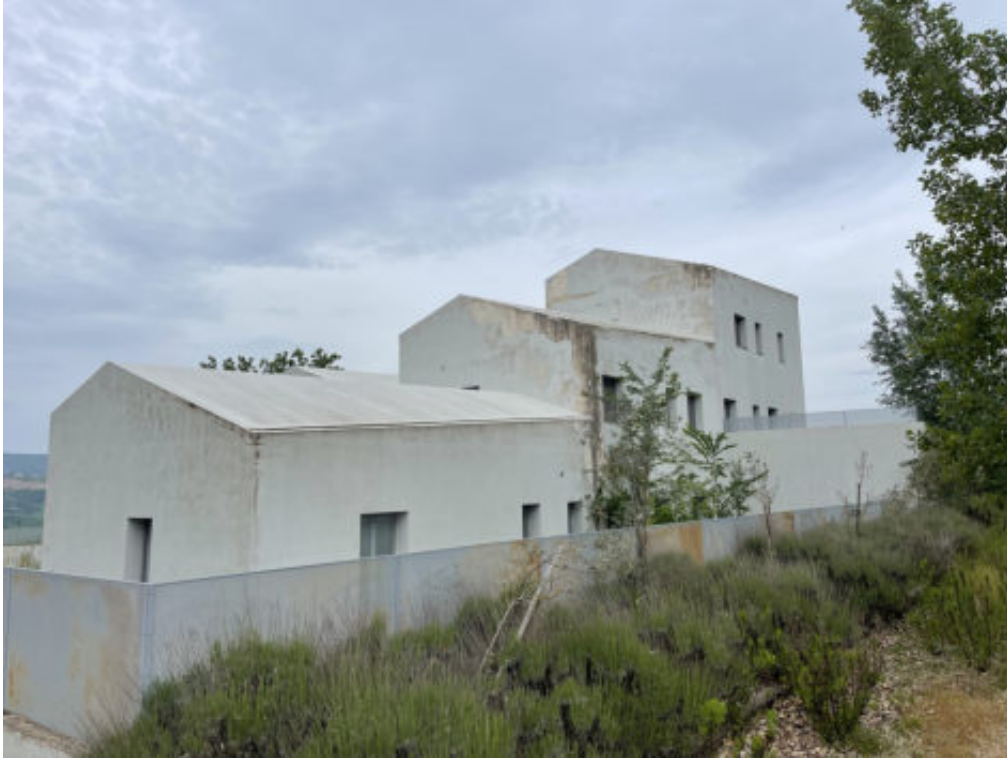
Foto n° 9: prospetto Est del fabbricato posto in Todi, località San Benigno, vocabolo Torresquadrata n° 182