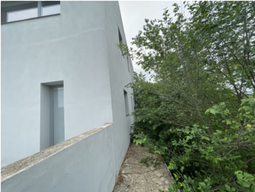
Foto n° 11: prospetto Ovest del fabbricato posto in Todi, località San Benigno, vocabolo Torresquadrata n° 182