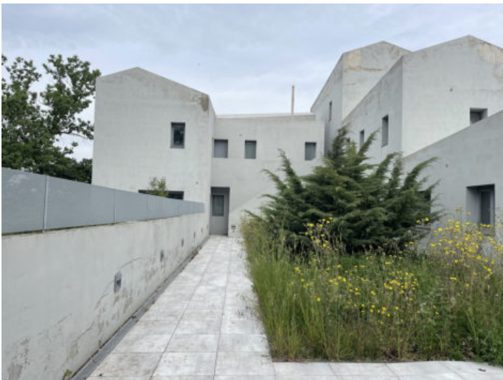
Foto n°12: ingresso al fabbricato e scala di accesso al piano primo ( si evidenziano macchie di umidità sulle pareti del fabbricato e modeste lesioni sui muretti di recinzione )