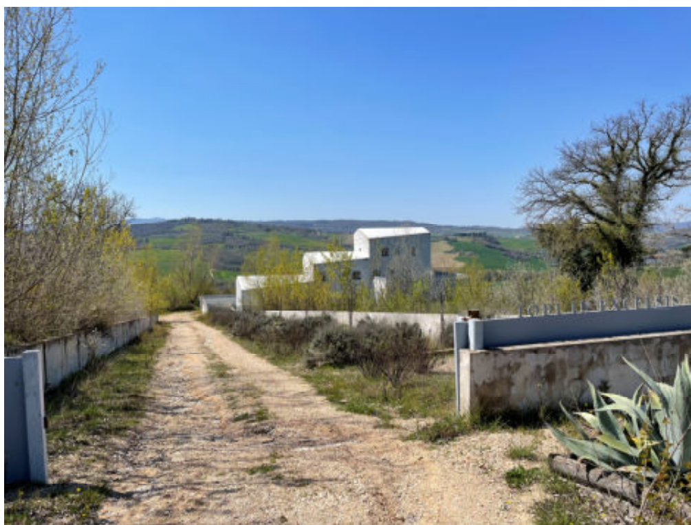
Foto n°6: ingresso del fabbricato posto in Todi, località San Benigno, vocabolo Torresquadrata n°