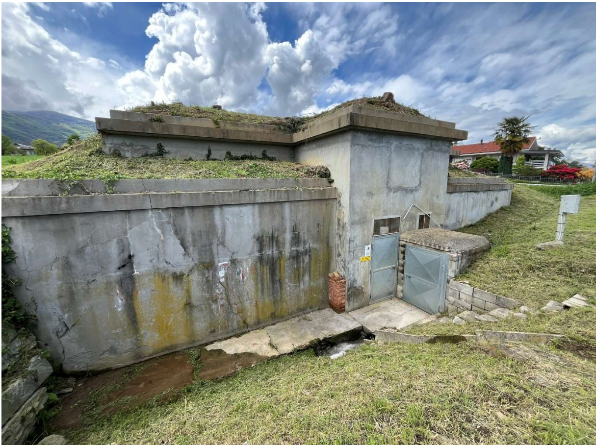
Foto n.21: Particolare fabbricato acquedotto comunale edificato sul Bene n.4