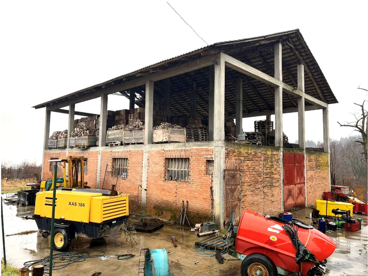
Foto n.3: Vista del fabbricato identificato dal Bene n.2 (P.T.-Magazzino) e Bene n.3 (P.1-Tettoia)