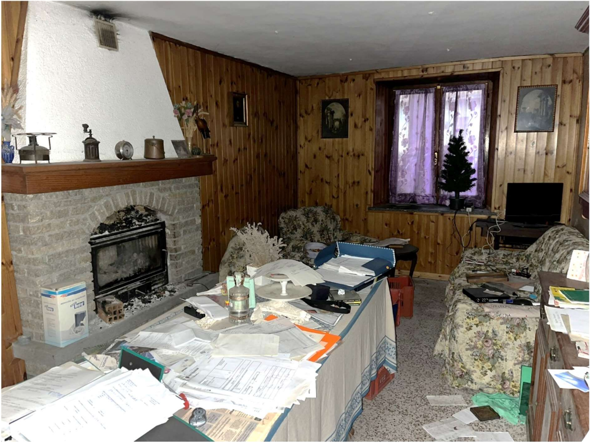
Foto n.8: Dettaglio interno del piano terreno Bene n.1 (abitazione)