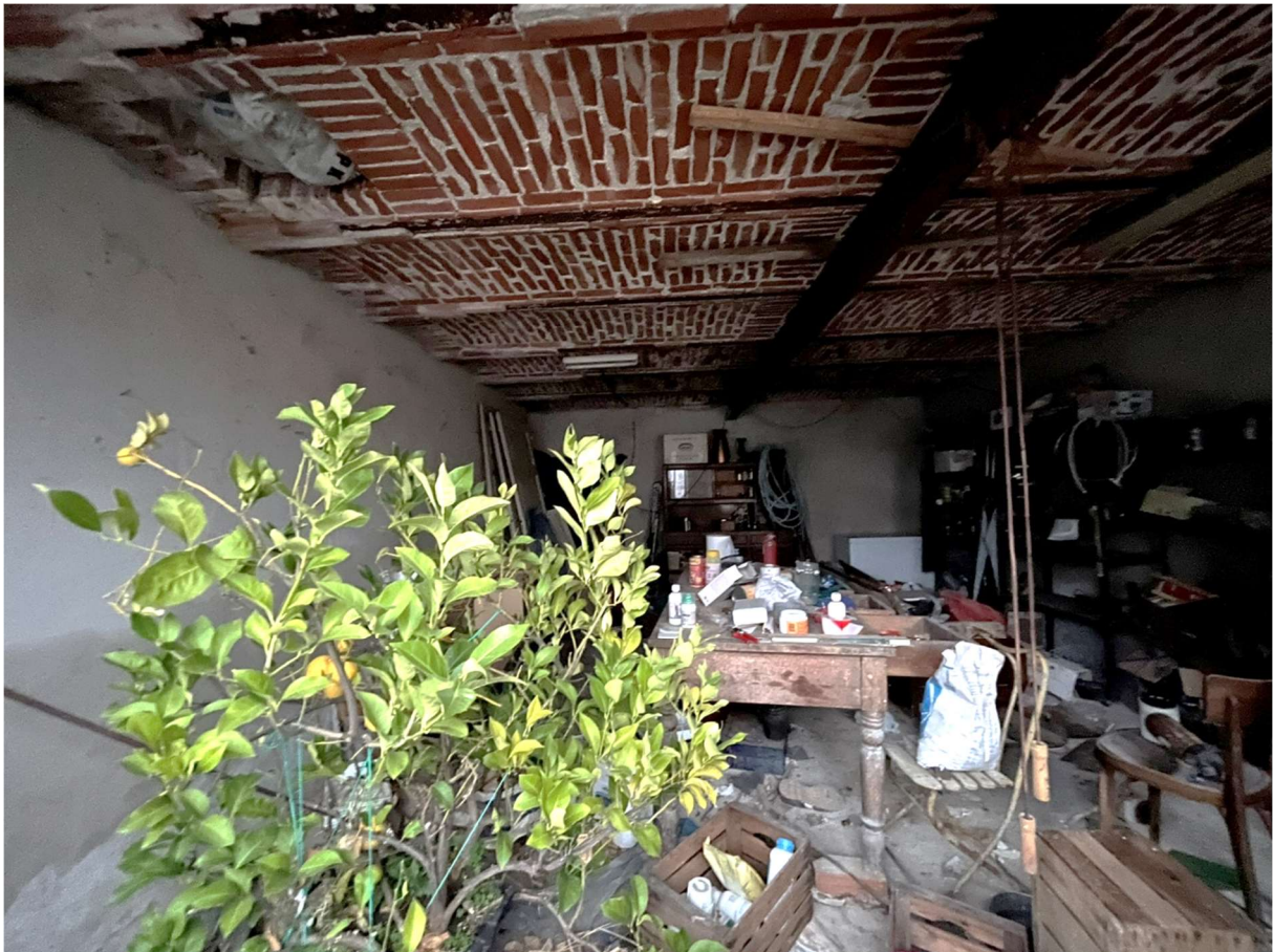
Foto n.16: Vista interna dello sgombero al piano terreno abitazione (Bene n.1)