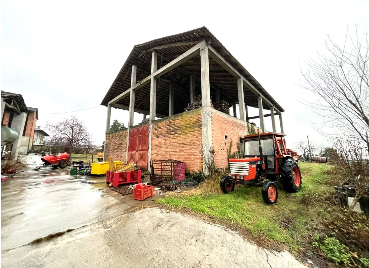
Foto n.4: Vista del fabbricato identificato dal Bene n.2 (P.T.-Magazzino) e Bene n.3 (P.1-Tettoia)