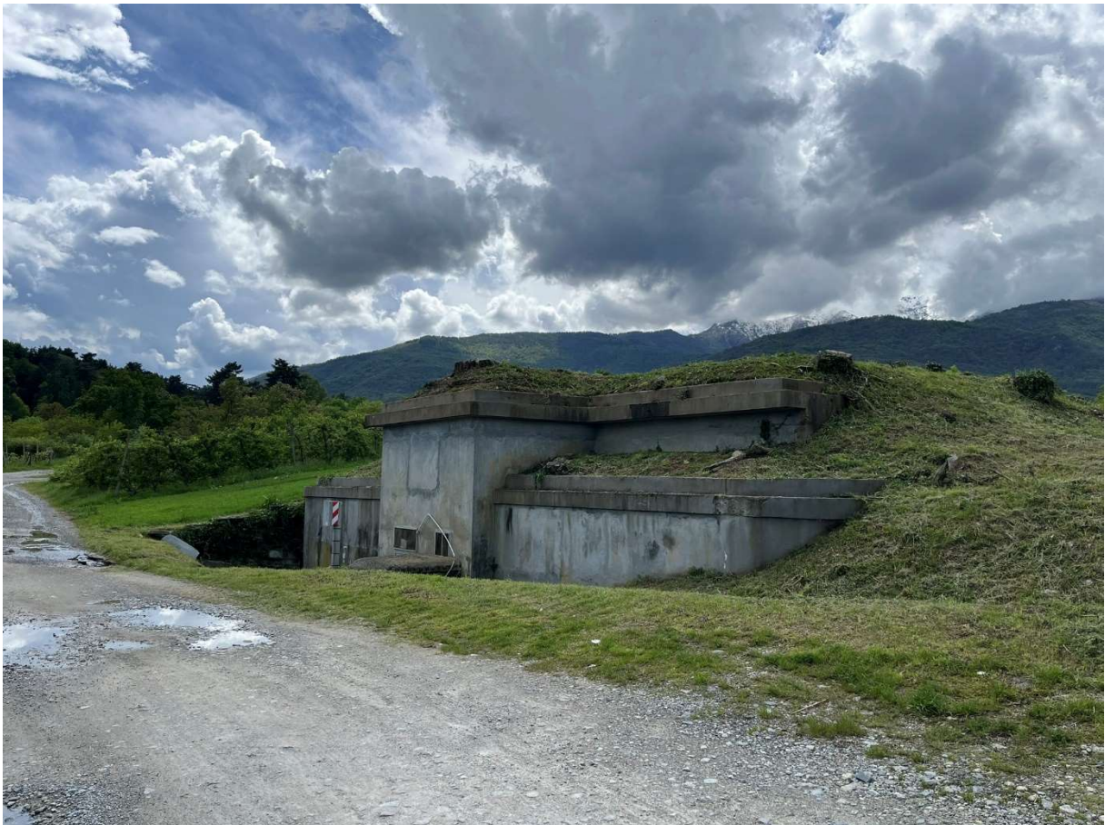
Foto n.19: Vista del Bene n.4 (terreno agricolo) con cabina acquedotto comunale parzialmente interrata