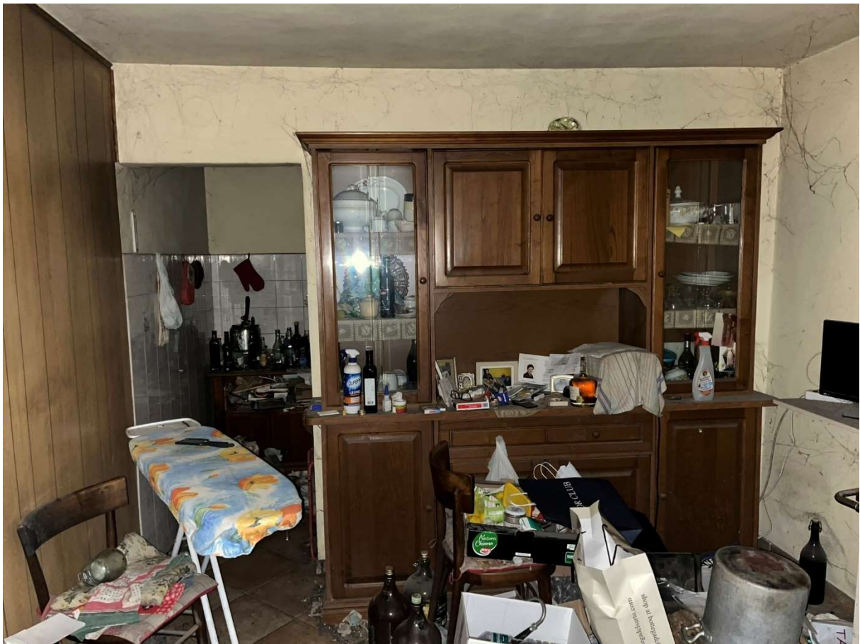
Foto n.7: Dettaglio interno del piano terreno Bene n.1 (abitazione)