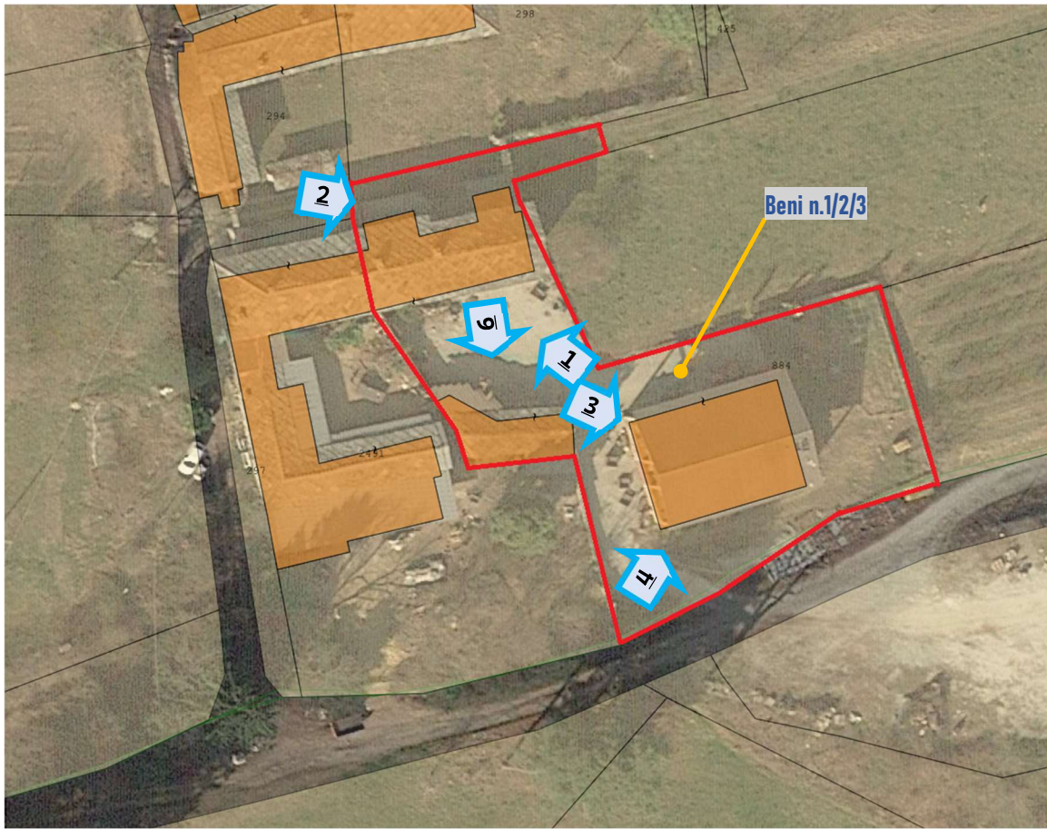
Vista aerea con individuazione dei Beni n.1/2/3 del Lotto n.1