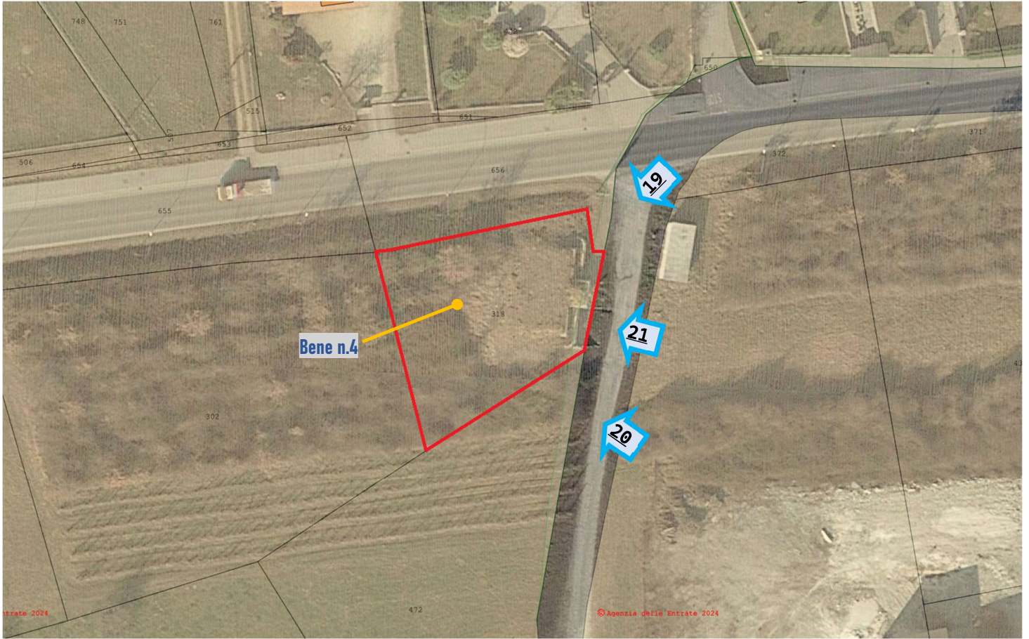
Vista aerea con individuazione del Bene n.4 del Lotto n.1