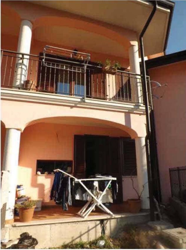
IL PORTICO E IL BALCONE SUL PROSPETTO EST