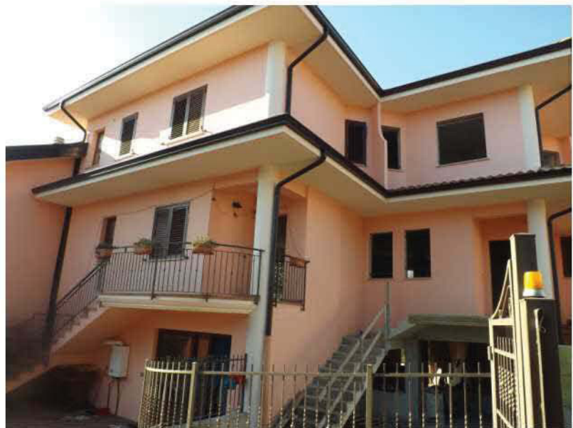
PROSPETTO SU VIA CHIESA (NORD)