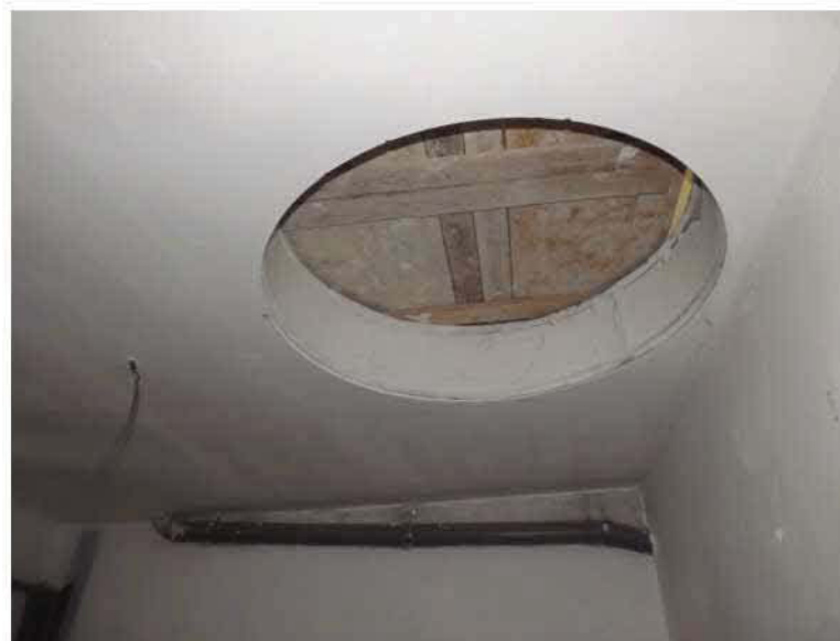
PARTICOLARE TAGLIO PER VANO SCALA