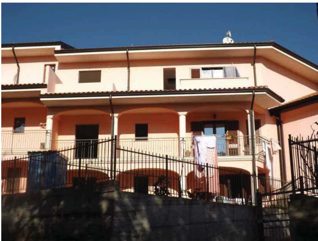
PROSPETTO SU STRADA PROVINCIALE (EST)