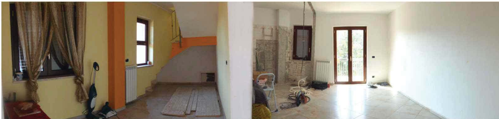
GLI AMBIENTI CHE COMPONGONO IL PRIMO PIANO