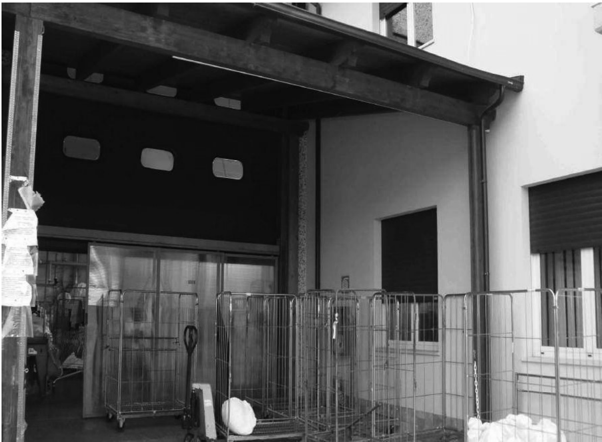
Foto 18. Esterno fronte