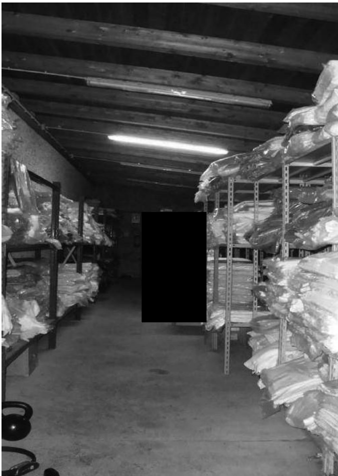
Foto 12. Laboratorio Lavanderia ampliamento.