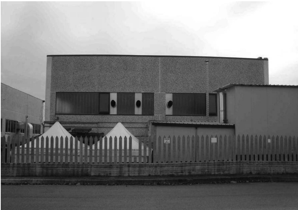
Foto 20. Esterno retro