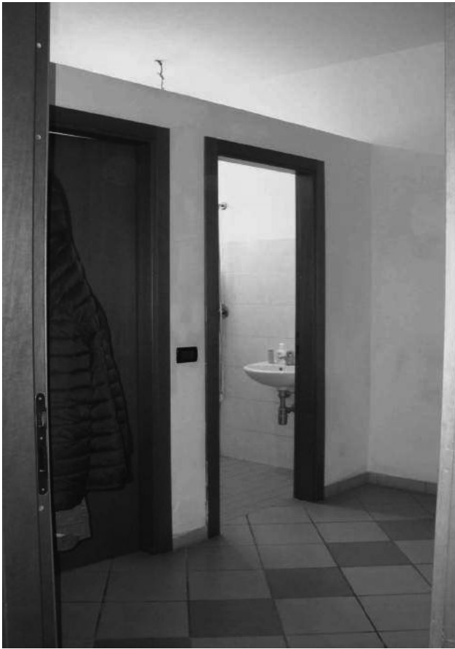
Foto 7. Bagni.