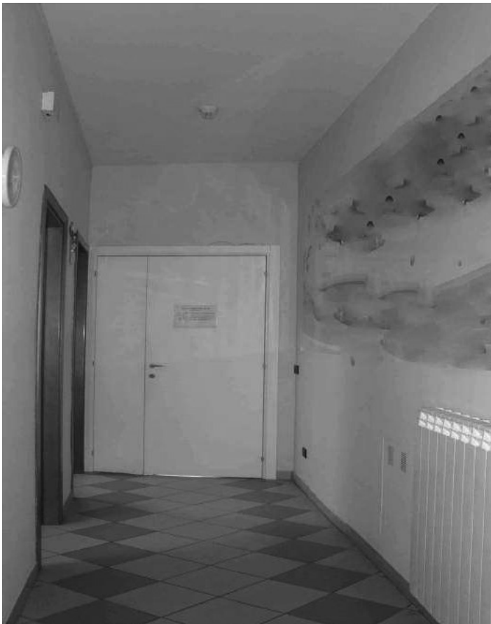
Foto 4. Disimpegno.