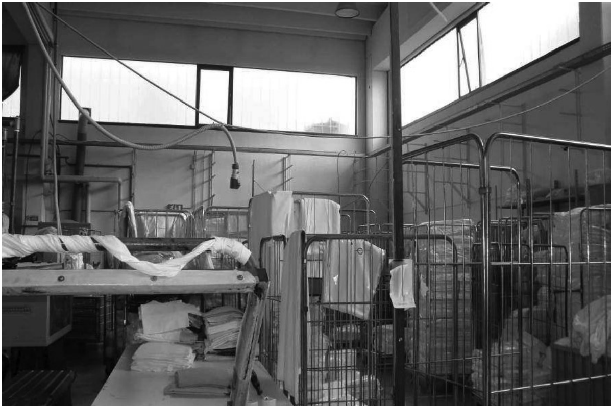
Foto 10. Laboratorio Lavanderia .