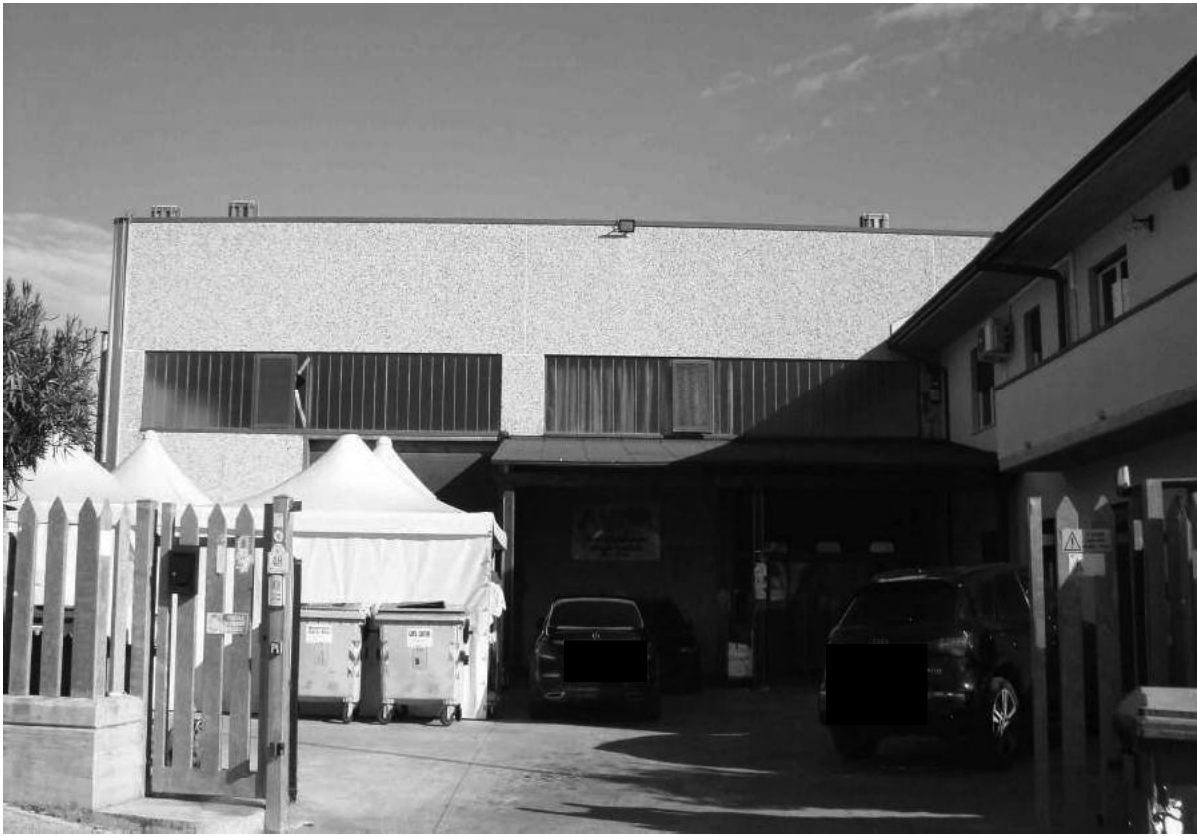
Foto 19. Esterno fronte