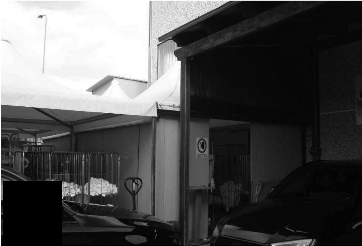
Foto 17. Esterno fronte