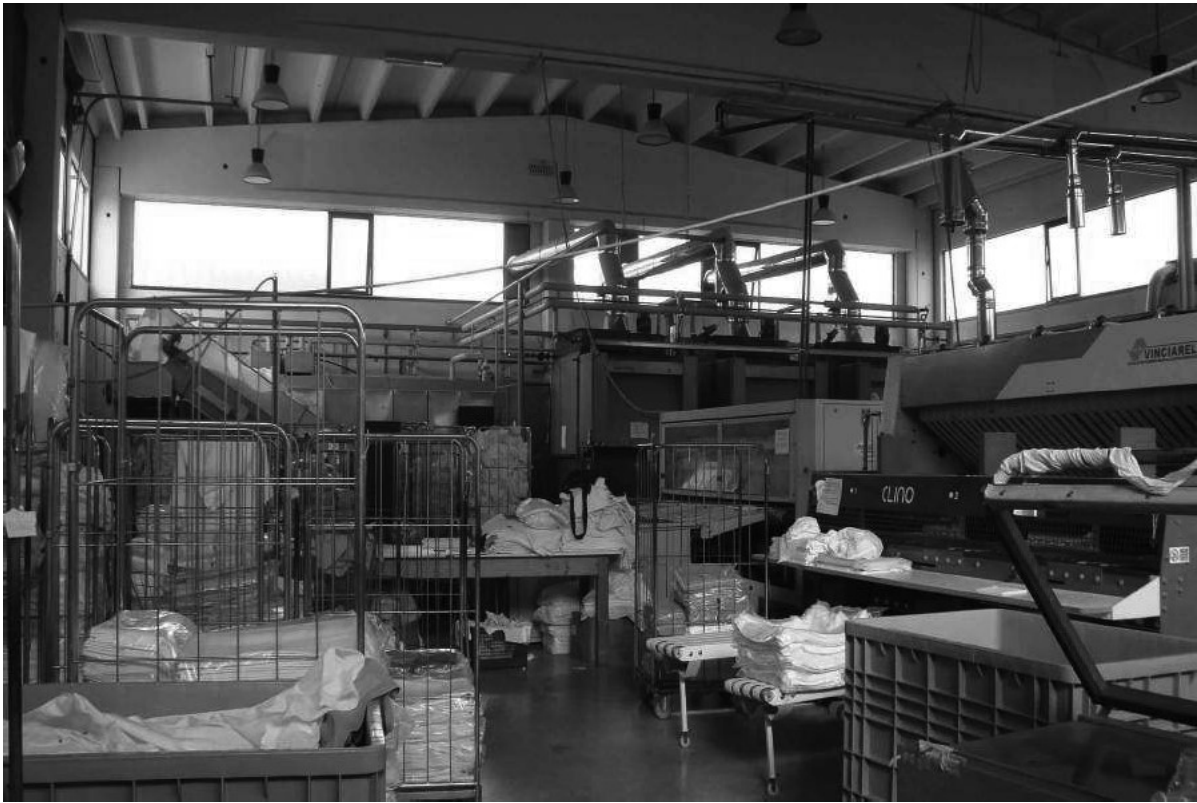
Foto 9. Laboratorio Lavanderia.