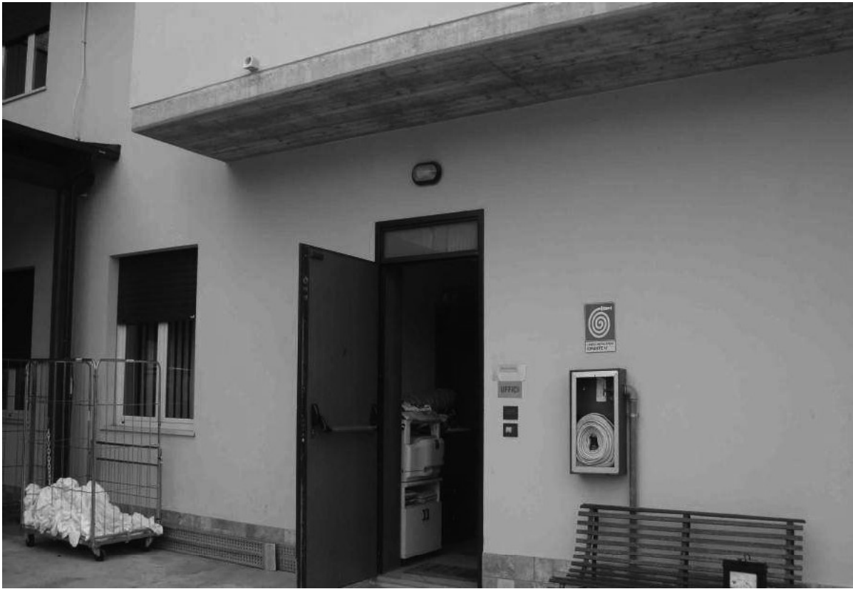
Foto 1. Accesso agli Uffici