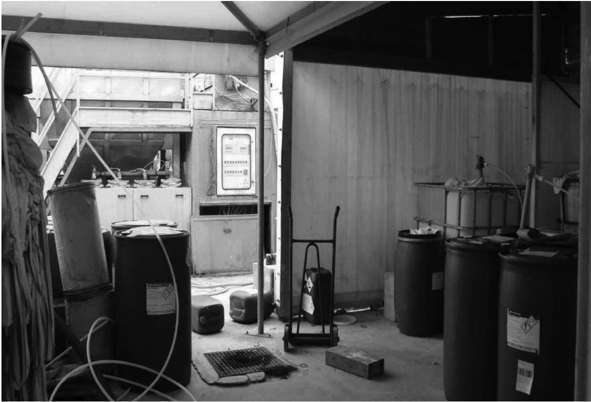
Foto 15. Esterno retro