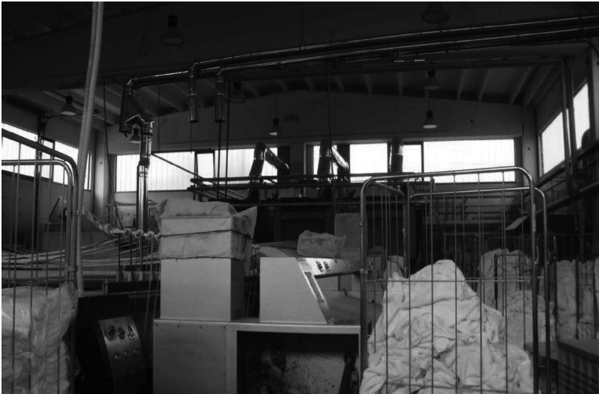
Foto 11. Laboratorio Lavanderia.