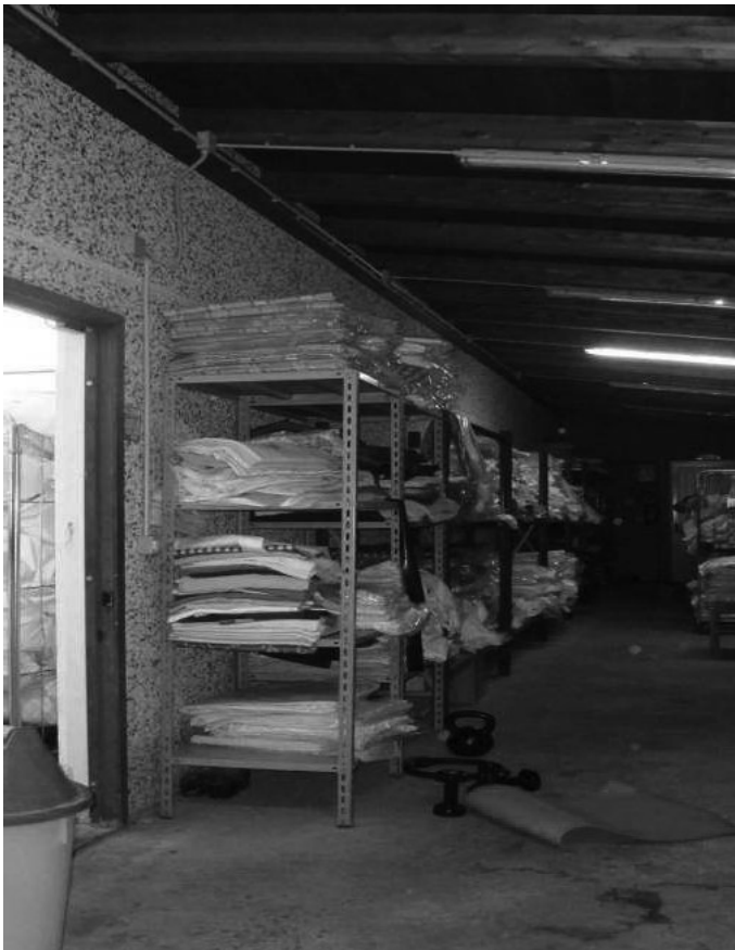
Foto 14. Laboratorio Lavanderia ampliamento.