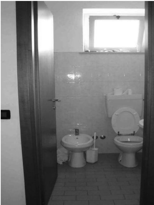
Foto 8. Bagni.