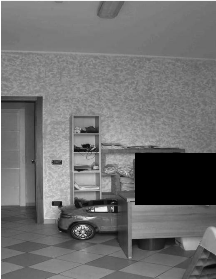
Foto 3. Ingresso.