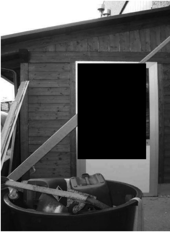
Foto 13. Laboratorio Lavanderia ampliamento.