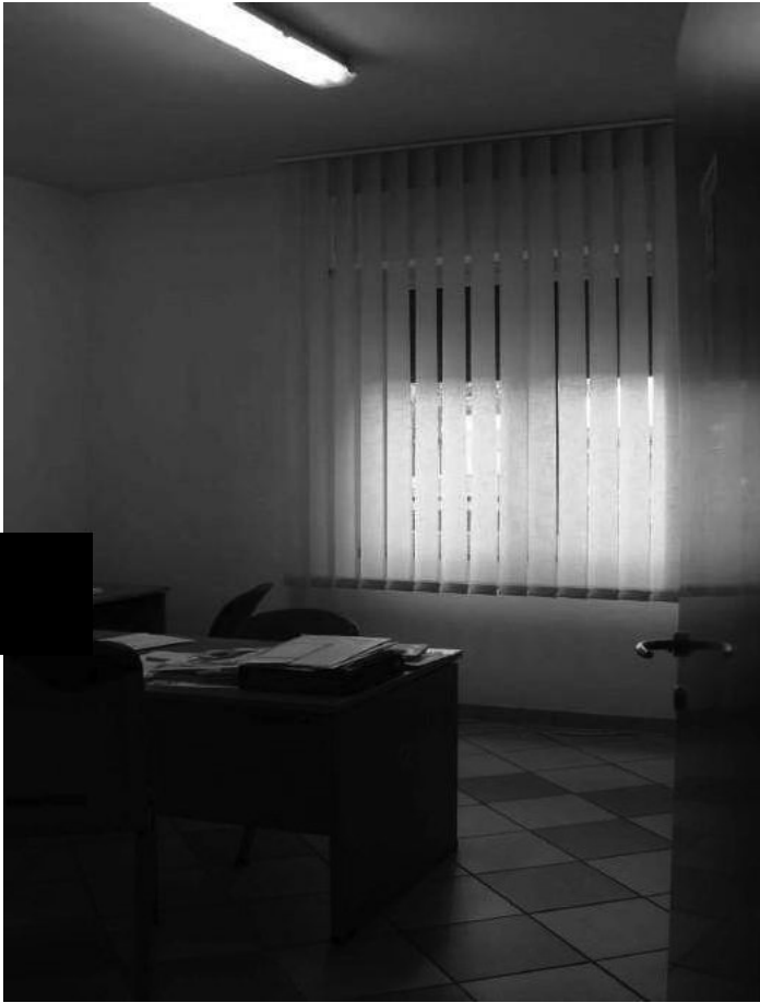
Foto 5. Ufficio 1.