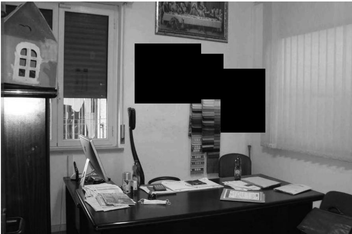
Foto 6. Ufficio 2.