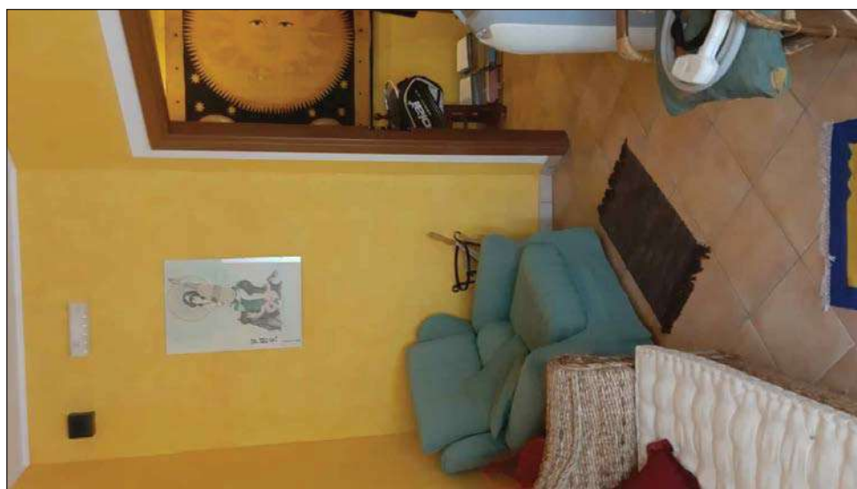
foto 4 - vista della sala d'attesa.