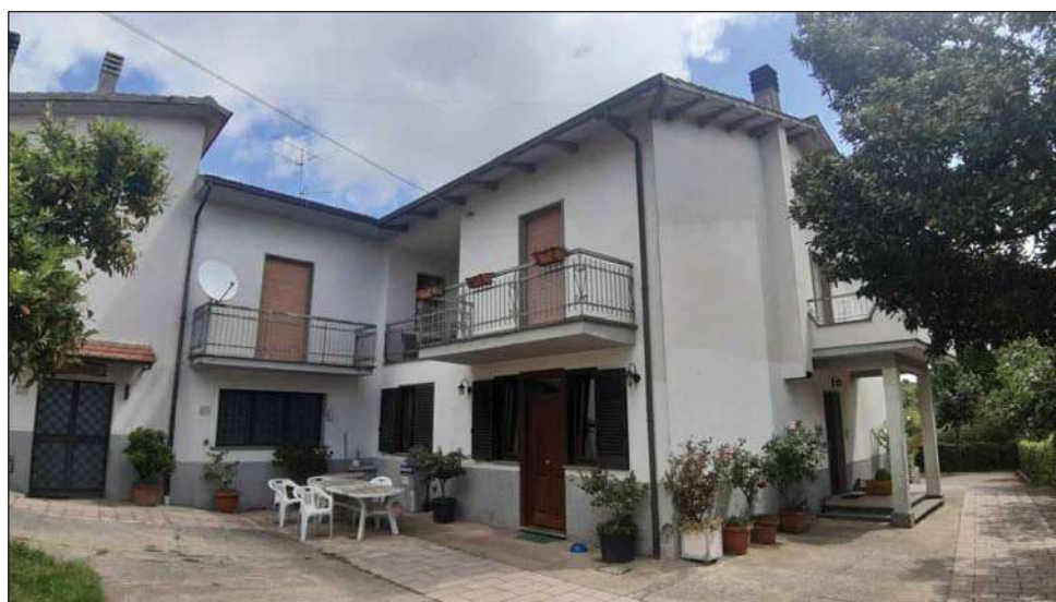
foto 2 - come sopra da altra angolazione con l'edificio nel quale sono posti gli immobili oggetto di Esecuzione.