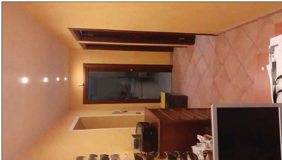
foto 5 - vista del corridoio.