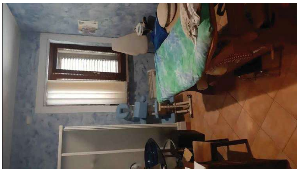
foto 7 - vista di un altro vano interno.