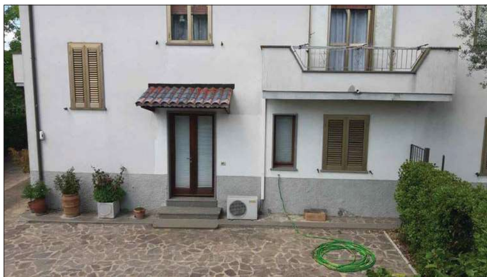
foto 3 - vista dell'ingresso al locale categoria C/3 di via Fiordini n. 52, p.T..