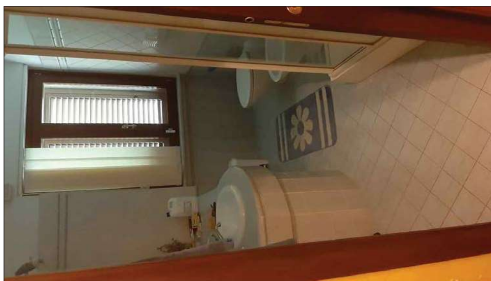
foto 8 - vista del bagno.