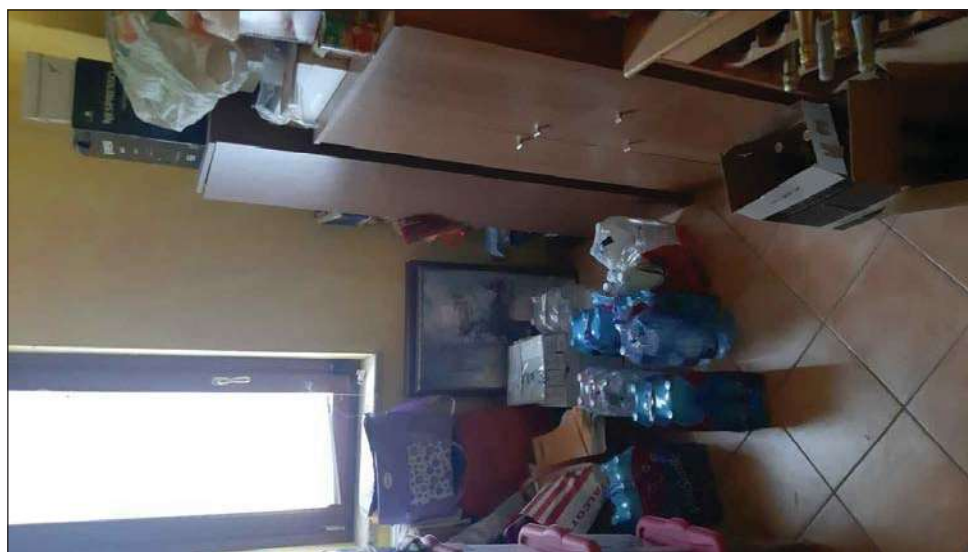
foto 9 - vista del piccolo vano.