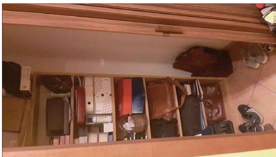
foto 10 - vista del ripostiglio.