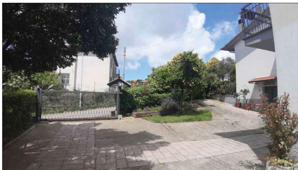
foto 1 - vista del piazzale di ingresso agli immobili oggetto di Esecuzione da via Fiordini.