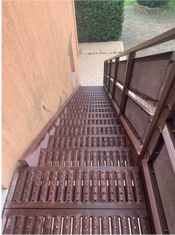
Scala esterna accesso sottotetto