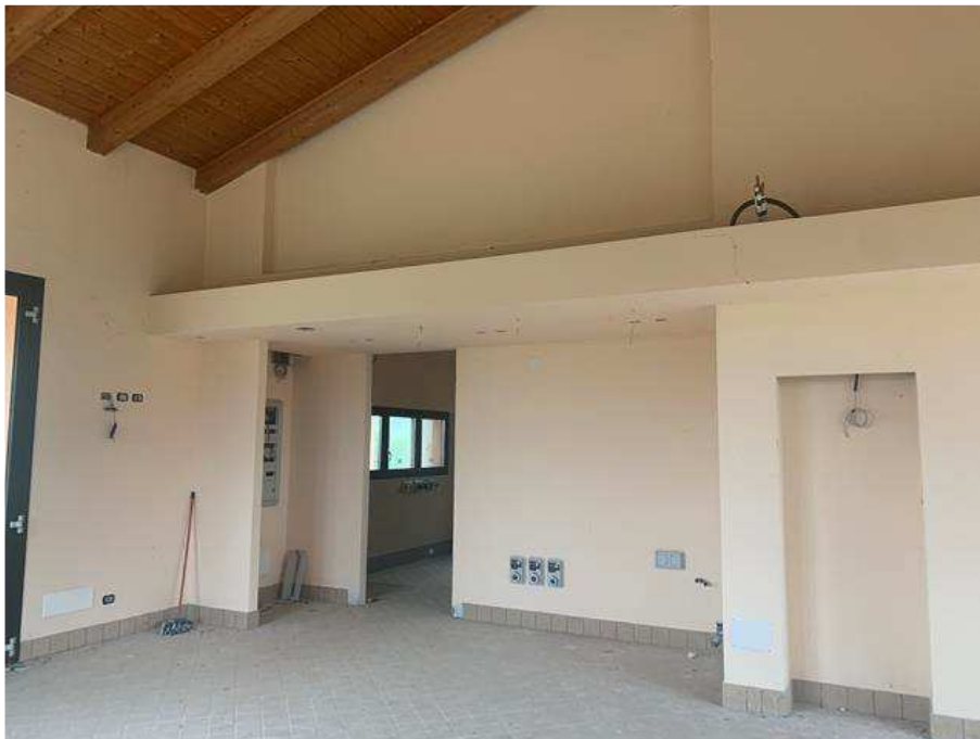
Piano terra salone