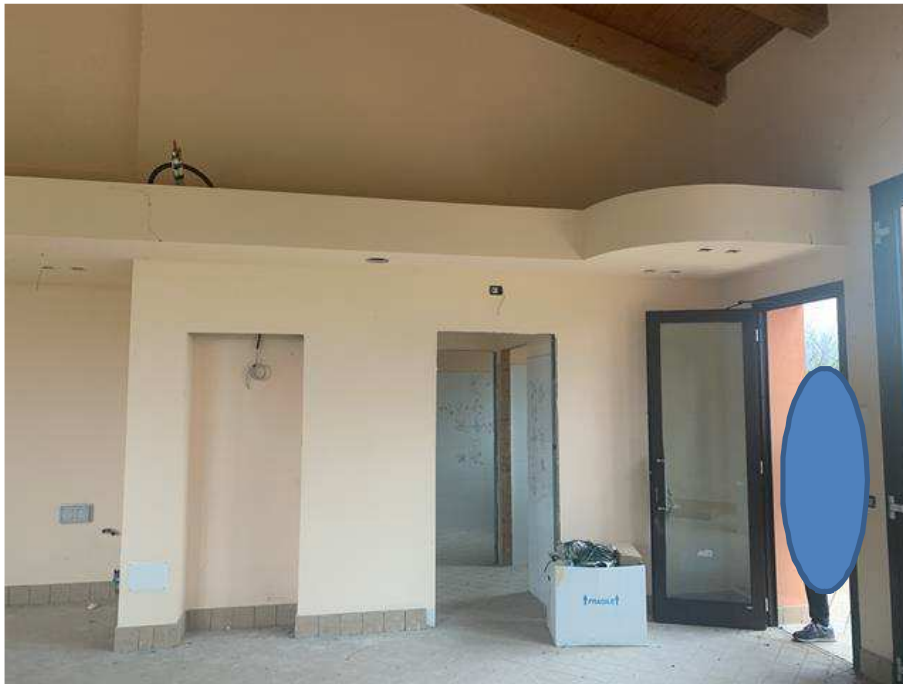
Piano terra salone