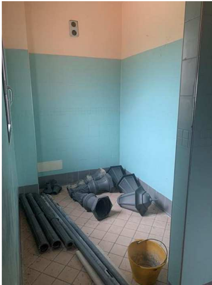
Dispensa e servizi