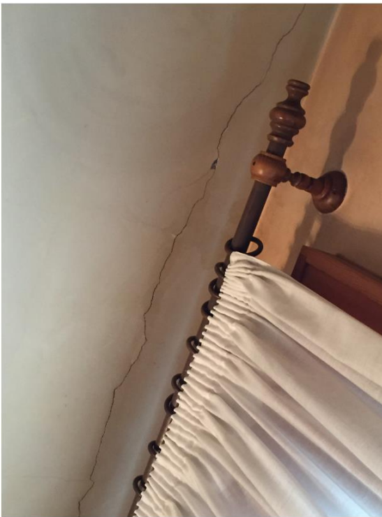
Camera da letto a sud - lesione