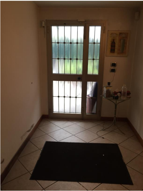
Ingresso piano terra –umidità di risalita