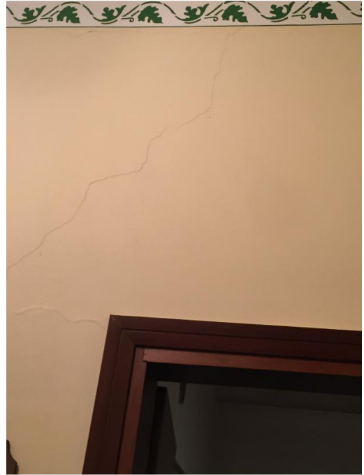
Comunicazione giorno-notte - lesione