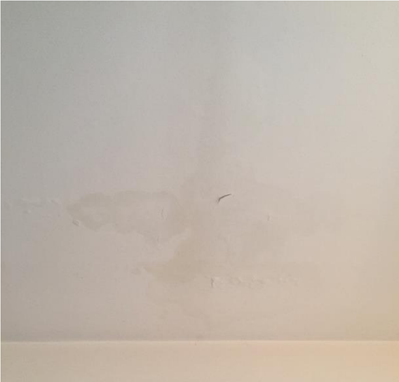
Ingresso primo piano - infiltrazione