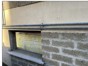
FOTO 5 - Accesso tamponato con tavolato posizionato all' interno del vano