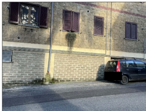
FOTO 3 - Prospetto Est fabbricato