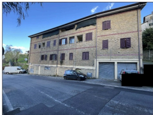
FOTO 2 - Prospetto Est Fabbricato