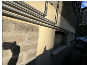
FOTO 6 - Accesso tamponato con tavolato posizionato all' interno del vano