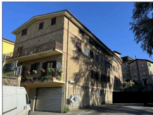
FOTO 1 - Prospetti Nord ed Est Fabbricato