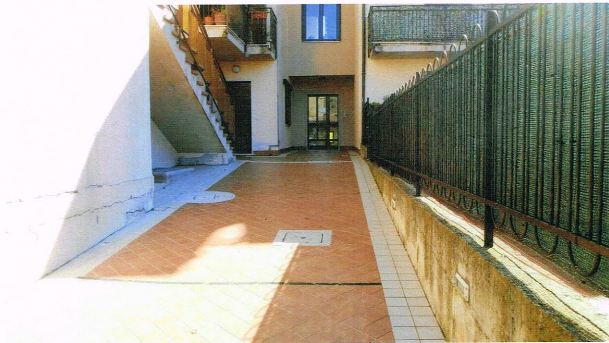
FOTO DEL VIALE CONDOMINIALE CHE CONDUCE AL PORTONE DI INGRESSO DELL'APPARTAMENTO PIGNORATO DI COLORE MARRONE SULLA SINISTRA