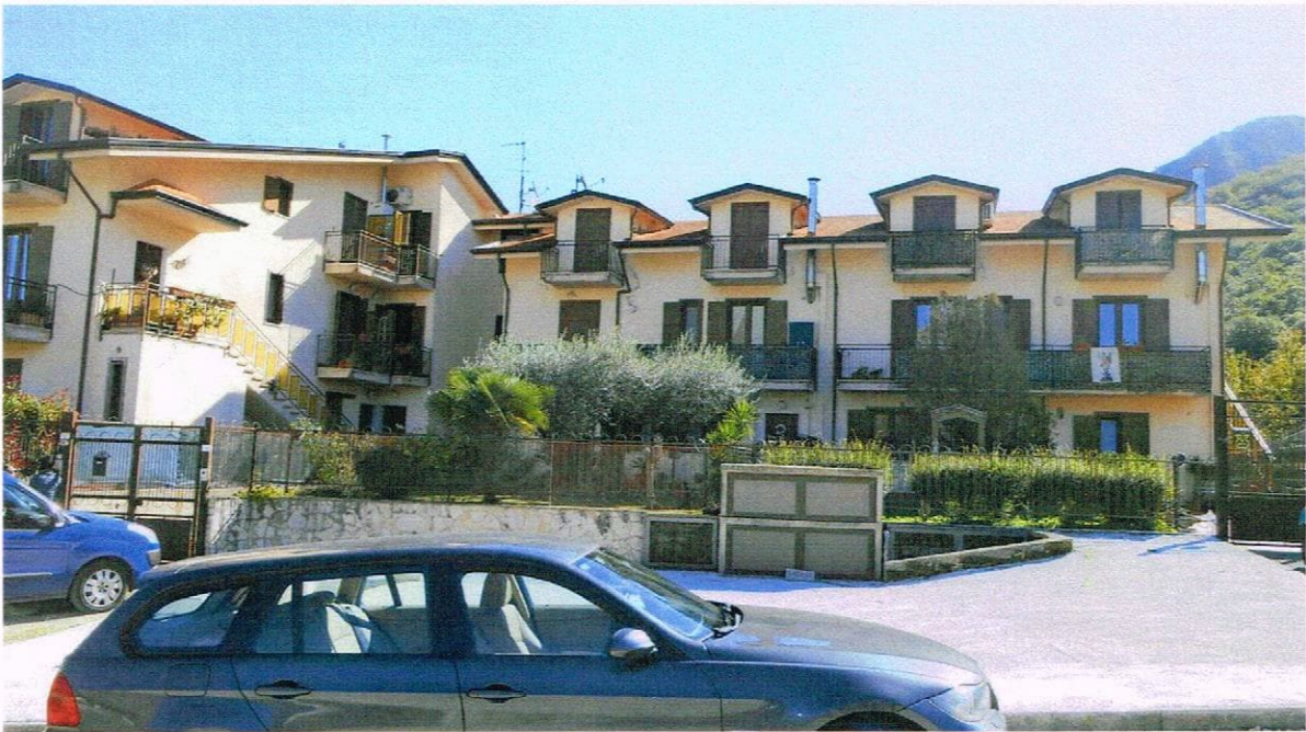
VISTA DEL CONDOMINIO PROSPETTO PRINCIPALE