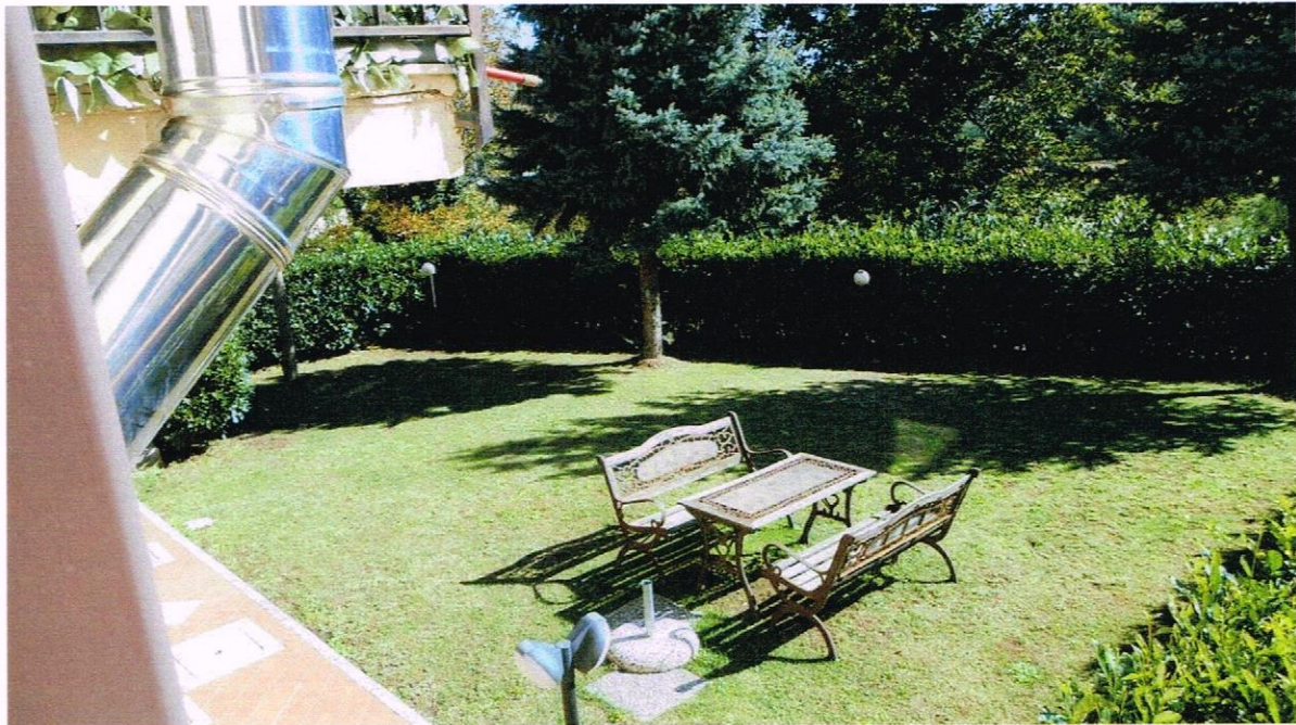
VISTA DEL GIARDINO ANNESSO ALL'APPARTAMENTO PIGNORATO