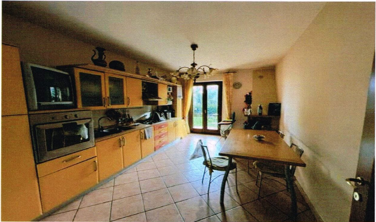
VISTA CUCINA E CAMERA DA LETTO APPARTAMENTO LOTTO N. 1 CORPO A