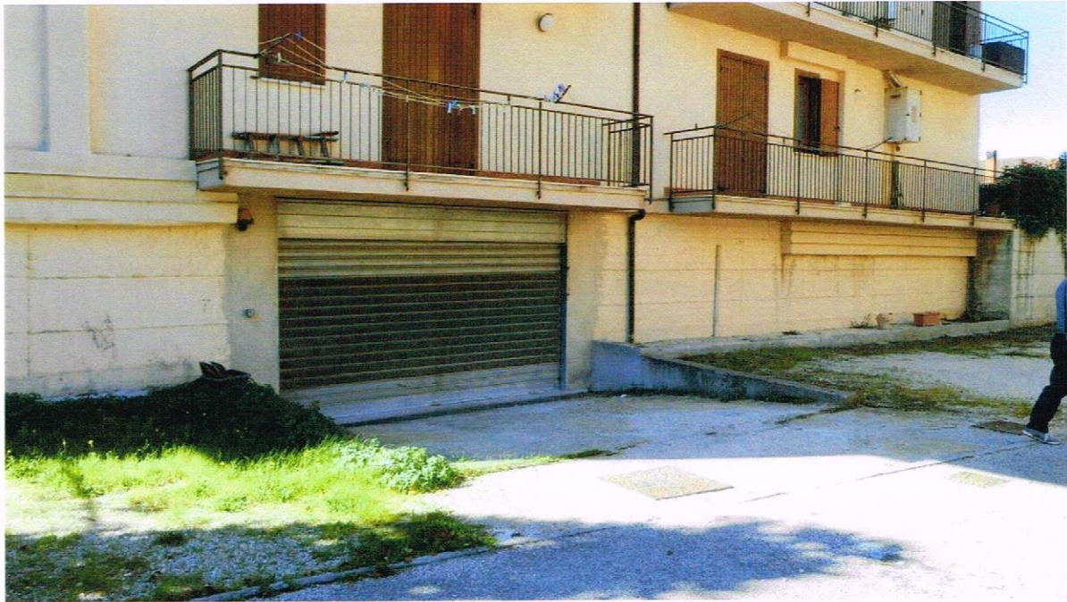
FOTO DELLA DELL'INGRESSO AL PIANO SEMINTERRATO