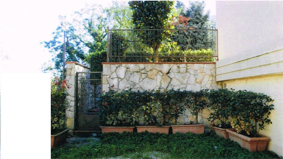
VISA DEL CANCELLETTO PRIVATO, CHE DAL PIANO DI INGRESSO AI GARAGE PORTA AL GIARDINO ANNESSO ALL'APPARTAMENTO