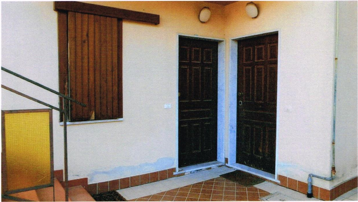
VISTA DEL PORTONE DI INGRESSO DI COLORE MARRONE ALL'APPARTAMENTO SUL LATO DESTRO