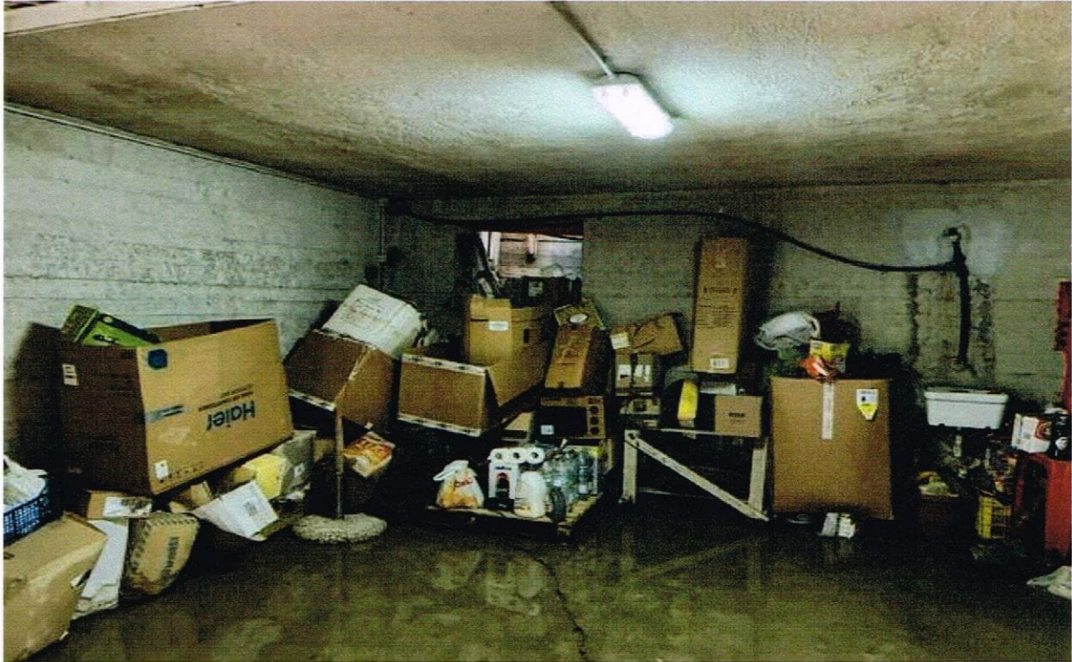
VISTA INTERNA DEL GARAGE AL PIANO SEMINTERRATO – FG. 4 P.LLA 677 SUB 4