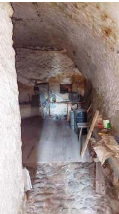
Parte d'ingresso a PT