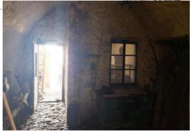
Altra stanza a PT