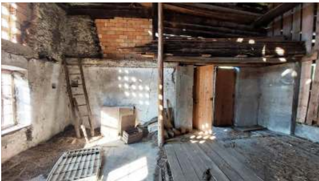
Vista da sud