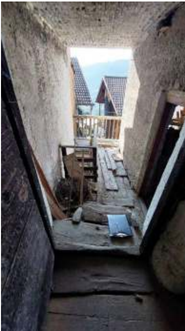
Vano scala a P1