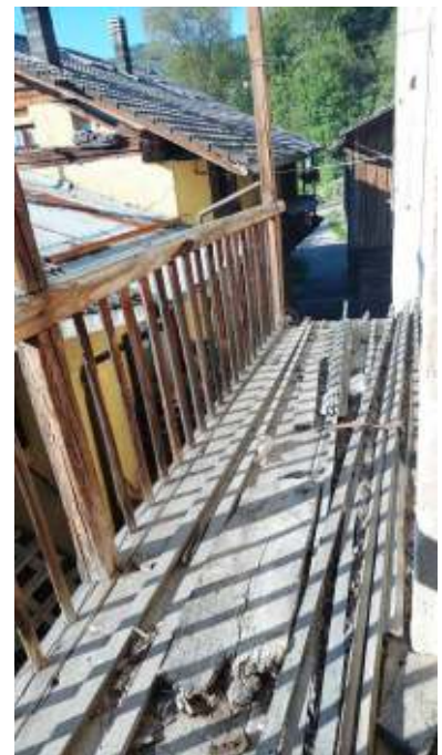
Balcone a P1