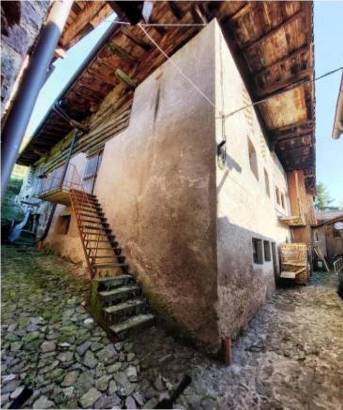
Vista dala strada d'accesso