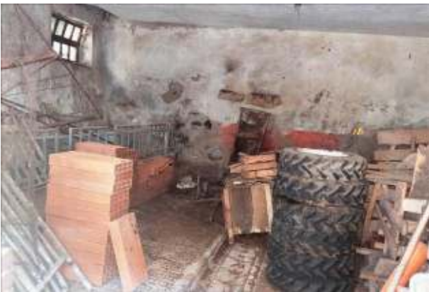
Stalla p.ed. 361/1