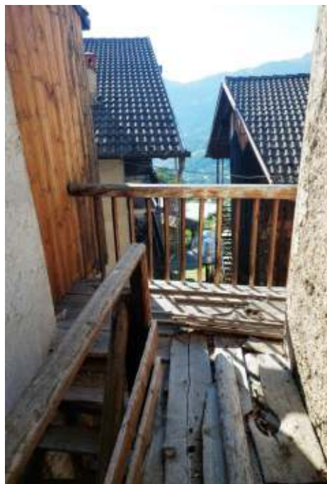
Scla e ballatoio a P1