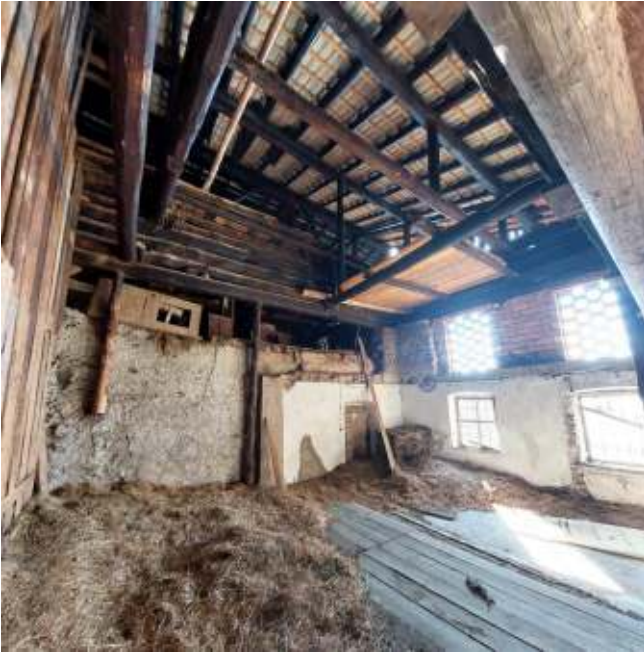
Foienile p.ed. 361/1