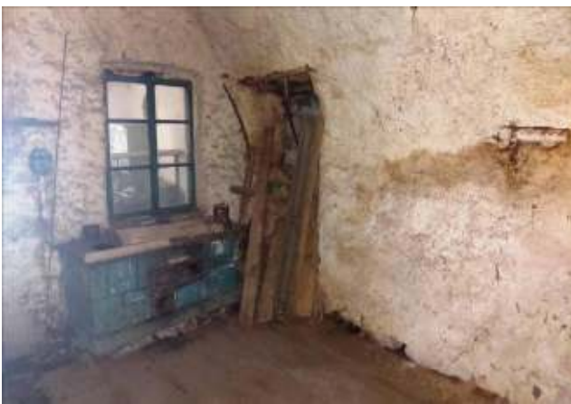
Dettaglio stanza a PT