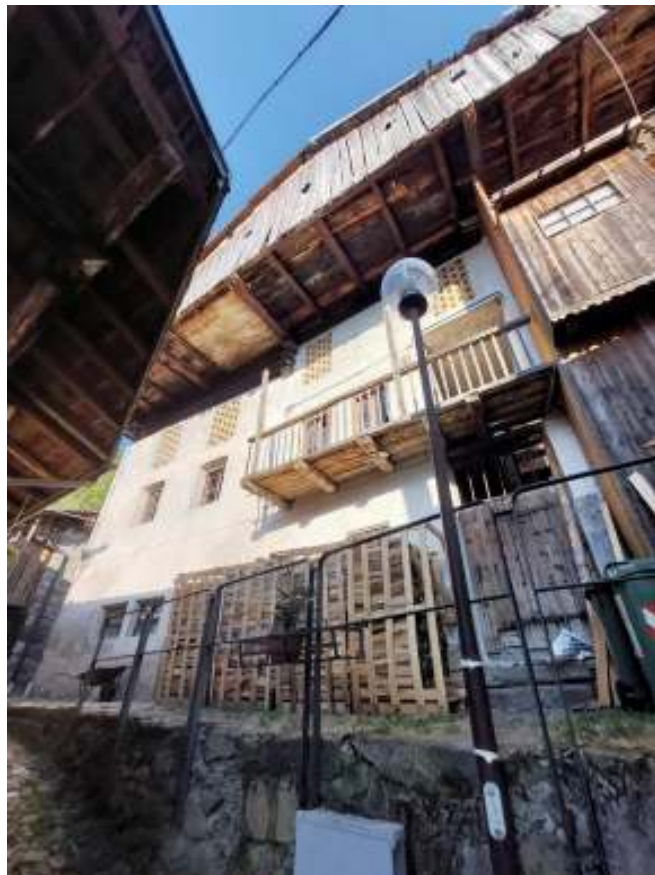
LOTTO N. 2 Rustico da ristrutturare Maso Zimeti - Fierozzo (TN)