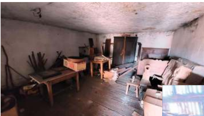
Stanza a P1