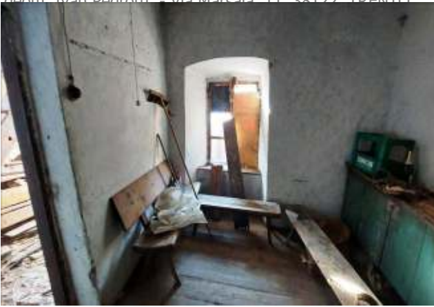
Stanza a PT p.ed. 361/2