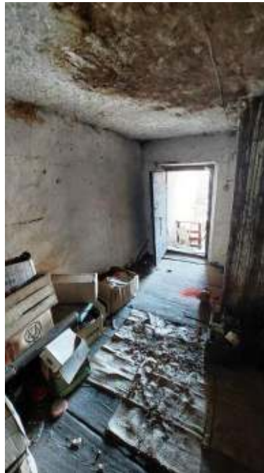
Stanza a P1