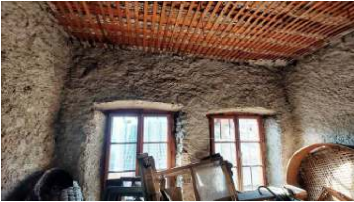
Stanza a P1 p.ed. 361/2