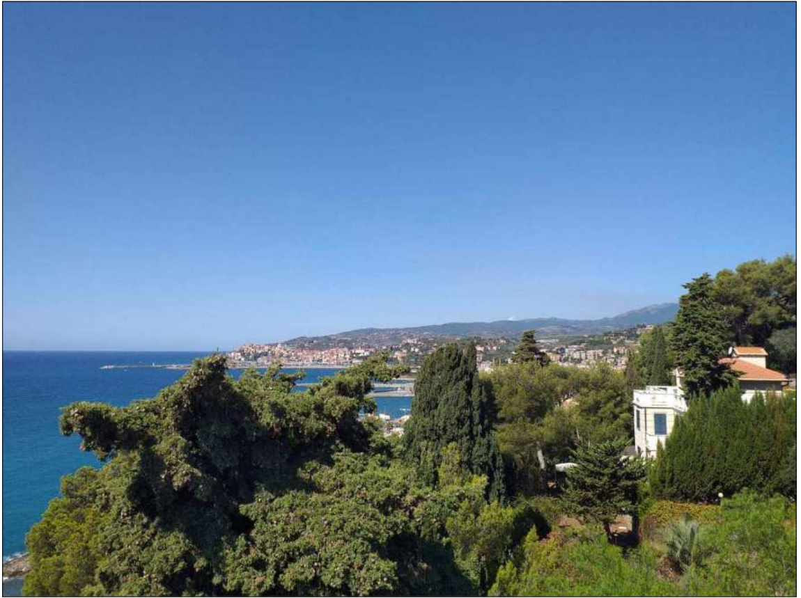
Vista dal lastrico sub 22