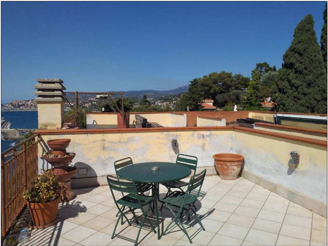
Dal lastrico sub 21 (non oggetto di perizia) ripresa verso il sub 22 e 23