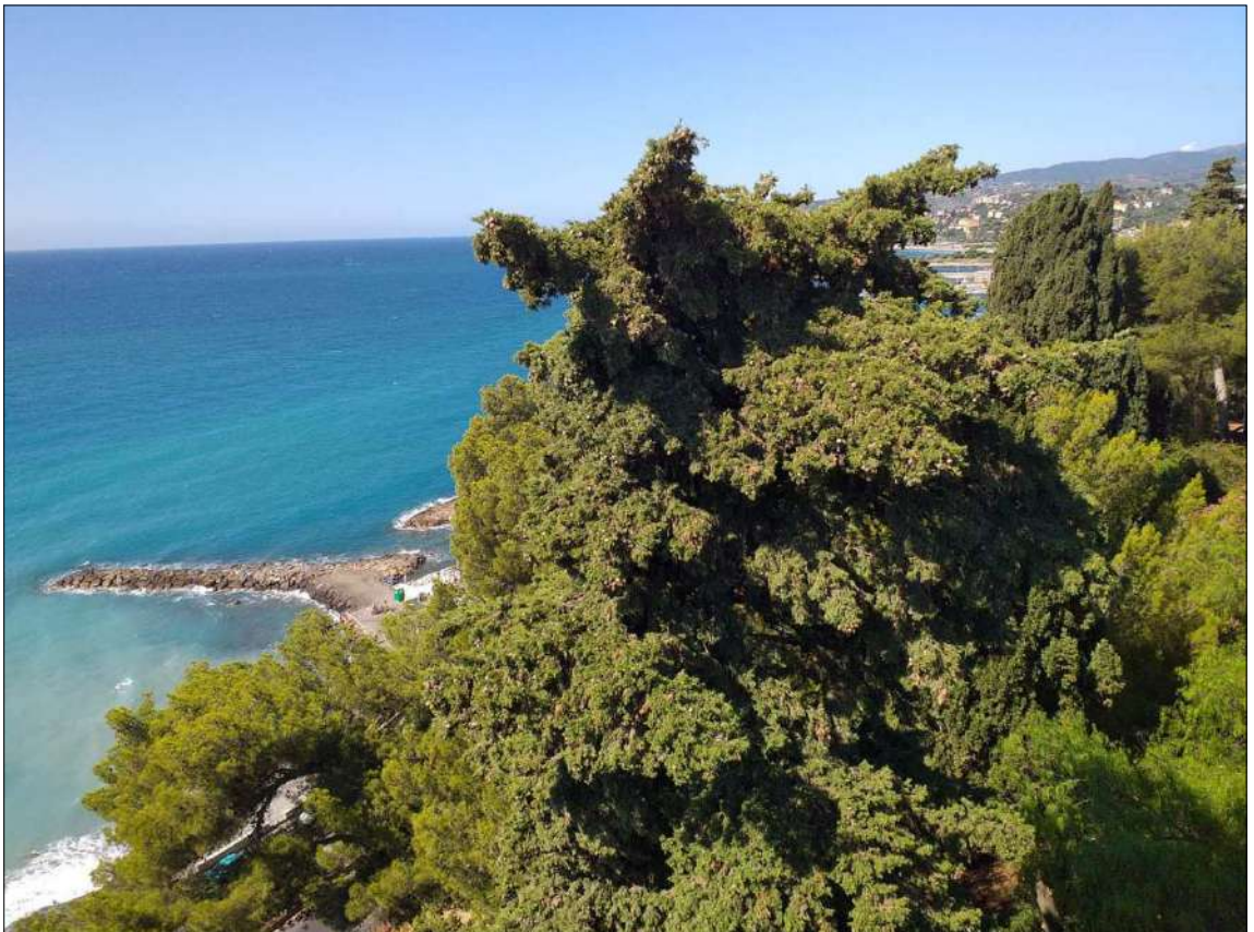
Vista dal lastrico sub 23