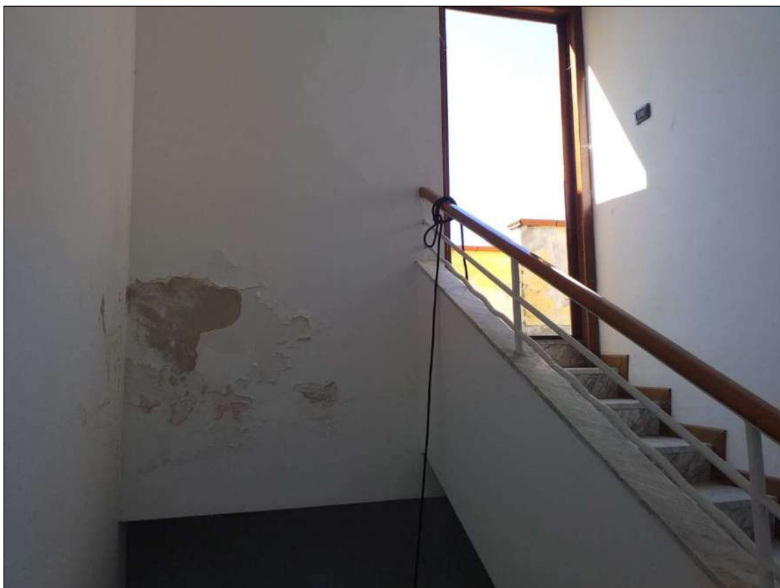
La scala condominiale raggiunge la copertura a lastrico solare