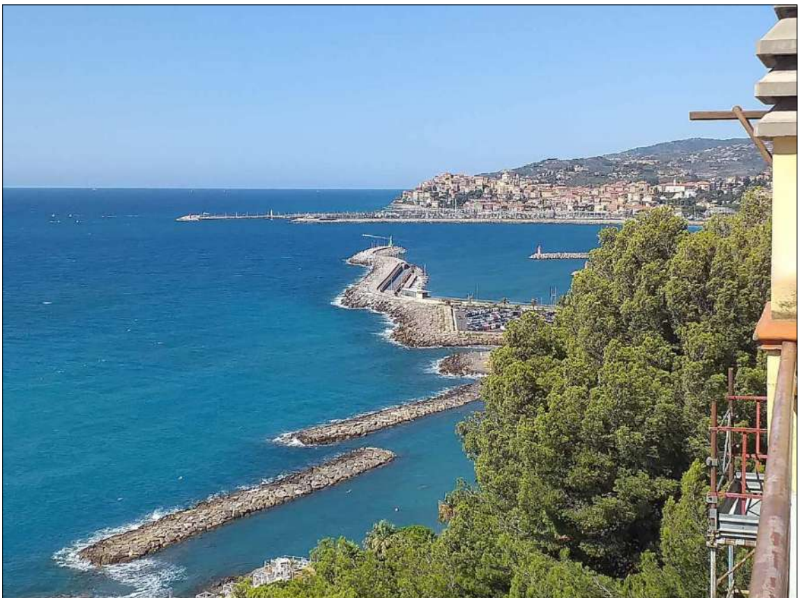
Vista dai lastrici sub 20 e 22