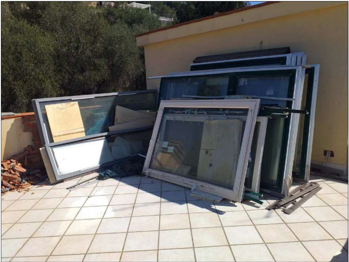
Altra ripresa del lastrico sub 23