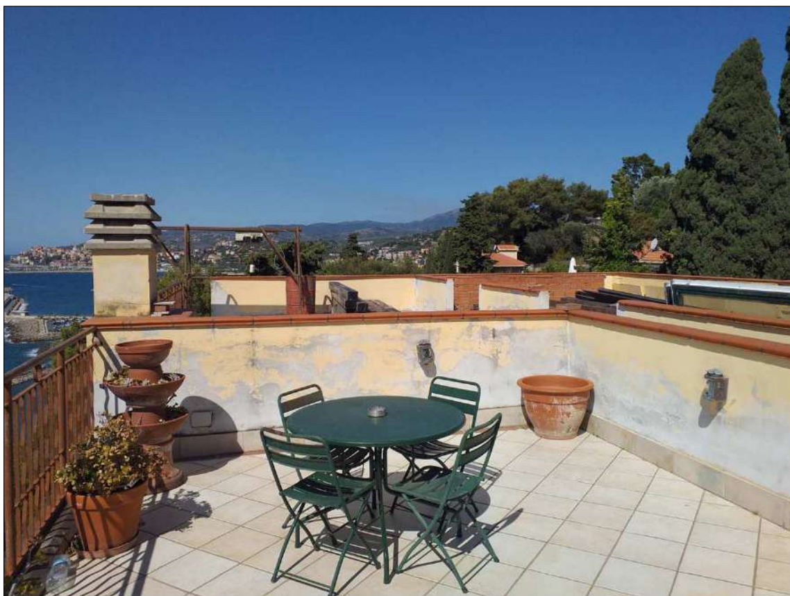
Dal lastrico sub 21 (non oggetto di perizia) ripresa verso il sub 22 e 23