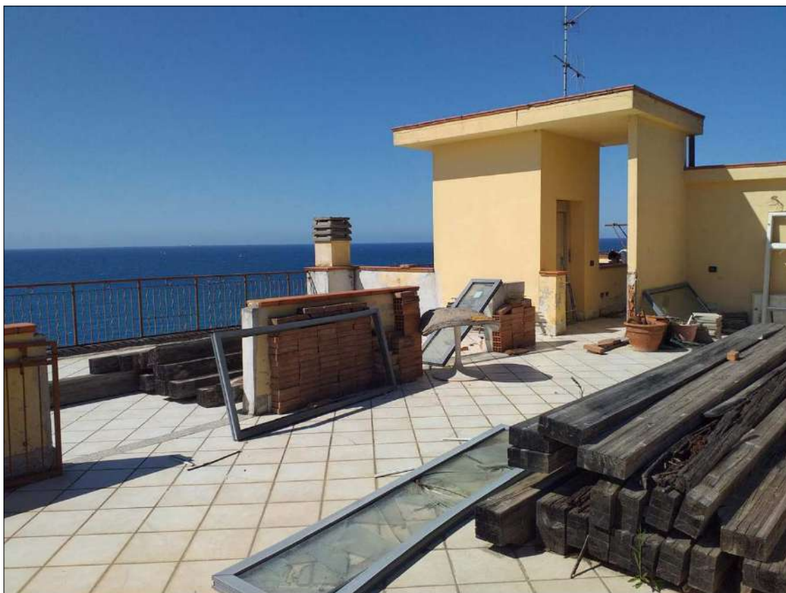
In primo piano il sub 19, verso mare il sub 20