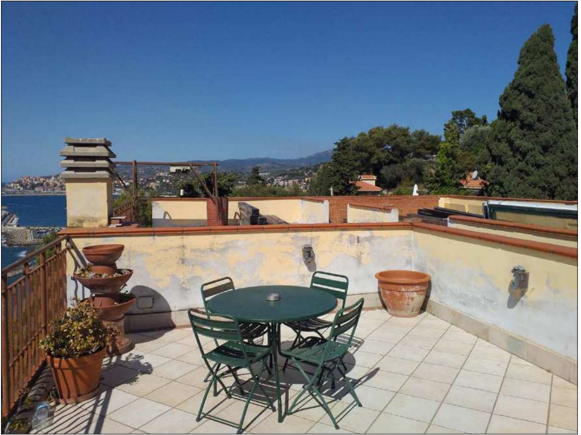
Dal lastrico sub 21 (non oggetto di perizia) ripresa verso il sub 22 e 23