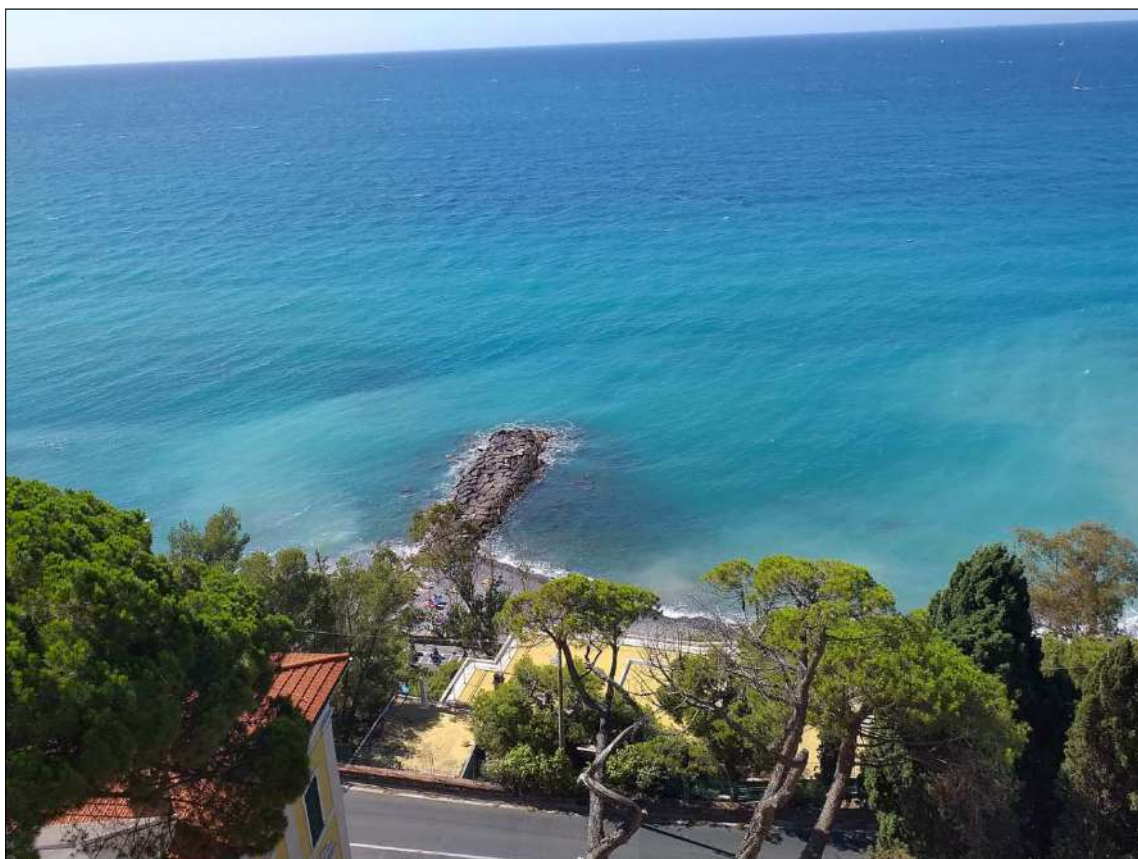
Vista dai lastrici sub 20 e 22