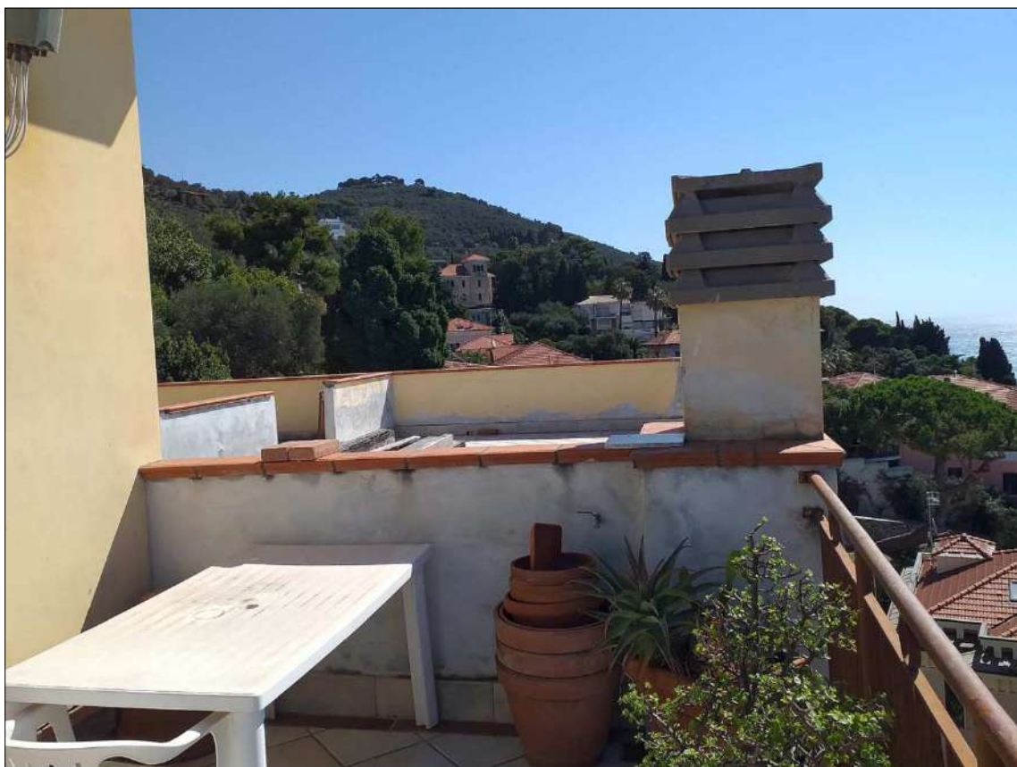
Dal lastrico sub 21 (non oggetto di perizia) ripresa verso il sub 20