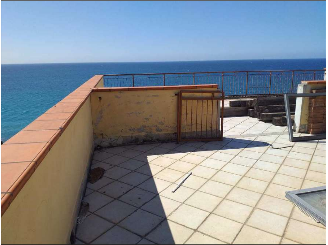
Come sopra, altra ripresa