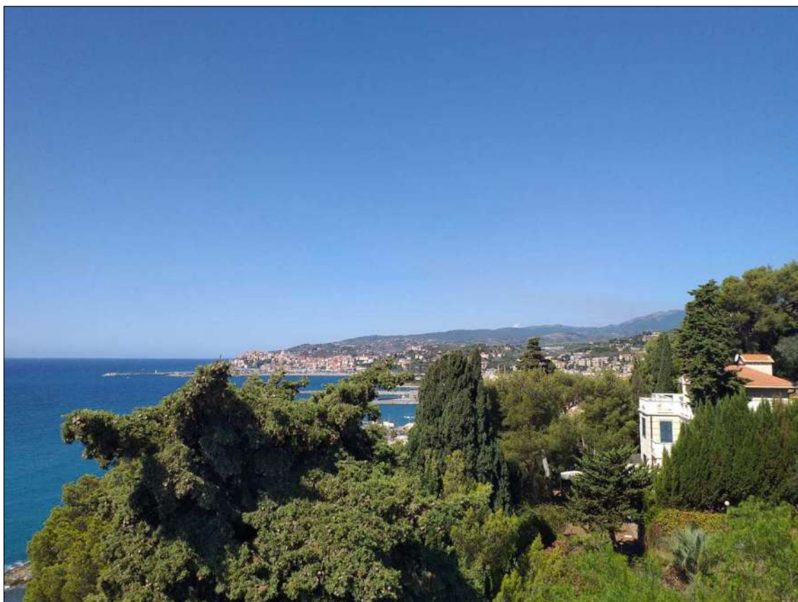
Vista dal lastrico sub 22