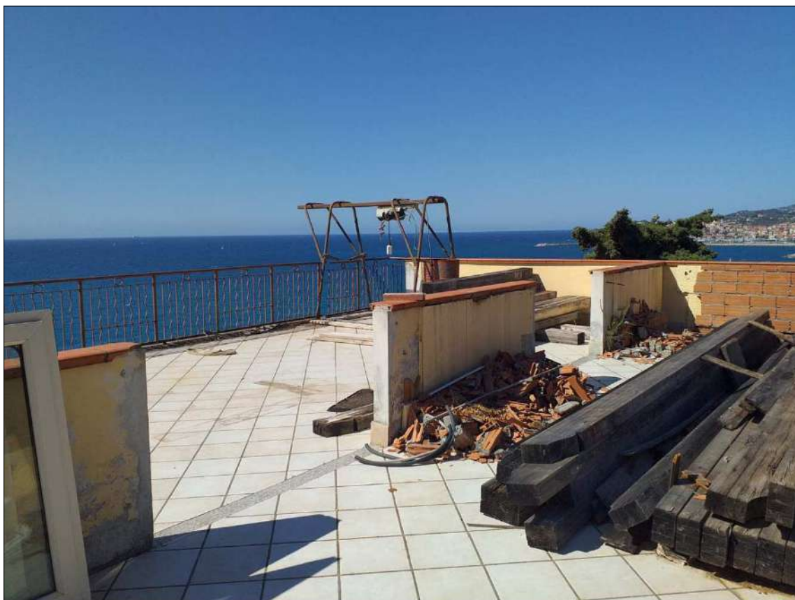
I lastrici sub 22 e 23