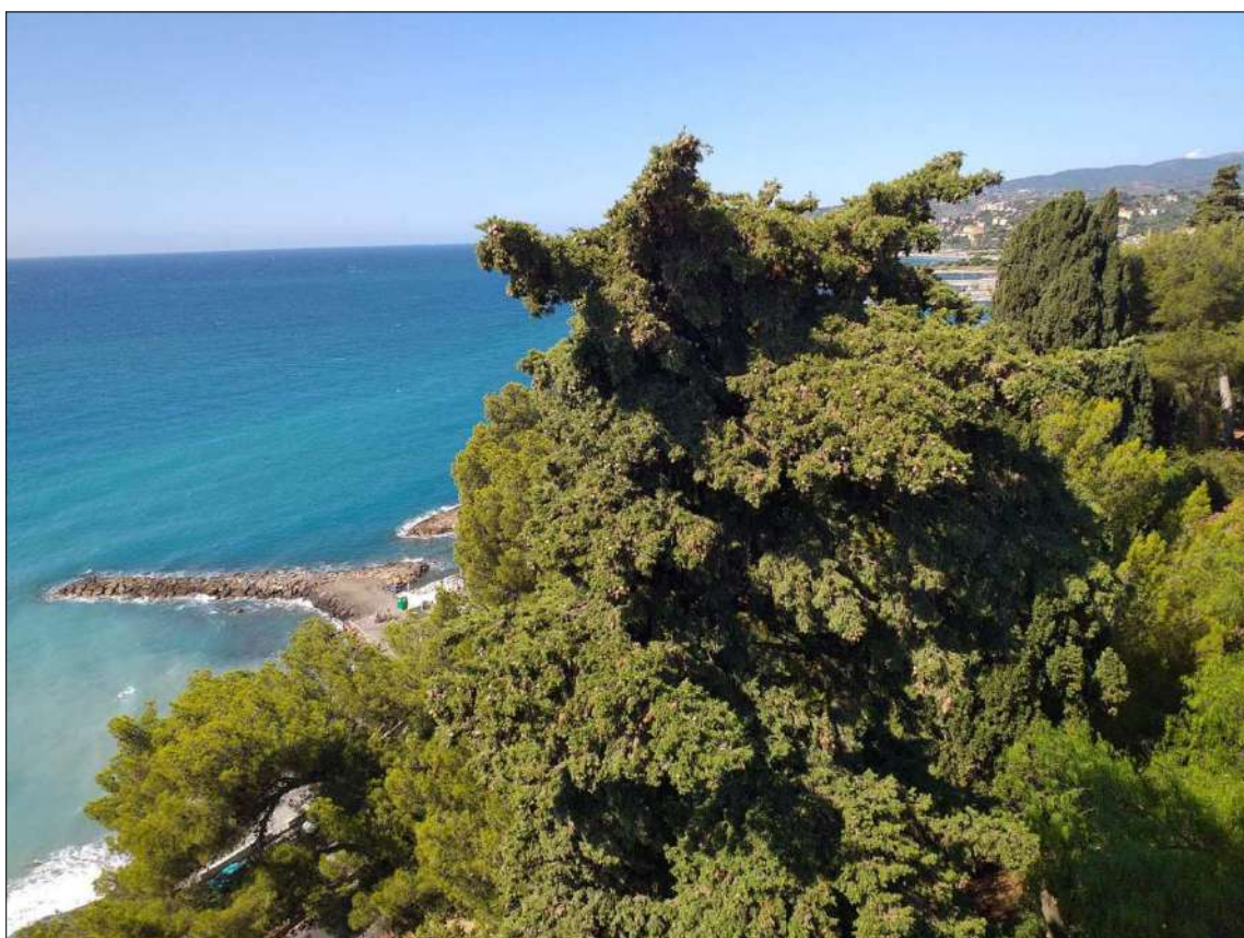
Vista dal lastrico sub 23