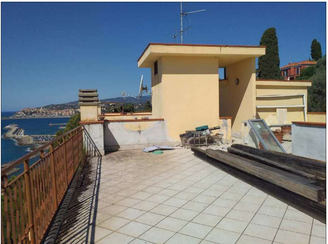
Il lastrico sub 20