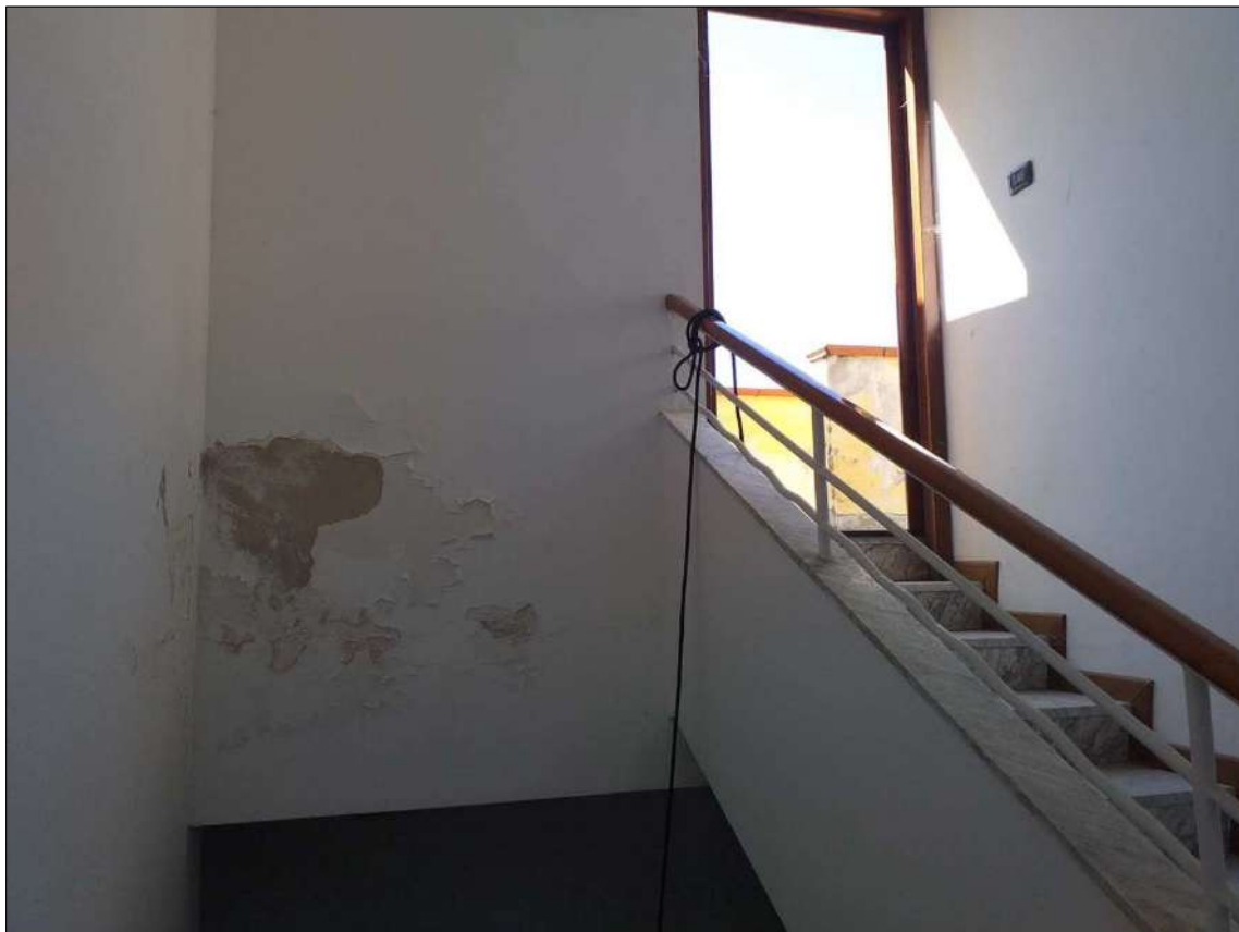
La scala condominiale raggiunge la copertura a lastrico solare