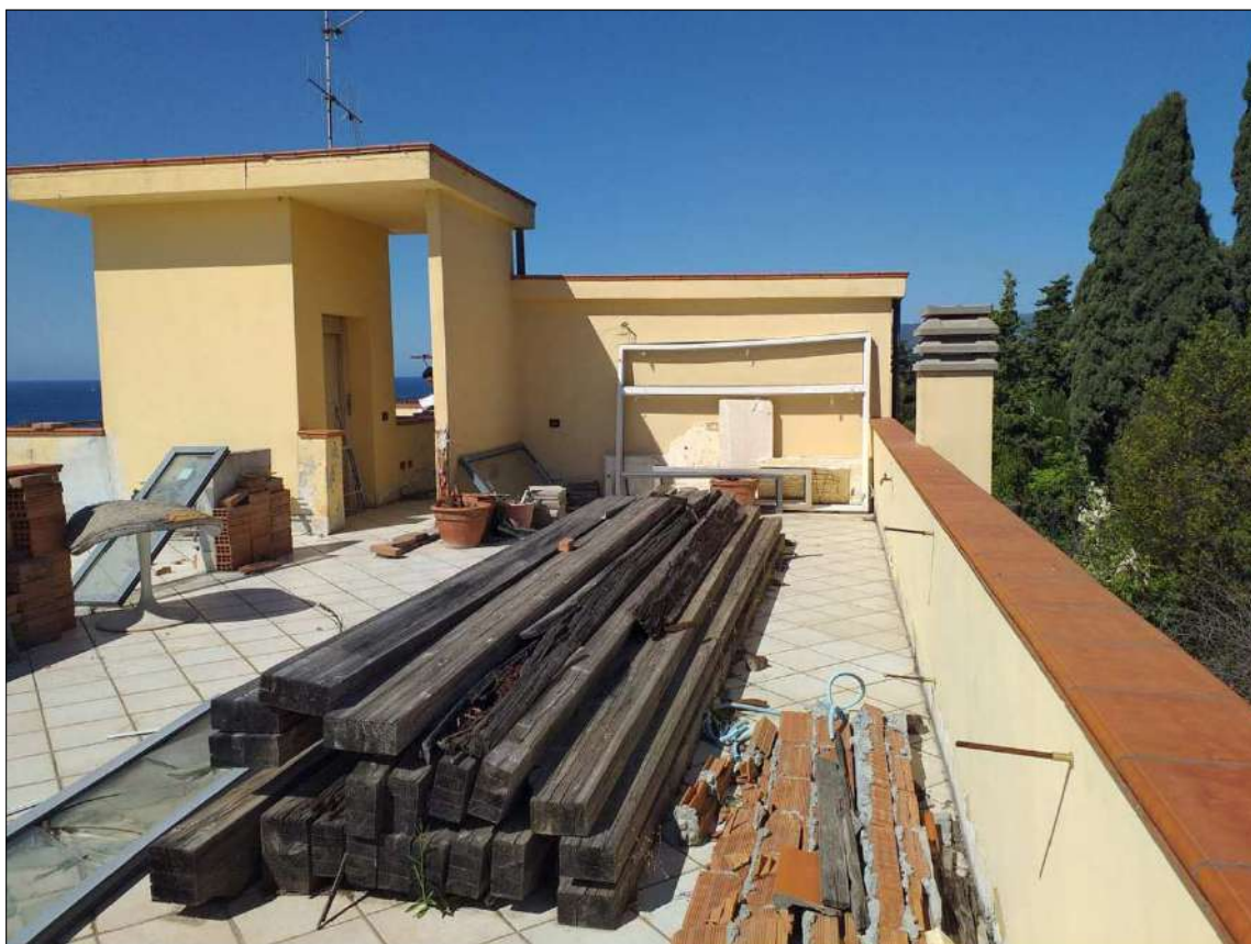
Il lastrico sub 19