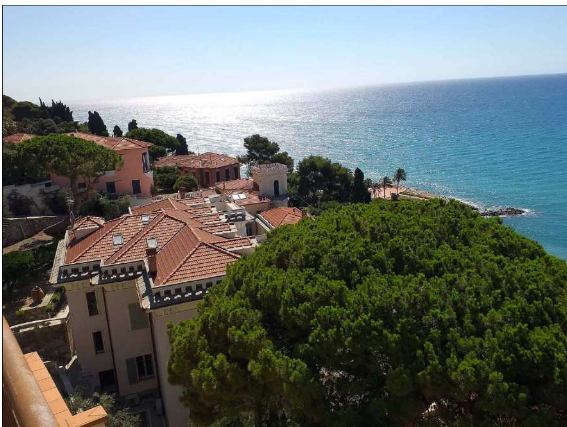
Vista dai lastrici sub 20 e 22