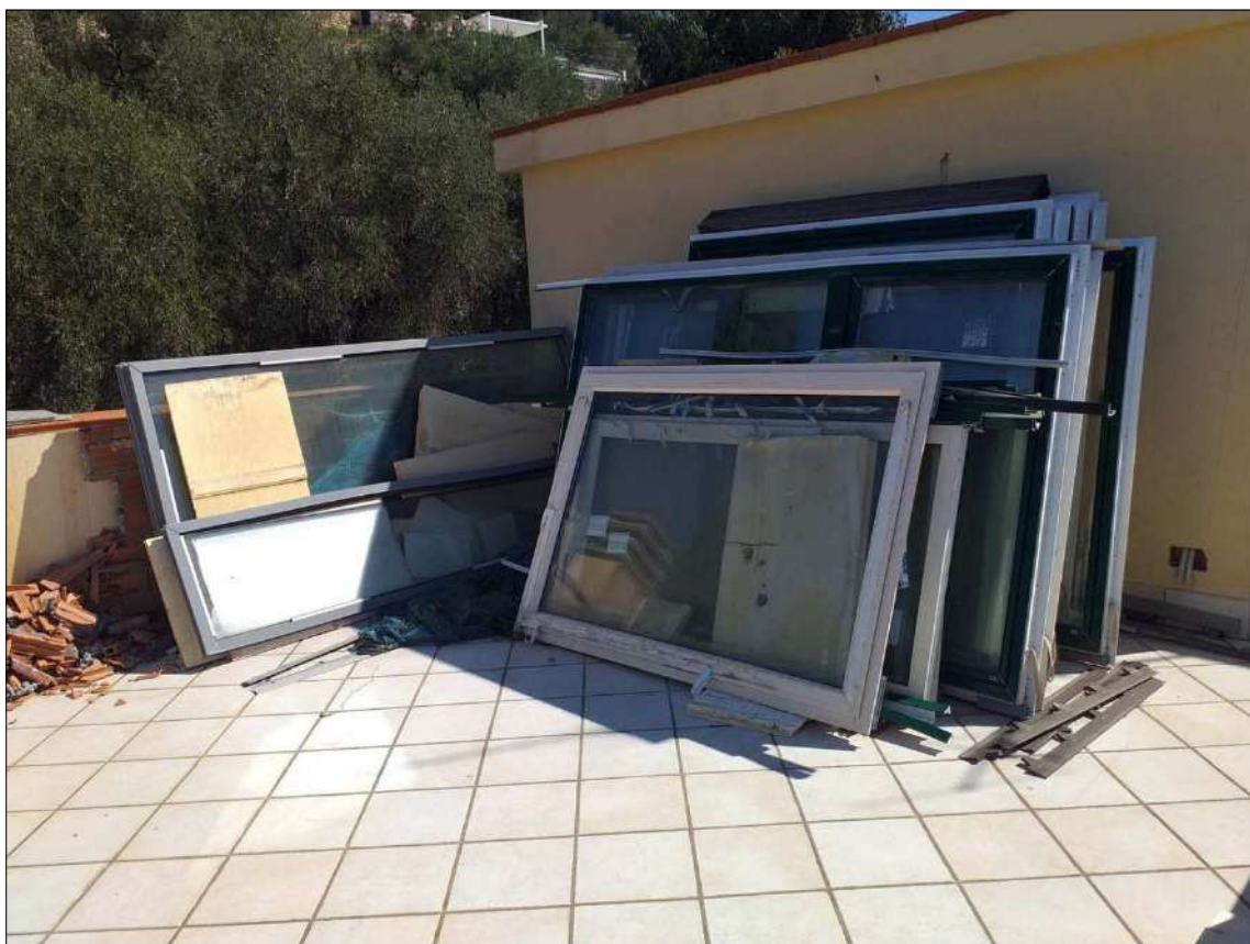
Altra ripresa del lastrico sub 23