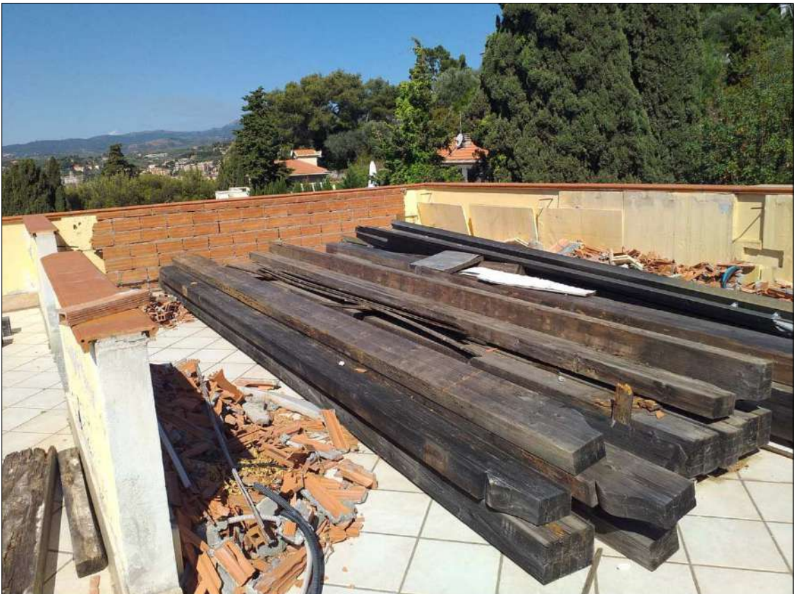
Il lastrico sub 23