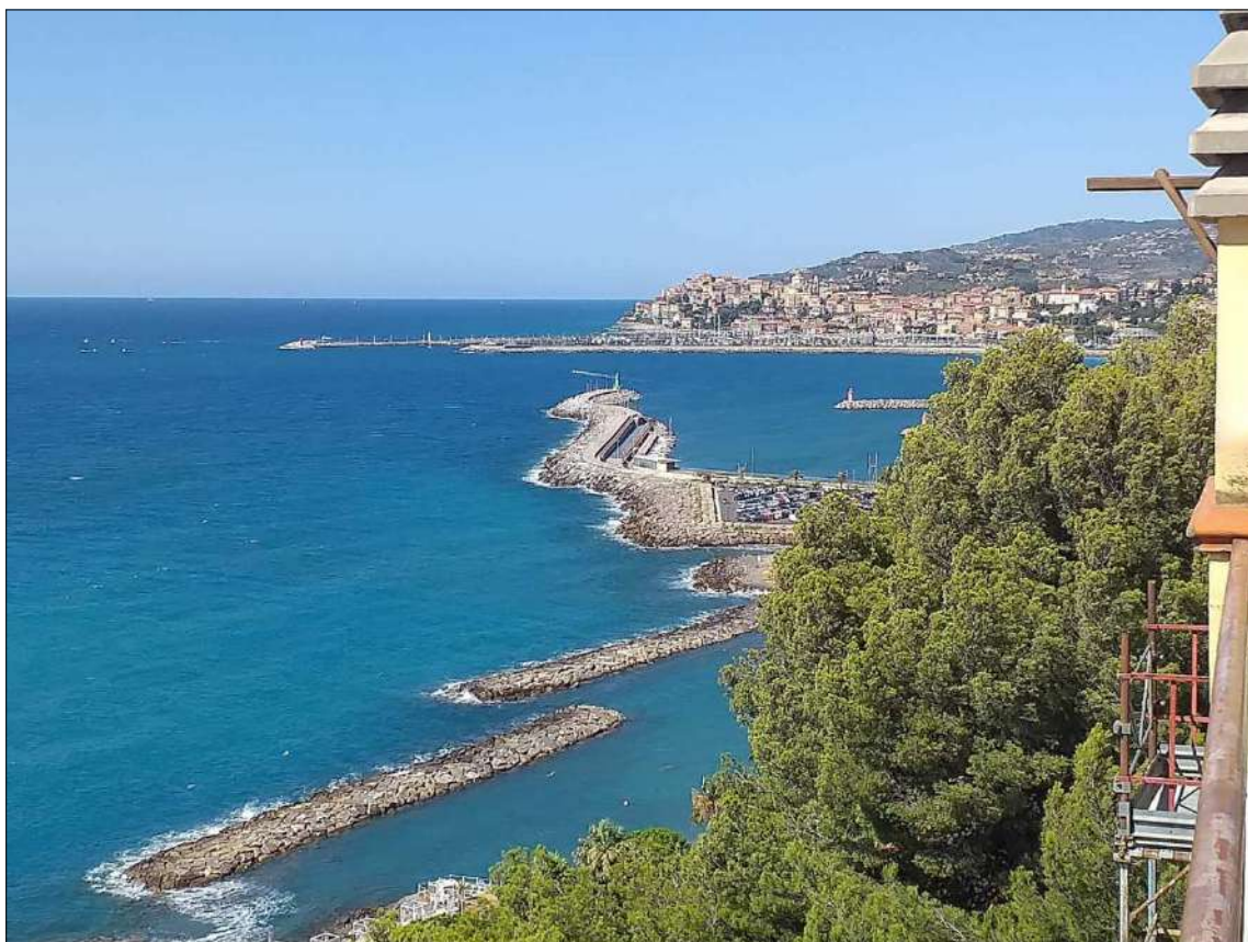
Vista dai lastrici sub 20 e 22