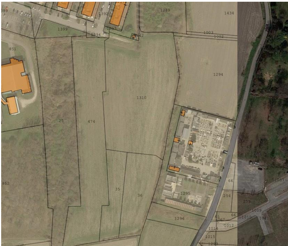
Estratto mappa sovrapposto a vista satellitare