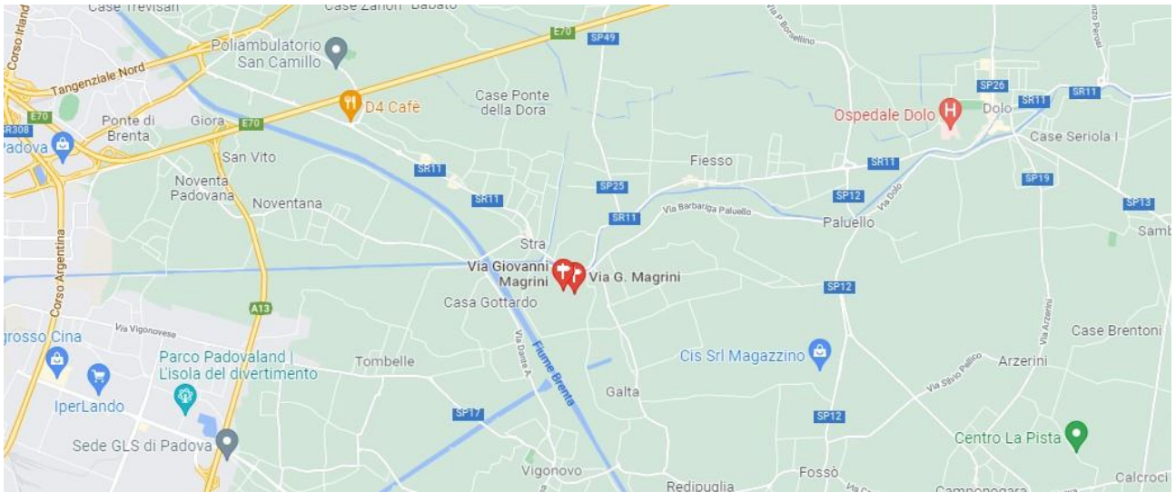
Google maps – stradario

Tre terreni contigui parzialmente edificabili- facenti parte di due lottizzazioni.