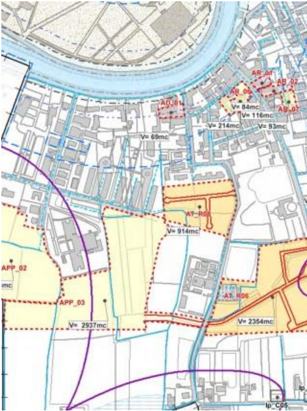
Individuazione lottizzazioni APP 3 e AT-R08