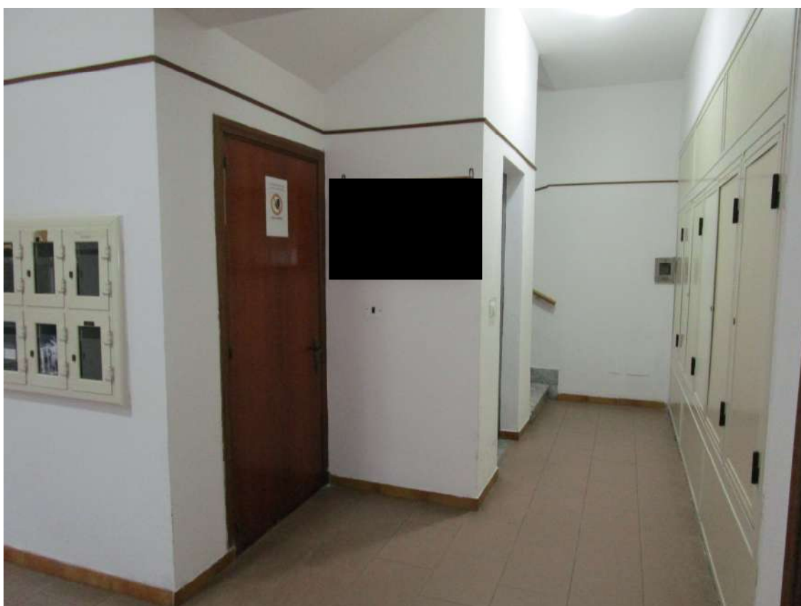
Foto 4 – disimpegno antistante l'accesso all'ascensore e al vano scala condominiale