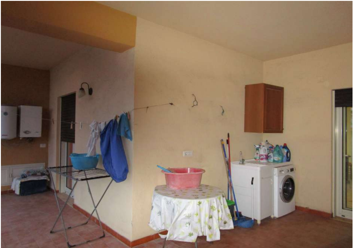
Foto 29 - veranda