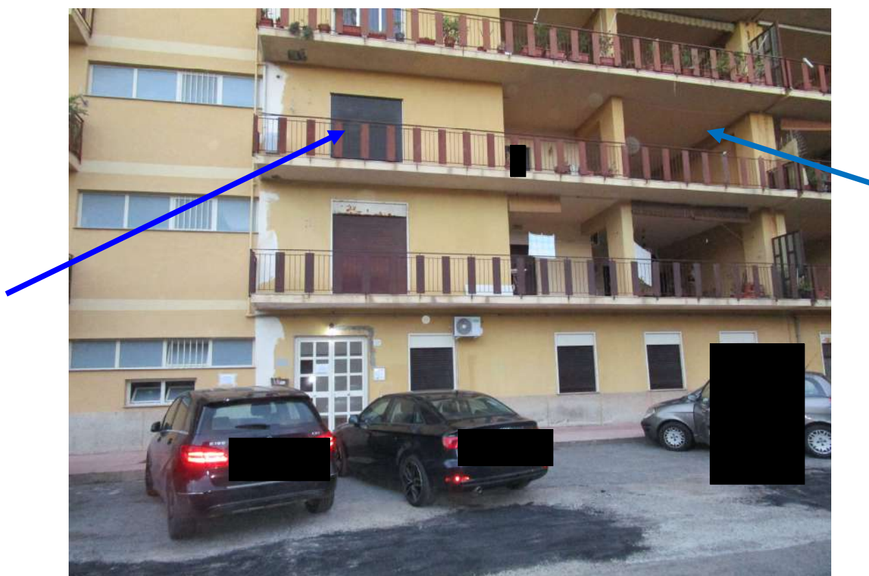
Foto 1 - prospetto principale edificio – appartamento ubicato al secondo piano