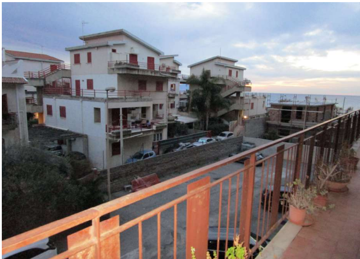
Foto 33– veduta panoramica dal balcone/veranda antistante verso Nord/Ovest