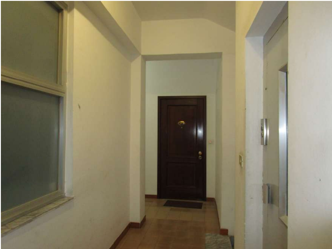
Foto 5 - Portone di ingresso all'appartamento dal vano scala/ascensore